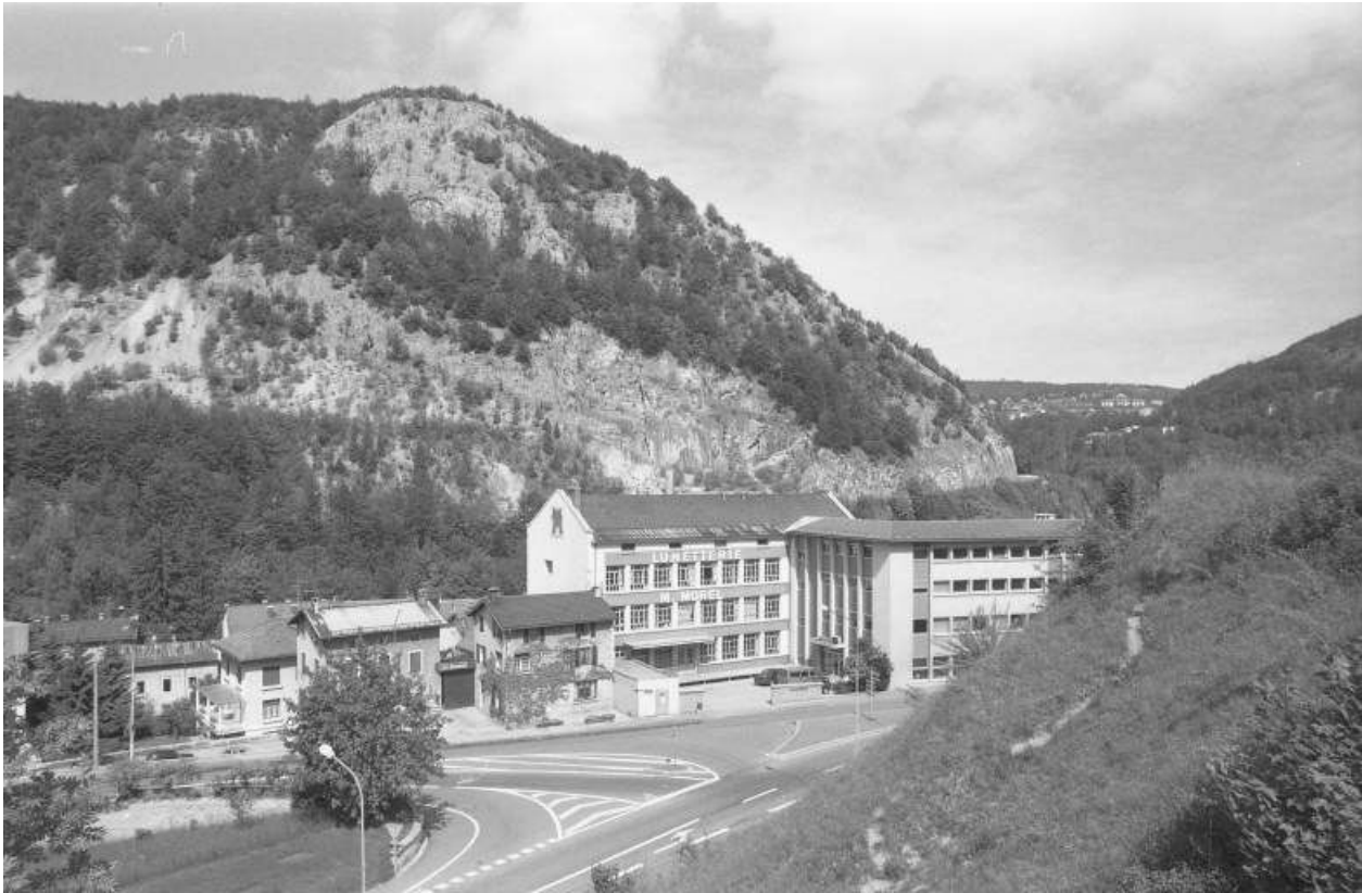
Vue d'ensemble de la façade antérieure.

39, Morez, 18 à 22 avenue Charles de Gaulle