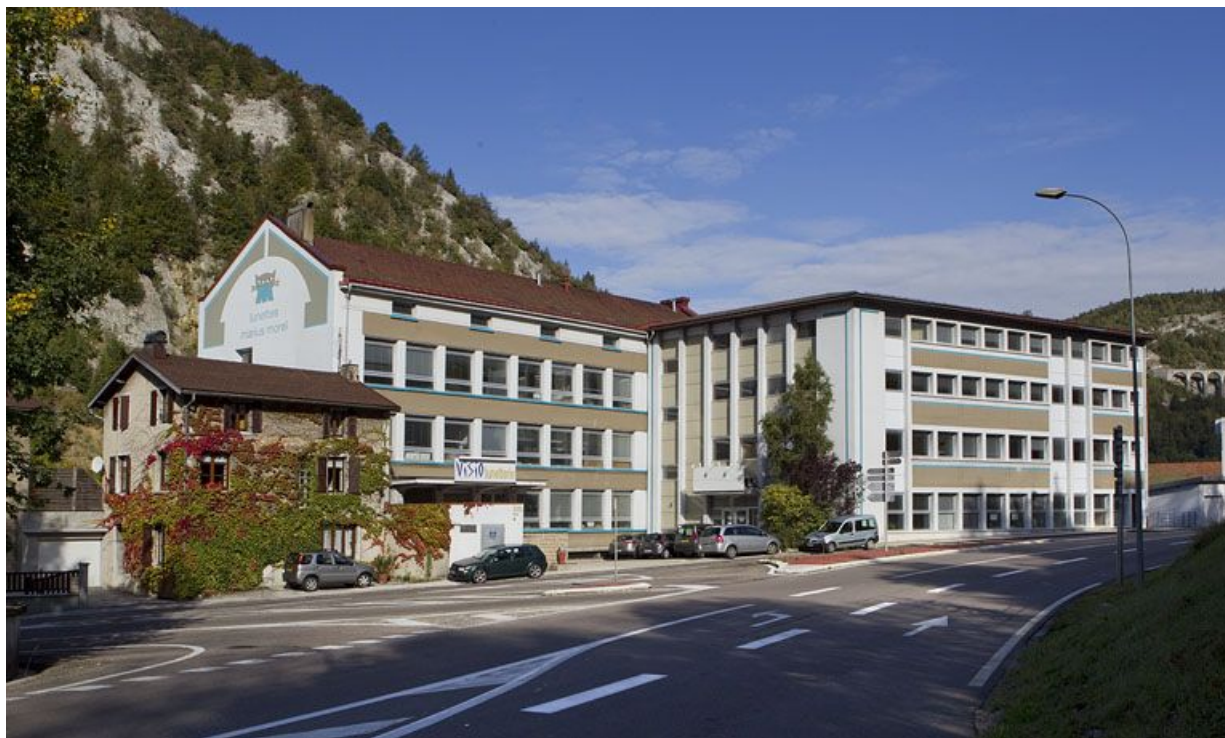
Ancienne usine de lunetterie Marius Morel (18 à 22 avenue Charles de Gaulle), actuellement Visio Lunetterie. 39, Morez