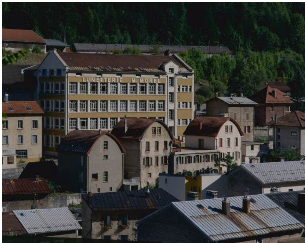
Façade postérieure du bâtiment de 1936, de trois quarts gauche.

39, Morez, 18 à 22 avenue Charles de Gaulle