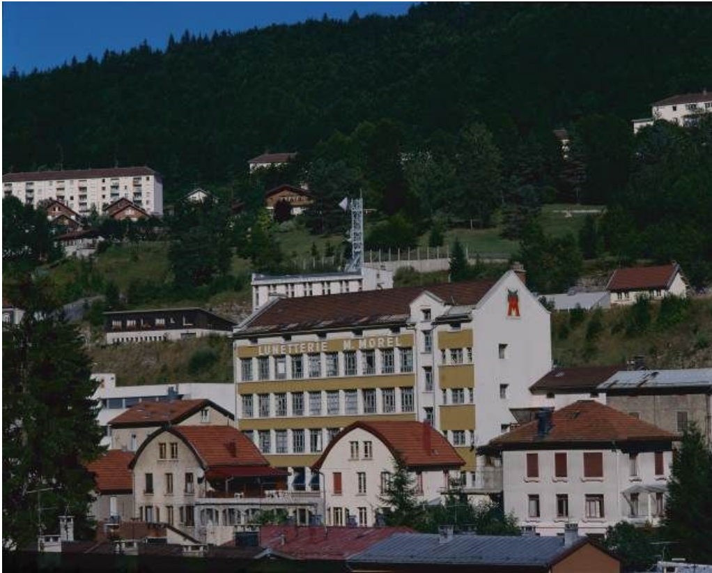
Façade postérieure du bâtiment de 1936, de trois quarts droite.

39, Morez, 18 à 22 avenue Charles de Gaulle