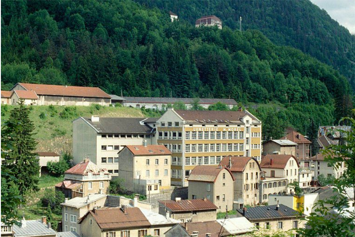
Vue d'ensemble de la façade postérieure.

39, Morez, 18 à 22 avenue Charles de Gaulle