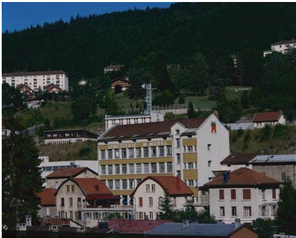
Façade postérieure du bâtiment de 1936, de trois quarts droite.

39, Morez, 18 à 22 avenue Charles de Gaulle