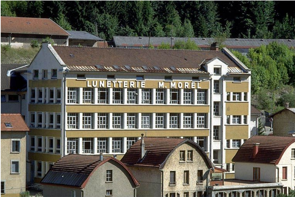
Façade postérieure de l'atelier de 1936.

39, Morez, 18 à 22 avenue Charles de Gaulle