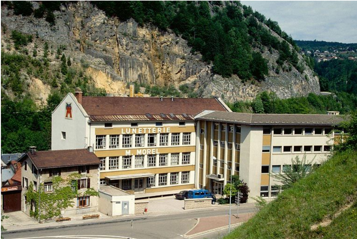
Façade antérieure du bâtiment de 1936.

39, Morez, 18 à 22 avenue Charles de Gaulle