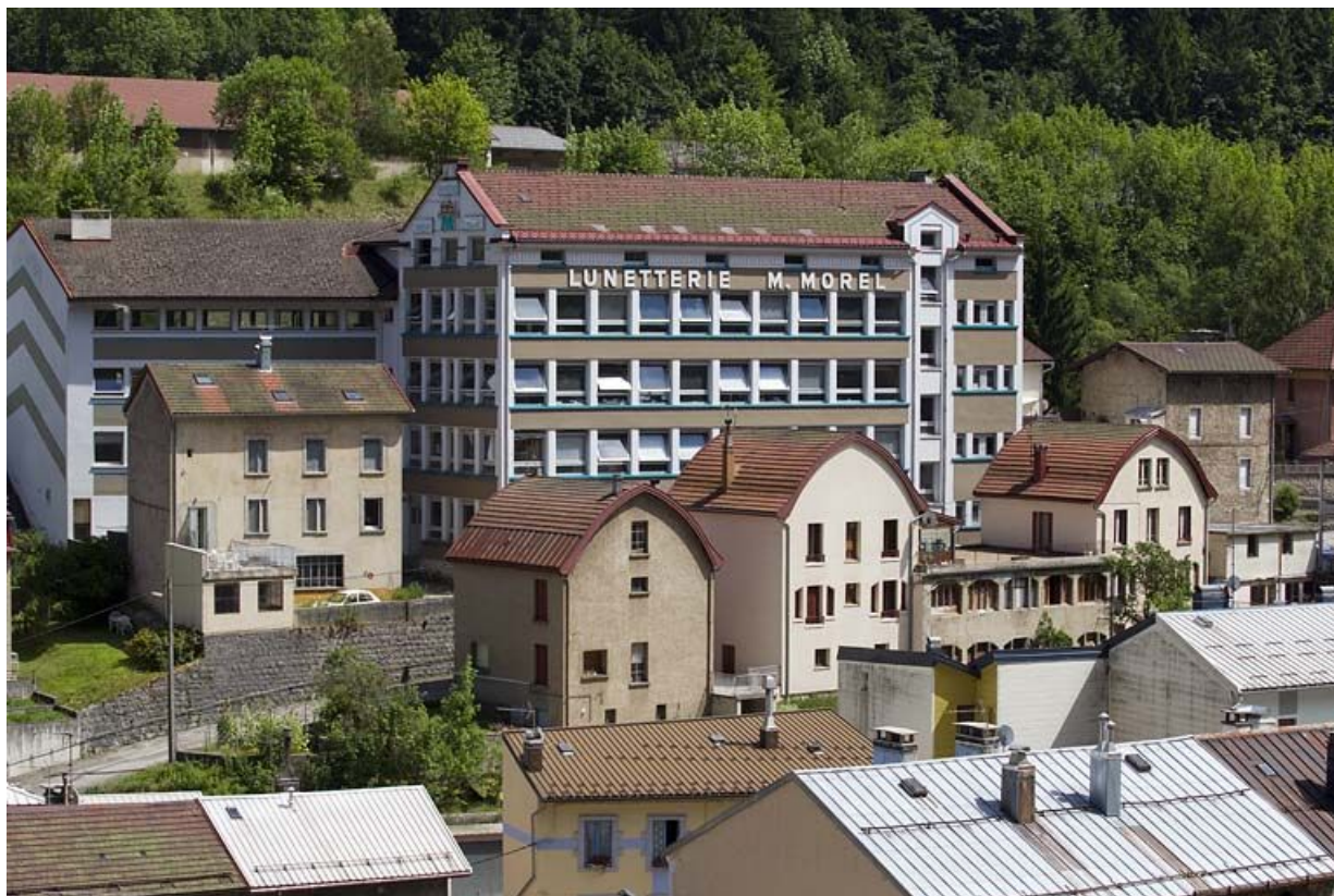
Vue d'ensemble de la façade postérieure.