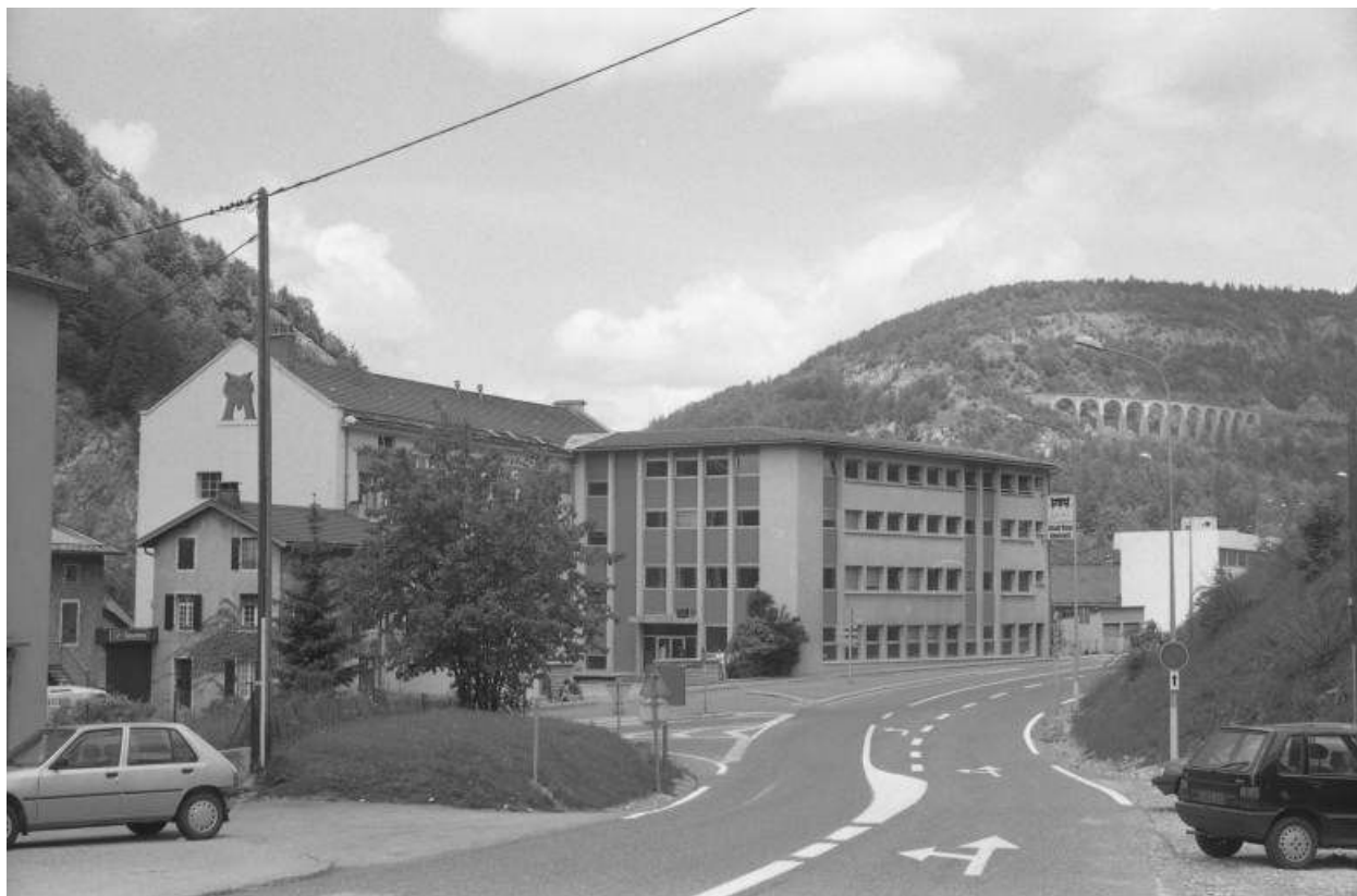
Façade antérieure du bâtiment de 1977.

39, Morez, 18 à 22 avenue Charles de Gaulle