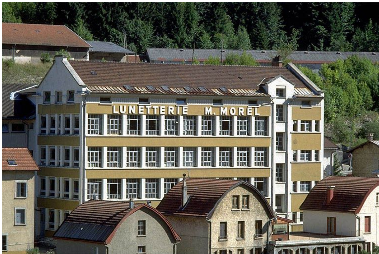
Façade postérieure de l'atelier de 1936.

39, Morez, 18 à 22 avenue Charles de Gaulle