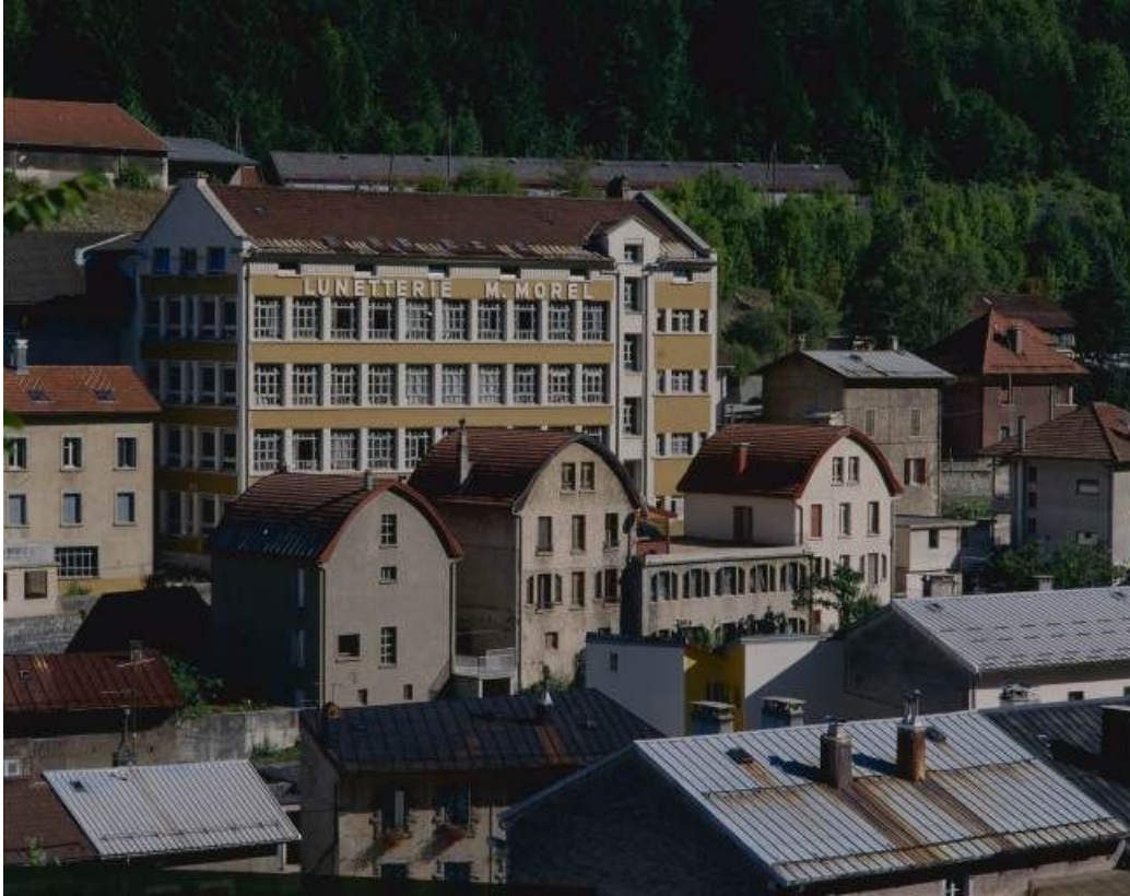
Façade postérieure du bâtiment de 1936, de trois quarts gauche.

39, Morez, 18 à 22 avenue Charles de Gaulle