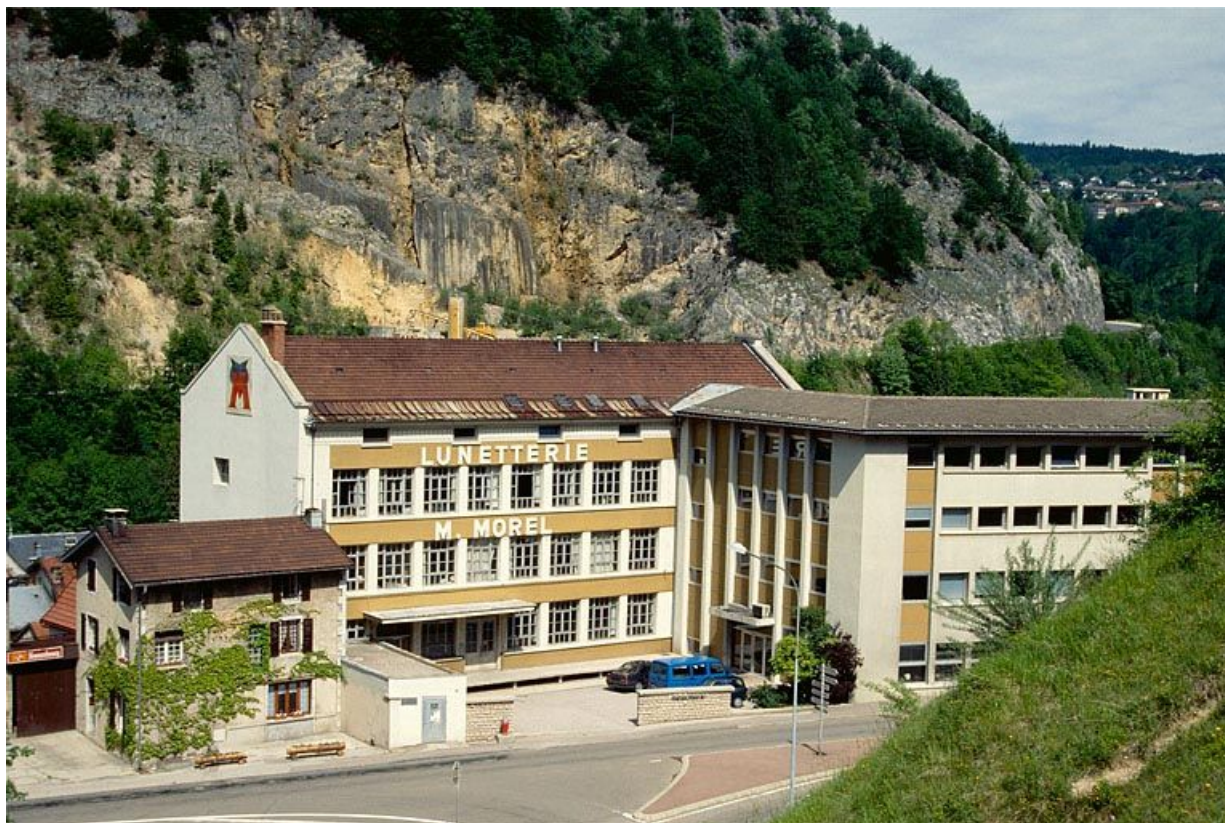
Façade antérieure du bâtiment de 1936.

39, Morez, 18 à 22 avenue Charles de Gaulle