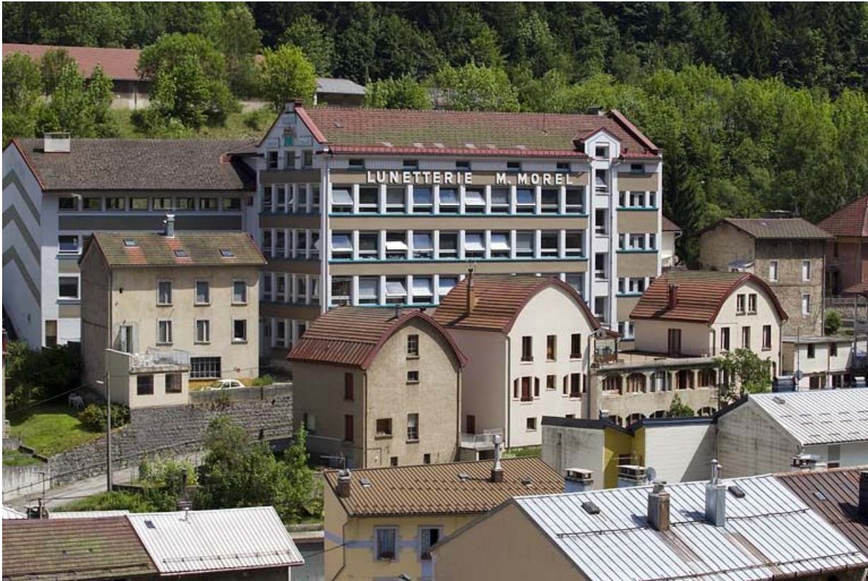
Vue d'ensemble de la façade postérieure.