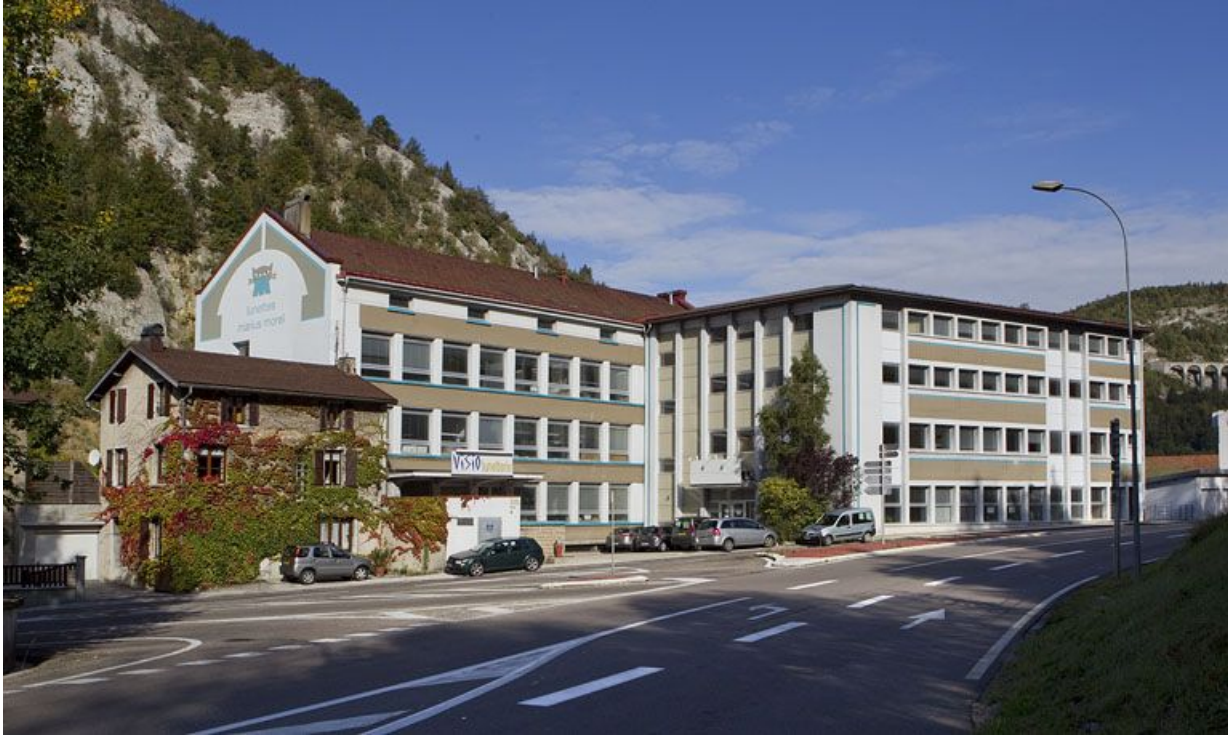
Ancienne usine de lunetterie Marius Morel (18 à 22 avenue Charles de Gaulle), actuellement Visio Lunetterie. 39, Morez