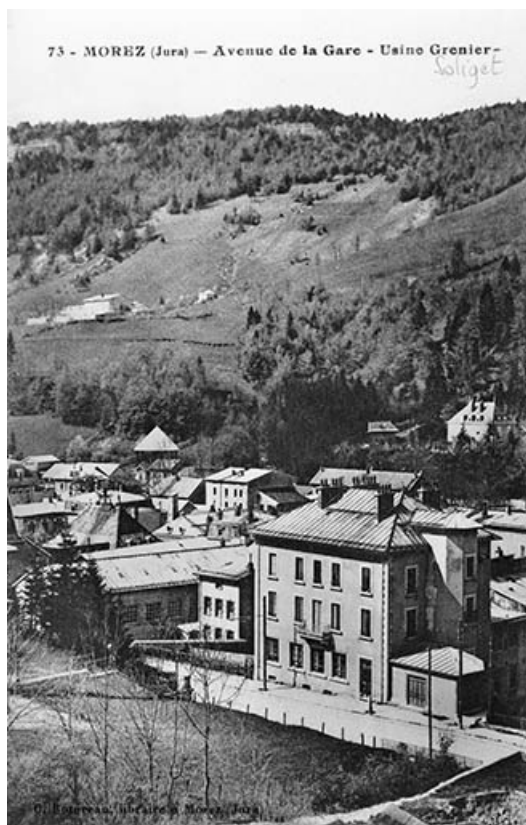
Morez (Jura) - Avenue de la Gare - Usine Grenier. 39, Morez, 10 avenue Charles de Gaulle