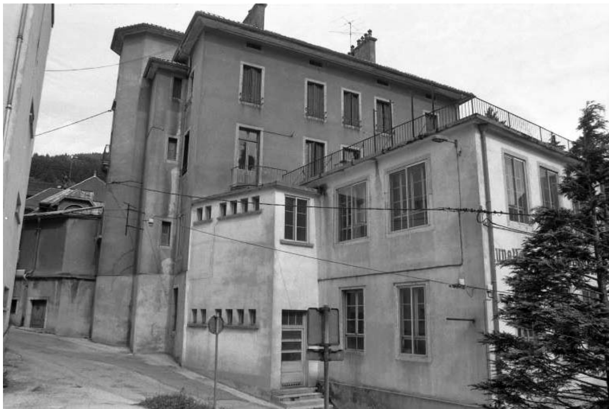
Façade postérieure et atelier sur la rue Fenandre.