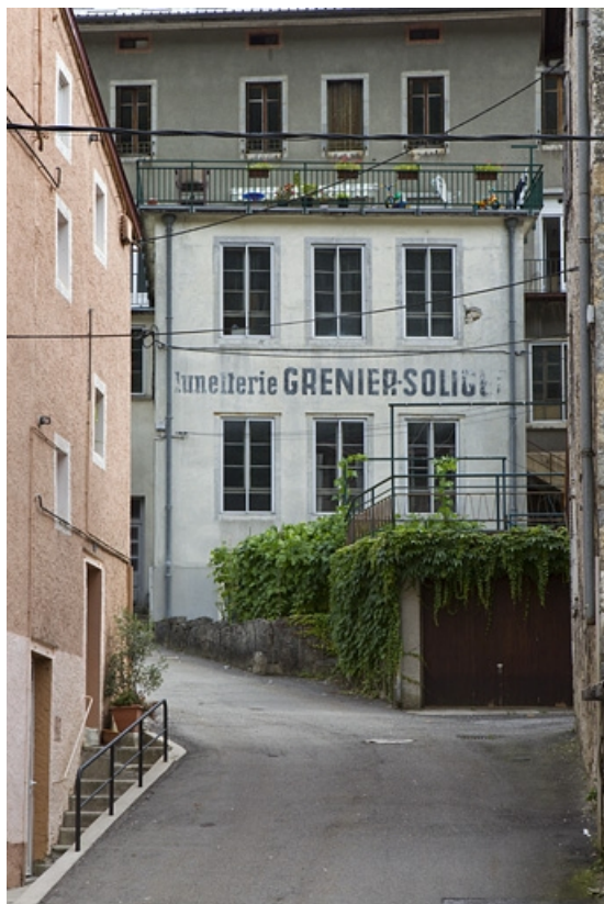
Façade postérieure sur la rue Fenandre.