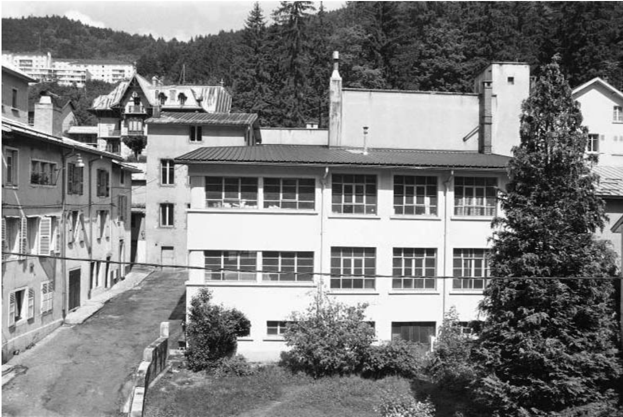
2 rue Raspail : atelier de fabrication.

39, Morez, 4 et 6 avenue Charles de Gaulle