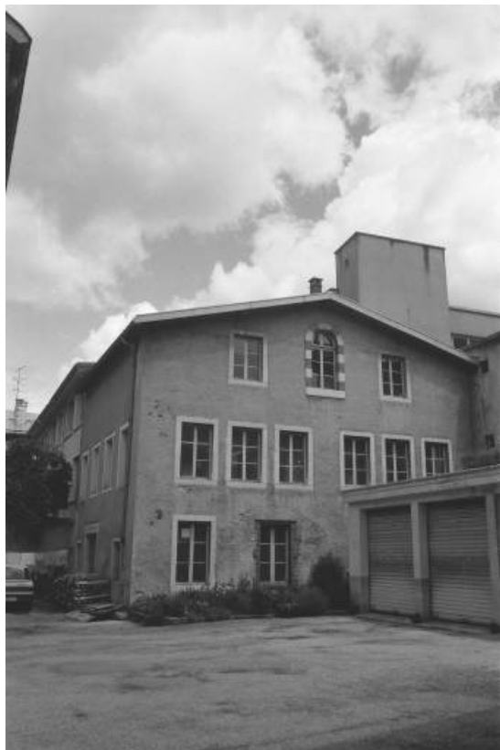
Rue de la République : atelier de fabrication dans la cour.

39, Morez, 4 et 6 avenue Charles de Gaulle