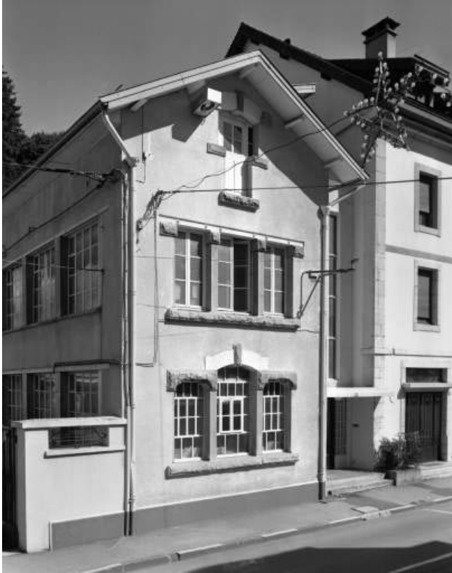
Rue de la République : façade antérieure de l'atelier Marius Morel. 39, Morez, 4 et 6 avenue Charles de Gaulle