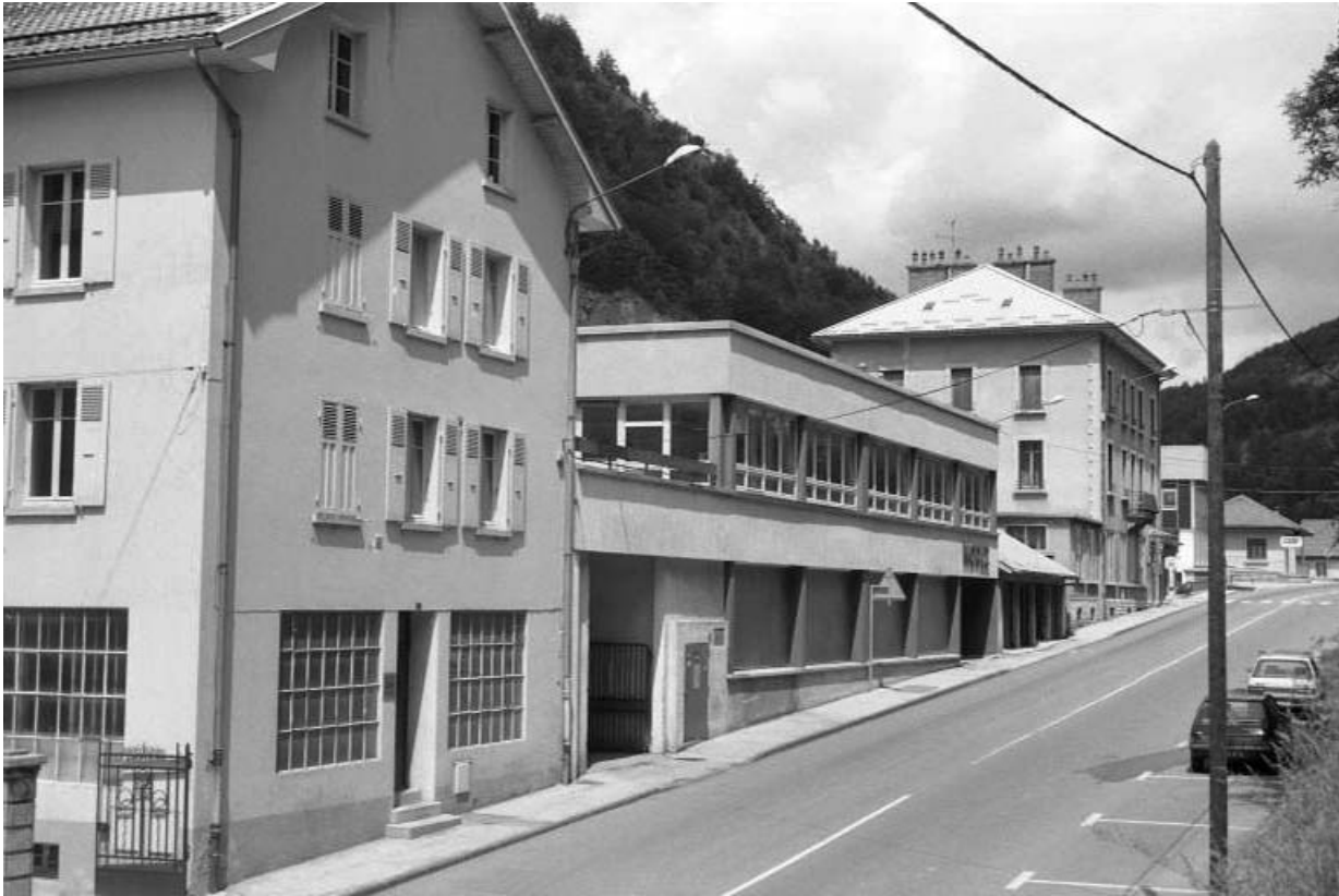
Avenue Charles de Gaulle : vue d'ensemble.