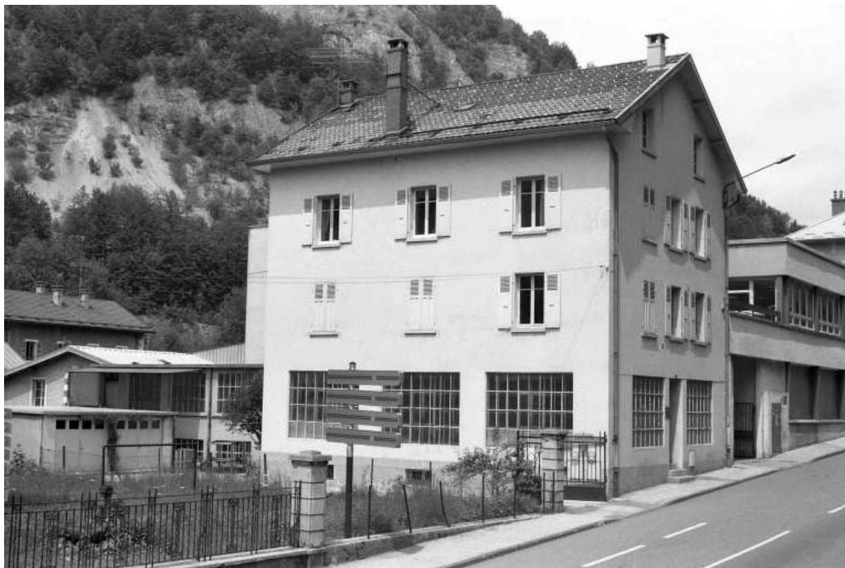
Avenue Charles de Gaulle : atelier Lamy Lunetterie.

39, Morez, 4 et 6 avenue Charles de Gaulle