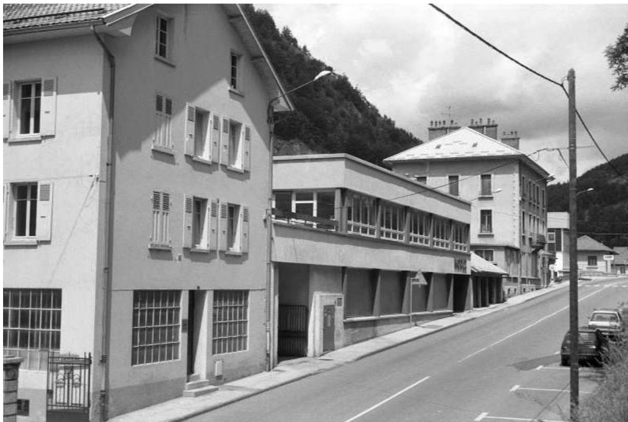
Avenue Charles de Gaulle : vue d'ensemble.