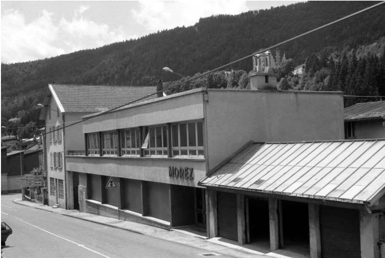
Avenue Charles de Gaulle : atelier Grandchavin-Lamy.

39, Morez, 4 et 6 avenue Charles de Gaulle