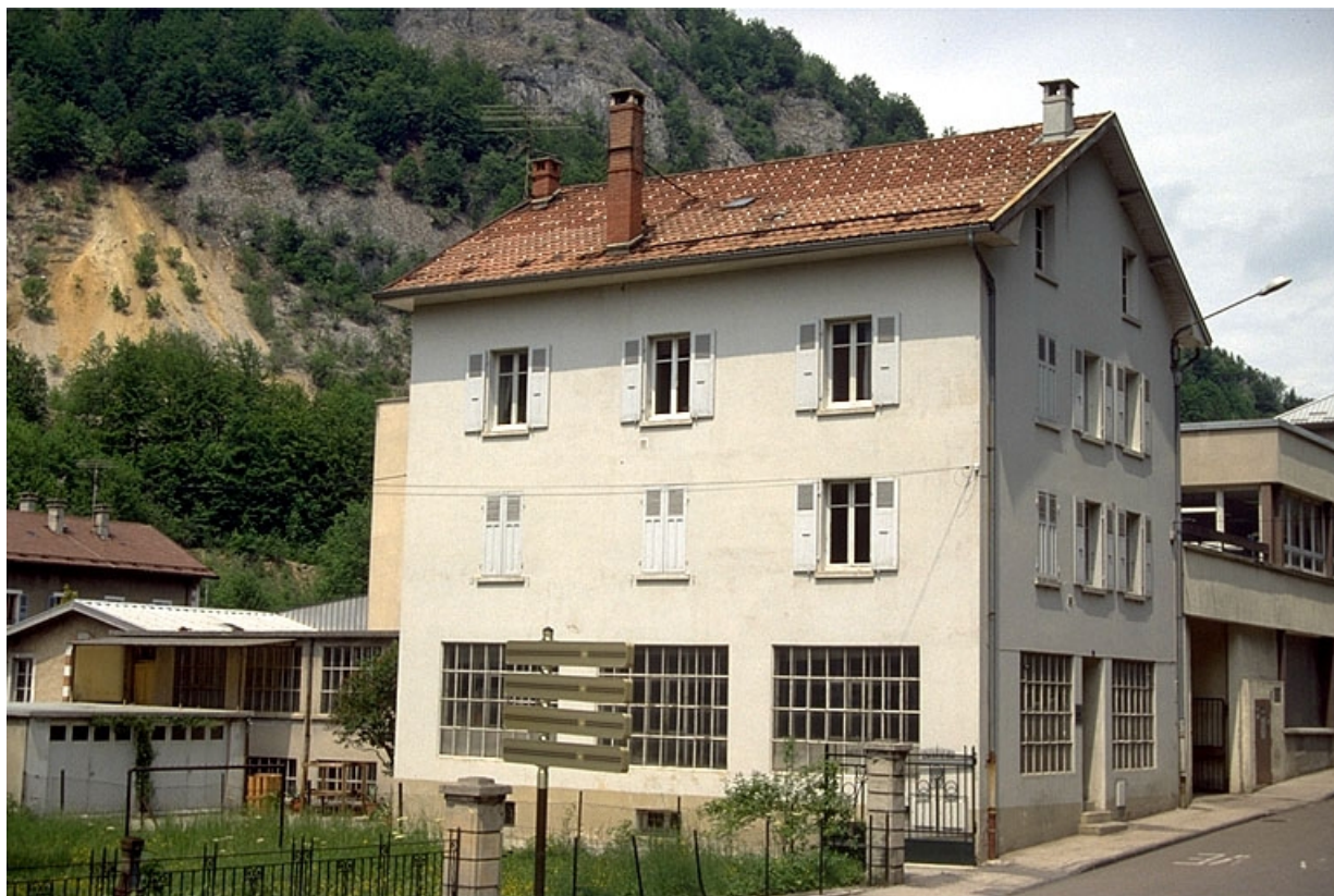
Vue d'ensemble sur l'avenue Charles de Gaulle.

39, Morez, 4 et 6 avenue Charles de Gaulle