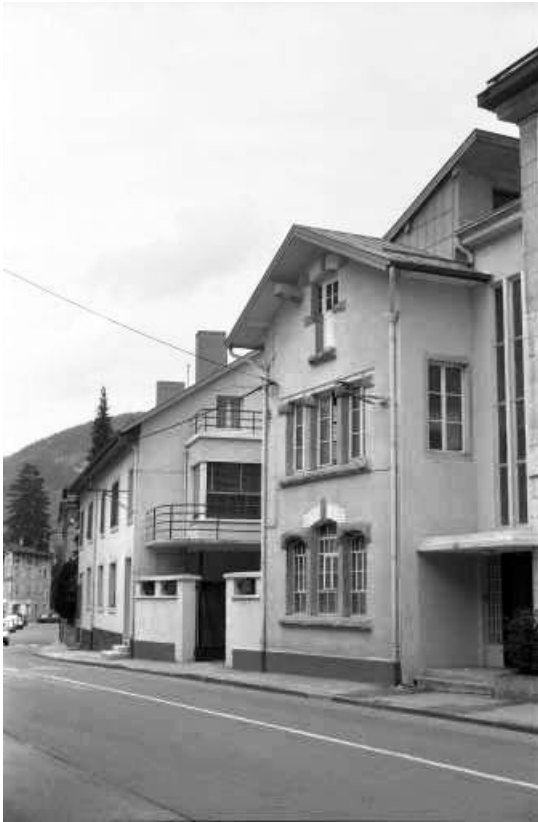
Rue de la République : vue d'ensemble.

39, Morez, 4 et 6 avenue Charles de Gaulle