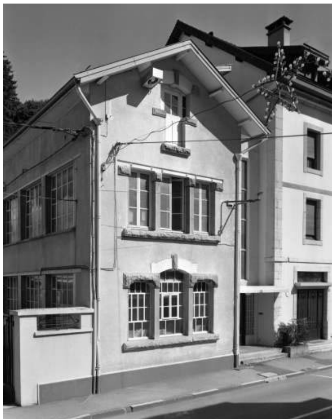
Rue de la République : façade antérieure de l'atelier Marius Morel. 39, Morez, 4 et 6 avenue Charles de Gaulle