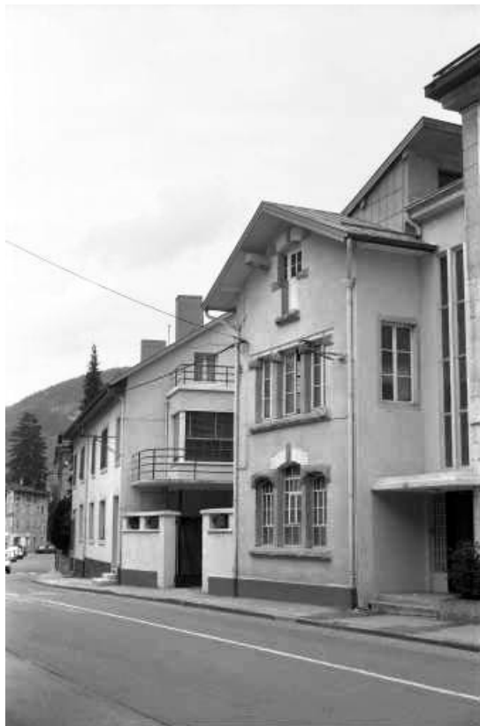
Rue de la République : vue d'ensemble.

39, Morez, 4 et 6 avenue Charles de Gaulle