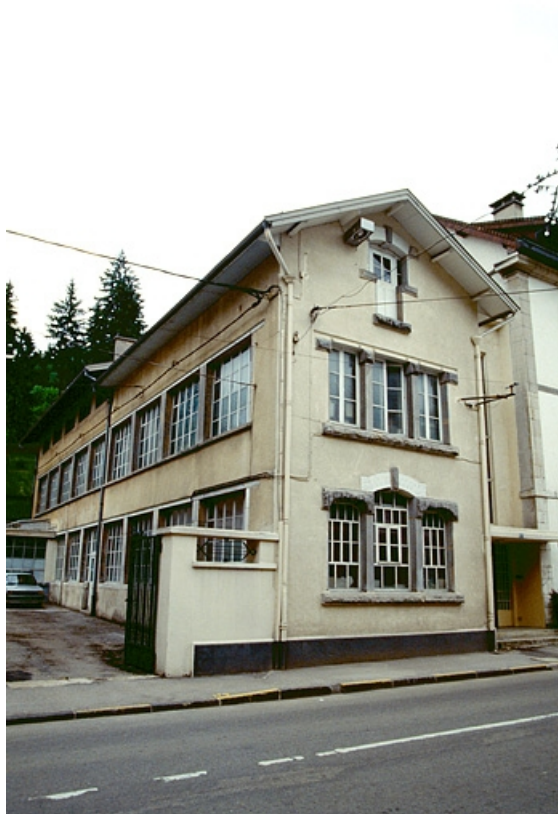
Rue de la République : atelier Marius Morel, de trois quarts gauche.