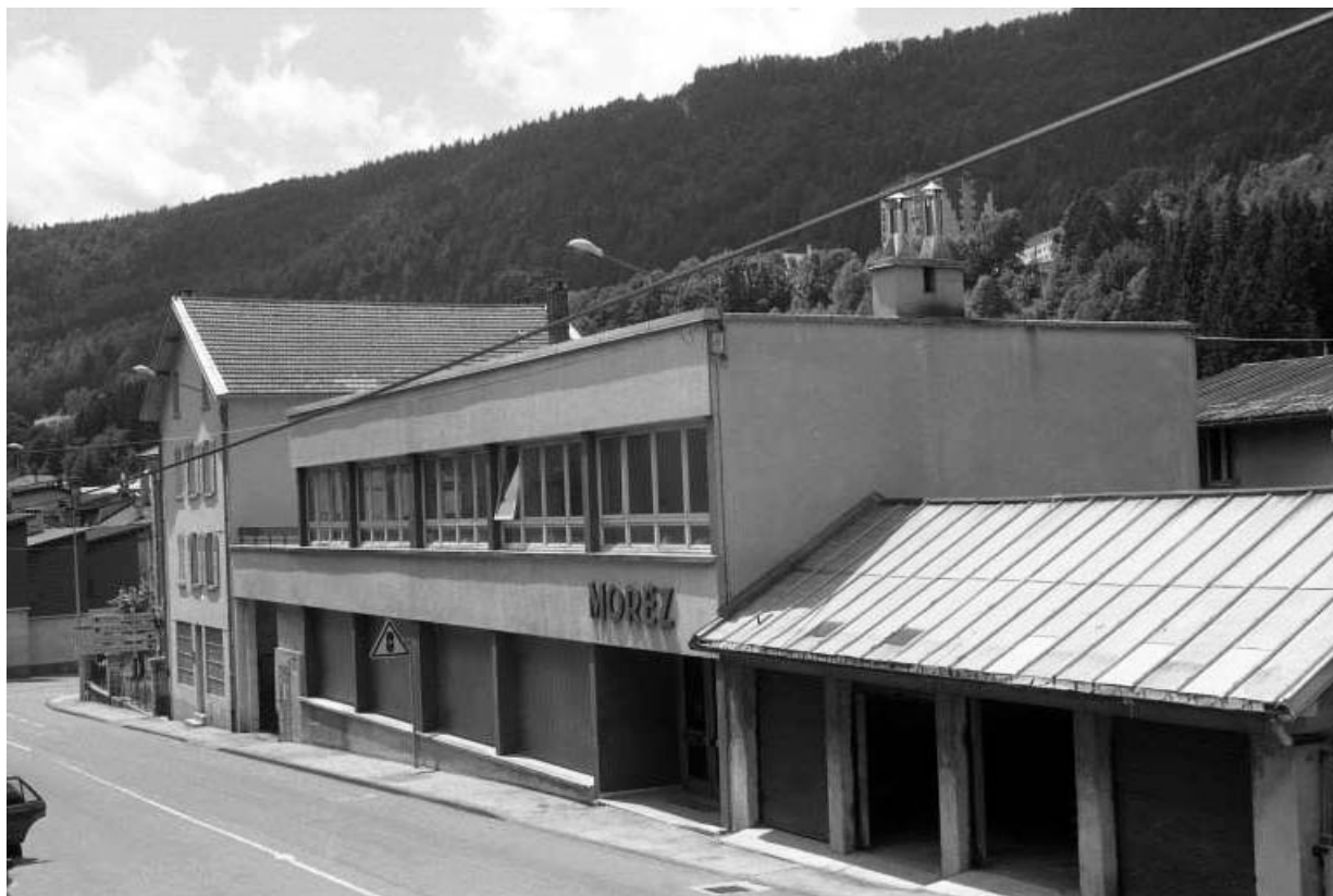
Avenue Charles de Gaulle : atelier Grandchavin-Lamy.

39, Morez, 4 et 6 avenue Charles de Gaulle