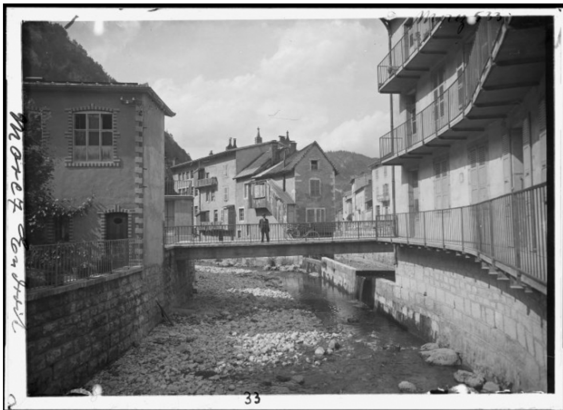
[La Bienne et la passerelle, depuis le pont du Casino], 1er quart 20e siècle. 39, Morez, 11 rue de l' Industrie