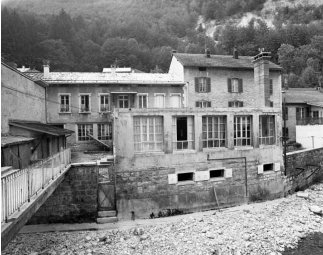
Façade antérieure de l'usine sur la rue de la République.