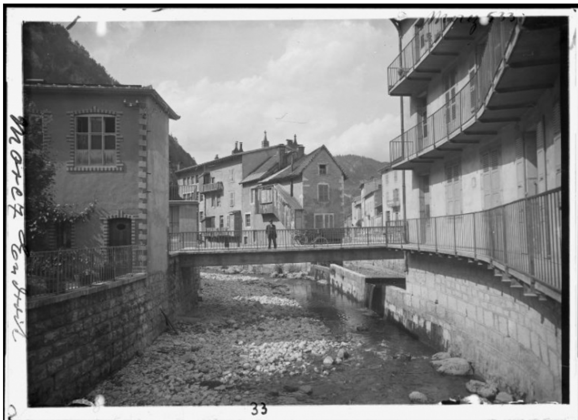
[La Bienne et la passerelle, depuis le pont du Casino], 1er quart 20e siècle. 39, Morez, 11 rue de l' Industrie