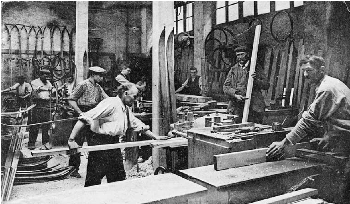
GRANDE FABRIQUE JURASSIENNE D'ARTICLES DE SPORT A. GAUTHIER, Morez-du-Jura

Vue générale de la Fabrication Mécanique