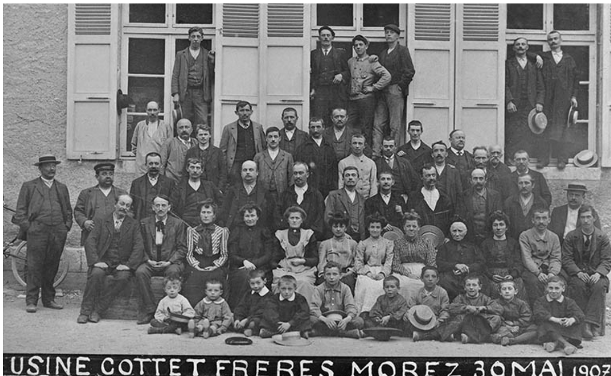
Usine Cottet frères. Morez. 30 mai 1907. 39, Morez, 18 rue Pasteur