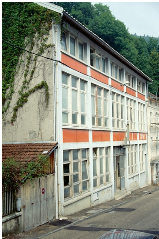
1ère unité (18 rue Pasteur) : façade antérieure de trois quarts gauche. 39, Morez, 18 rue Pasteur