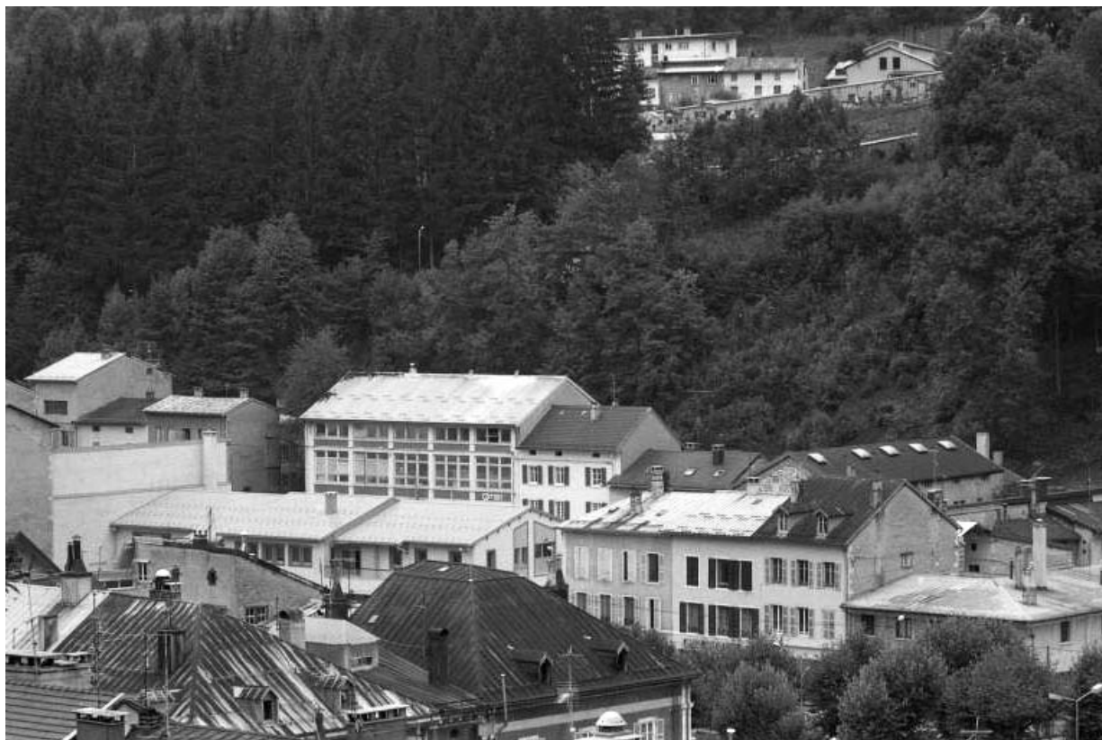
Vue d'ensemble depuis l'est.