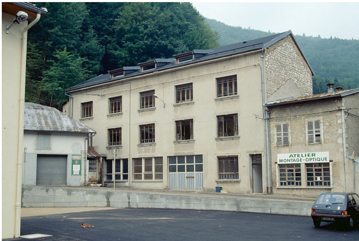
Deuxième unité (à l'angle de la rue Pasteur). 39, Morez, 18 rue Pasteur