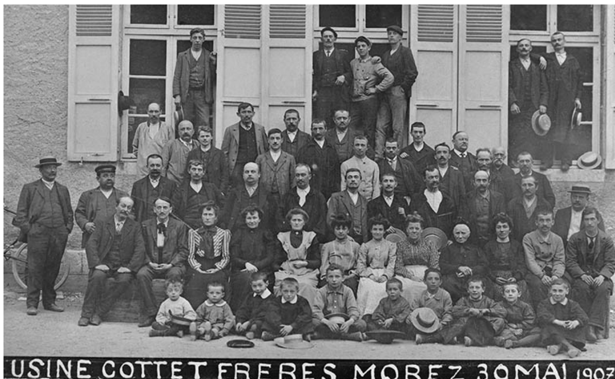
Usine Cottet frères. Morez. 30 mai 1907. 39, Morez, 18 rue Pasteur