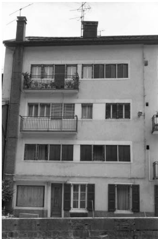
Détail de la façade latérale gauche.