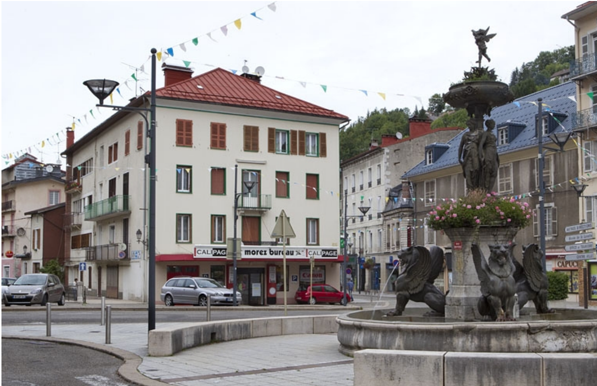
Vue d'ensemble, de trois quarts gauche. 39, Morez, 144 rue de la République