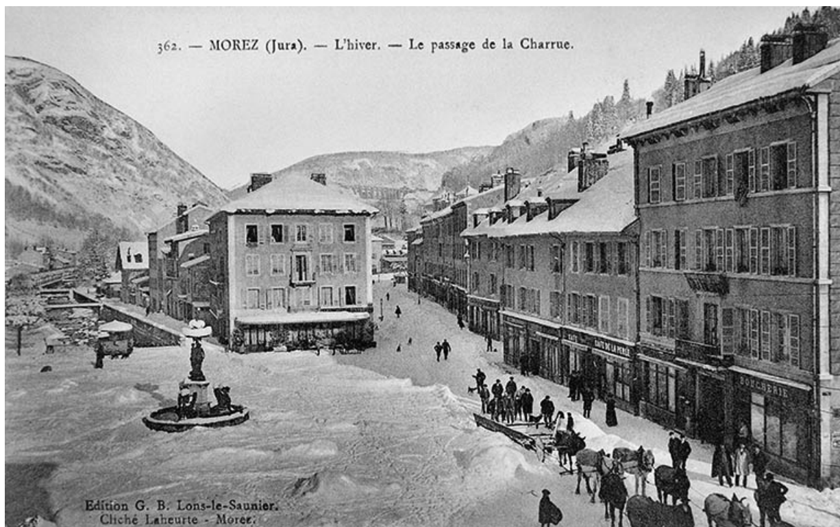
Morez (Jura). - L'hiver. - Le passage de la Charrue.