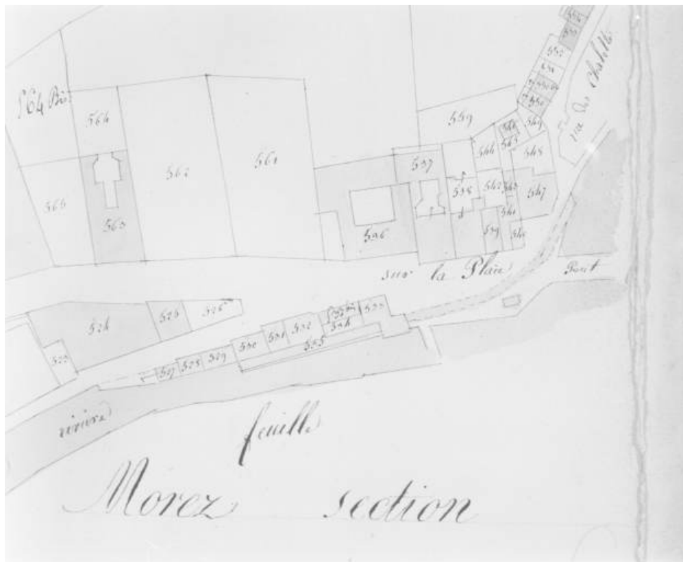
Morez. Section unique 2e feuille [plan de situation extrait du plan cadastral].