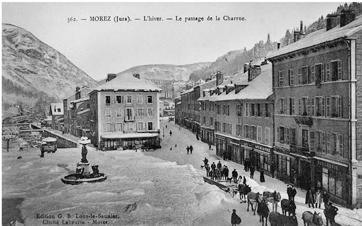
Morez (Jura). - L'hiver. - Le passage de la Charrue.