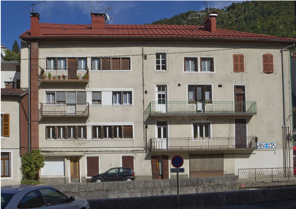
Face latérale gauche.