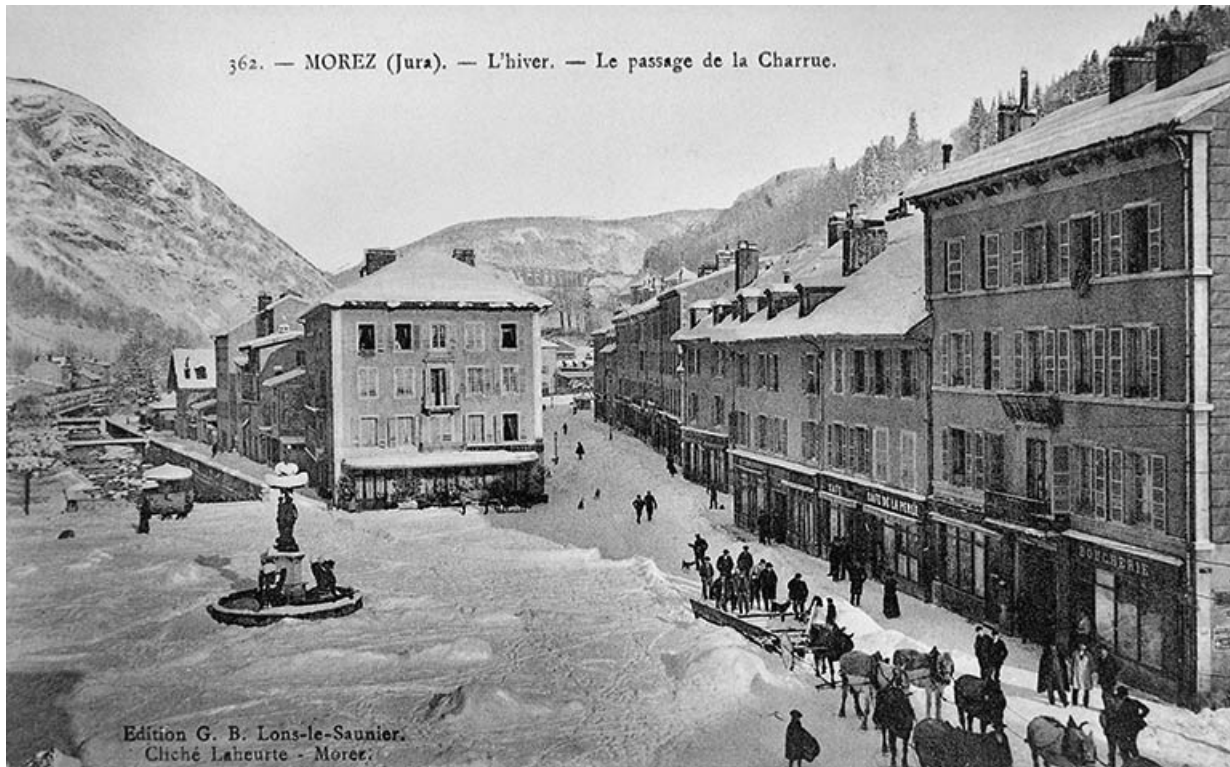
Morez (Jura). - L'hiver. - Le passage de la Charrue.