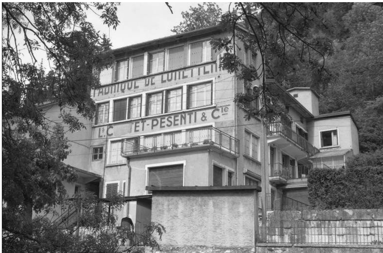
Façade antérieure de trois quarts droite.