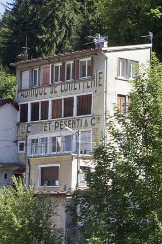
Ancienne usine de lunetterie L. Cottet-Pesenti et Cie (23 rue Wladimir Gagneur).