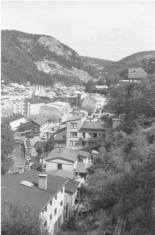
Vue d'ensemble plongeante depuis le sud-est.