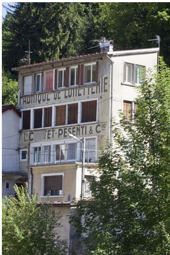
Ancienne usine de lunetterie L. Cottet-Pesenti et Cie (23 rue Wladimir Gagneur).