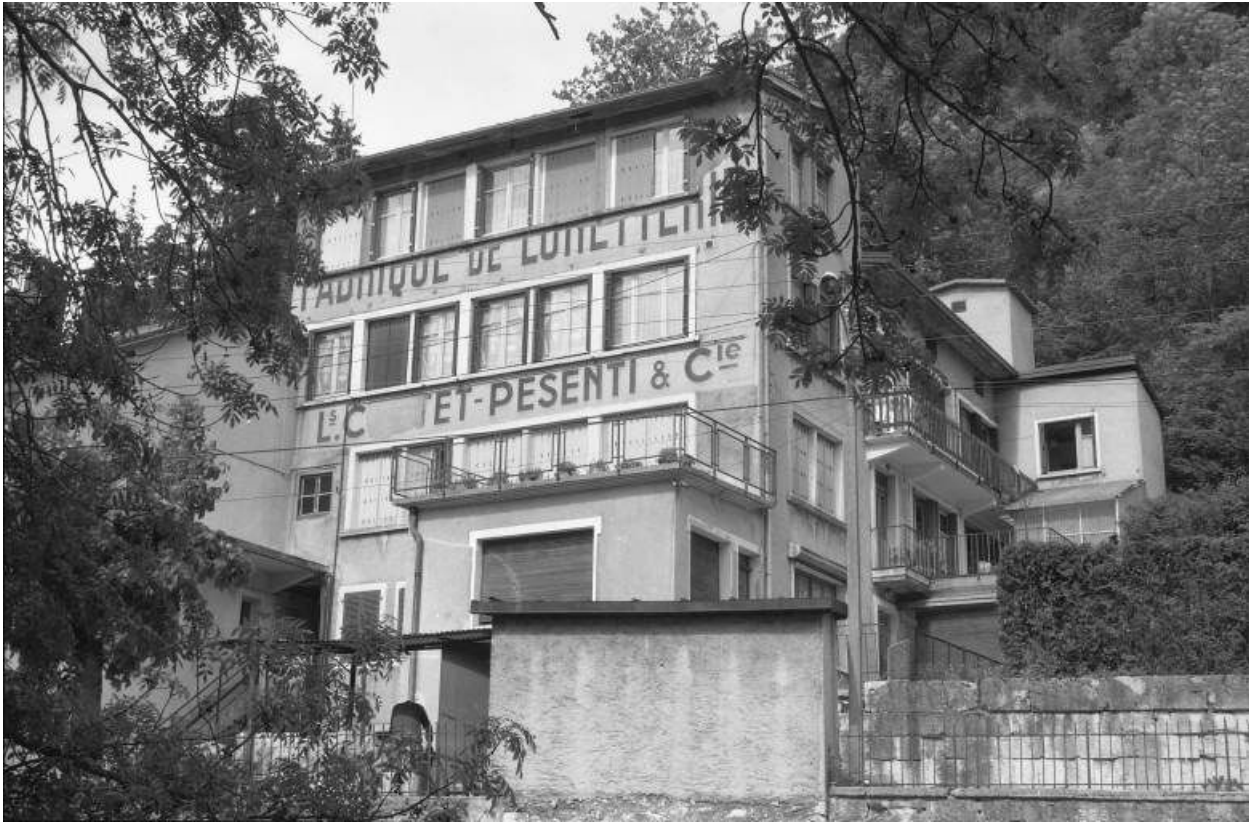
Façade antérieure de trois quarts droite.