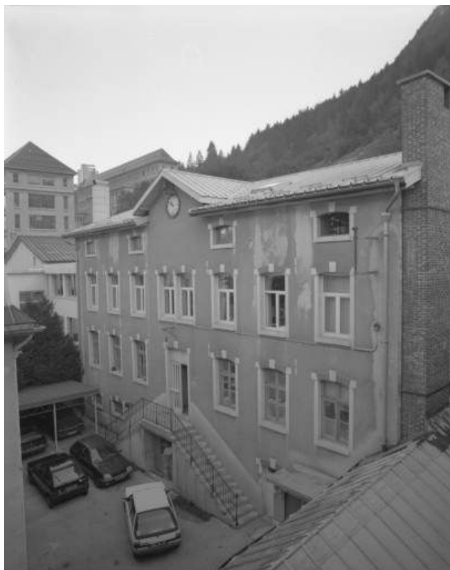
Site ancien : façade antérieure de l'usine, de trois quarts droite. 39, Morez, 11, 13 rue Wladimir Gagneur