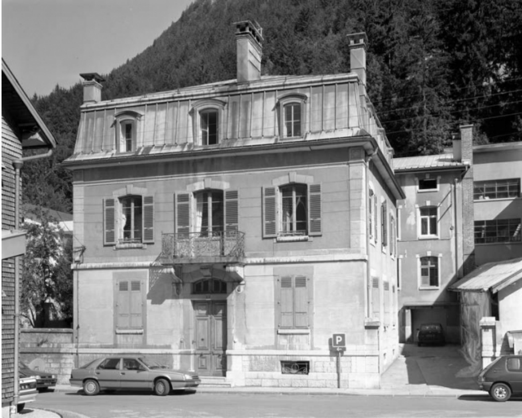
Site ancien : façade antérieure du logement.