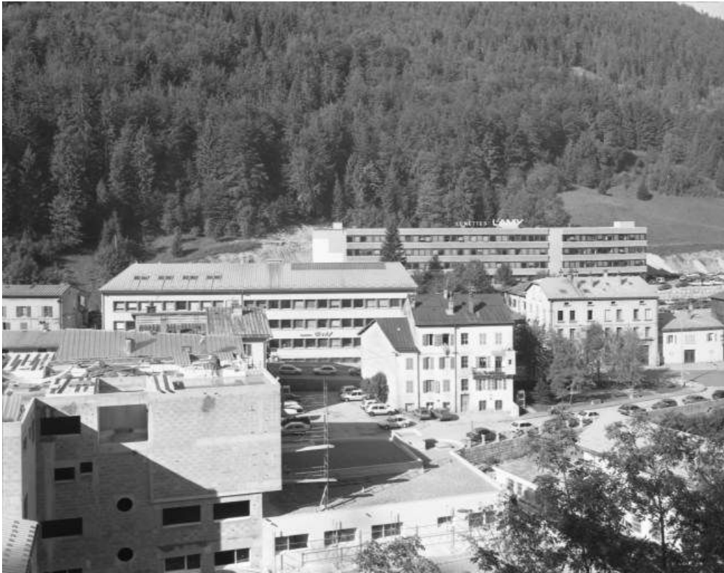
Site récent : vue d'ensemble.