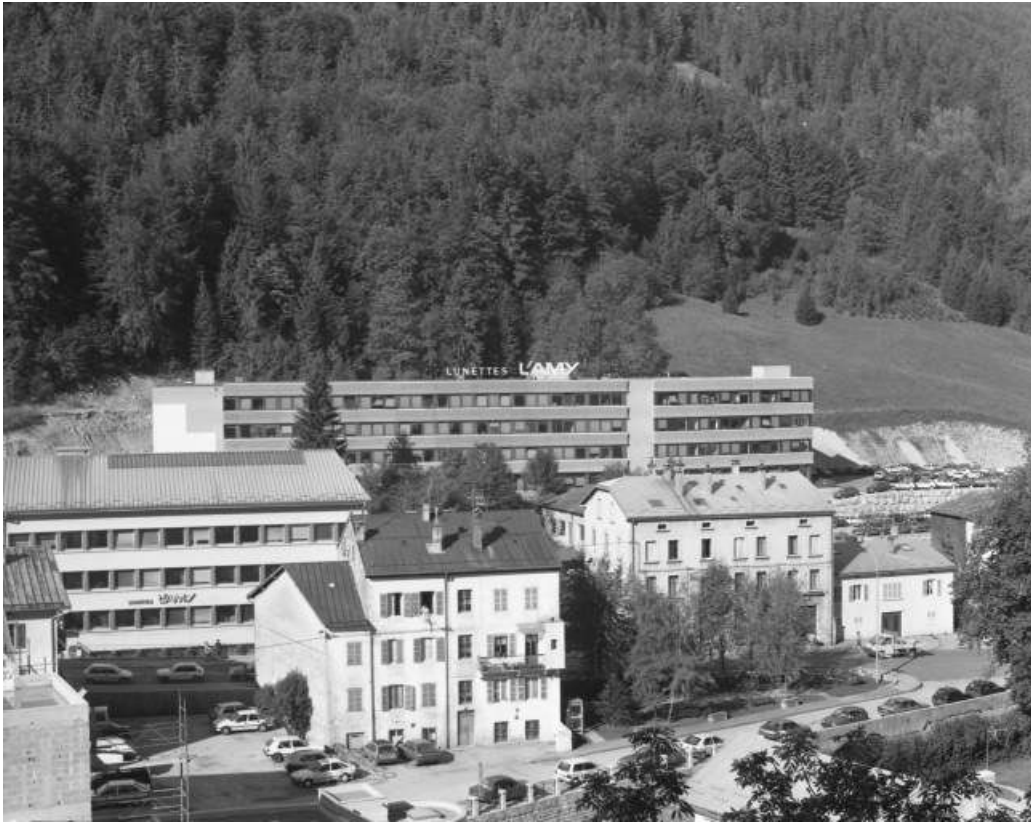
Site récent : bâtiment en retrait de la rue de la République.