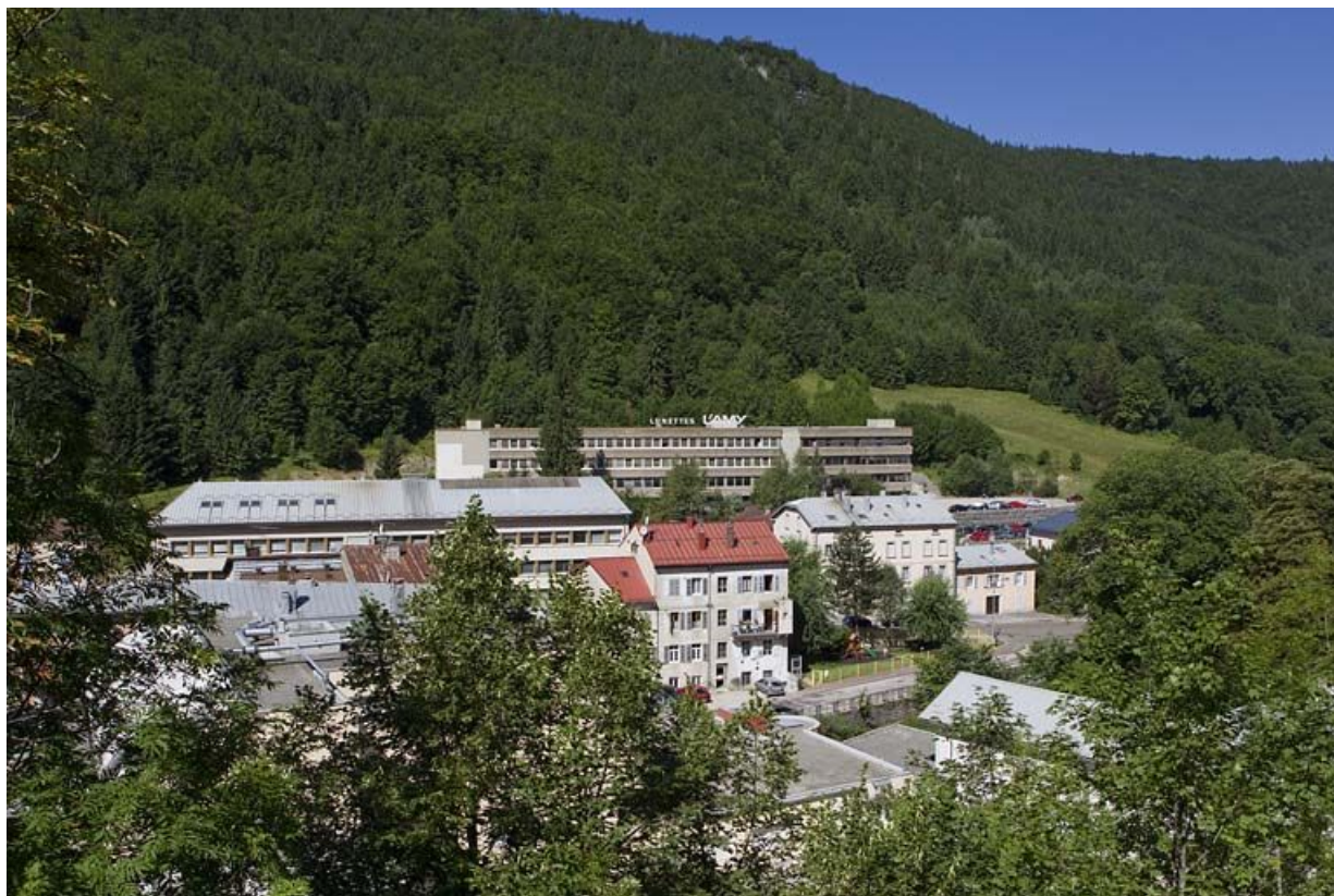
Usine de lunetterie L'Amy : vue d'ensemble du site récent (216 à 220 rue de la République). 39, Morez, 11, 13 rue Wladimir Gagneur