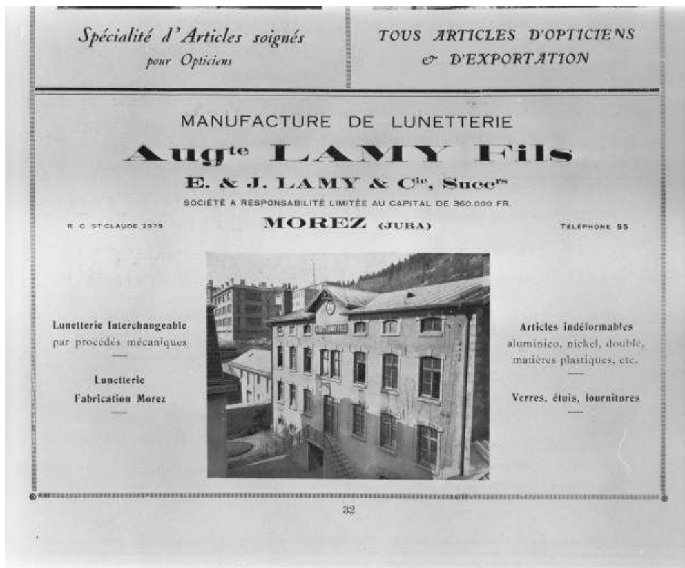
Façade antérieure de l'usine, de trois quarts droite.