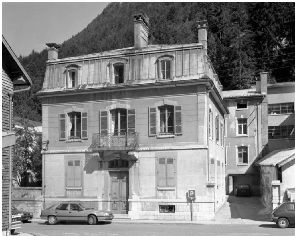
Site ancien : façade antérieure du logement. 39, Morez, 11, 13 rue Wladimir Gagneur