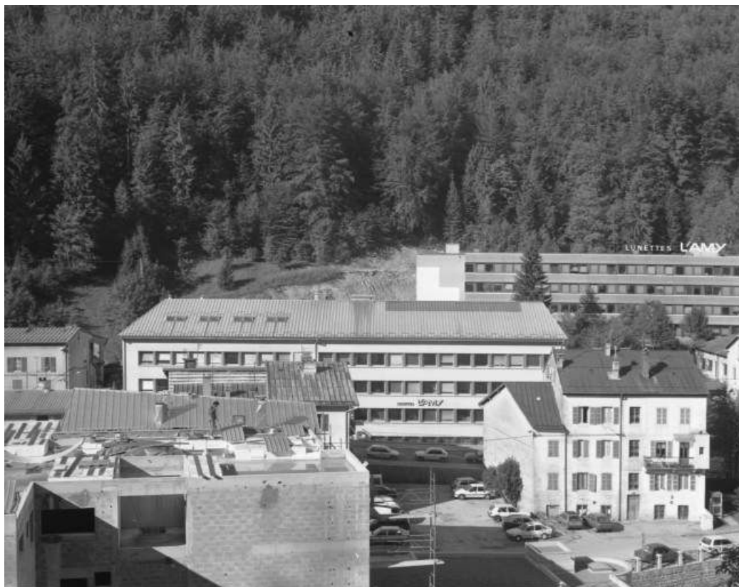
Site récent : bâtiment au long de la rue de la République.