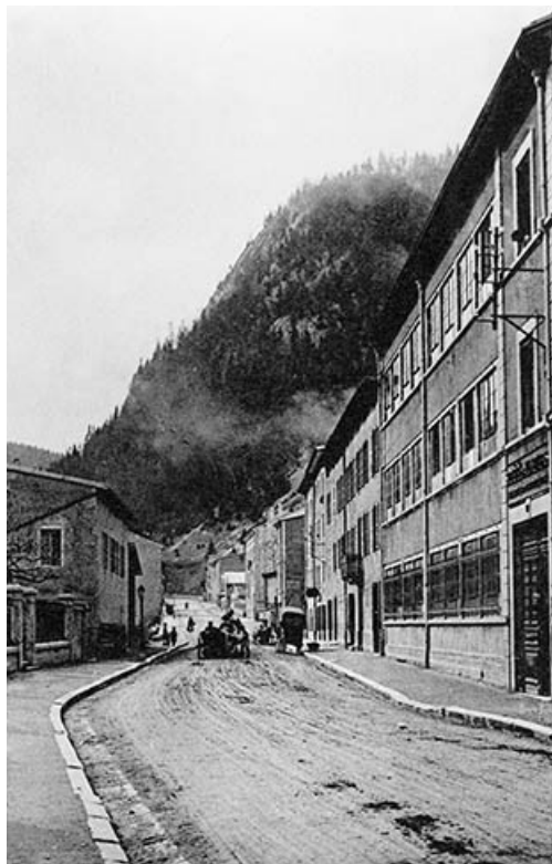
23165. - MOREZ (Jura) — La Société des Lunettiers. Rue de la République.