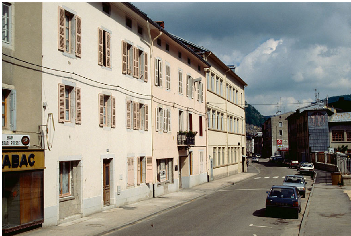
Façade antérieure des bâtiments sur rue. 39, Morez, 194 à 198 rue de la République