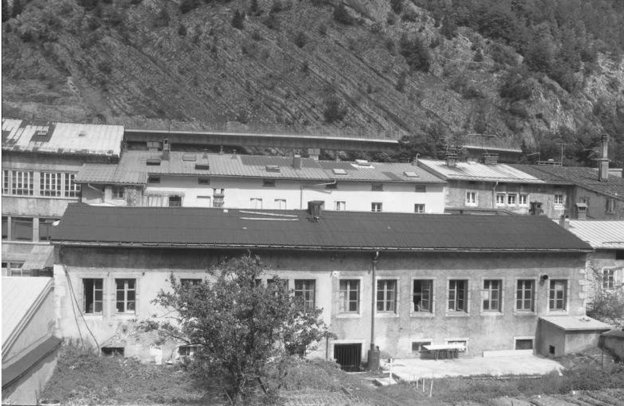
Façade postérieure des ateliers en fond de cour, aux n° 196 et 198.

39, Morez, 194 à 198 rue de la République