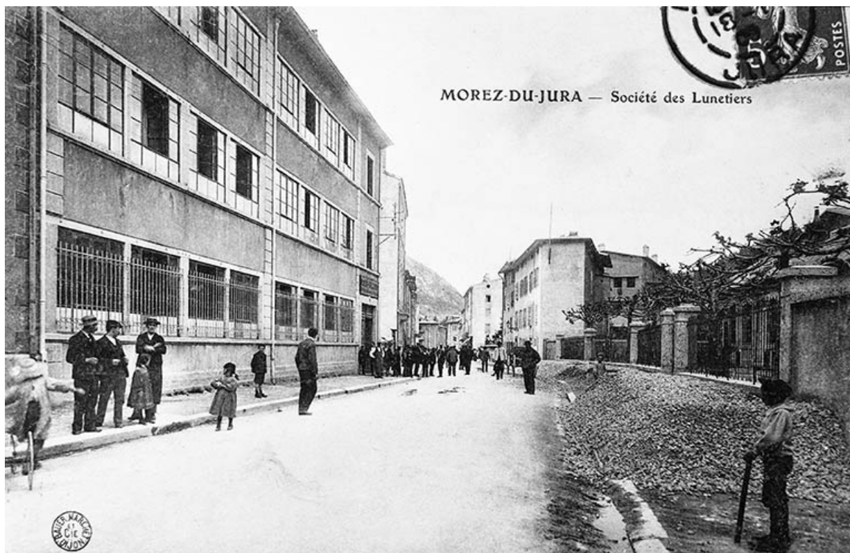
Morez-du-Jura - Société des Lunetiers.