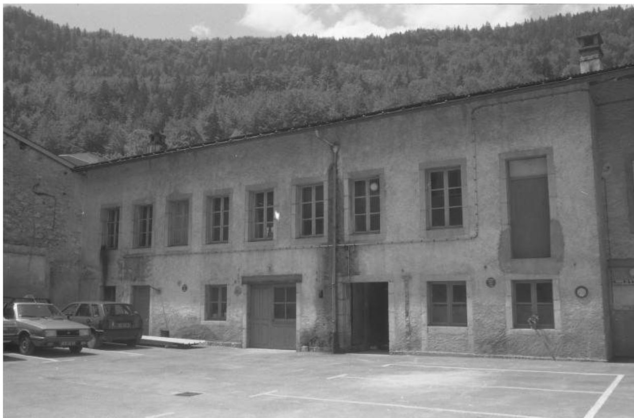
Façade antérieure des ateliers en fond de cour, aux n° 196 et 198.

39, Morez, 194 à 198 rue de la République