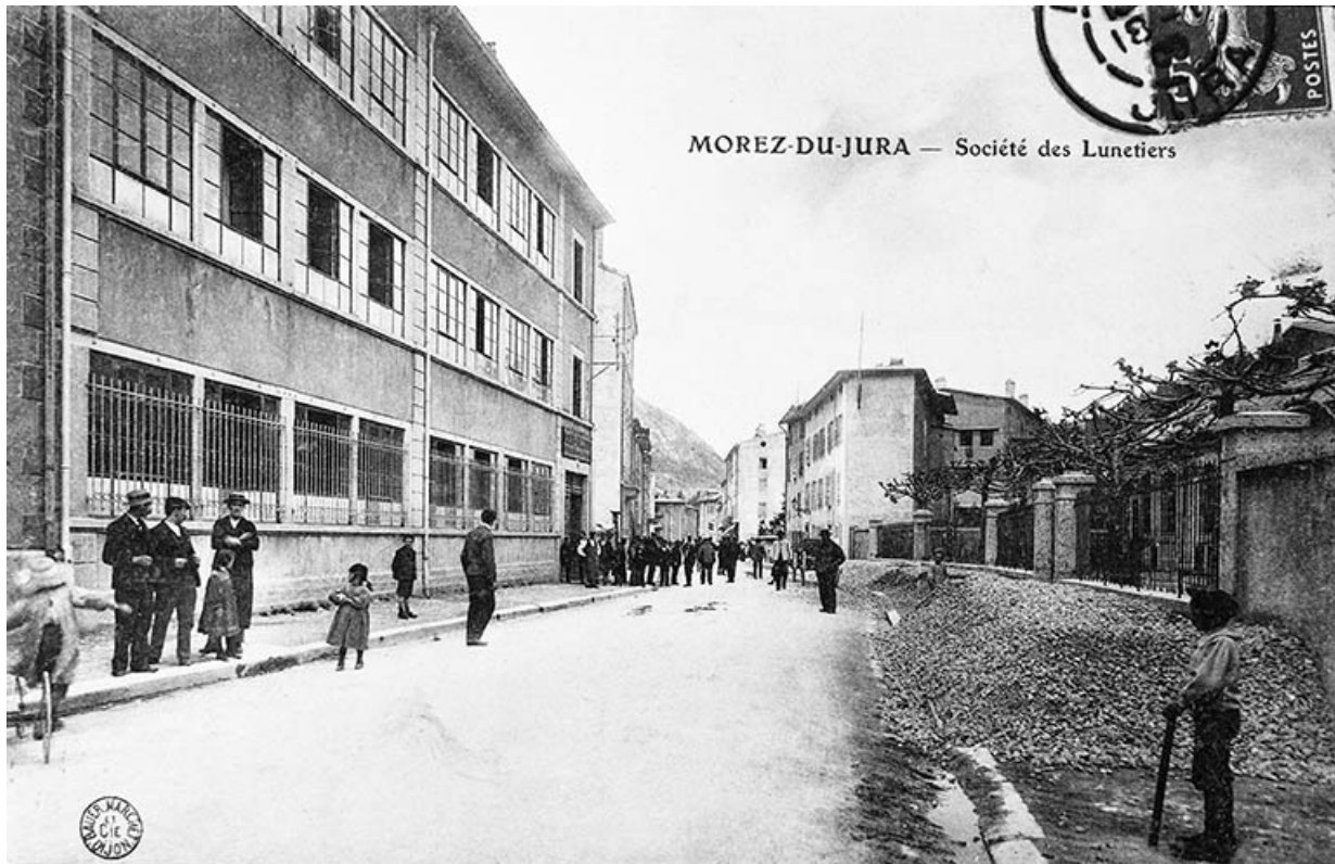
Morez-du-Jura - Société des Lunetiers.