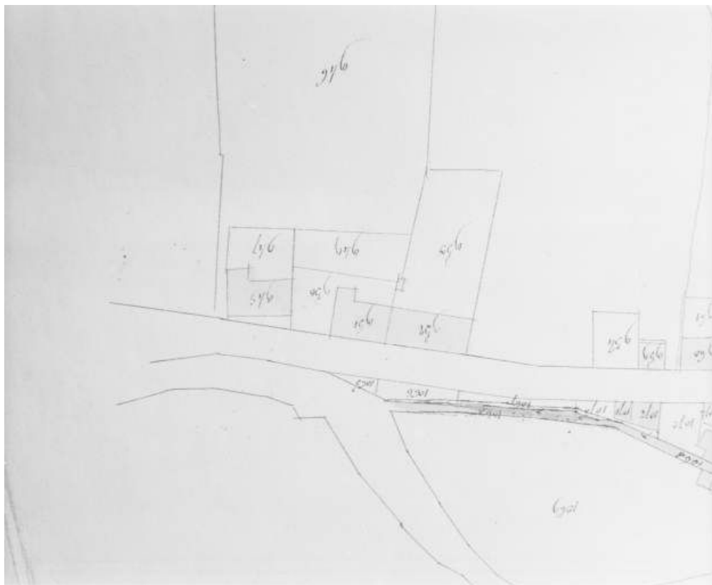
Morez. Section unique 7e feuille [plan de situation extrait du plan cadastral].

39, Morez, 194 à 198 rue de la République