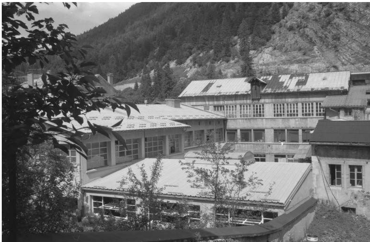
Façade postérieure des ateliers au n° 194.

39, Morez, 194 à 198 rue de la République