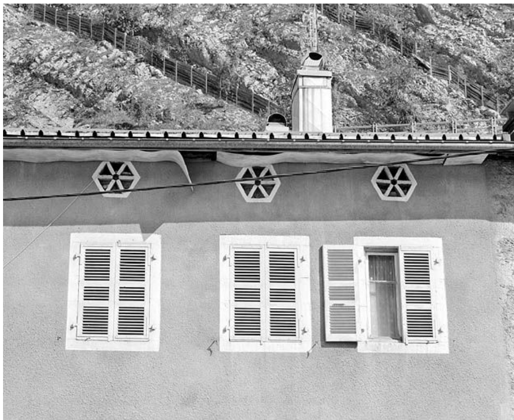
Maison au n° 18 rue Wladimir Gagneur : fenêtres du dernier étage et baies aérant le comble (façade postérieure). Maison faisant partie de l'usine de produits chimiques puis tannerie Brasier.