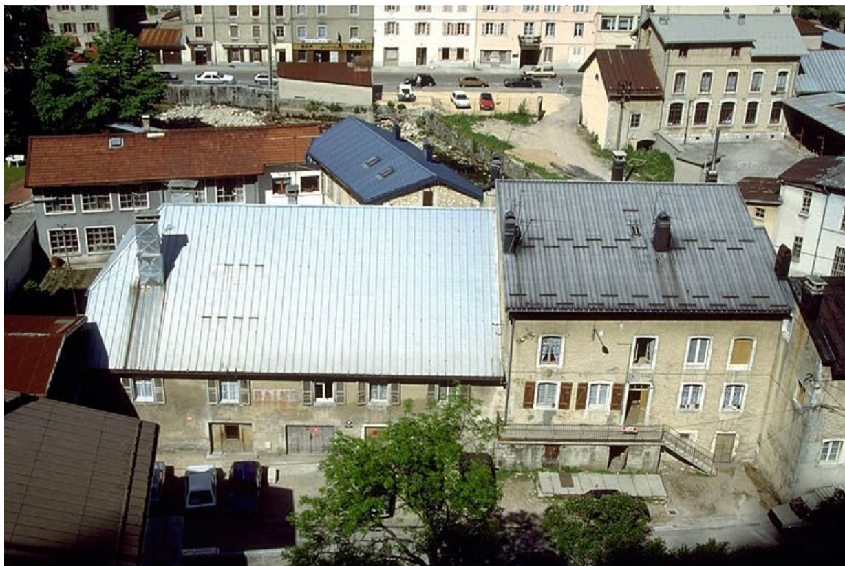
Vue d'ensemble plongeante depuis l'est.