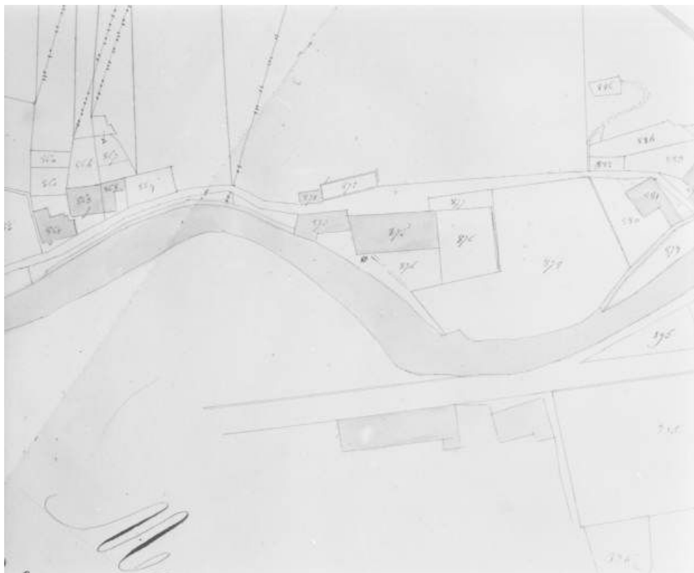
Morez. Section unique 6e feuille [plan de situation extrait du plan cadastral].