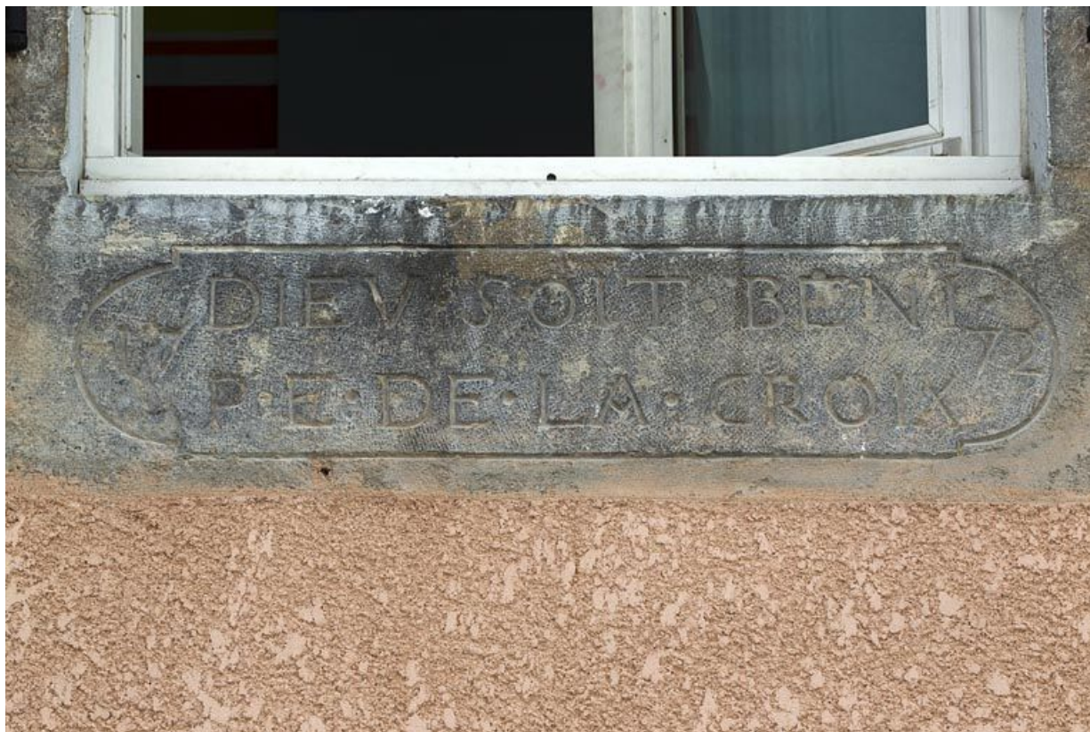
Linteau remployé comme appui de fenêtre.