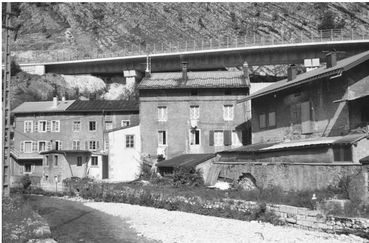
Vue d'ensemble depuis l'ouest (façades sur la Bienne).