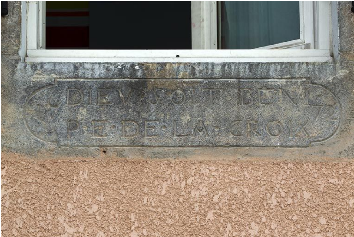
Linteau remployé comme appui de fenêtre.