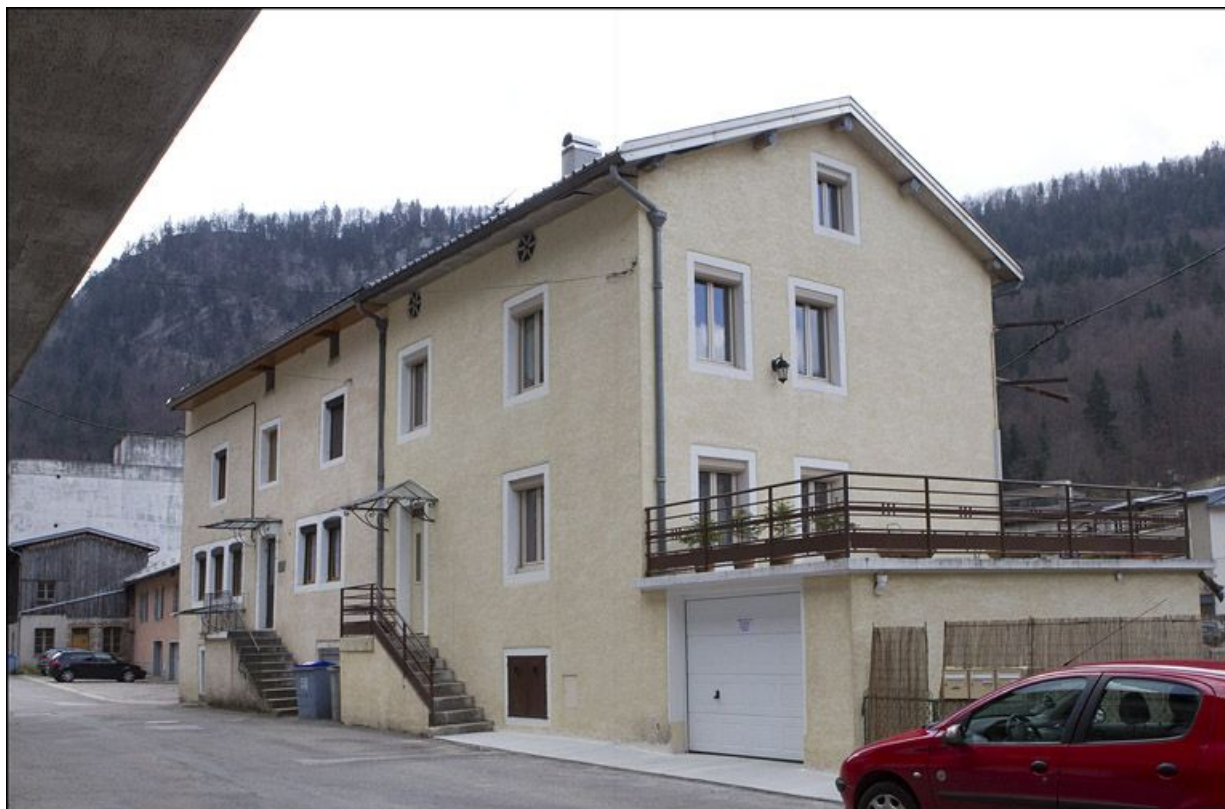
Façade antérieure de l'ancien moulin à tan, de trois quarts droite.