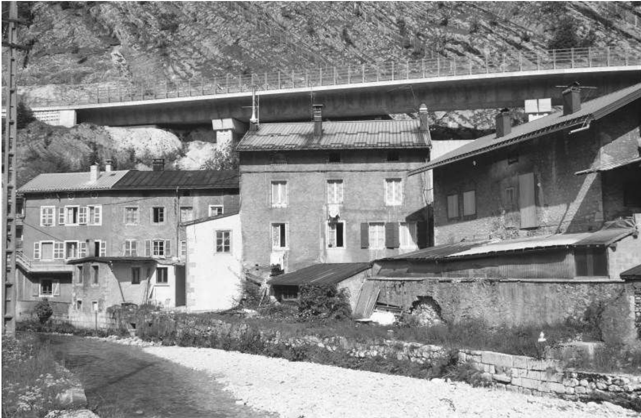
Vue d'ensemble depuis l'ouest (façades sur la Bienne).