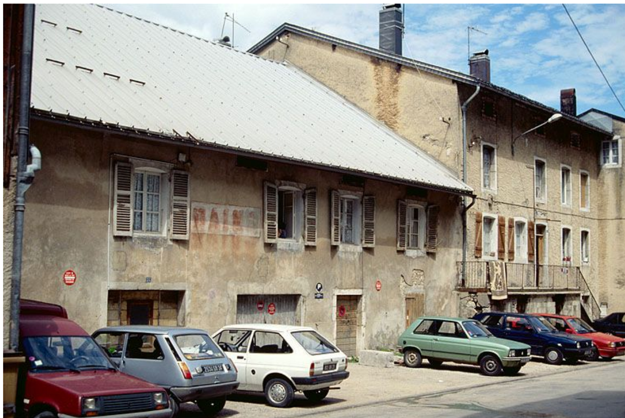
Façade antérieure de l'ancienne tannerie, de trois quarts gauche.