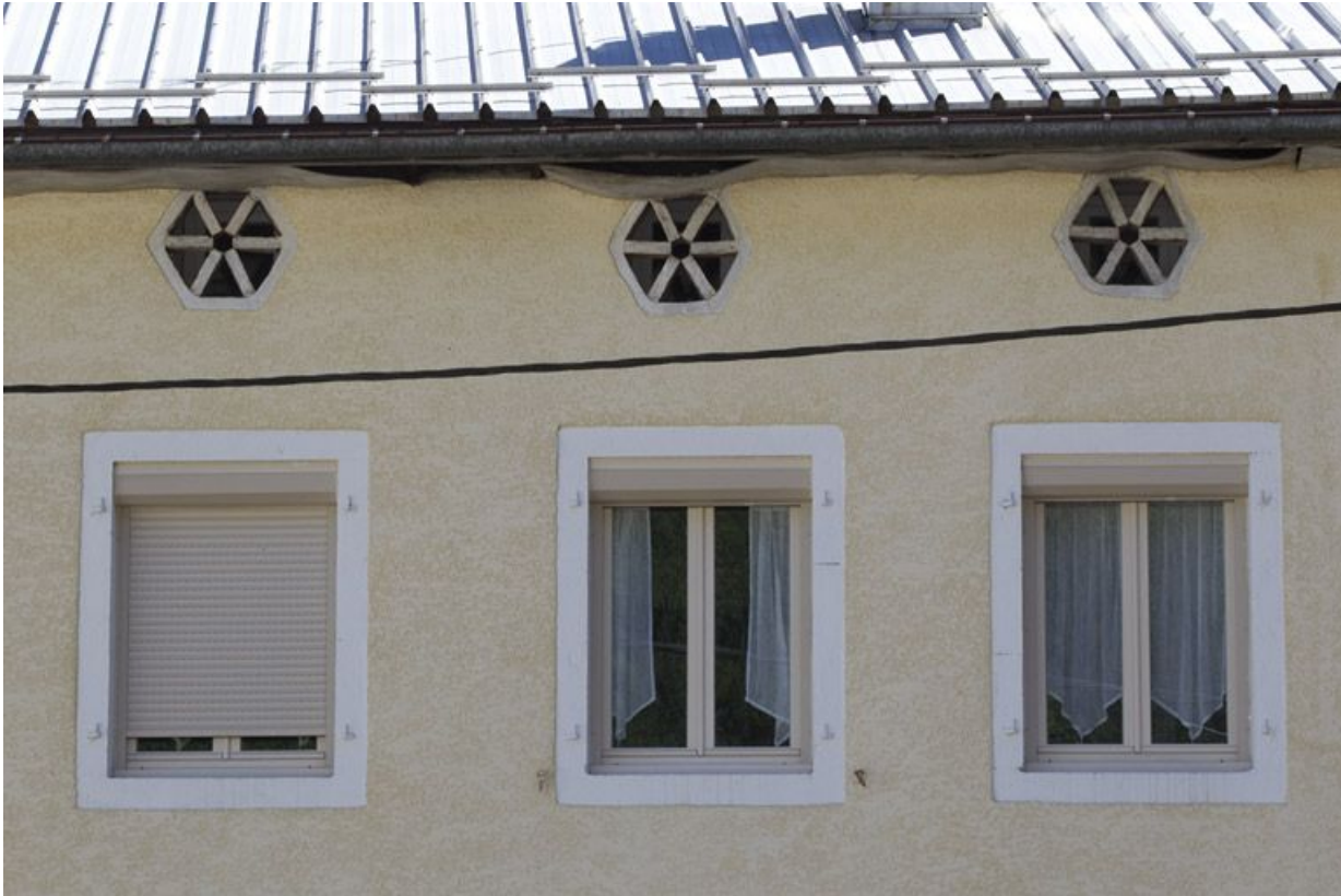
Baies aérant le comble de l'ancien moulin à tan.