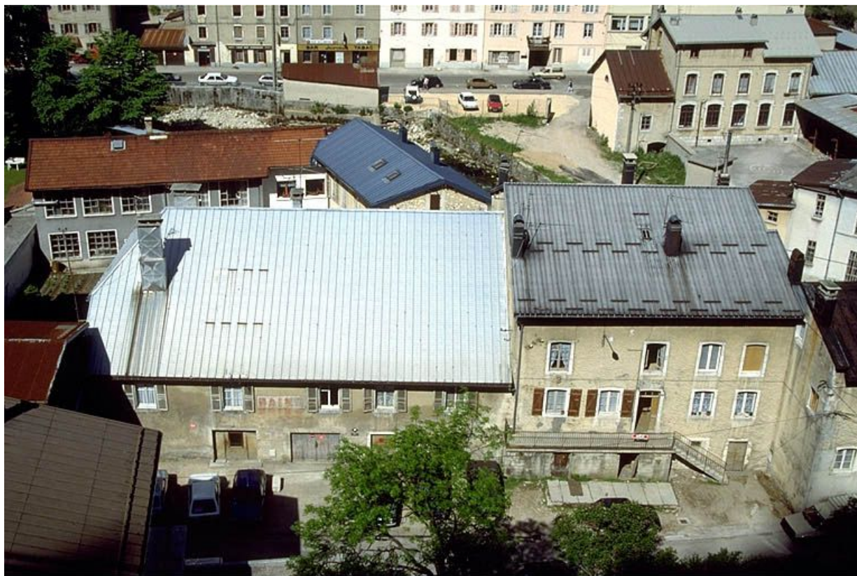
Vue d'ensemble plongeante depuis l'est. 39, Morez, 18 à 26 rue Wladimir Gagneur