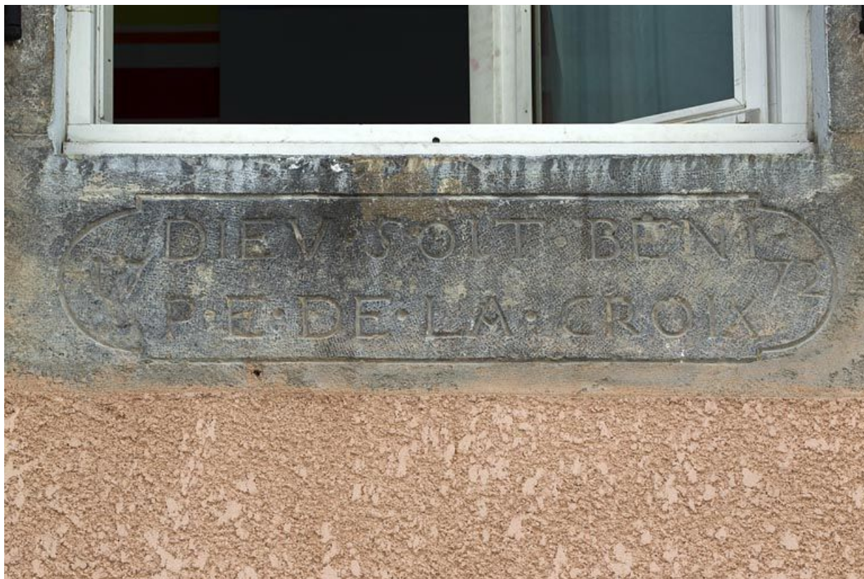
Linteau remployé comme appui de fenêtre.