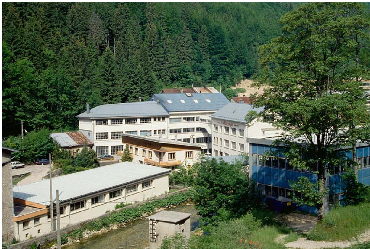
Vue d'ensemble depuis le sud-est.