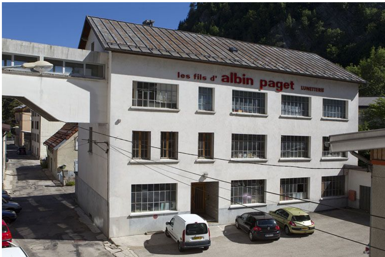
Usine de lunetterie Albin Paget (15 rue Emile Zola et 221 rue de la République).