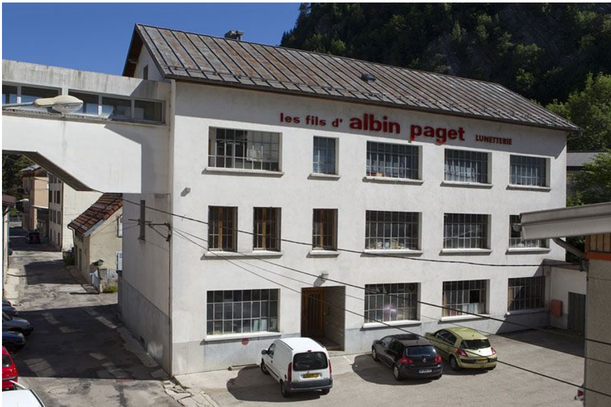
Usine de lunetterie Albin Paget (15 rue Emile Zola et 221 rue de la République).