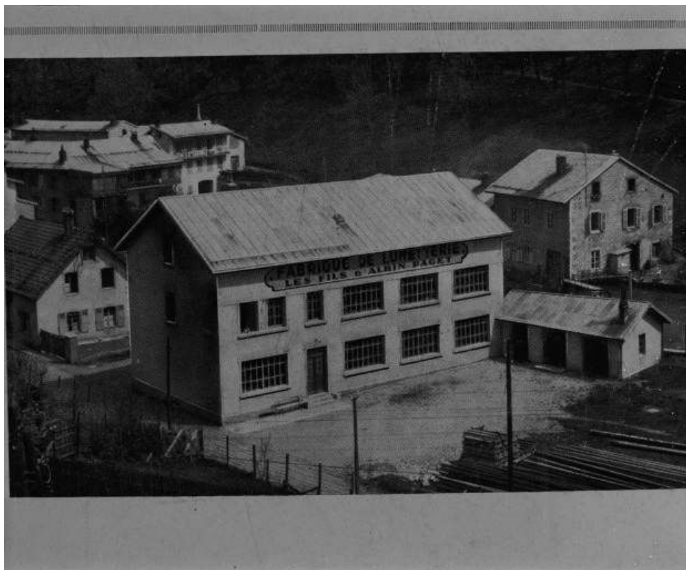
Vue d'ensemble de l'usine. Photographie, s.d. [2e quart 20e siècle, vers 1933]. 39, Morez, 15 rue Emile Zola