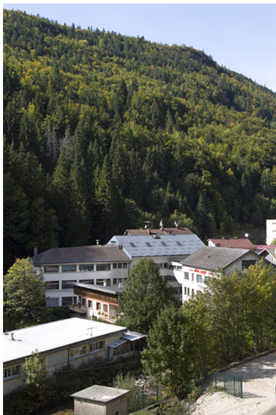
Vue d'ensemble depuis le sud-est.