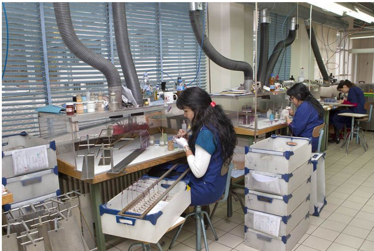
Usine de lunetterie Albin Paget : décoration de branches de lunettes.