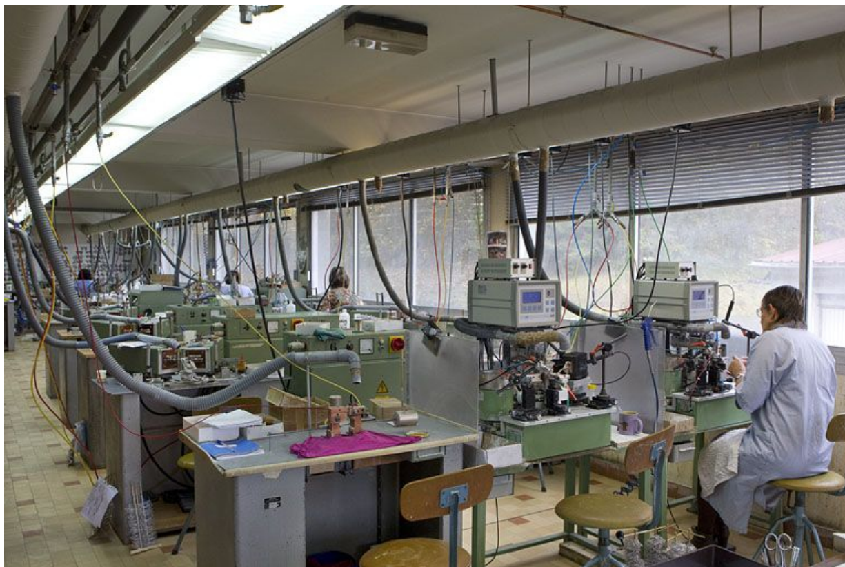
Usine de lunetterie Albin Paget : intérieur d'un atelier de soudage. 39, Morez, 15 rue Emile Zola