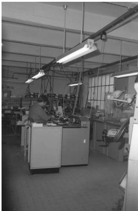
Intérieur d'un atelier dans le bâtiment d'origine.