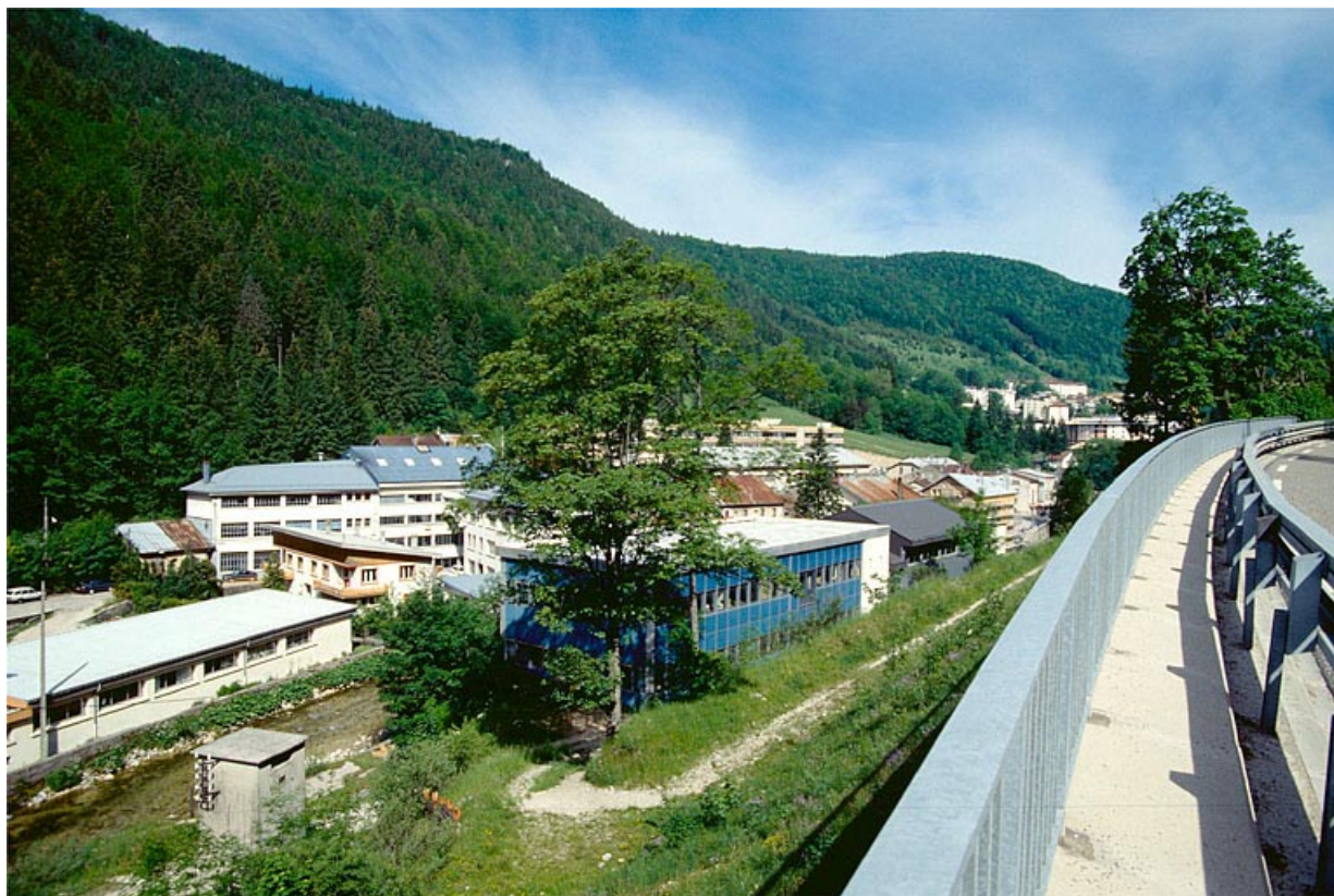
Vue d'ensemble depuis le sud-est.