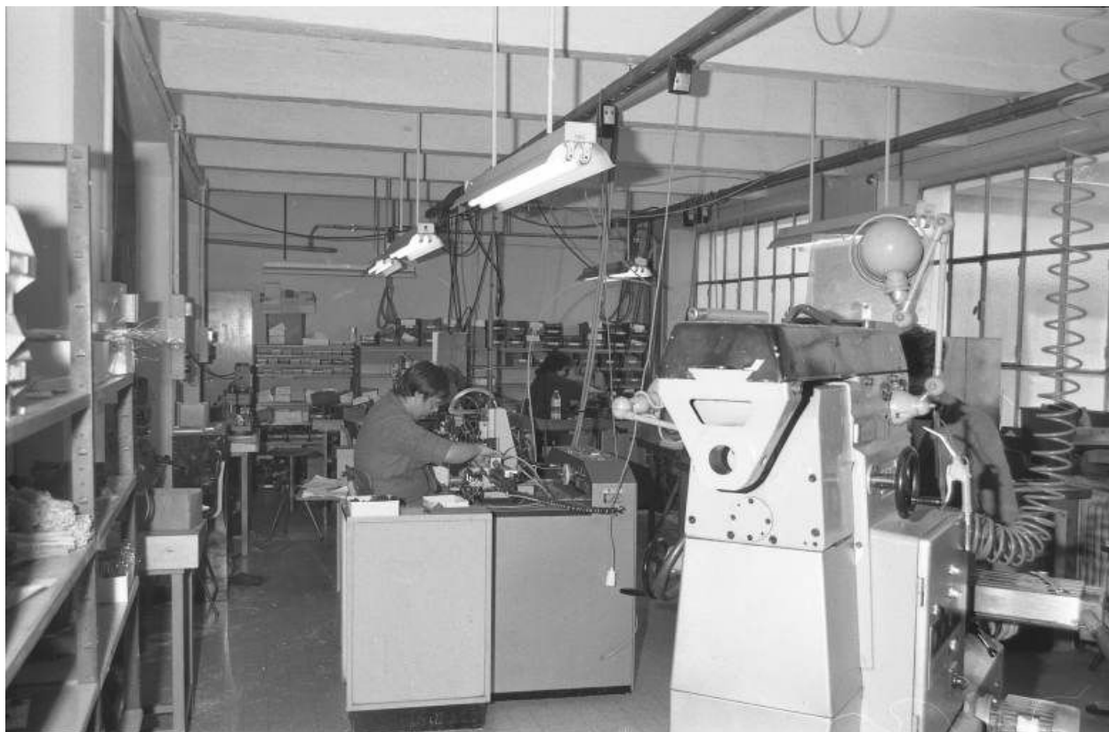
Intérieur d'un atelier dans le bâtiment d'origine.