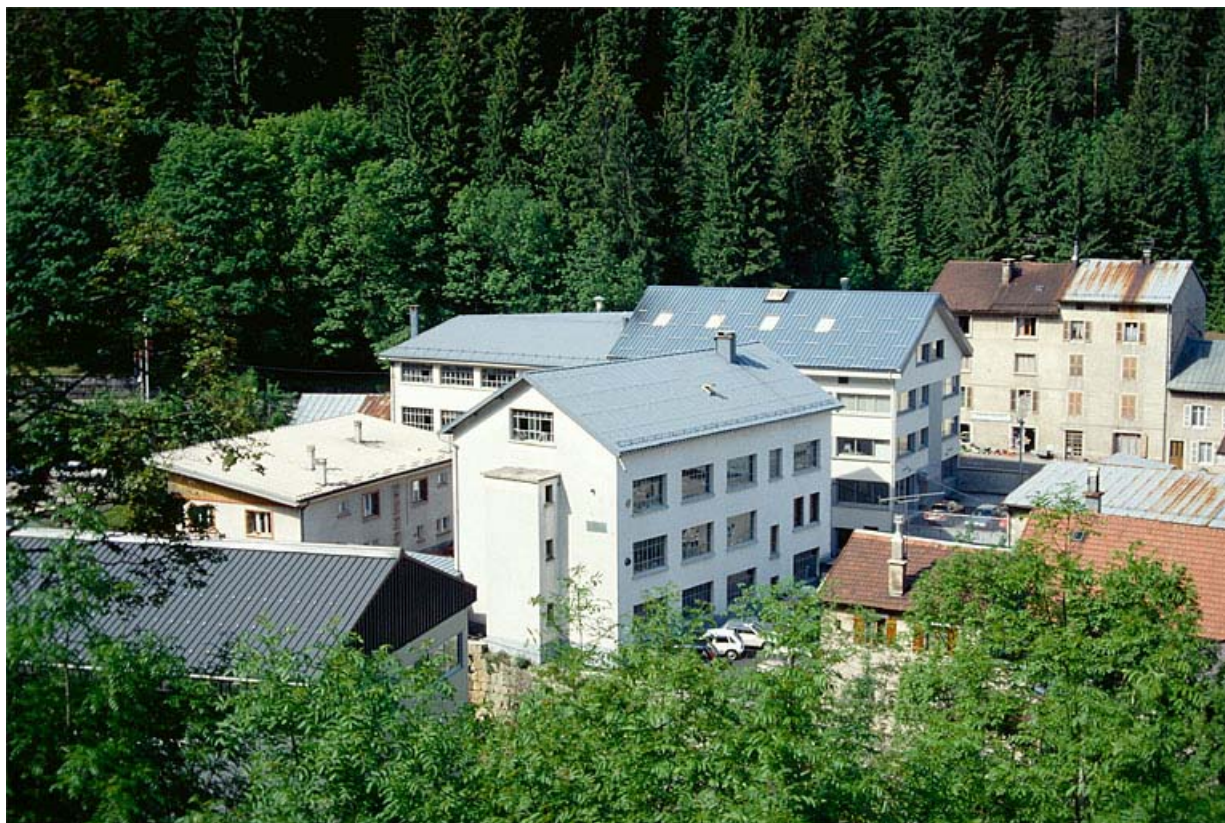
Vue d'ensemble depuis le nord-est.