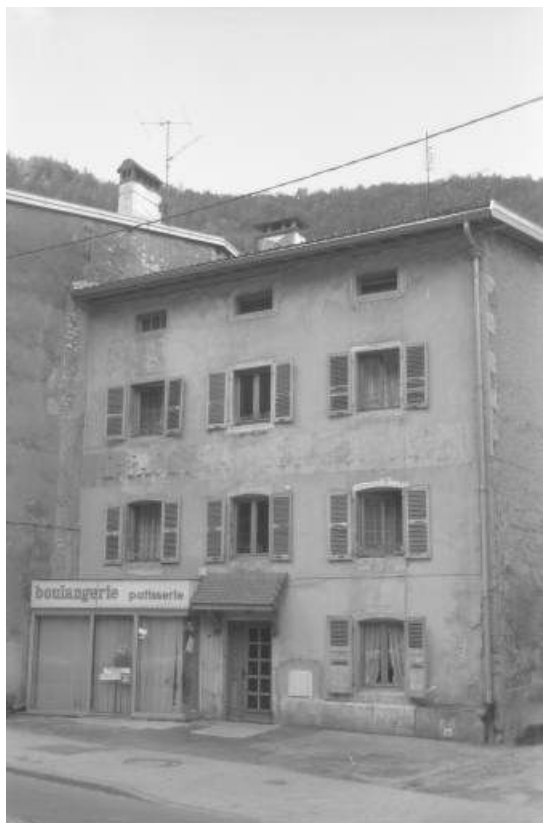
Premier atelier de la société Paget (Louis puis Albin), 204 rue de la République. 39, Morez, 15 rue Emile Zola