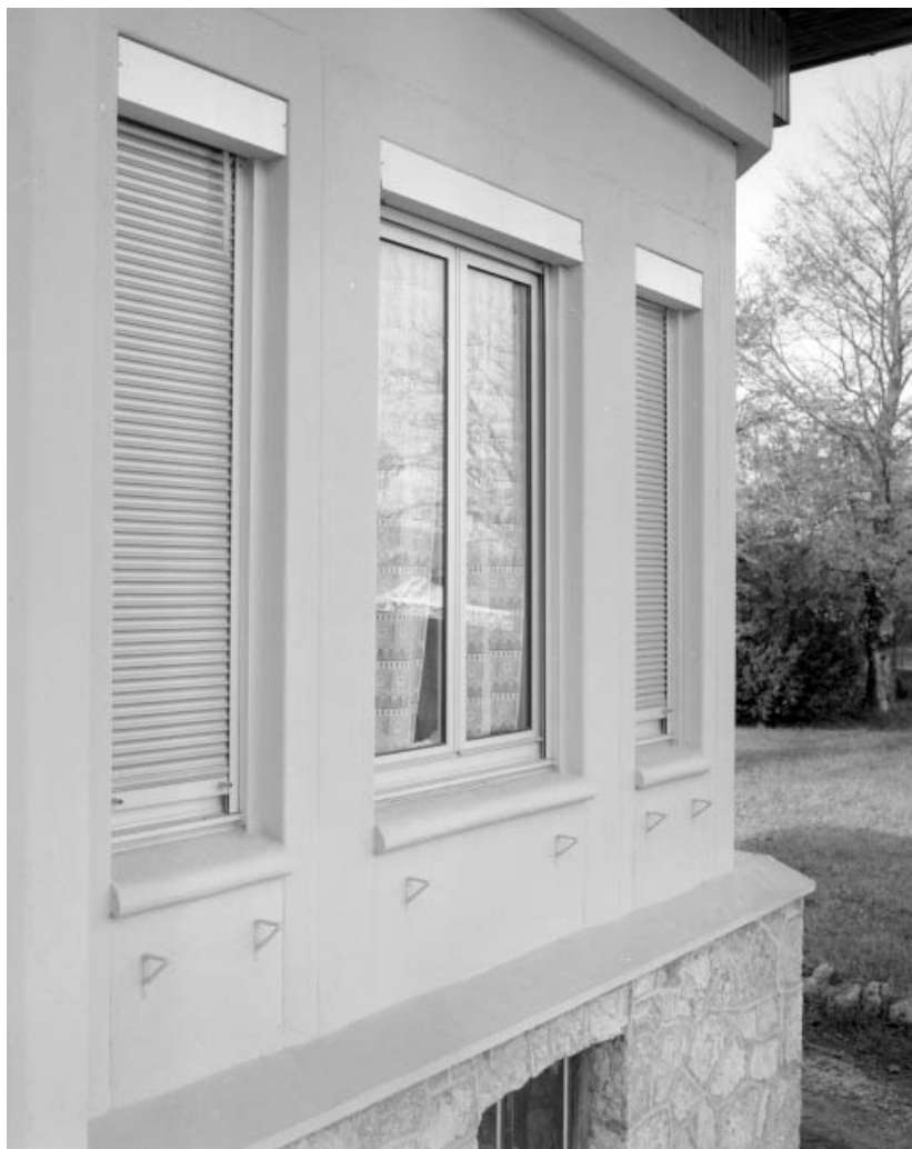
Façade antérieure : fenêtres du renforcement à droite.