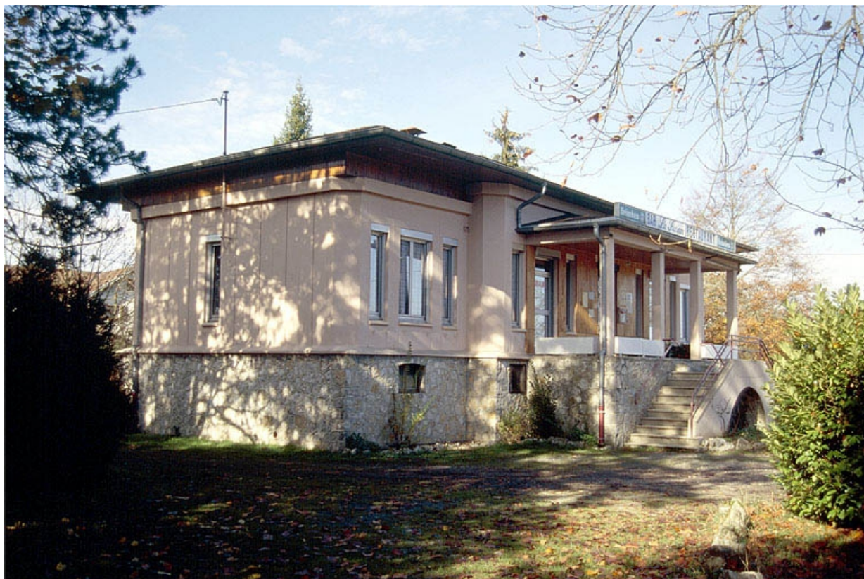
Façade antérieure vue de trois quarts gauche.