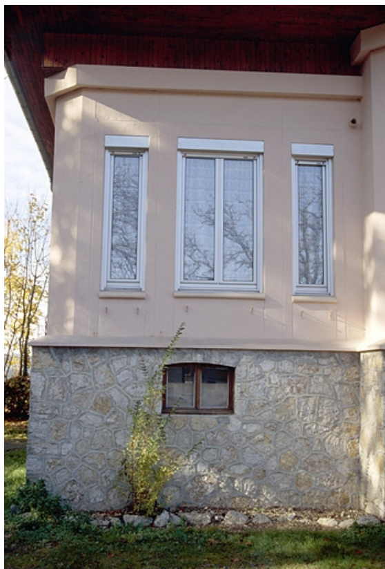
Façade antérieure : fenêtres du renforcement à gauche.