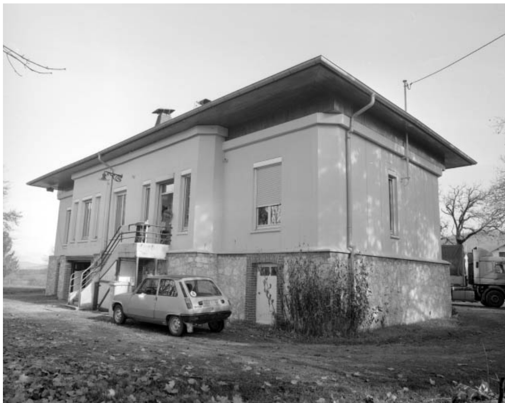
Façade postérieure vue de trois quarts droite.