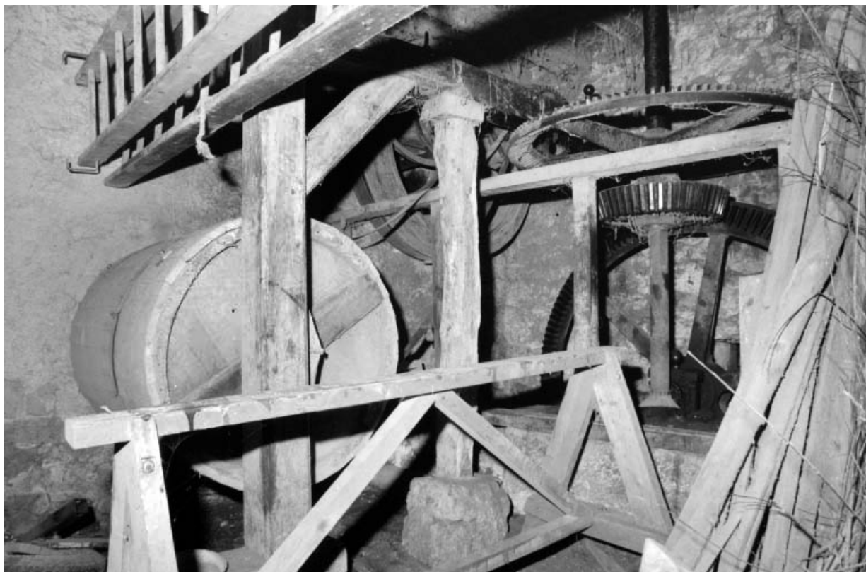
Tonneau de polissage et transmission.