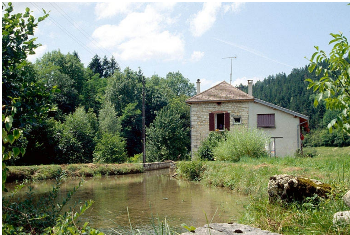
Bassin de retenue et façade latérale gauche.