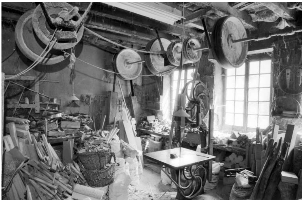
Intérieur de l'atelier de tournerie.