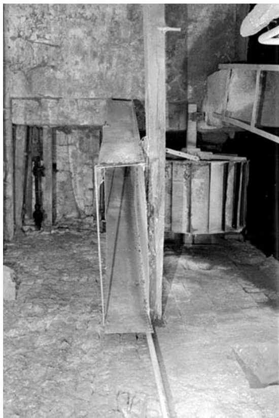
Roue en dessus et conduite d'amenée.

39, Graye-et-Charnay rue du Moulin des Prés