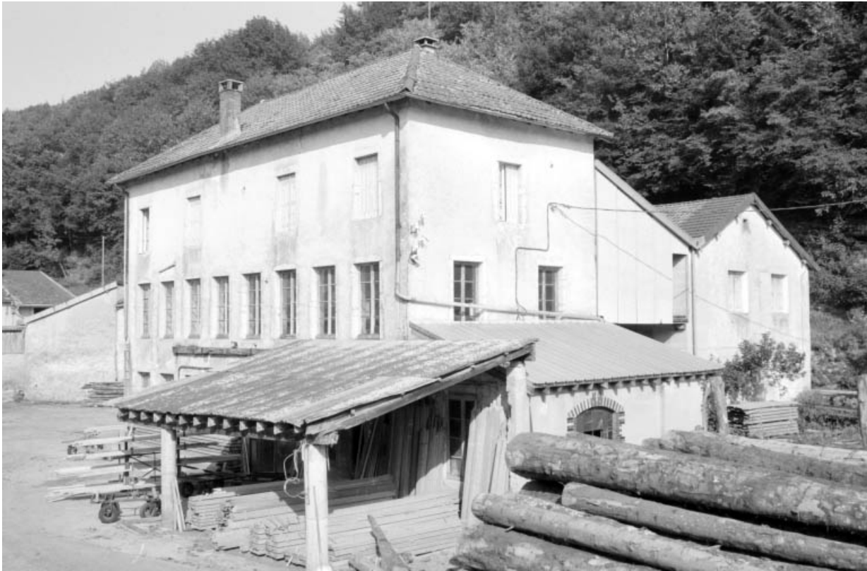
Ancienne tournerie, salle des machines et ancienne huilerie.

39, Arinthod, lieudit : le Moulin d'Arinthod