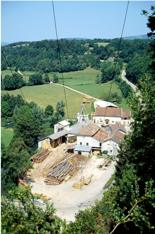
Vue d'ensemble plongeante depuis le sud.