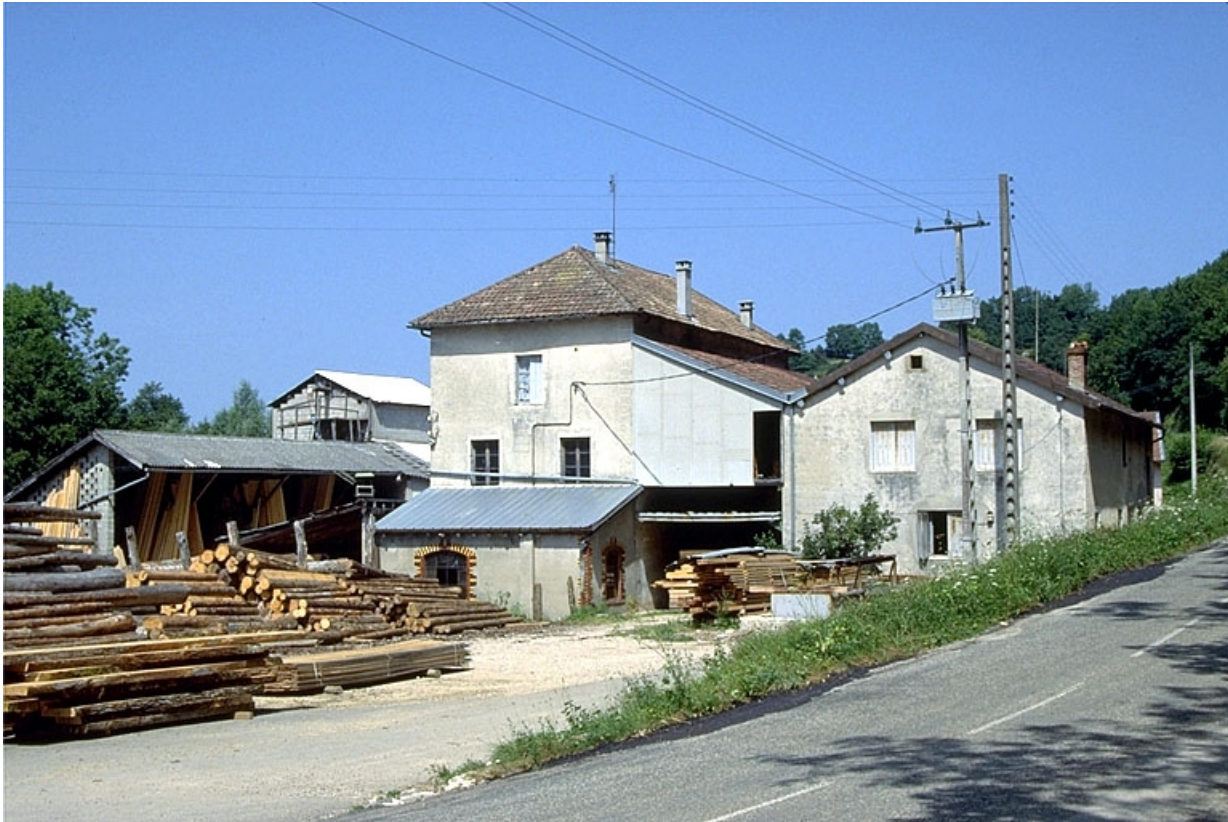
Scierie, ancienne tournerie et ancienne huilerie.

39, Arinthod, lieudit : le Moulin d'Arinthod