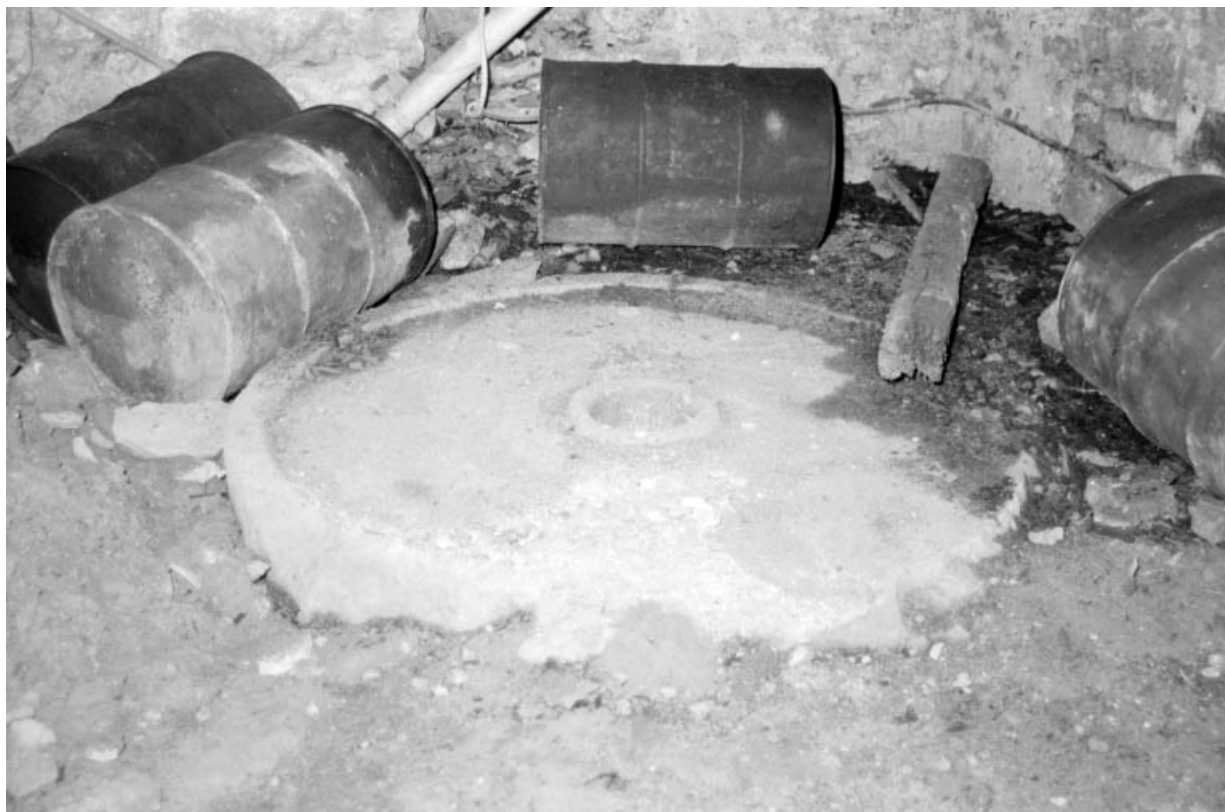
"Pierre à huile" (meule dormante).

39, Arinthod, lieudit : le Moulin d'Arinthod