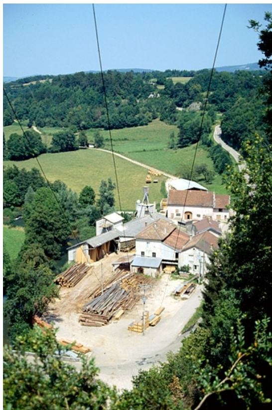
Vue d'ensemble plongeante depuis le sud.