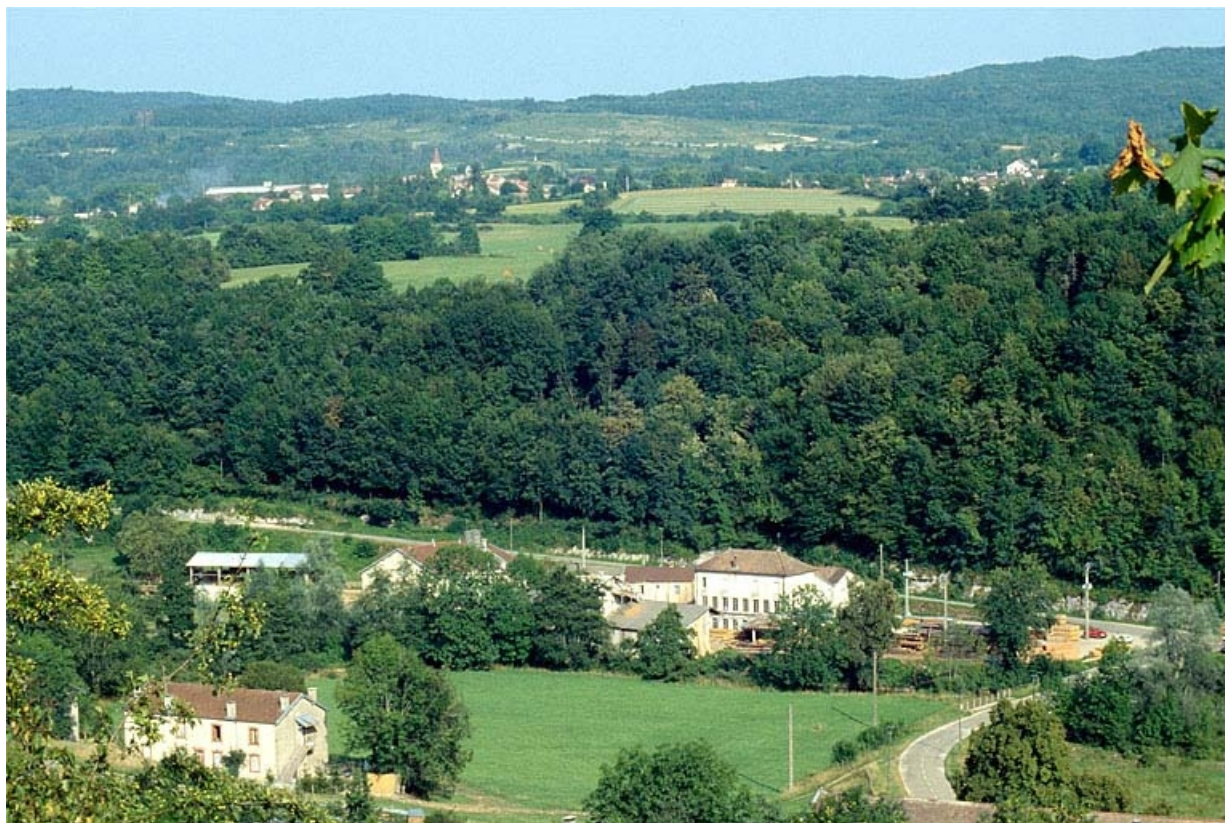
Vue d'ensemble plongeante depuis l'ouest.