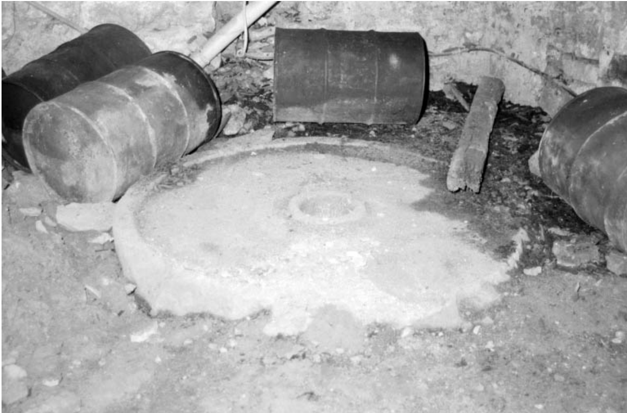
"Pierre à huile" (meule dormante).

39, Arinthod, lieudit : le Moulin d'Arinthod