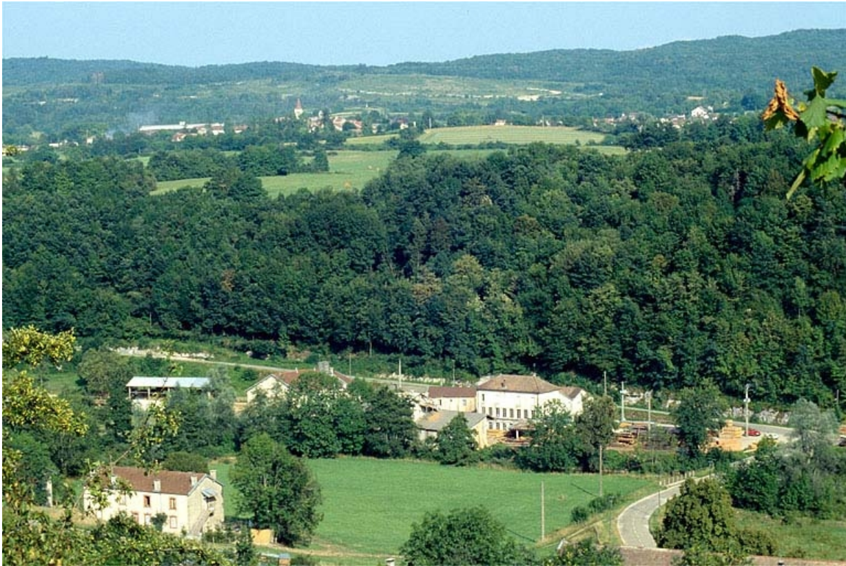
Vue d'ensemble plongeante depuis l'ouest.