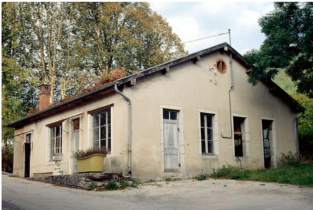
Atelier (B), vu de trois quarts droite.