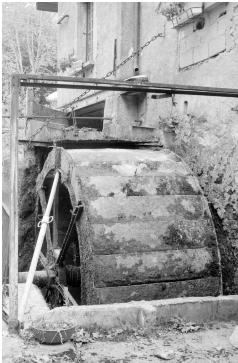
Roue en dessus et conduite d'amenée, vues de face.