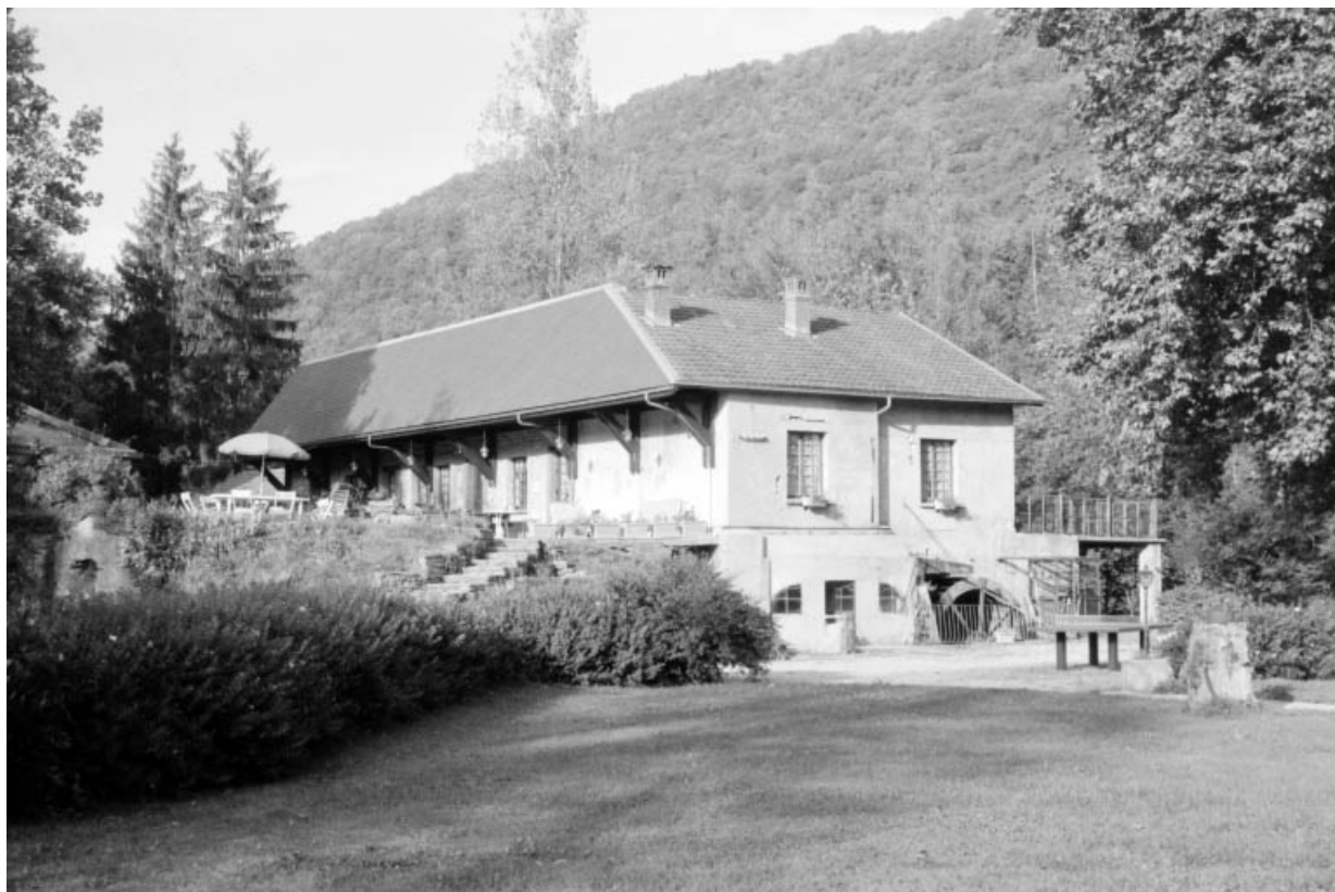
Bâtiment d'eau, vu de trois quarts droite.