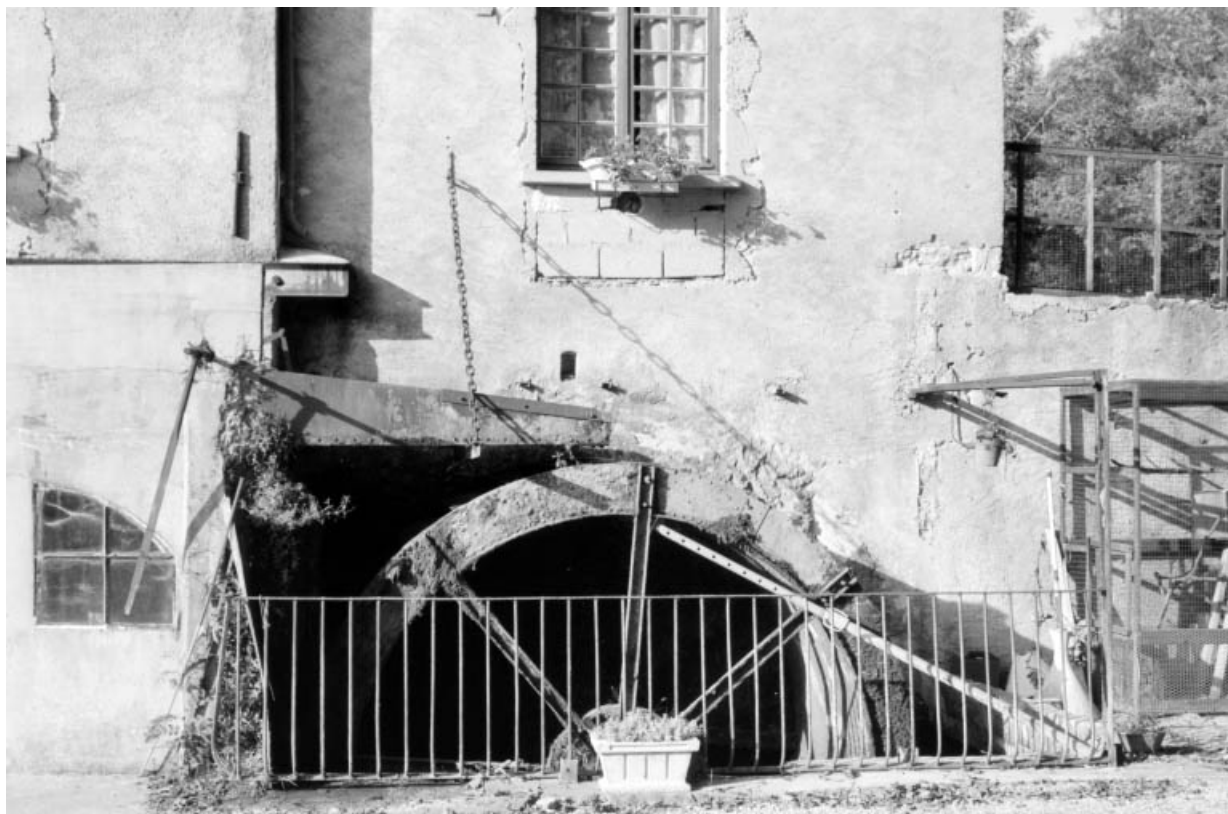
Roue en dessus et conduite d'amenée.