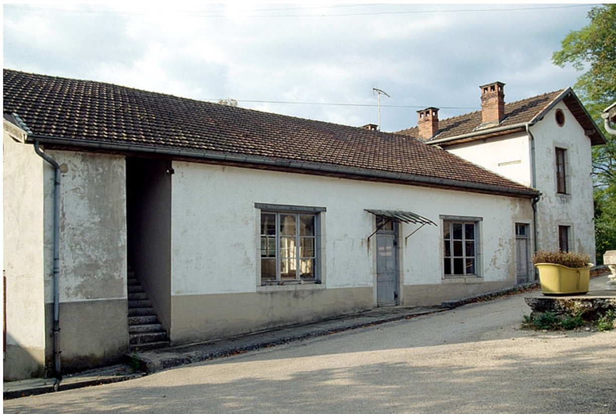
Ateliers de fabrication (C, D), vus de trois quarts gauche.