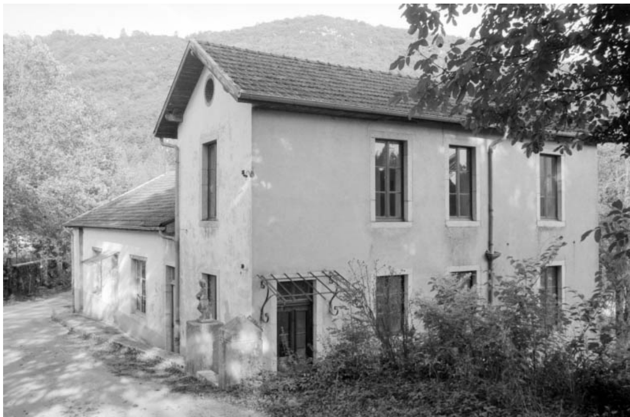
Ateliers de fabrication (C, D), vus de trois quarts droite.