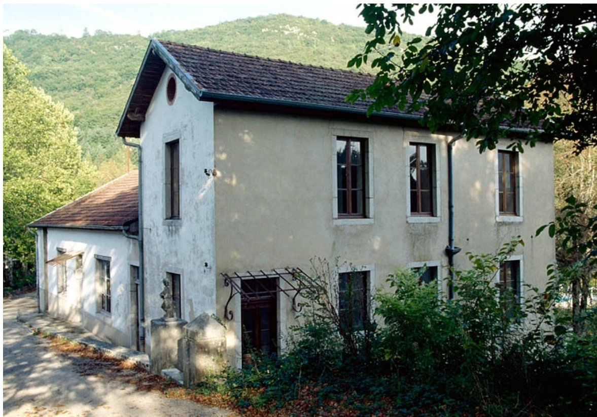
Ateliers de fabrication (C, D), vus de trois quarts droite.