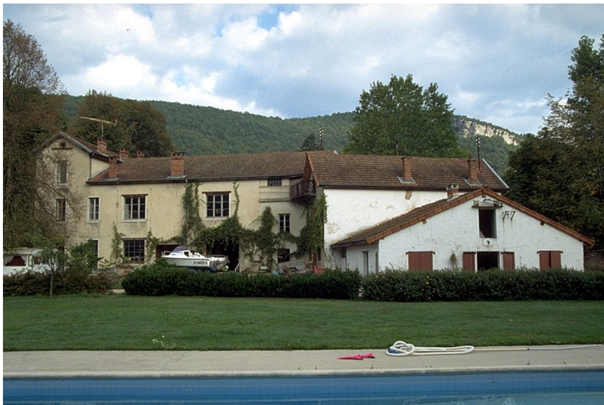
Façade postérieure des bâtiments (C, D, E, F).