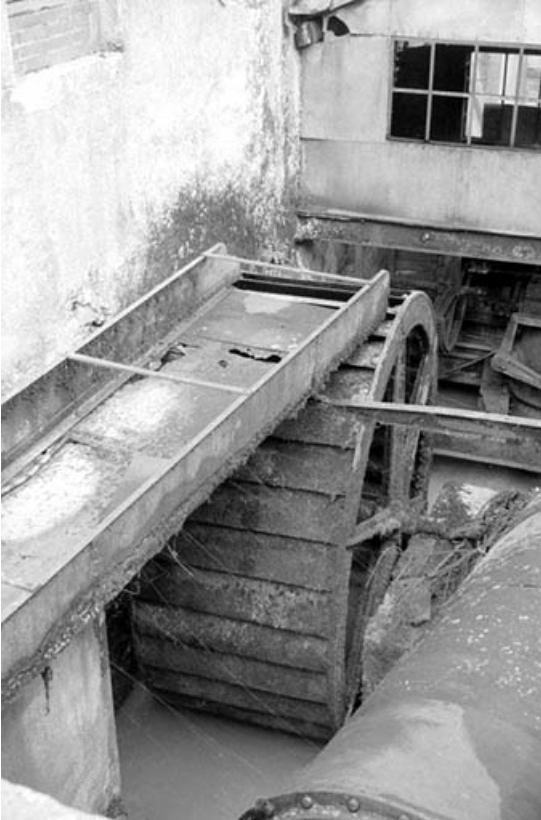
Roue hydraulique verticale.

39, Saint-Amour, 10 rue du Moulin de la Foule