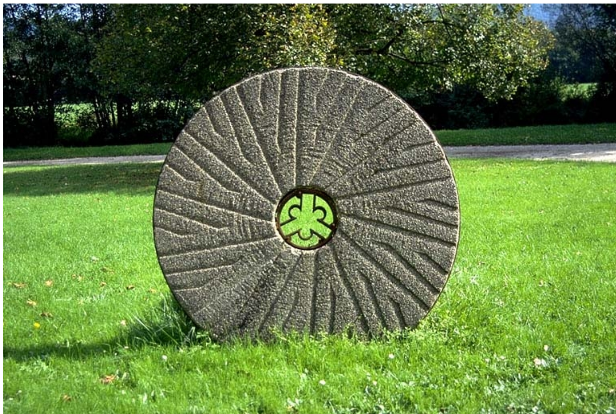
Meule vue de face.

39, Saint-Amour, 10 rue du Moulin de la Foule