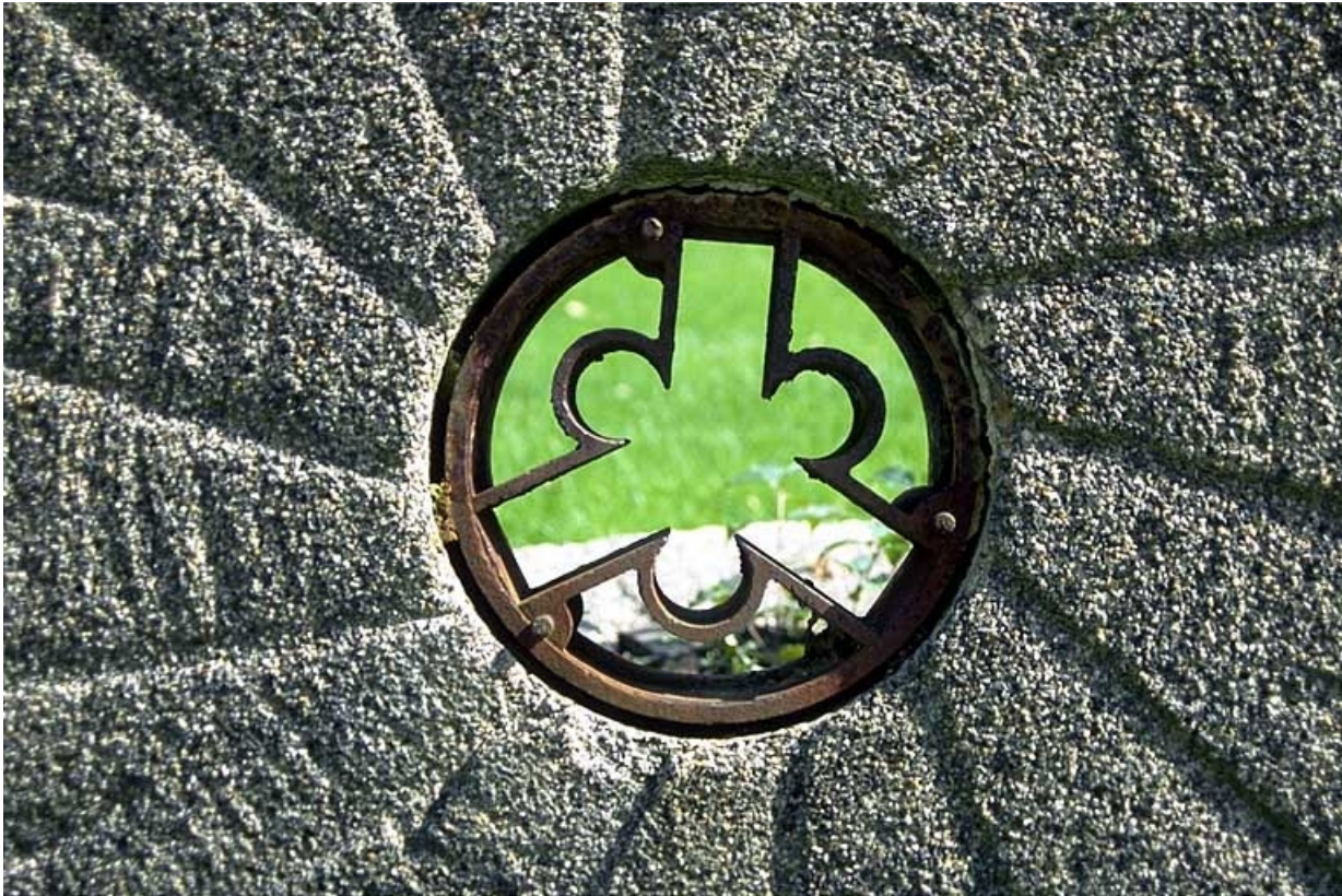
Meule : détail de l'anille.

39, Saint-Amour, 10 rue du Moulin de la Foule