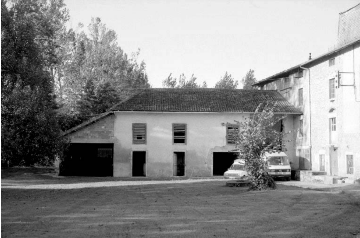
Ancienne étable et remise d'automobile.

39, Saint-Amour, 10 rue du Moulin de la Foule