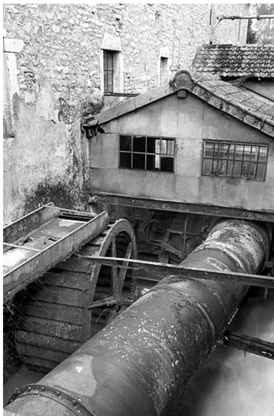
Roue hydraulique, conduite forcée et bâtiment d'eau.

39, Saint-Amour, 10 rue du Moulin de la Foule