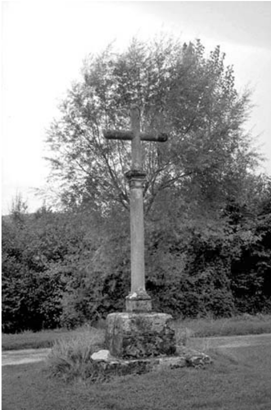
Croix de chemin.

39, Saint-Amour, 10 rue du Moulin de la Foule