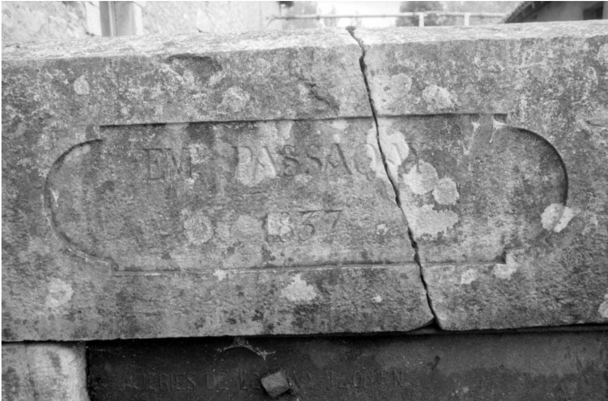
Inscription sur le garde-corps de la passerelle.

39, Saint-Amour, 10 rue du Moulin de la Foule