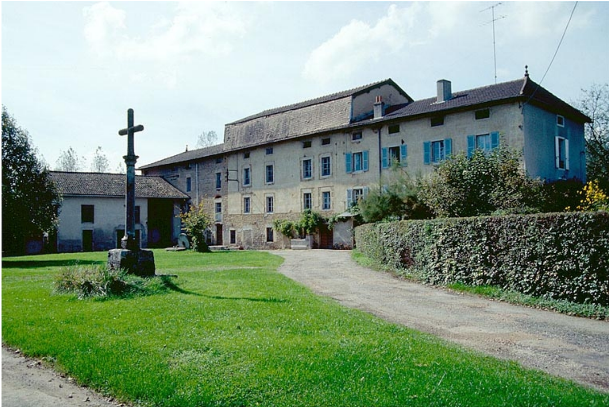
Vue d'ensemble depuis l'entrée de la cour. 39, Saint-Amour, 10 rue du Moulin de la Foule