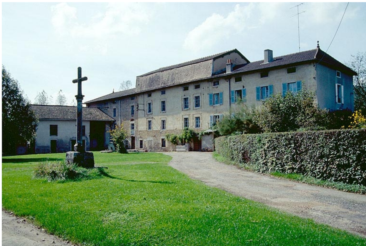
Vue d'ensemble depuis l'entrée de la cour. 39, Saint-Amour, 10 rue du Moulin de la Foule