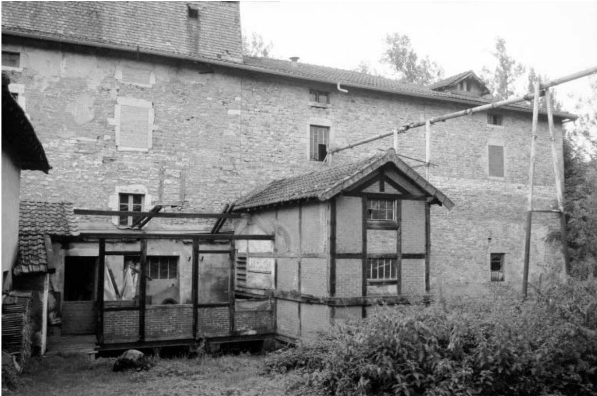
Magasin industriel et salle des machines en ruine.

39, Saint-Amour, 10 rue du Moulin de la Foule