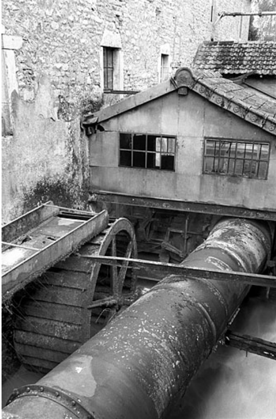
Roue hydraulique, conduite forcée et bâtiment d'eau.

39, Saint-Amour, 10 rue du Moulin de la Foule