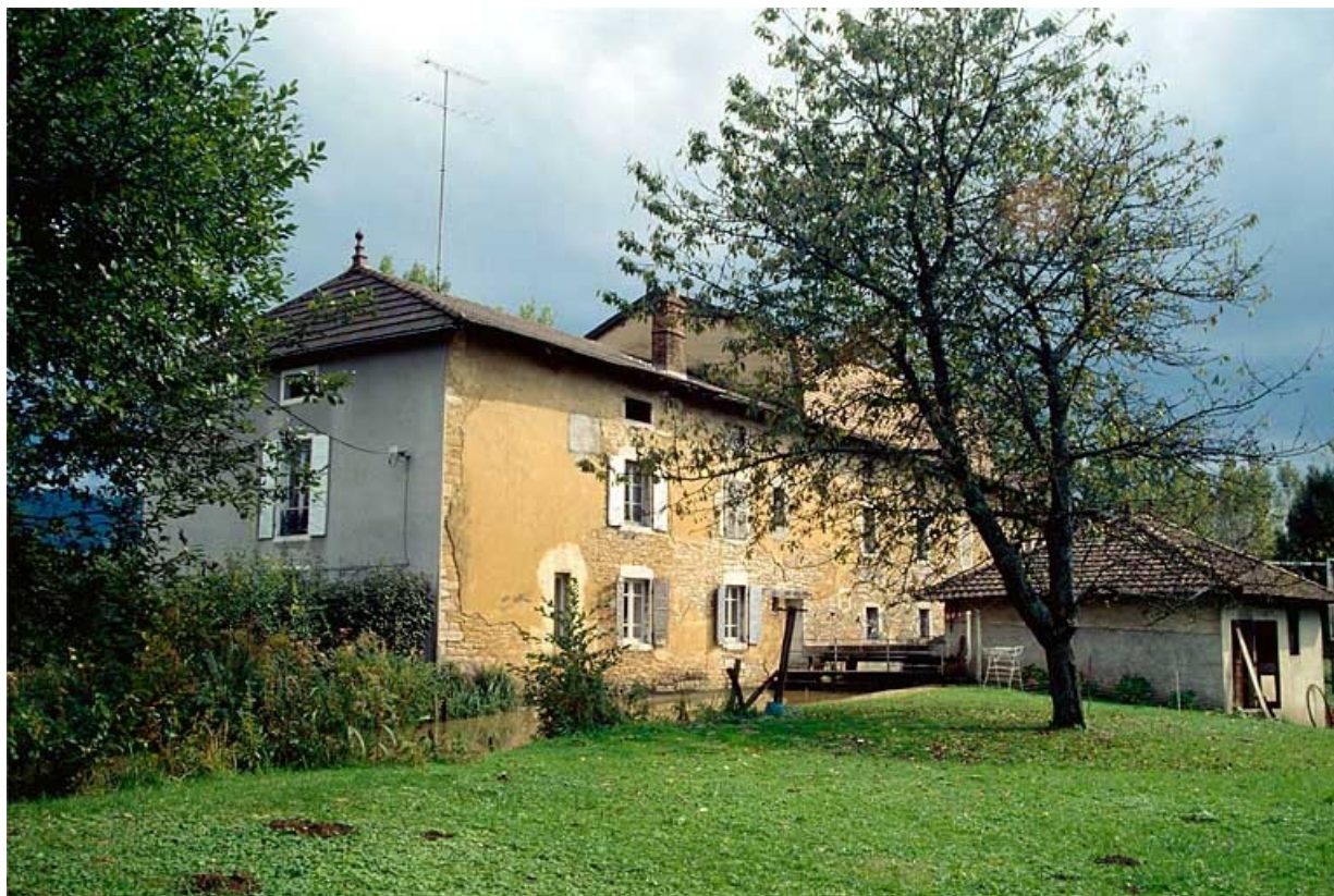
Façade postérieure du logement patronal (G), passerelle et ancien battoir à chanvre. 39, Saint-Amour, 10 rue du Moulin de la Foule