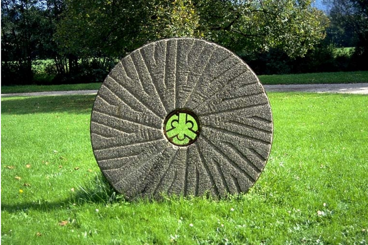
Meule vue de face.

39, Saint-Amour, 10 rue du Moulin de la Foule