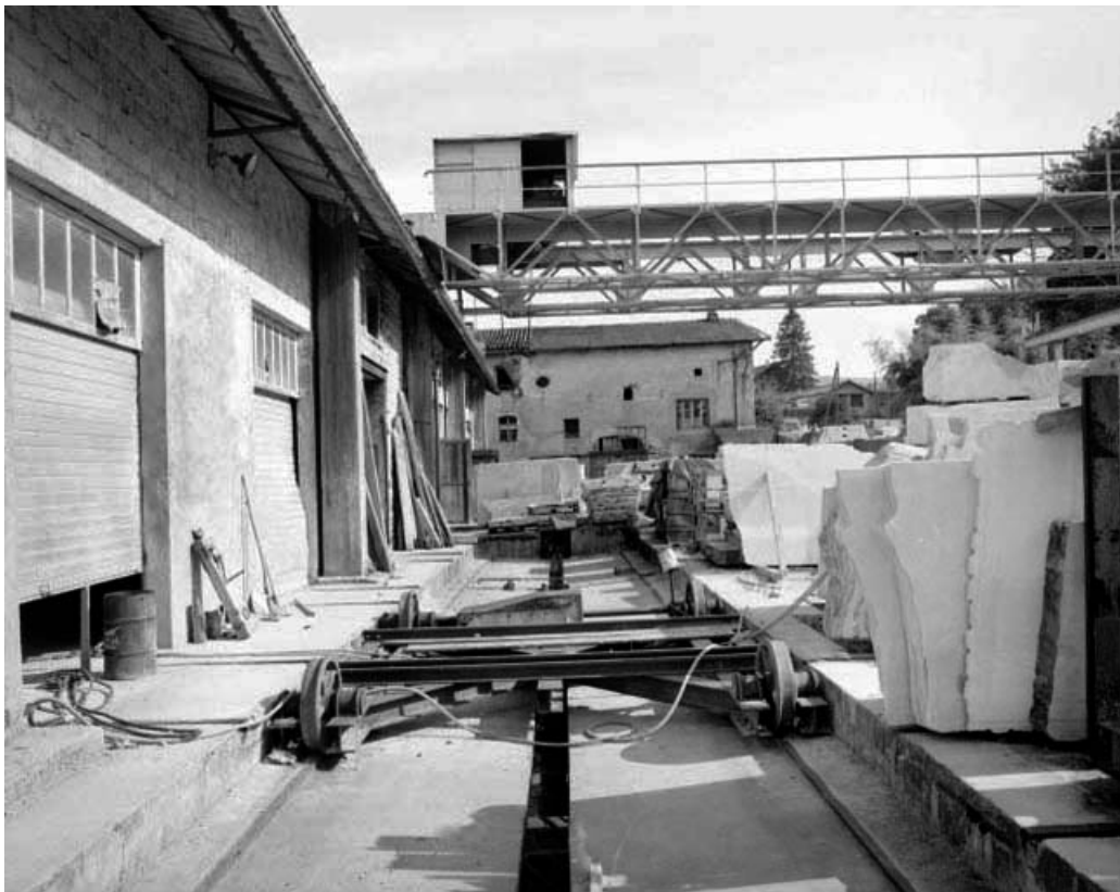
Chariot desservant l'atelier de fabrication.