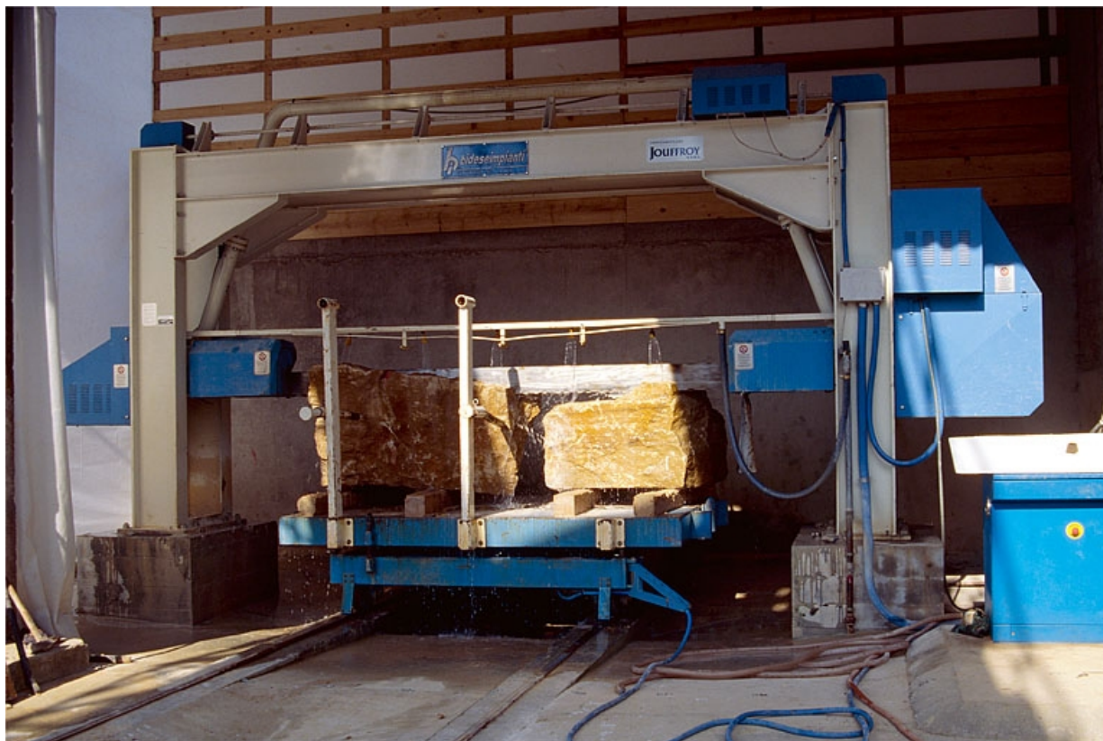
Scie monolame Bideseimpianti.