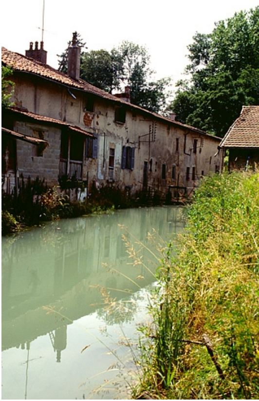
Canal vu d'amont et façade postérieure du logement, de l'atelier de réparation et du bureau. 39, Saint-Amour, 4, 6 rue des Sources