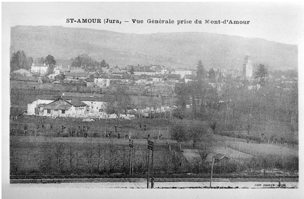
St-Amour (Jura) - Vue Générale prise du Mont-d'Amour.