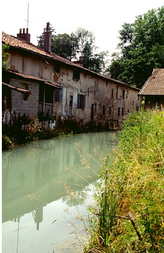
Canal vu d'amont et façade postérieure du logement, de l'atelier de réparation et du bureau. 39, Saint-Amour, 4, 6 rue des Sources