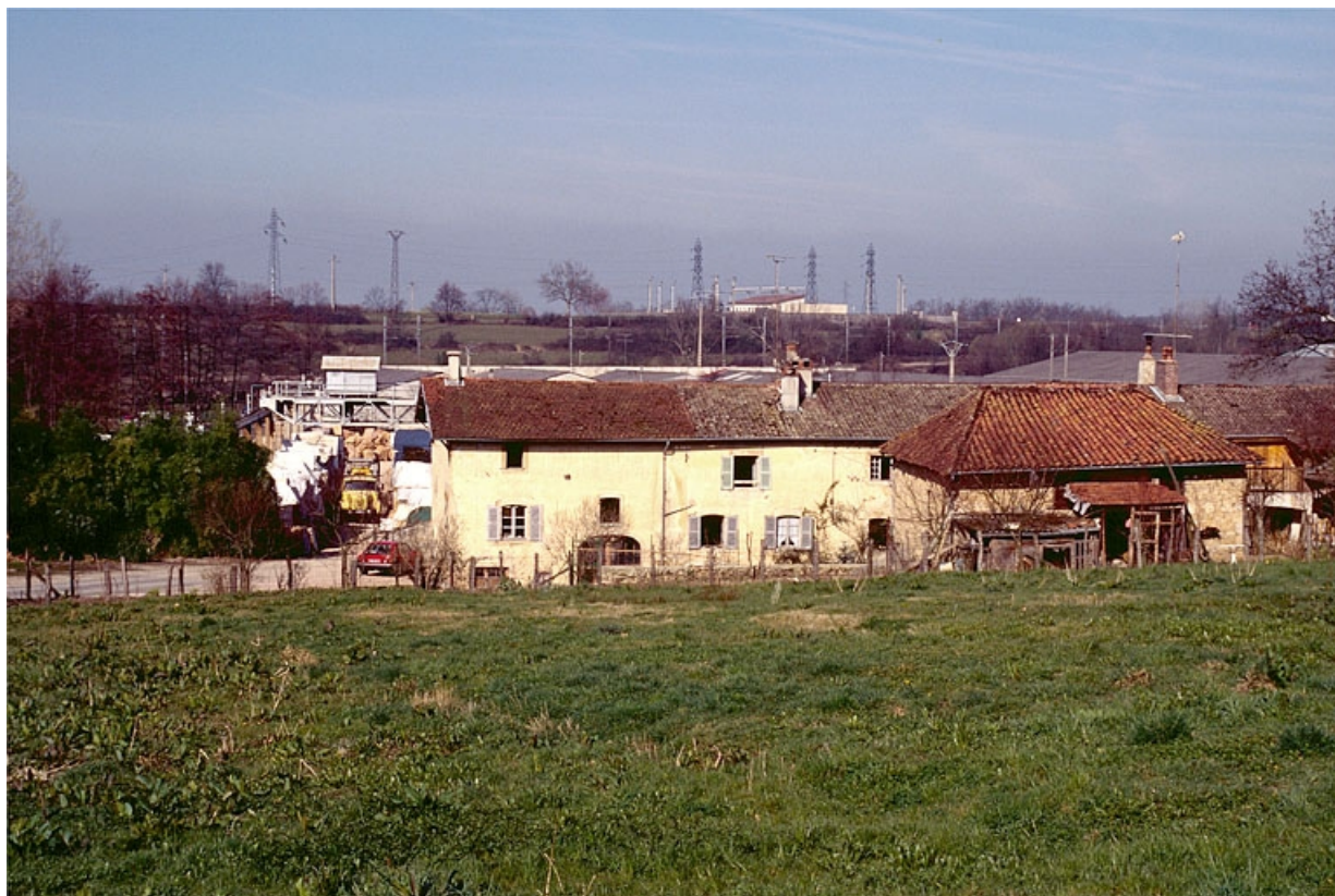
Bureau, atelier de réparation, logement et remise d'automobile, vus du sud-est.