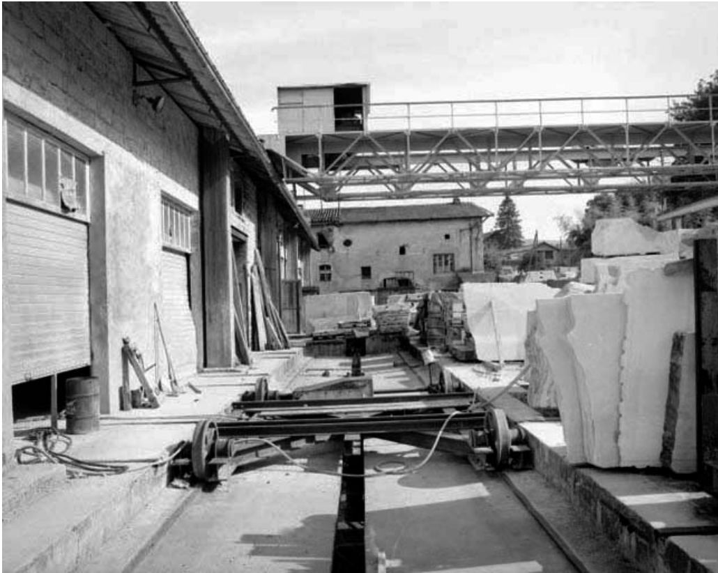
Chariot desservant l'atelier de fabrication.