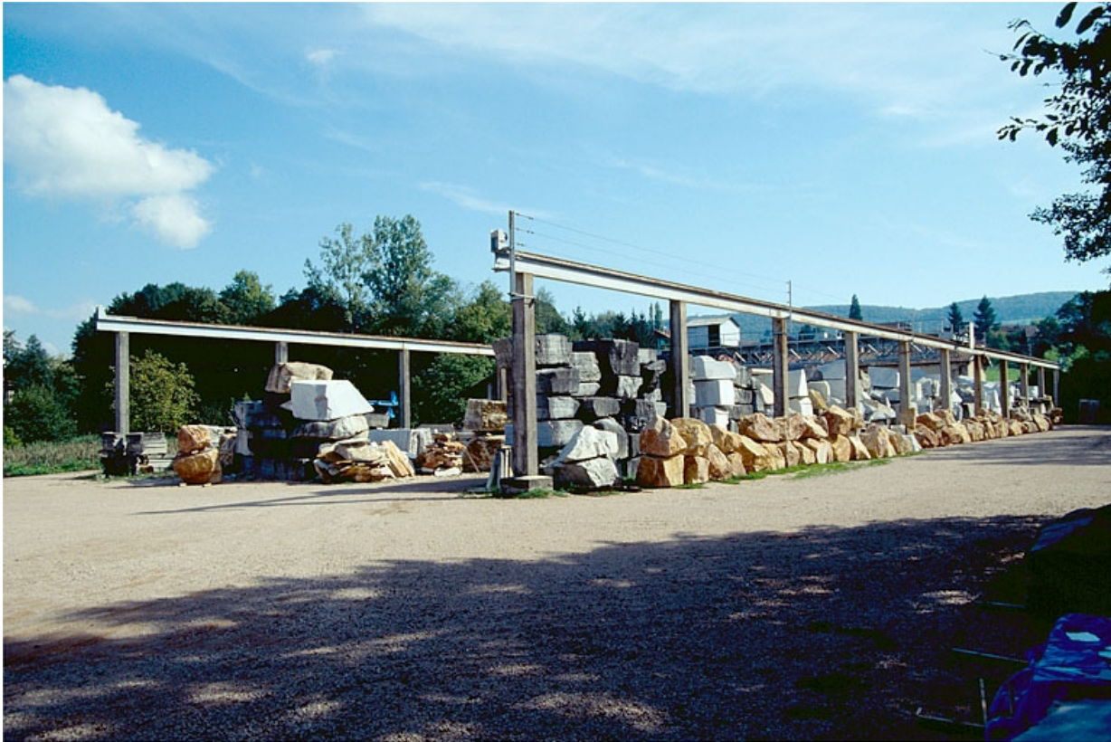
Pont roulant et aire des matières premières, vus de l'ouest.