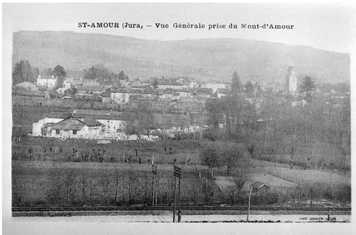
St-Amour (Jura) - Vue Générale prise du Mont-d'Amour.