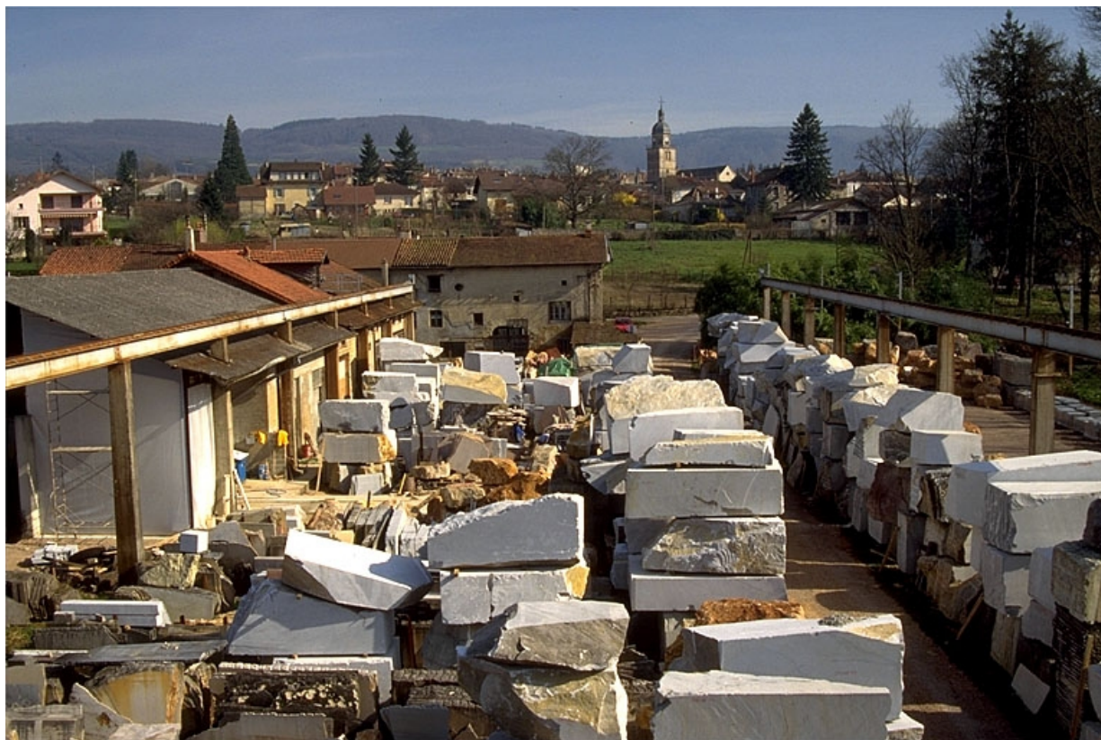
Aire des matières premières.