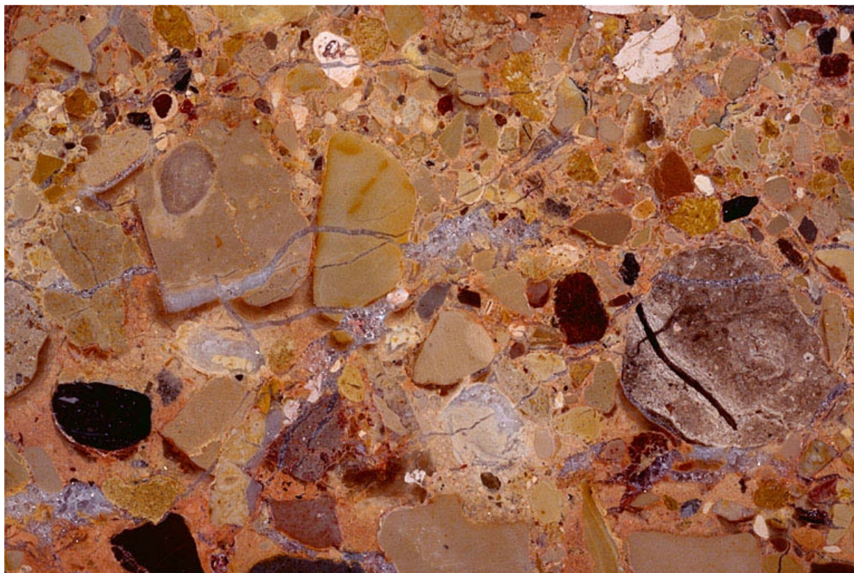
Echantillon de marbre de la Maladière (brèche).