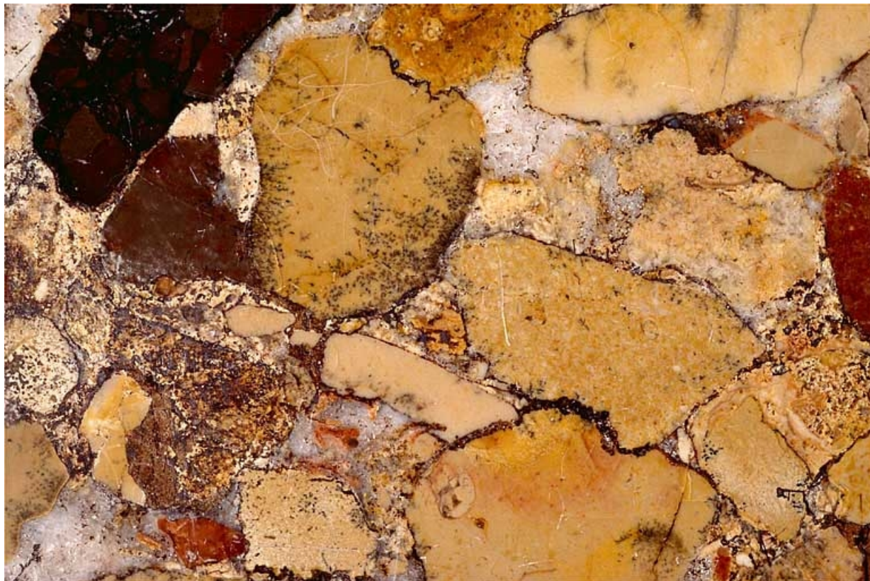
Echantillon de marbre de la Maladière (brèche).