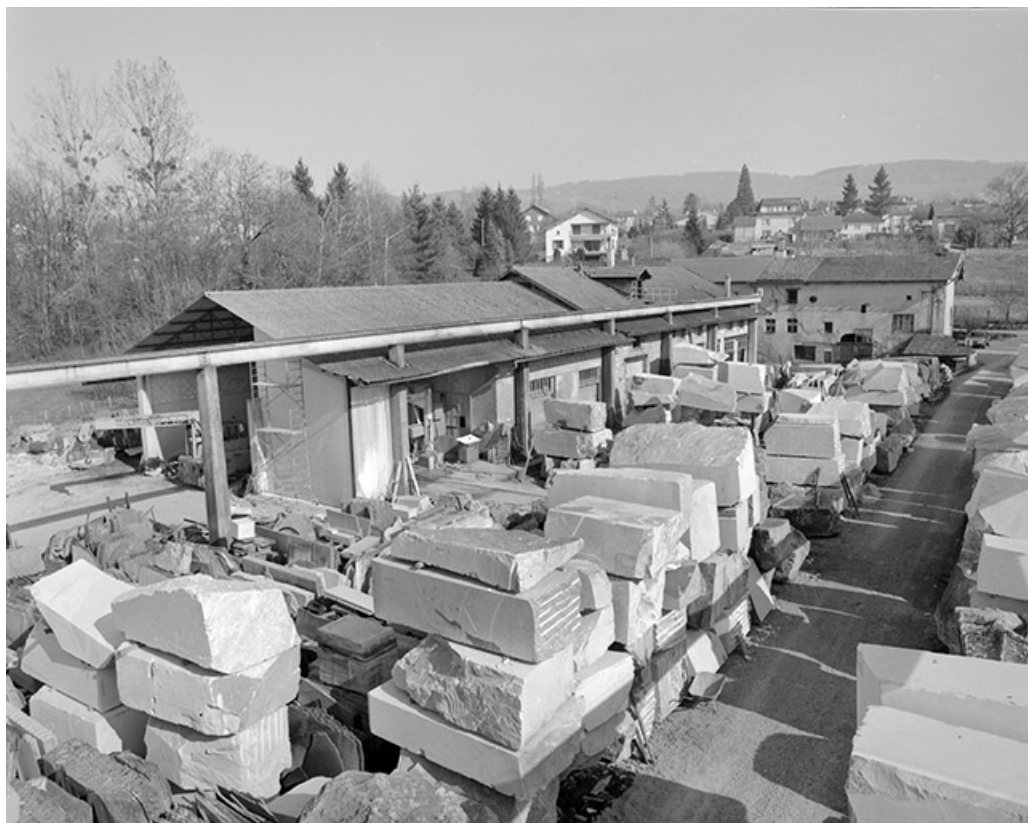
Vue d'ensemble des bâtiments depuis l'ouest.