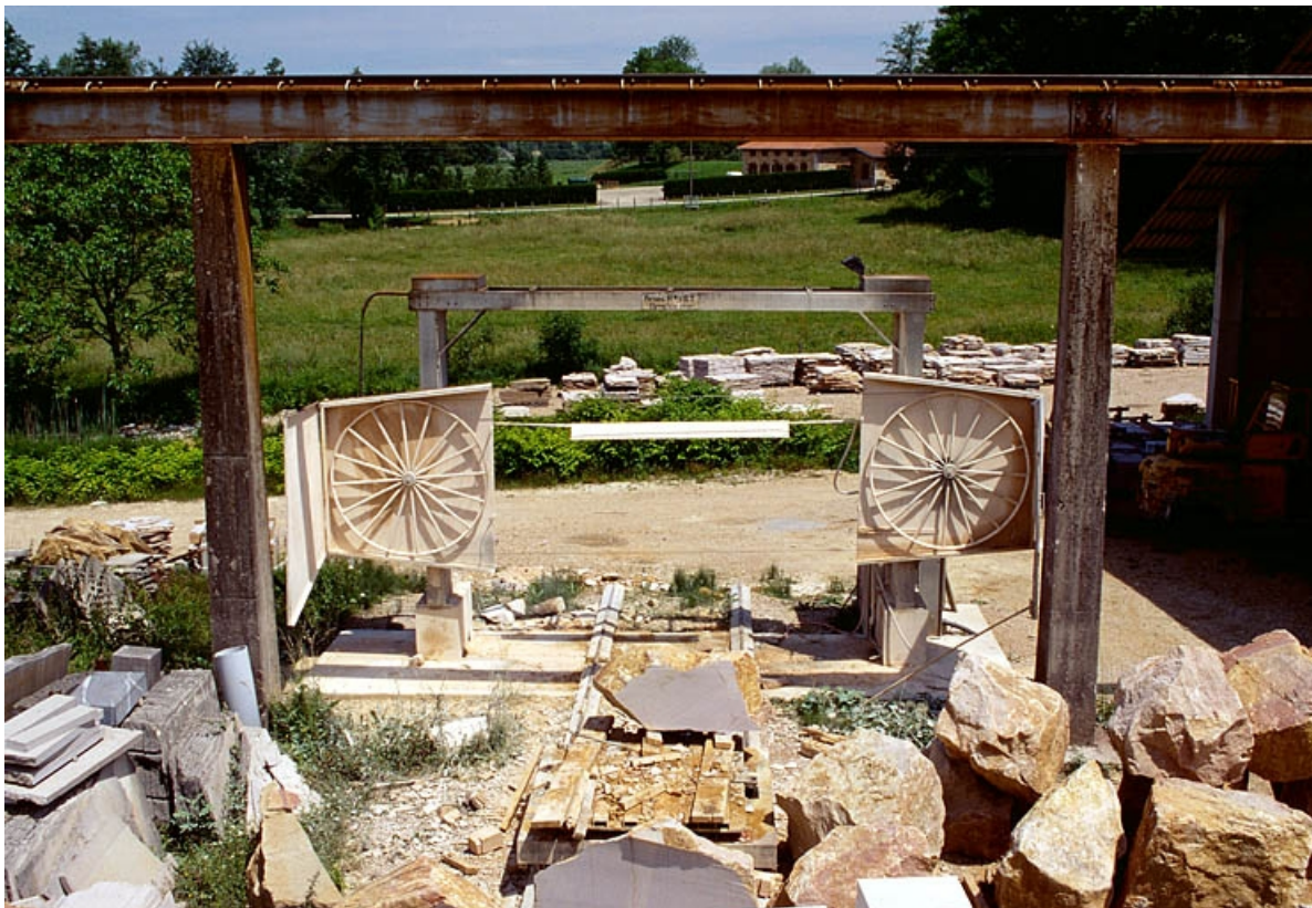
Vue d'ensemble de la scie à fil diamanté.