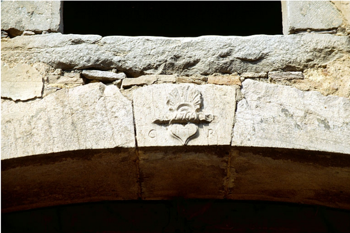
Bâtiment du bureau : clé de voûte sculptée.