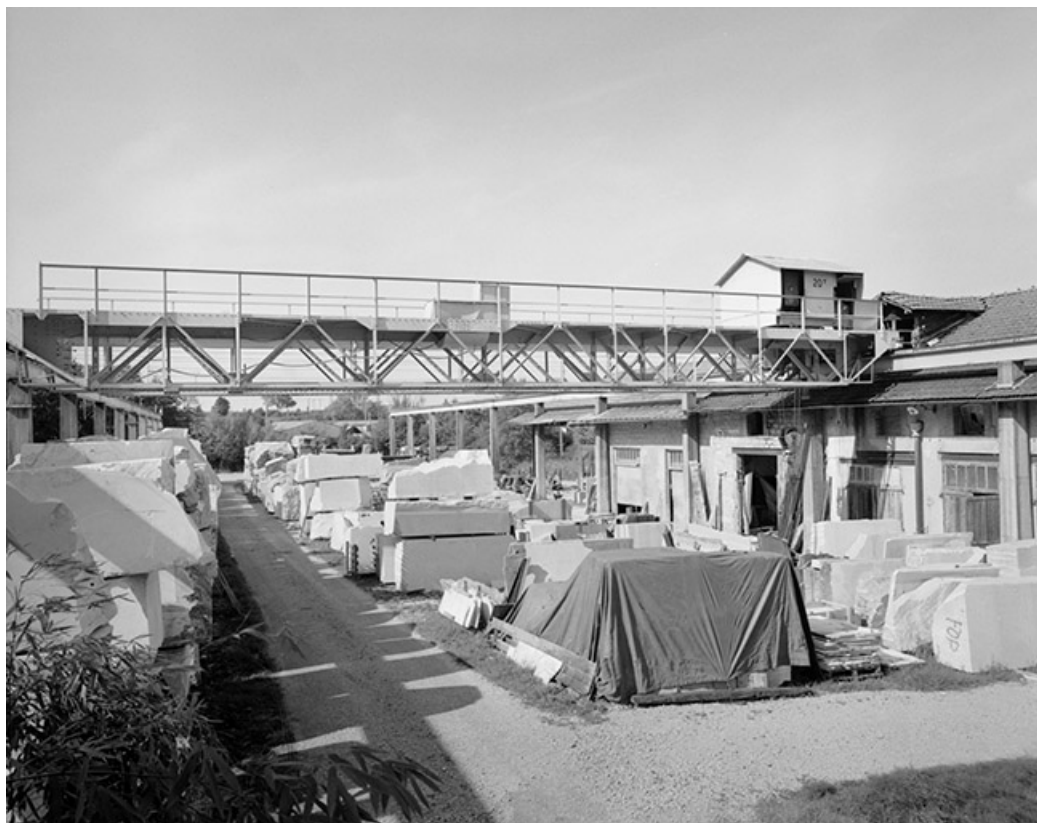
Atelier de fabrication et pont roulant. 39, Saint-Amour, 4, 6 rue des Sources