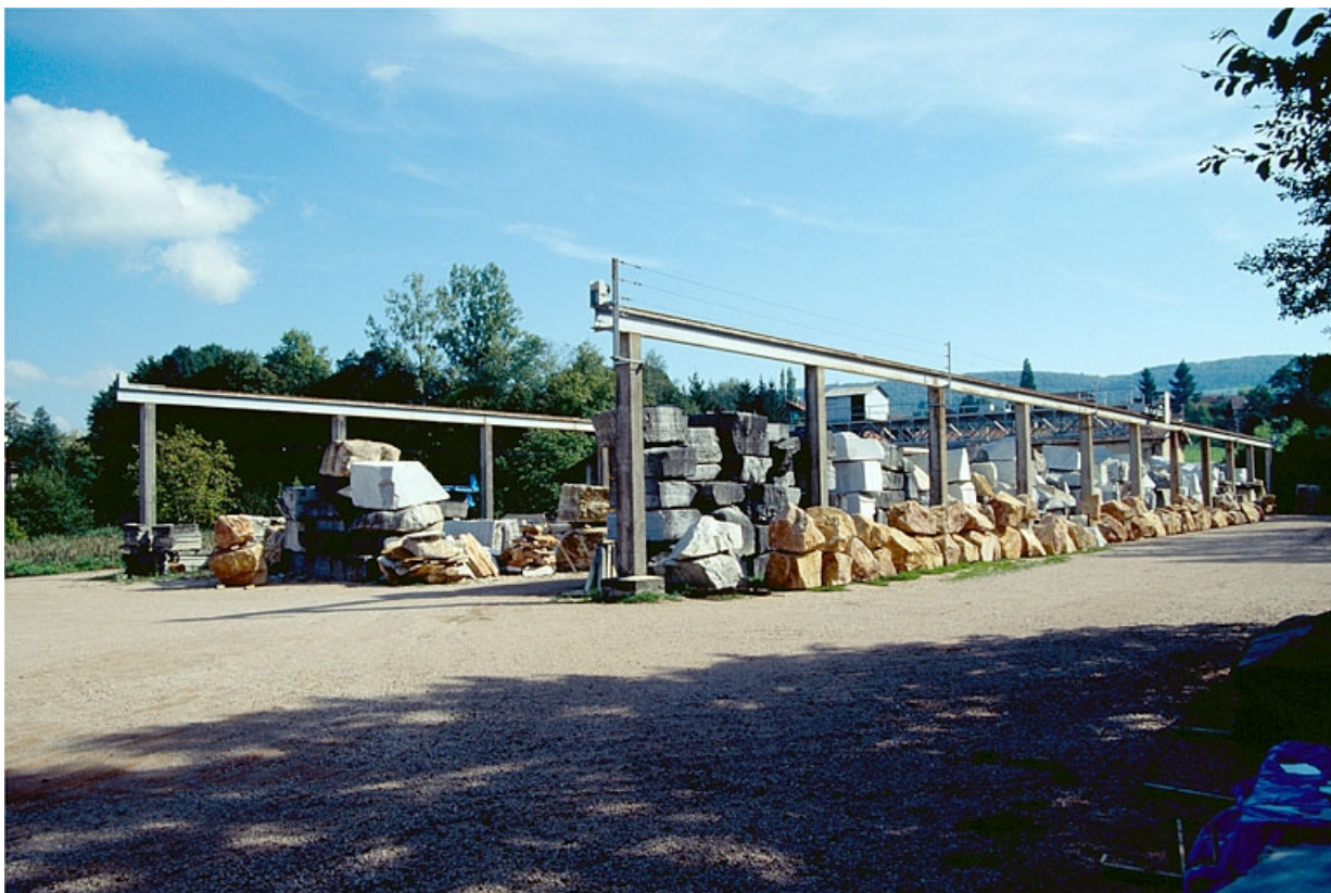
Pont roulant et aire des matières premières, vus de l'ouest.