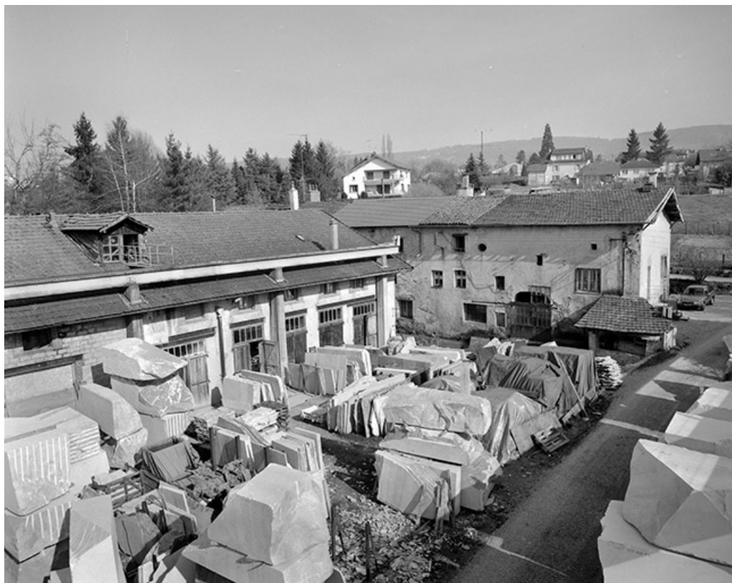
Atelier de fabrication, atelier de réparation et bureau, vus de l'ouest.