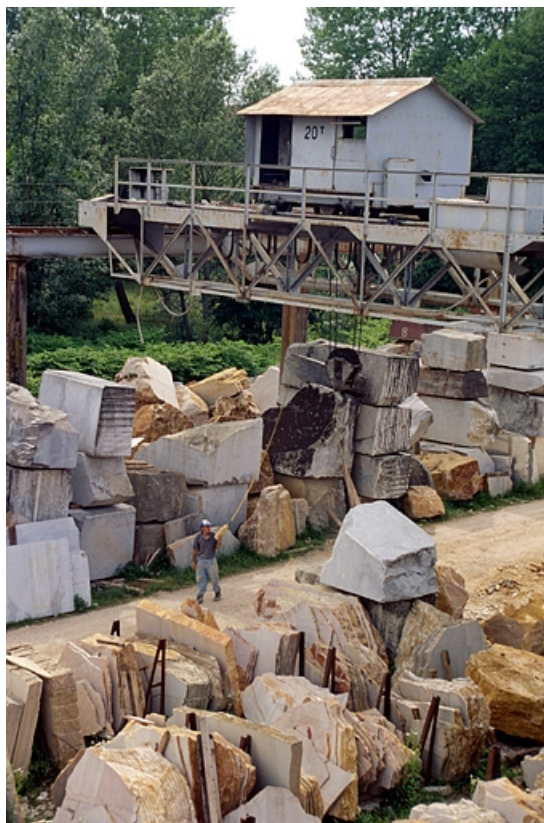
Pont roulant et ouvrier.