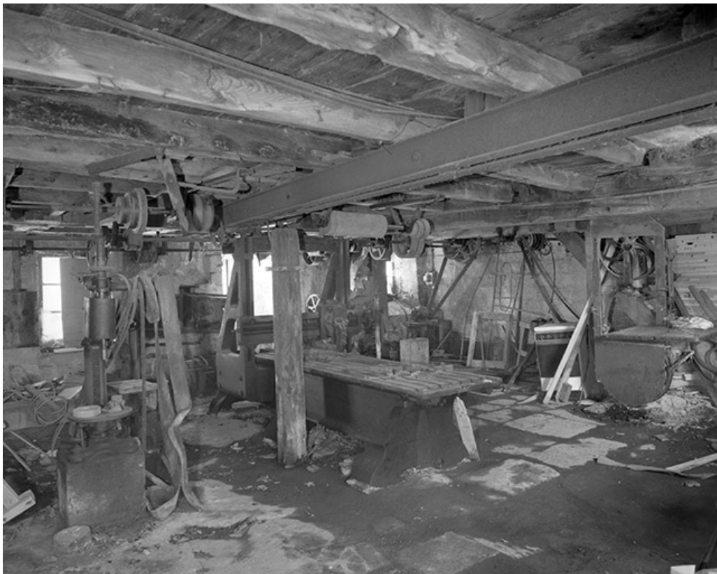
Intérieur de l'atelier de réparation.