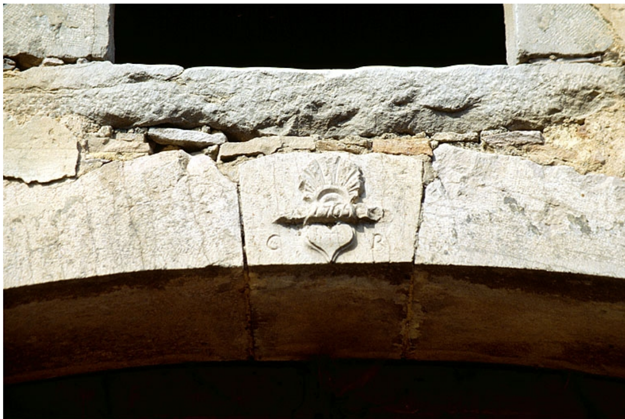
Bâtiment du bureau : clé de voûte sculptée.