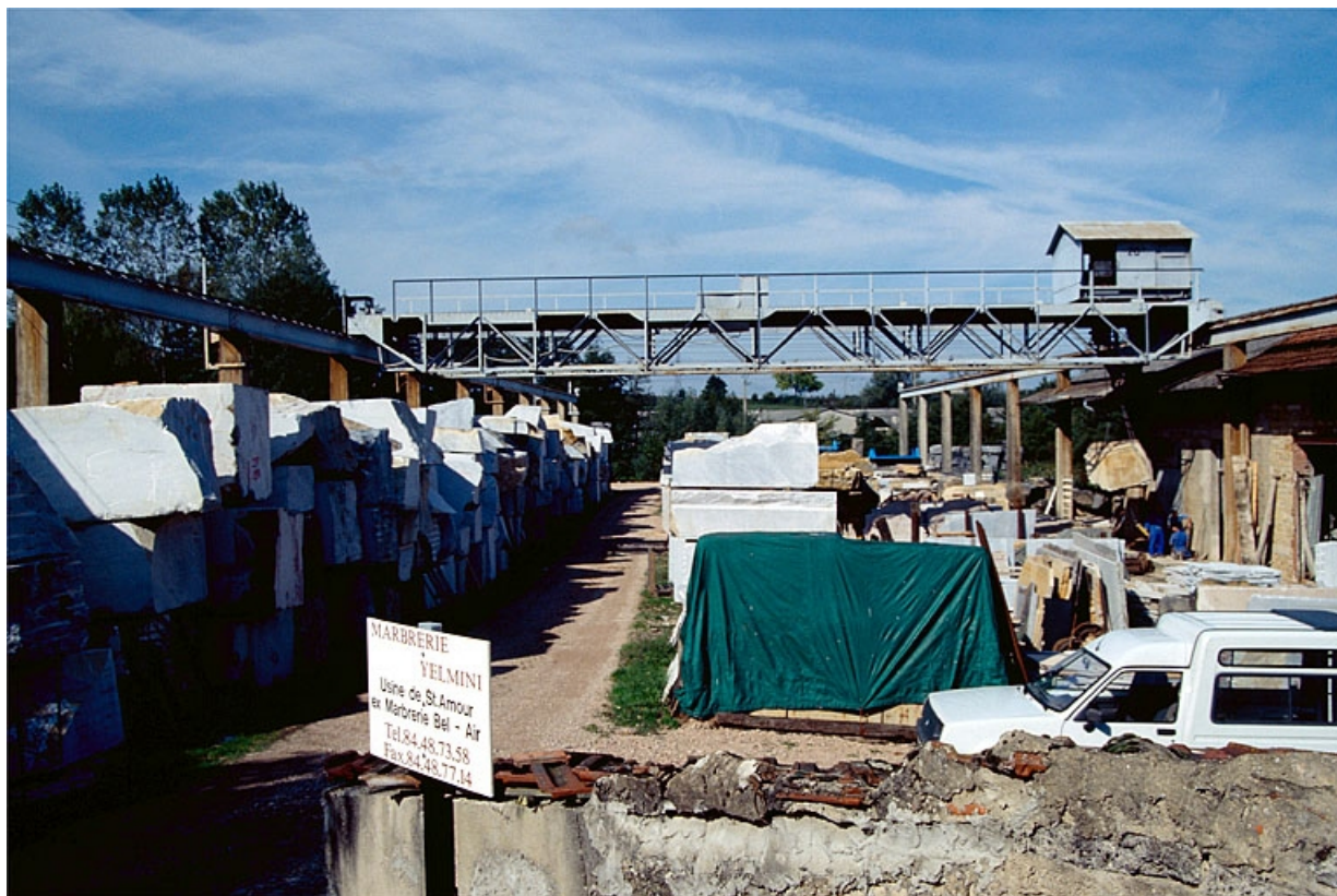
Pont roulant et aire des matières premières, vus depuis l'entrée à l'est.