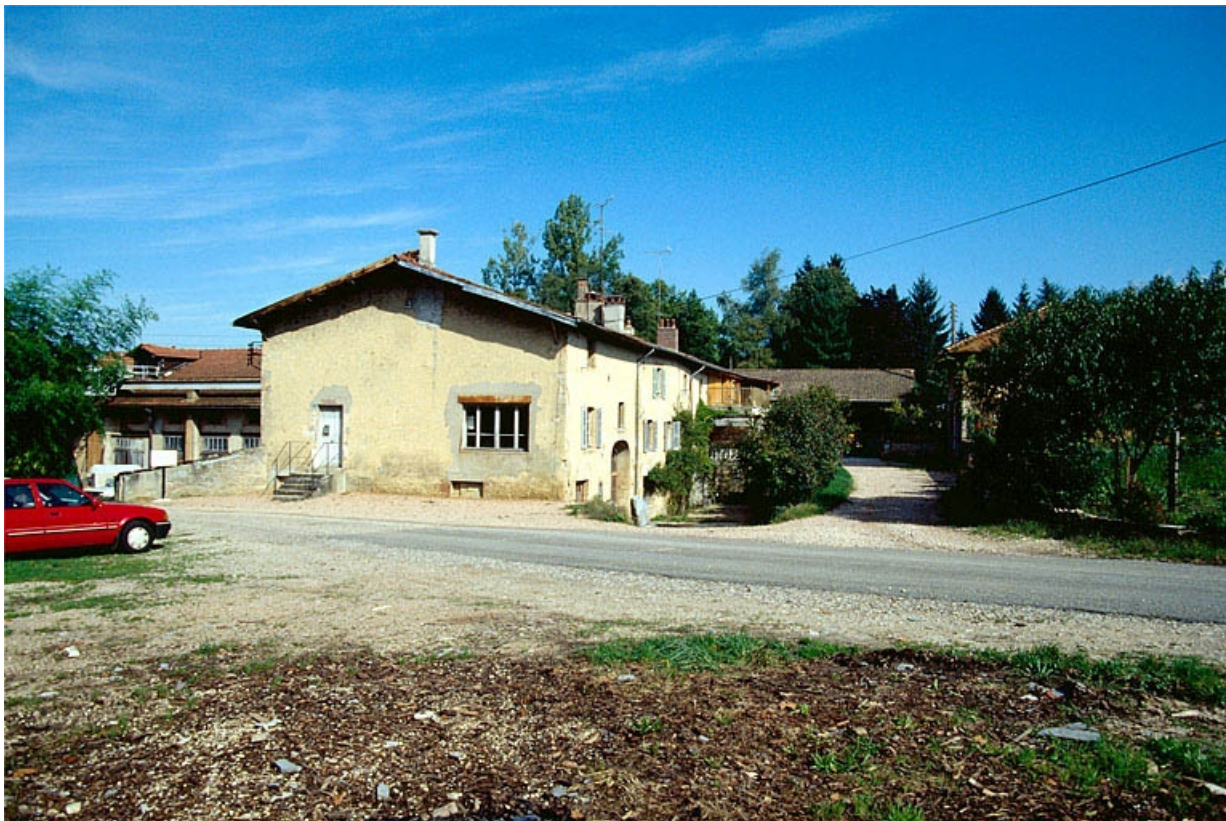
Bureau, atelier de réparation et logement.