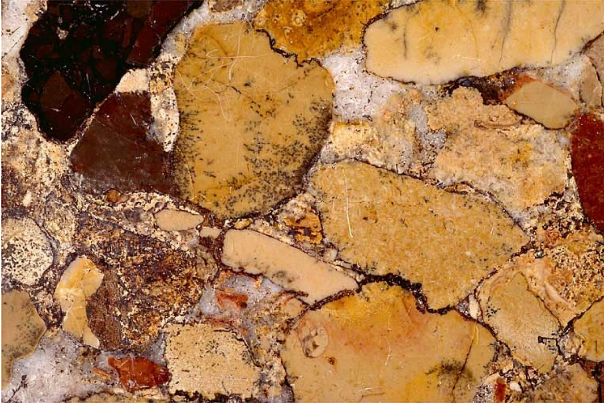
Echantillon de marbre de la Maladière (brèche).