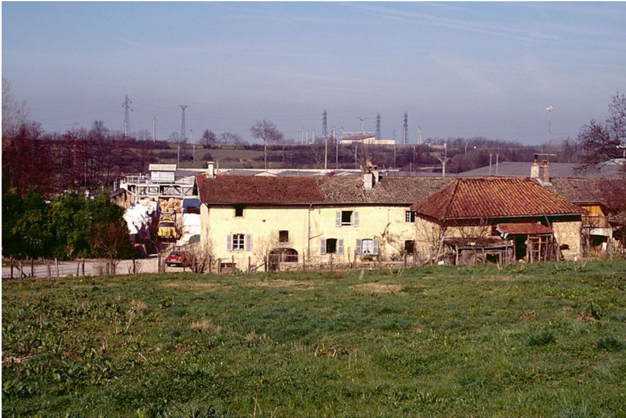
Bureau, atelier de réparation, logement et remise d'automobile, vus du sud-est.