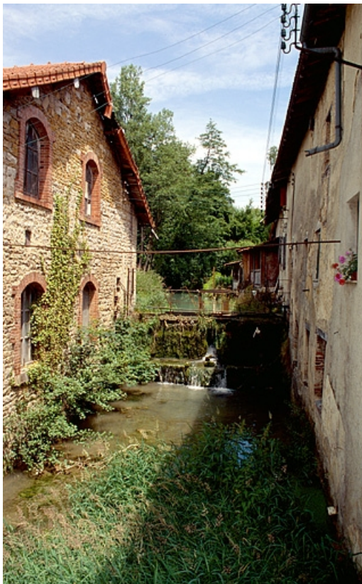
Canal vu d'aval, façade postérieure de l'atelier de réparation et façade latérale de l'atelier de fabrication. 39, Saint-Amour, 4, 6 rue des Sources