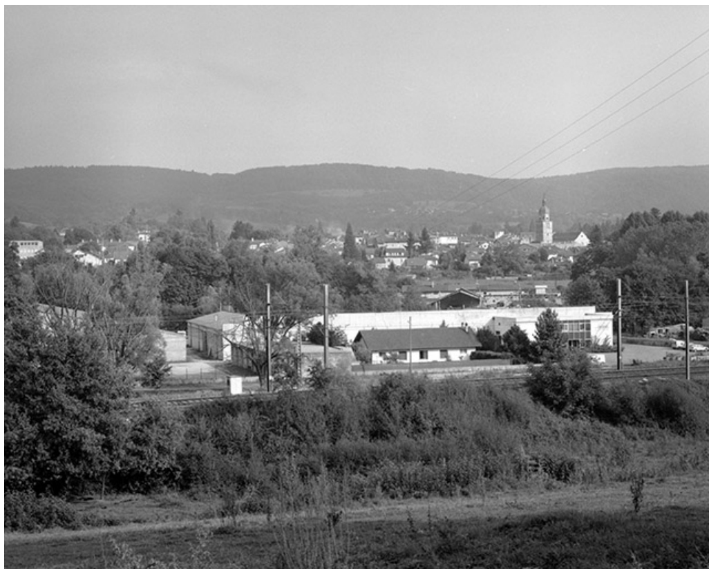
Vue d'ensemble du site depuis l'ouest.