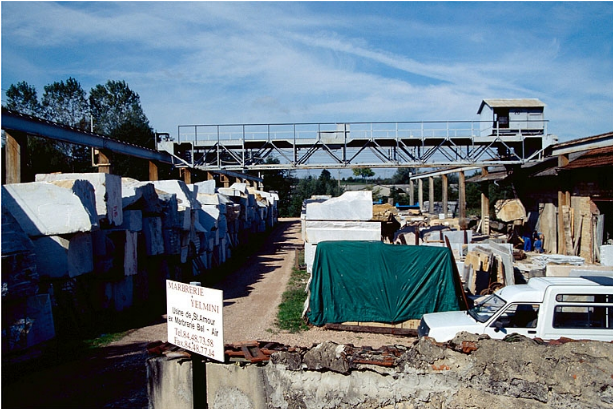
Pont roulant et aire des matières premières, vus depuis l'entrée à l'est.