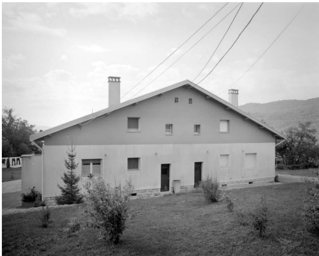
Maison d'agent de maîtrise : façade postérieure.