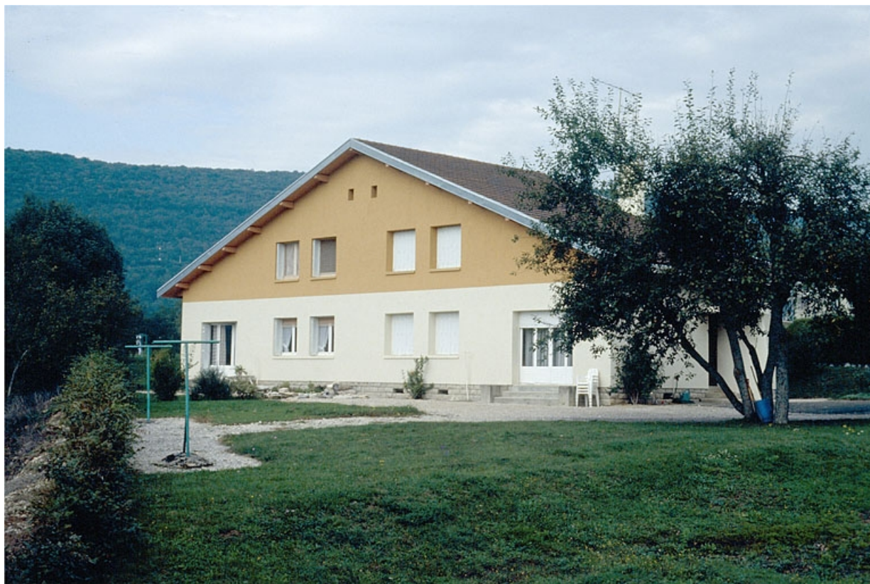
Maison d'agent de maîtrise : façade antérieure.