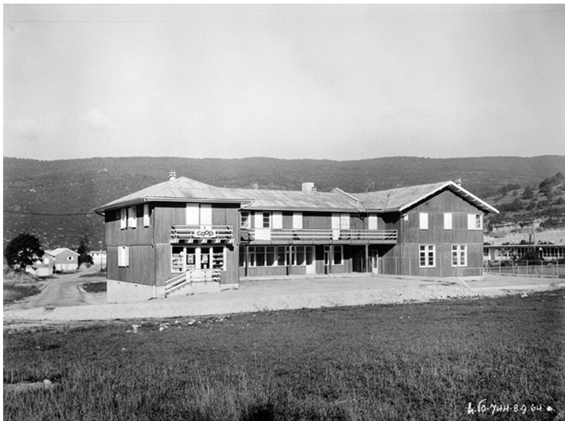
[Cité de Vouglans.] Centre commercial - Ecole - Vue générale.