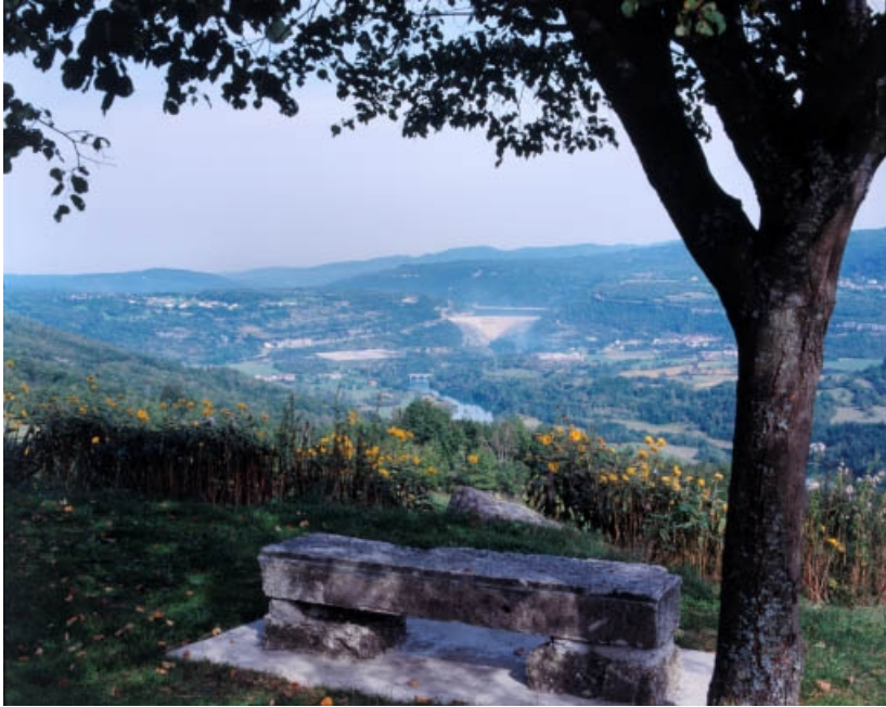
Vue d'ensemble de la vallée de l'Ain et du barrage, depuis le sud-ouest. 39, Cernon