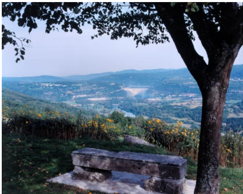
Vue d'ensemble de la vallée de l'Ain et du barrage, depuis le sud-ouest. 39, Cernon