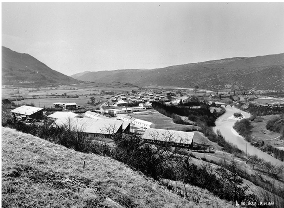
Cité de Vouglans [vue d'ensemble].