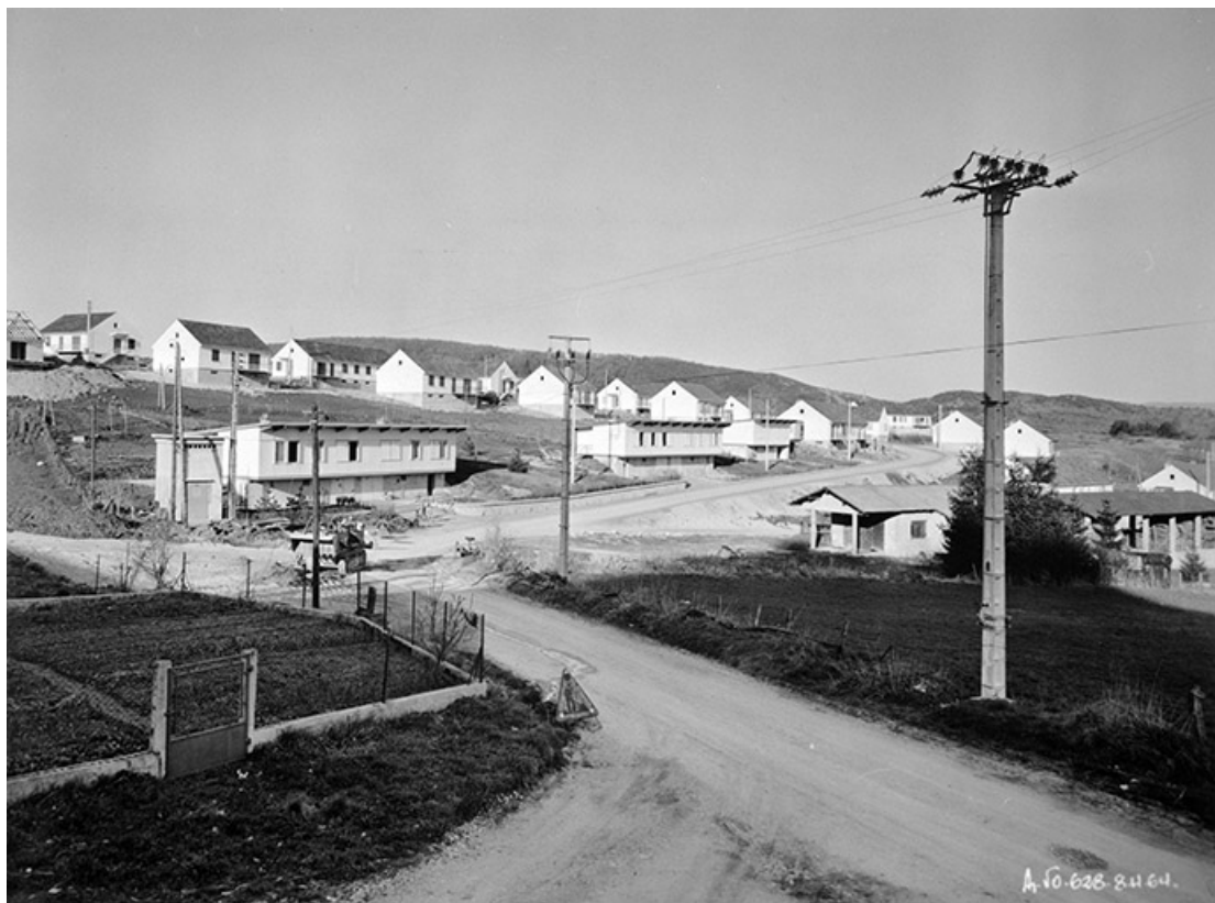
Cité du Closey à Orgelet. Vue générale.