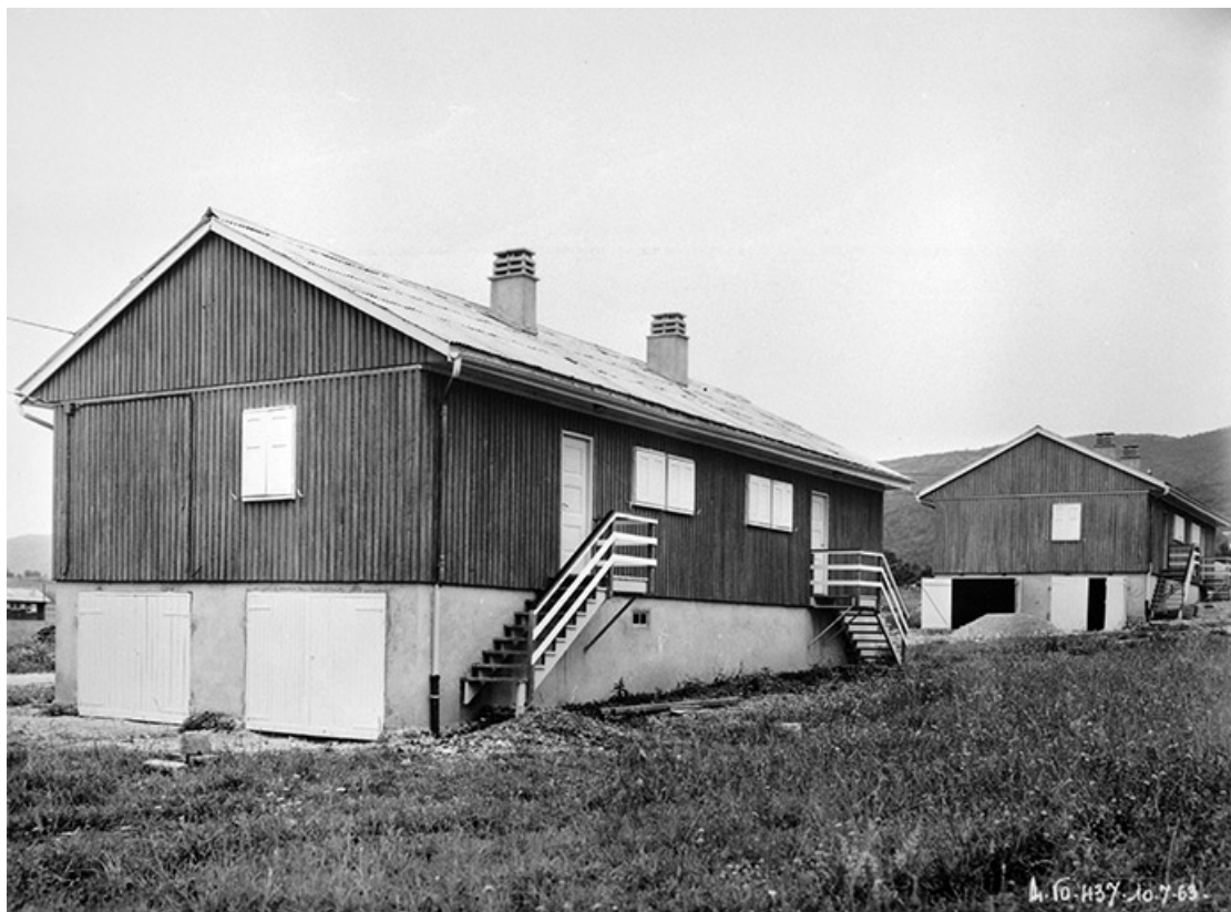
Cité de Vouglans. Logements R.B.M. 39, Cernon