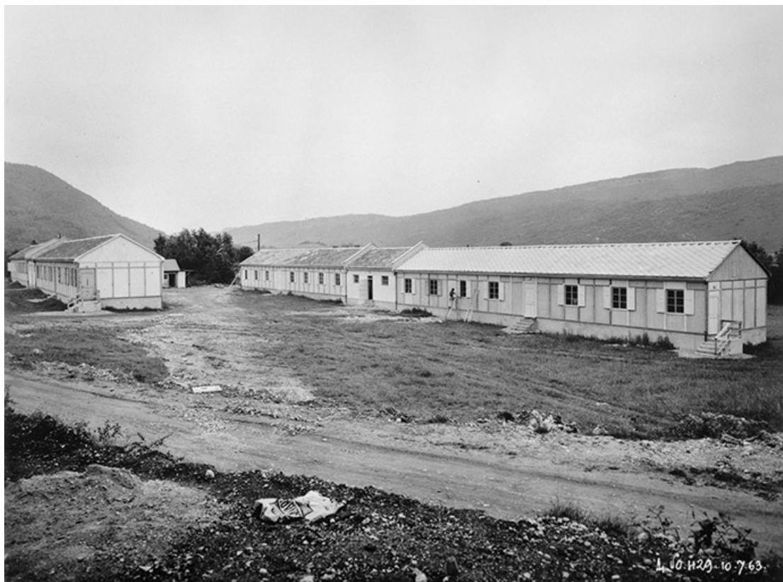
Cité de Vouglans. Dortoirs Lecorche. 39, Cernon