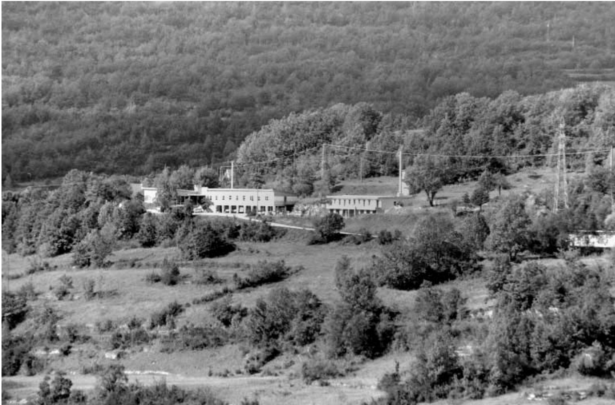
Vue d'ensemble de l'ancienne cantine et de l'ancien logement d'ouvriers. 39, Cernon