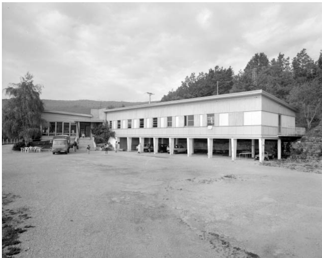
Ancienne cantine. Cantine-foyer à gauche, logement d'ouvriers à droite. 39, Cernon