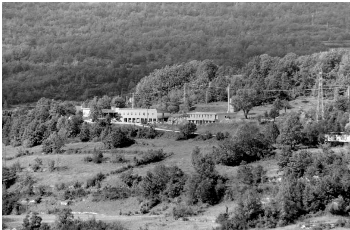
Vue d'ensemble de l'ancienne cantine et de l'ancien logement d'ouvriers. 39, Cernon