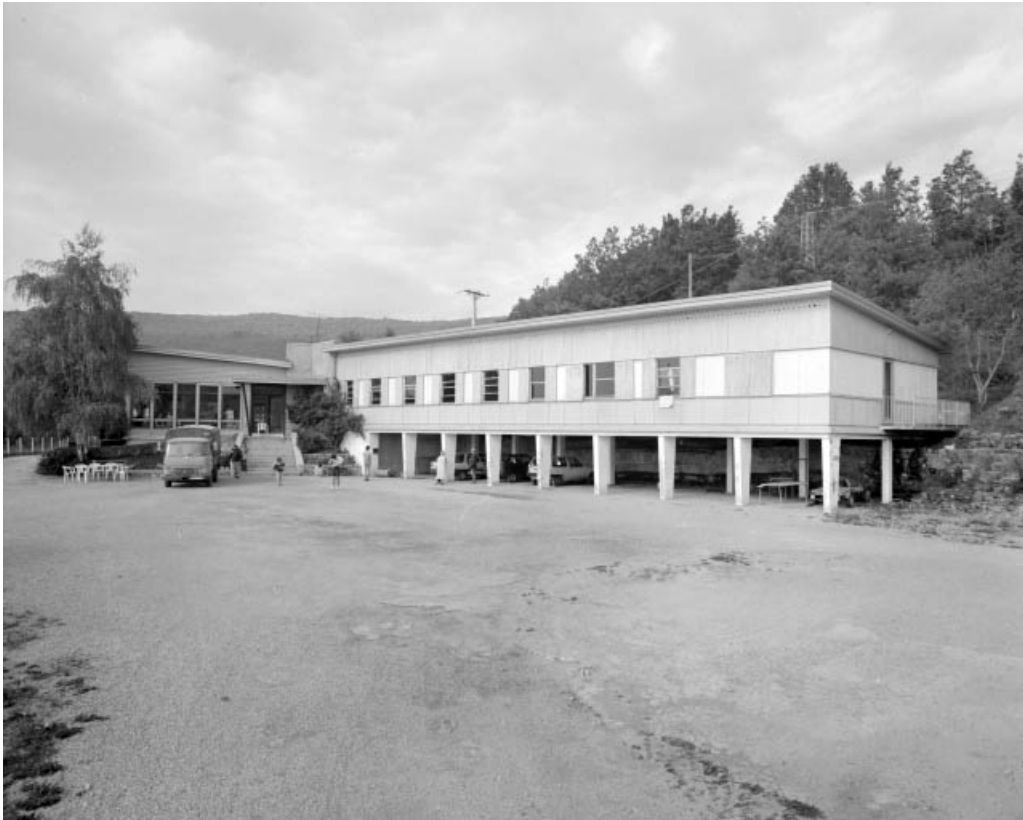
Ancienne cantine. Cantine-foyer à gauche, logement d'ouvriers à droite. 39, Cernon