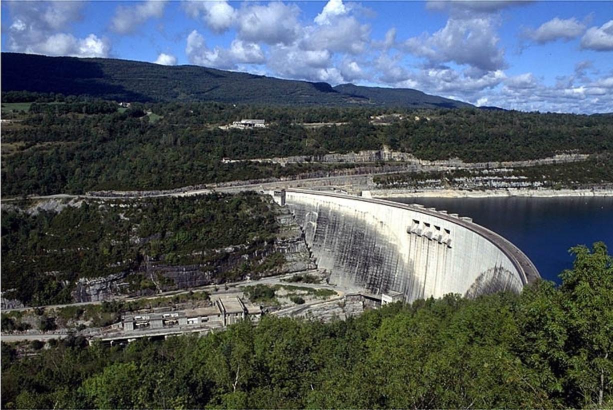
Vue d'ensemble du barrage et de sa centrale hydroélectrique.