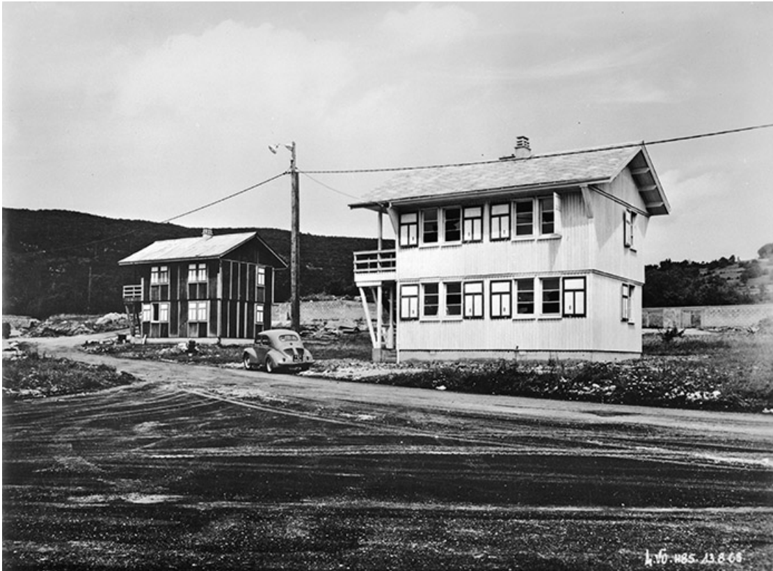
Cité de Vouglans. 2 chalets. 39, Cernon