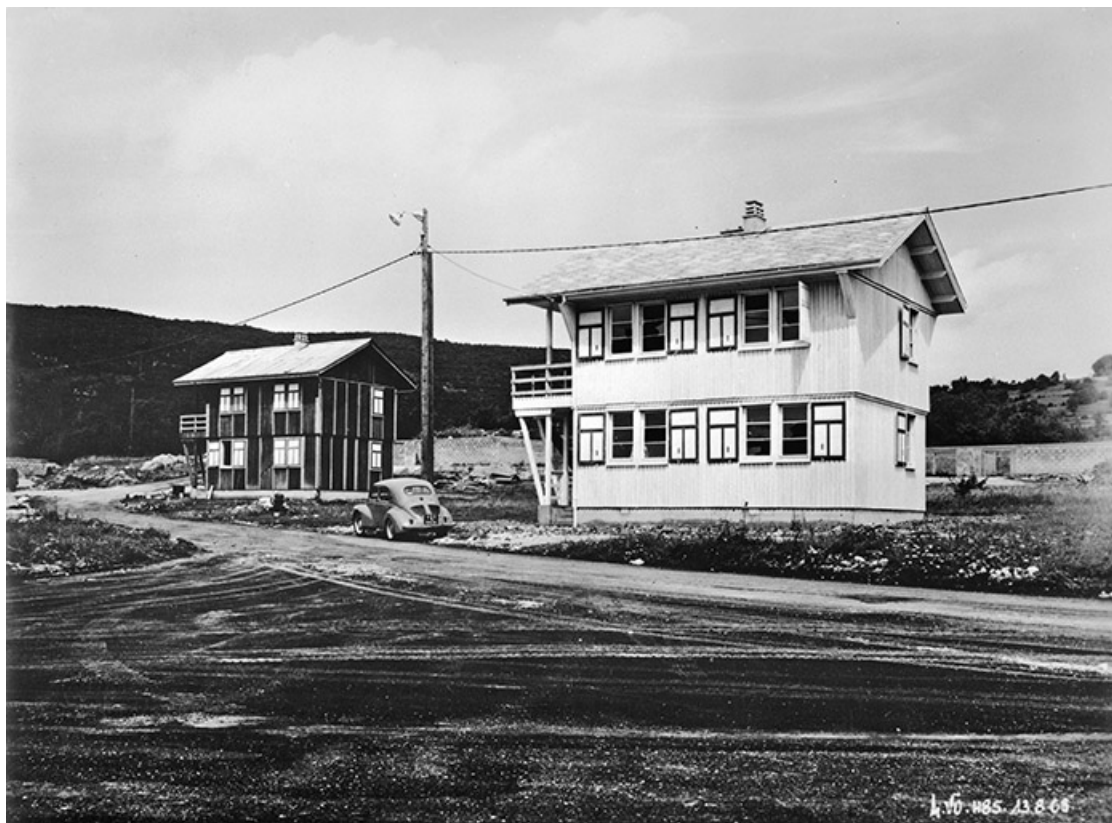
Cité de Vouglans. 2 châlets.