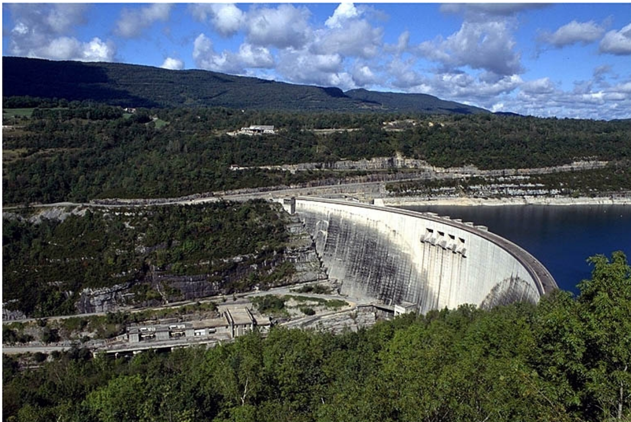
Vue d'ensemble du barrage et de sa centrale hydroélectrique. 39, Cernon