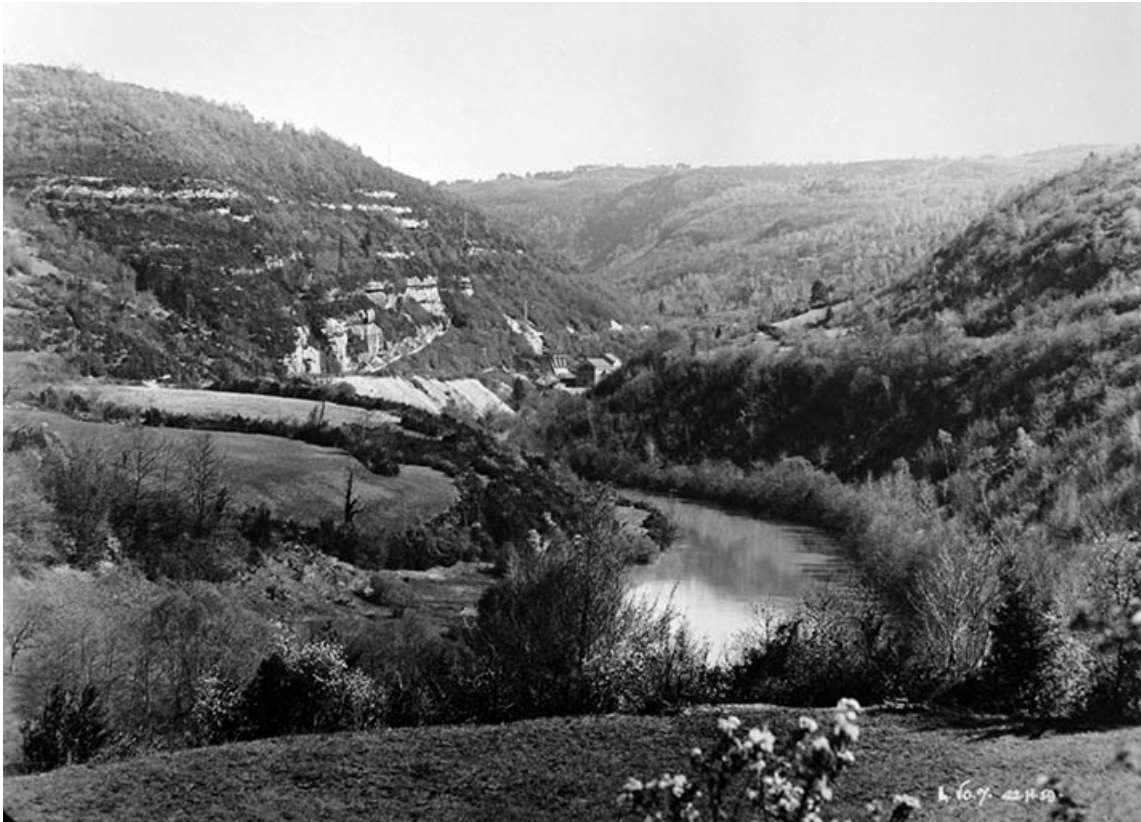
Verrou vu de l'aval [vue d'ensemble du site].