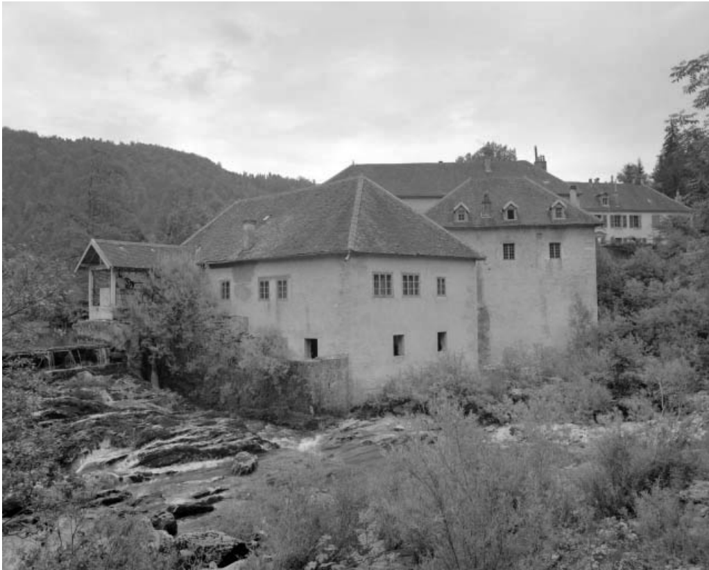
Scierie, vue depuis l'ouest.