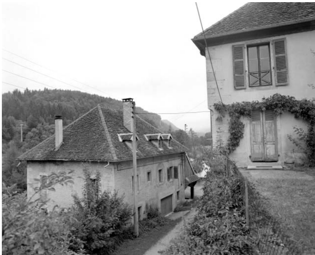
Moulin : façades antérieure et latérale droite.