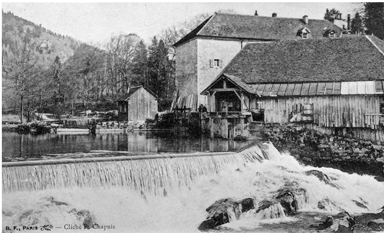
Environs de Champagnole - L'Ain au barrage de Syam.