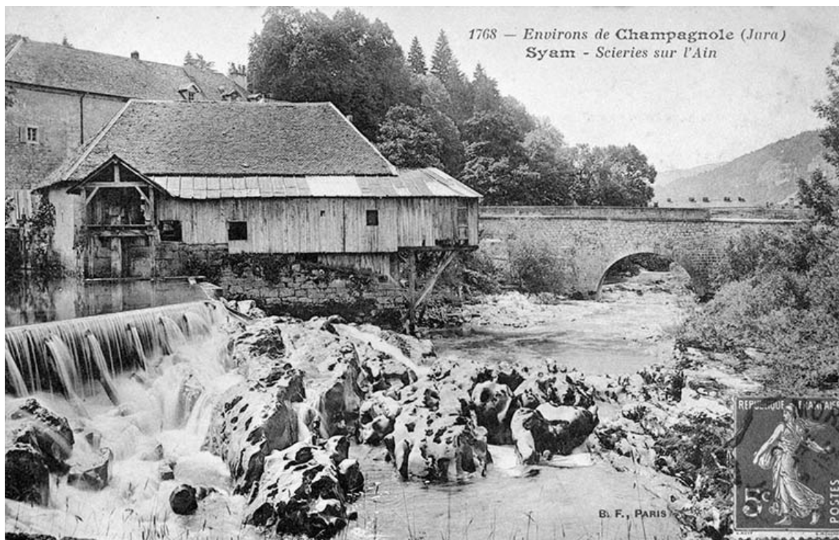
Environs de Champagnole (Jura). Syam - Scieries sur l'Ain.