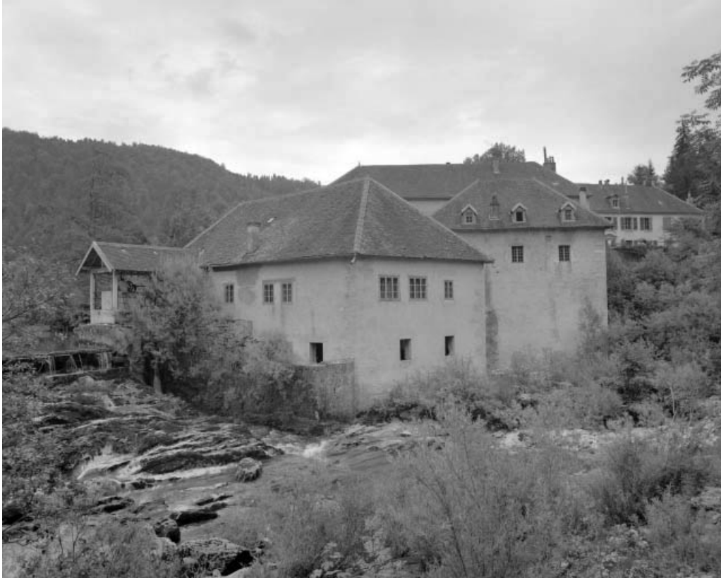
Scierie, vue depuis l'ouest.