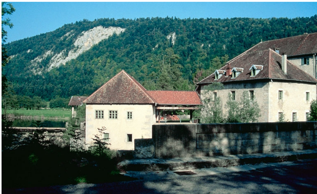
Vue d'ensemble depuis le pont, à l'ouest.