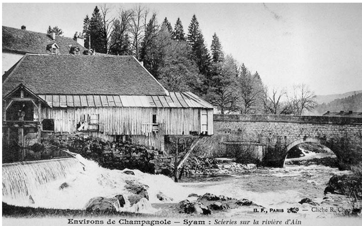
Environs de Champagnole - Syam : Scieries sur la rivière d'Ain.