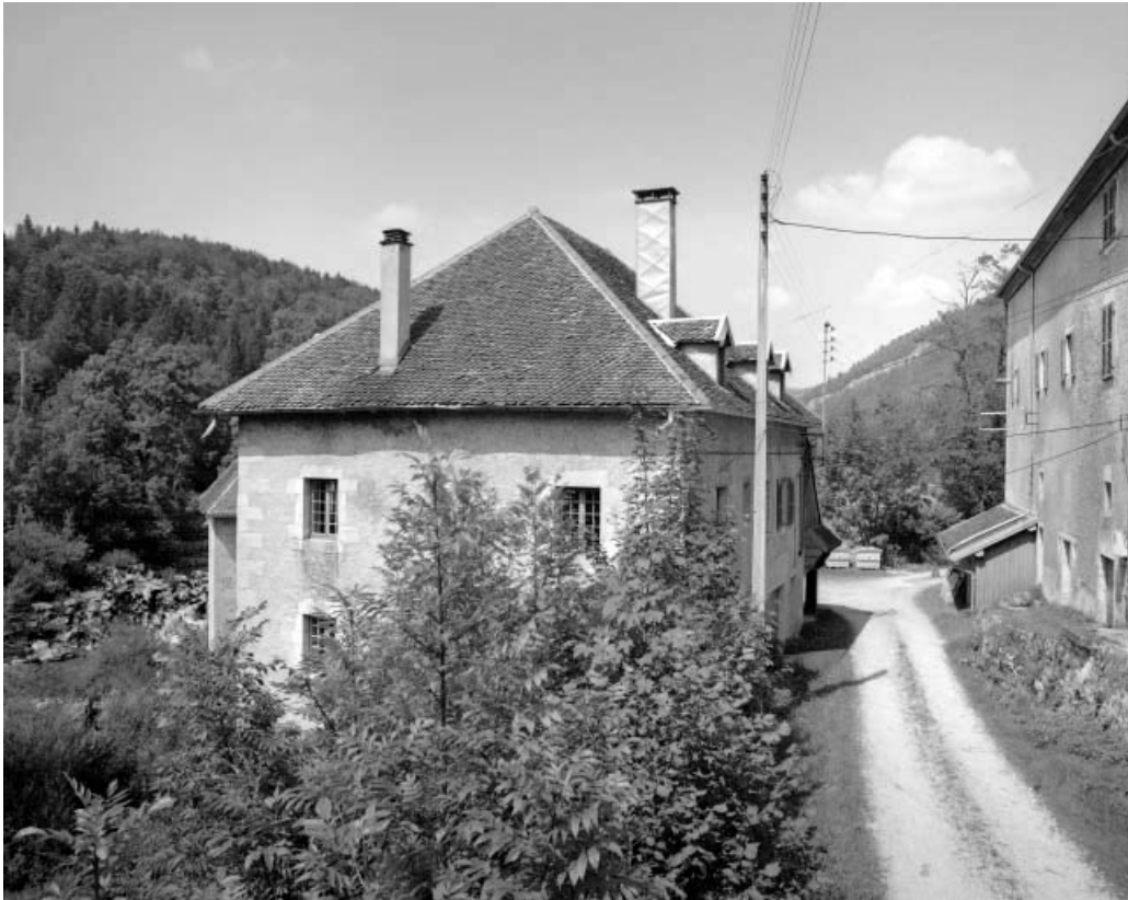
Moulin : façade antérieure. 39, Syam, lieudit : les Forges