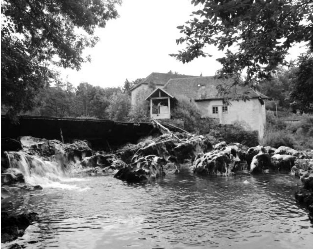
Barrage et scierie depuis le nord-ouest.