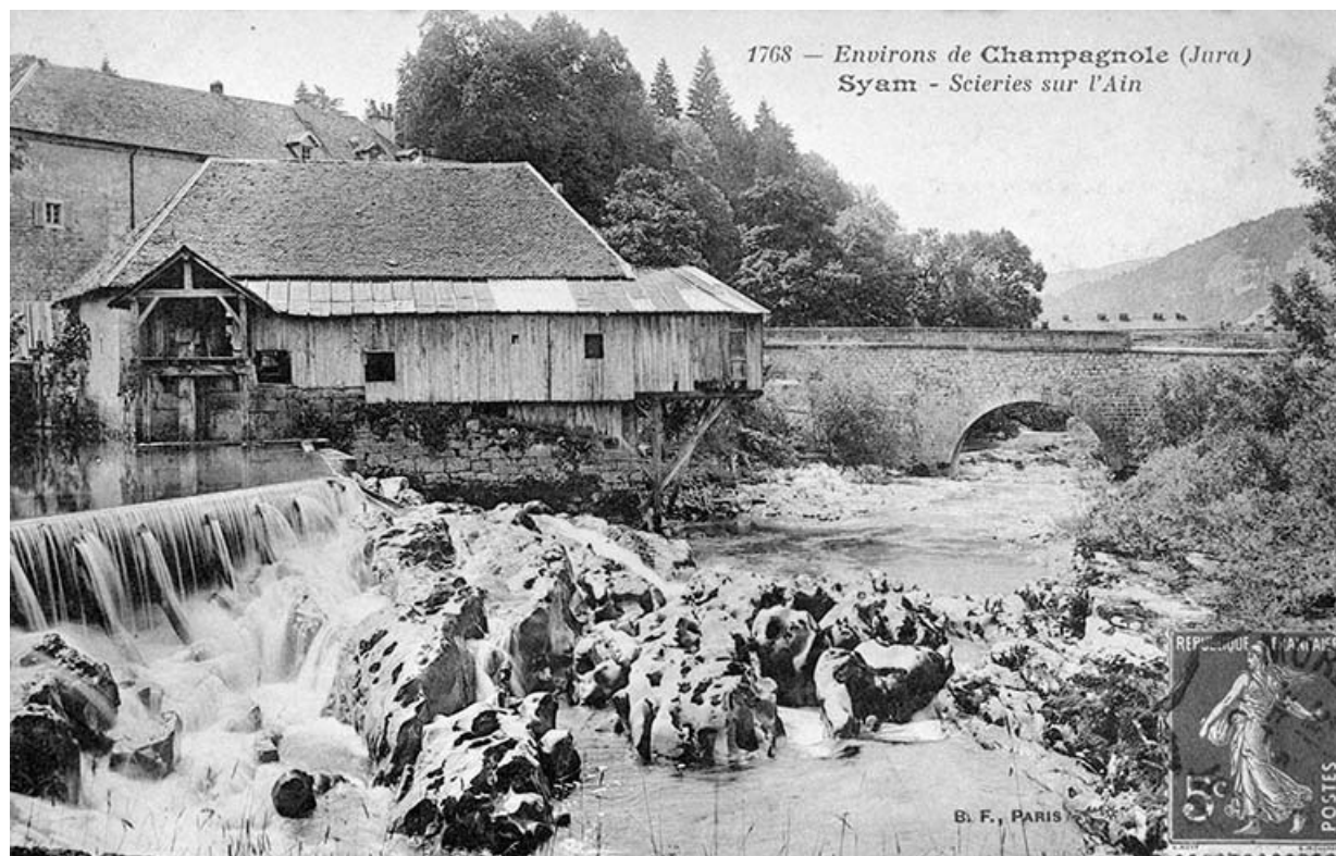
Environs de Champagnole (Jura). Syam - Scieries sur l'Ain.