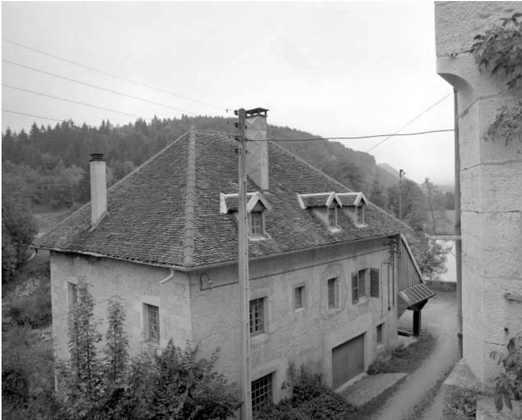
Moulin : façades antérieure et latérale droite, vues en plongée.