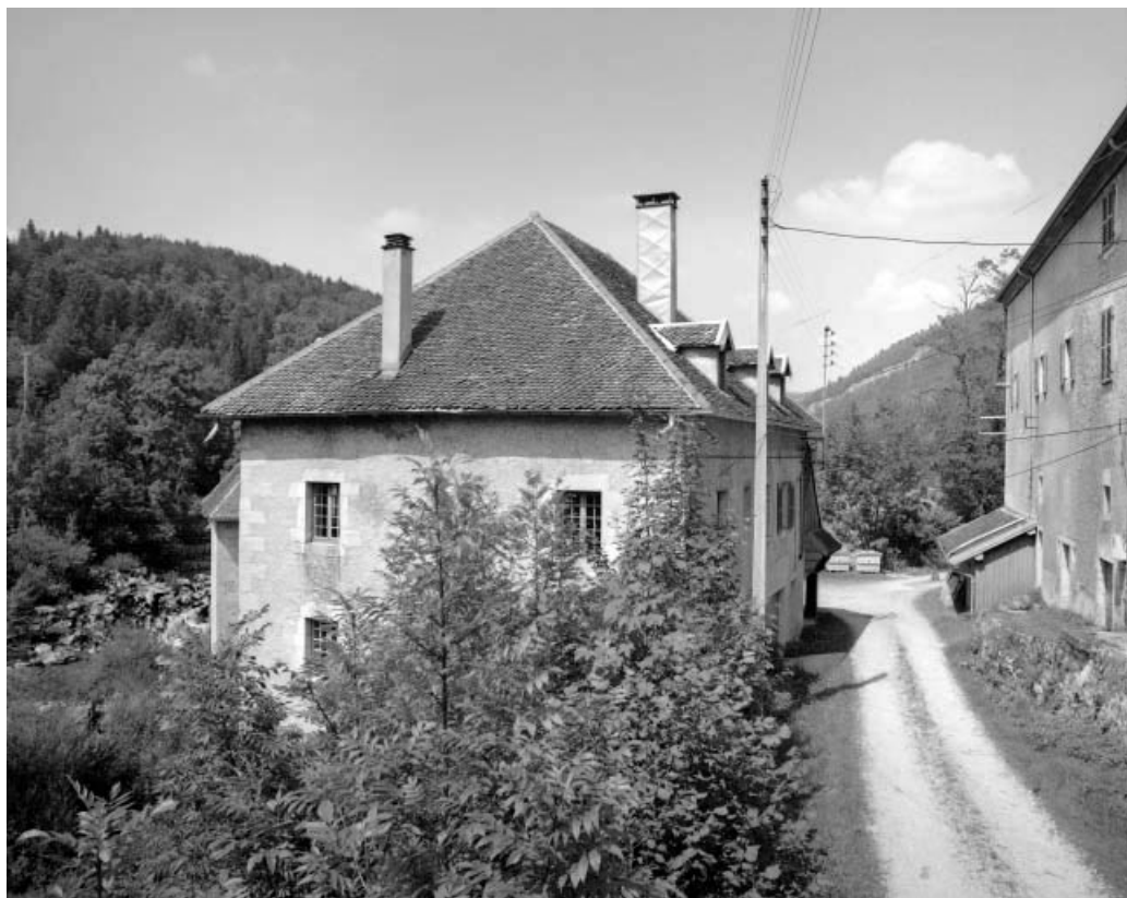
Moulin : façade antérieure. 39, Syam, lieudit : les Forges