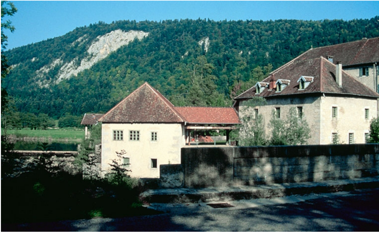
Vue d'ensemble depuis le pont, à l'ouest.