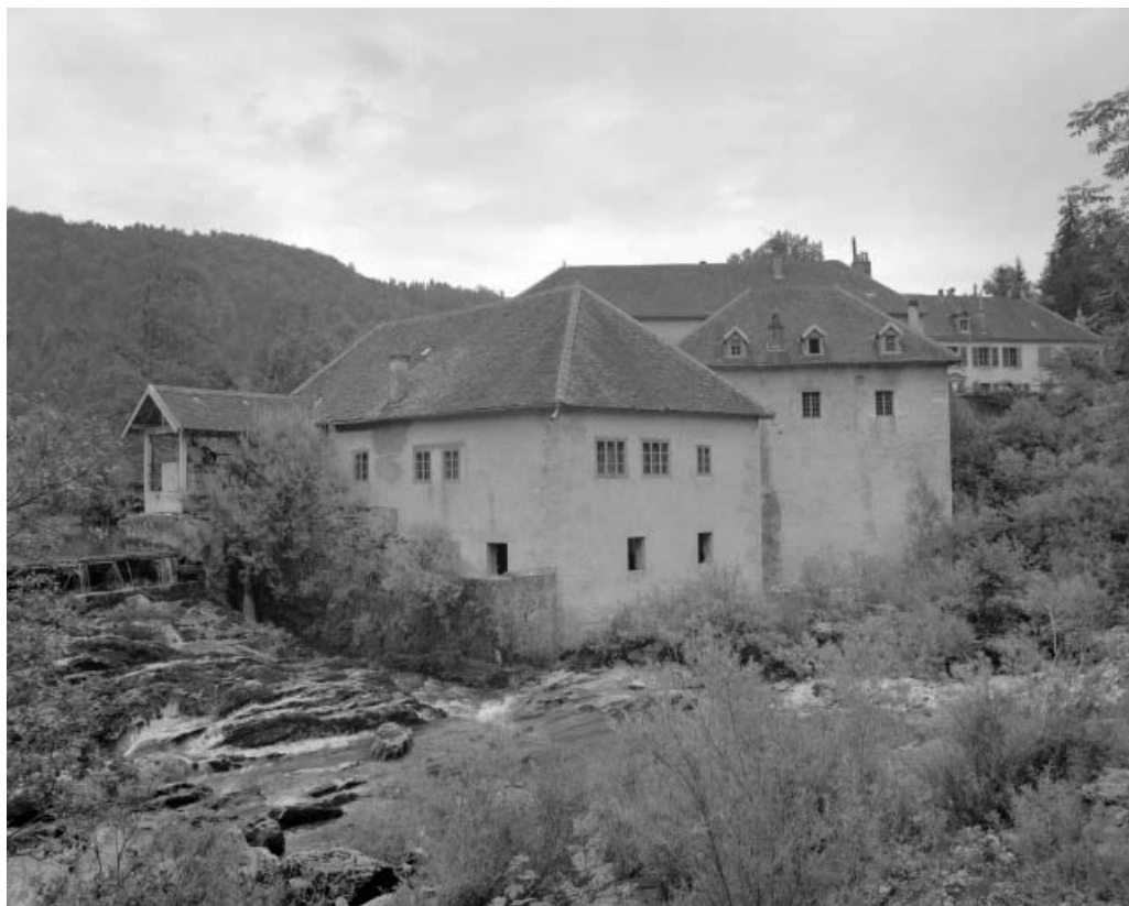
Scierie, vue depuis l'ouest.