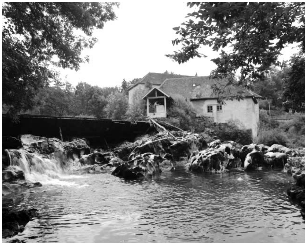
Barrage et scierie depuis le nord-ouest.