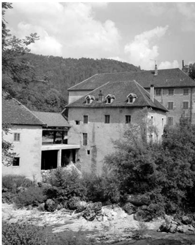
Moulin : façade latérale gauche.