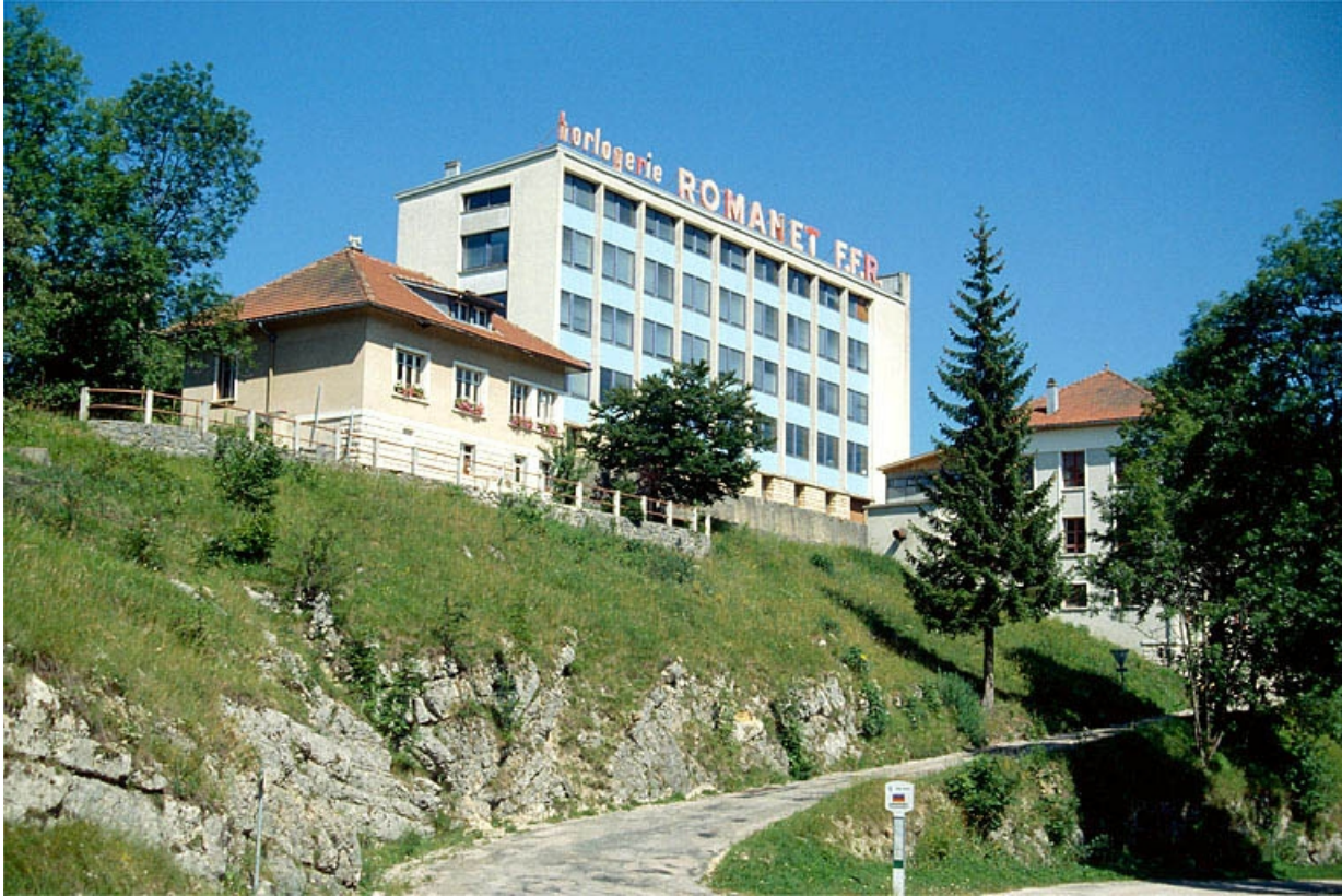
Vue d'ensemble depuis l'ouest.