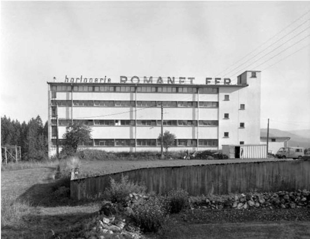
Façade postérieure du bâtiment de 1961.

39, Morbier, 4 chemin du Caton, lieudit : la Combe Froide