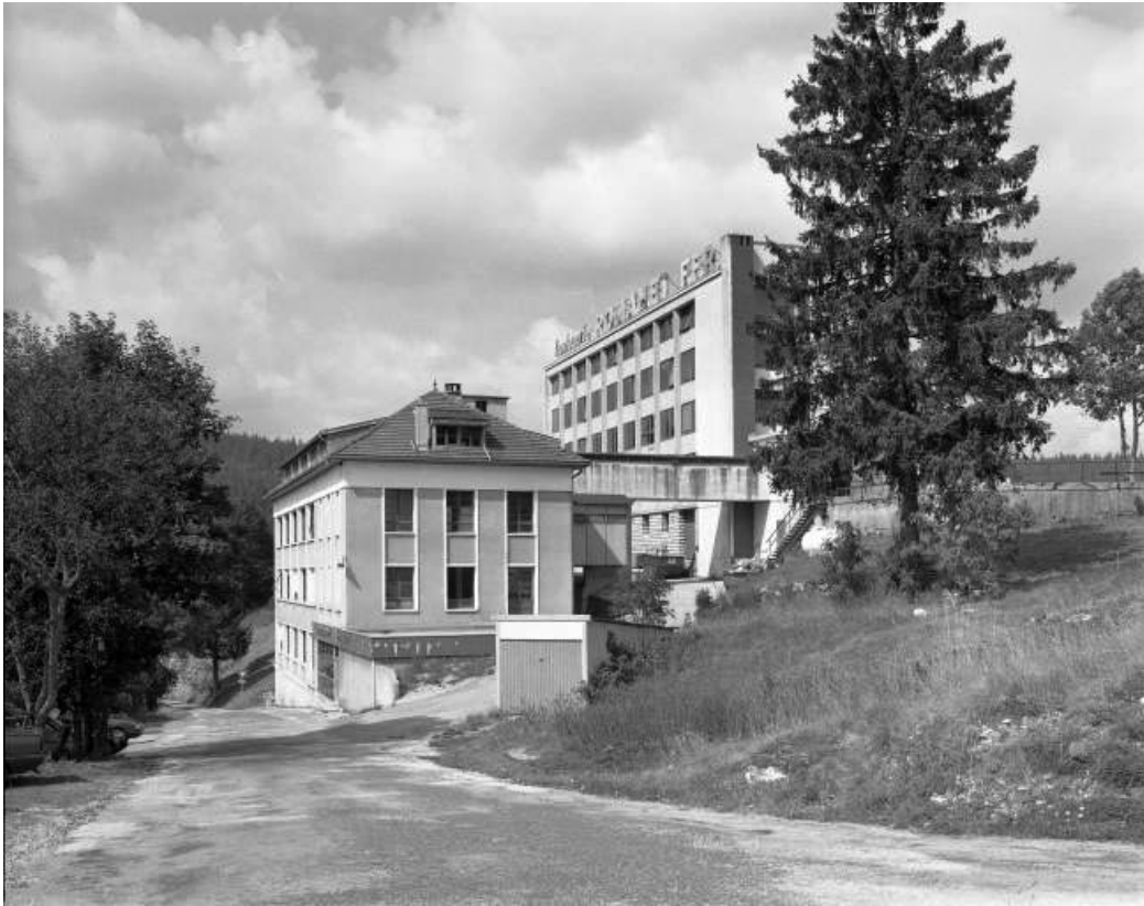
Façade latérale droite des bâtiments.

39, Morbier, 4 chemin du Caton, lieudit : la Combe Froide