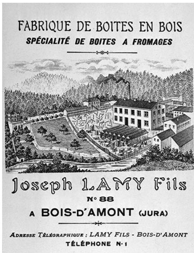
Vue cavalière de l'usine.