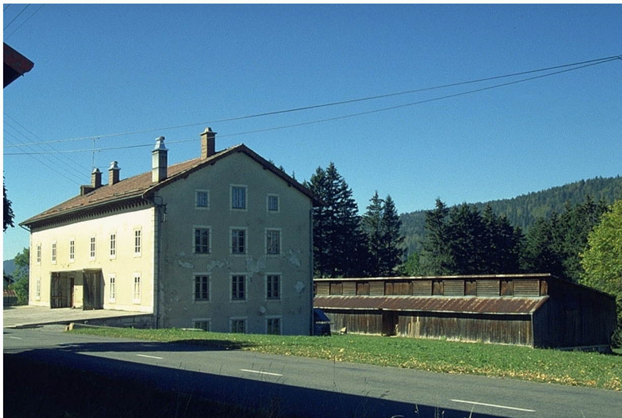
Atelier de fabrication et séchoir.