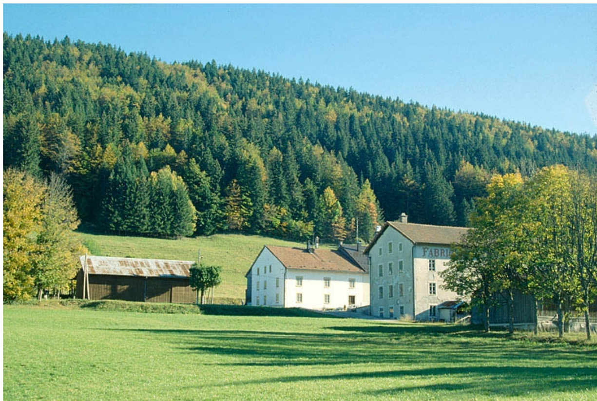
Vue d'ensemble depuis le nord.