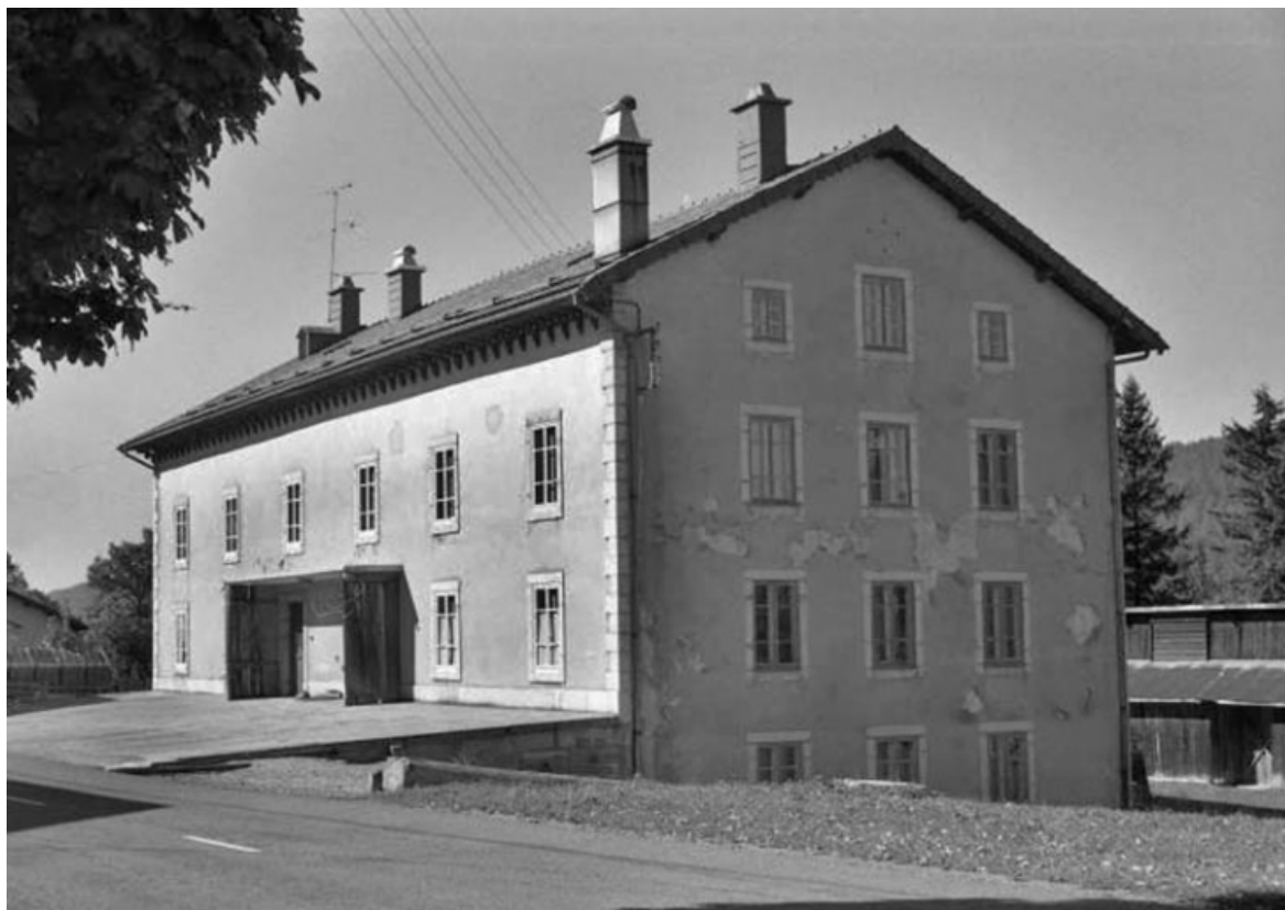
Atelier de fabrication, de trois quarts droite.