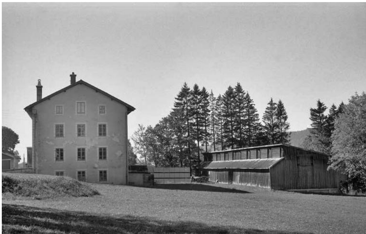
Façade latérale droite de l'atelier de fabrication et du séchoir.