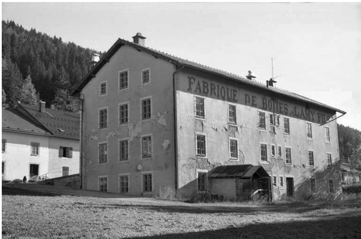
Façades postérieure et latérale droite de l'atelier de fabrication.