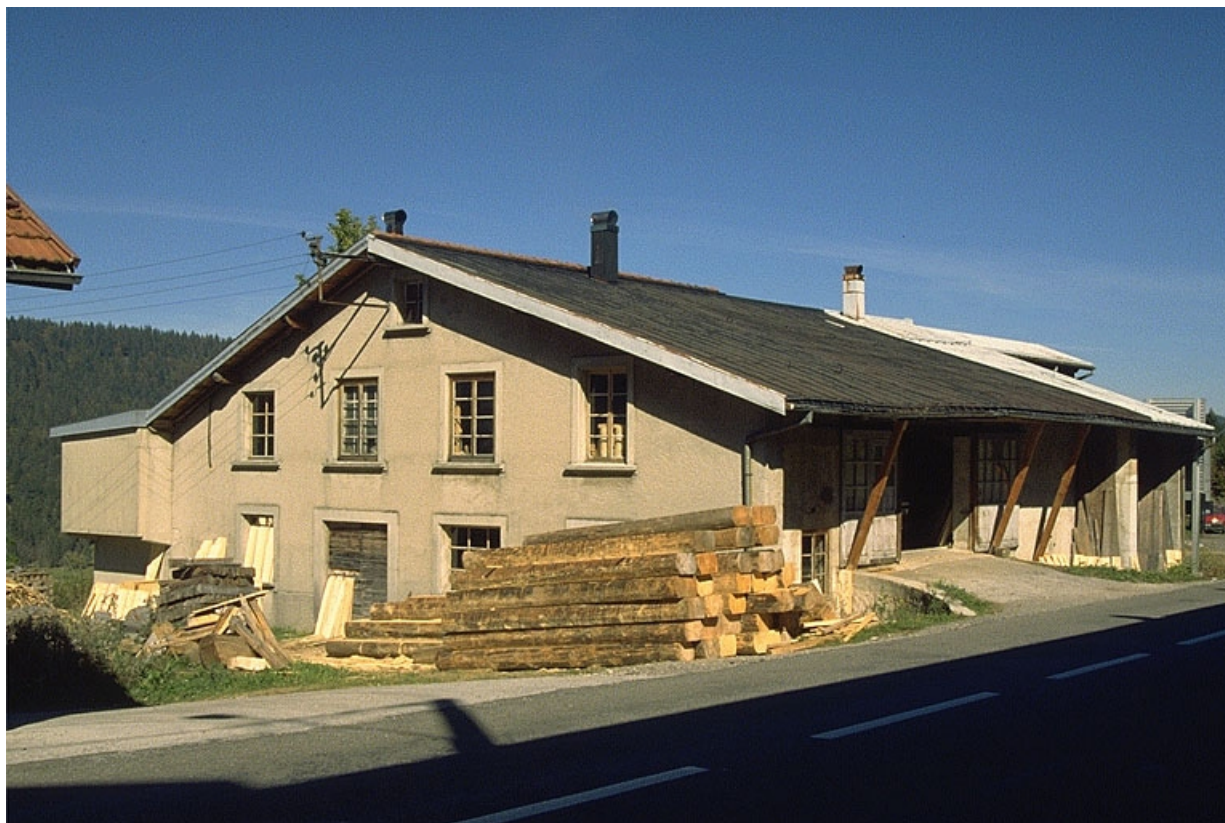
Scierie vue de trois quarts gauche.