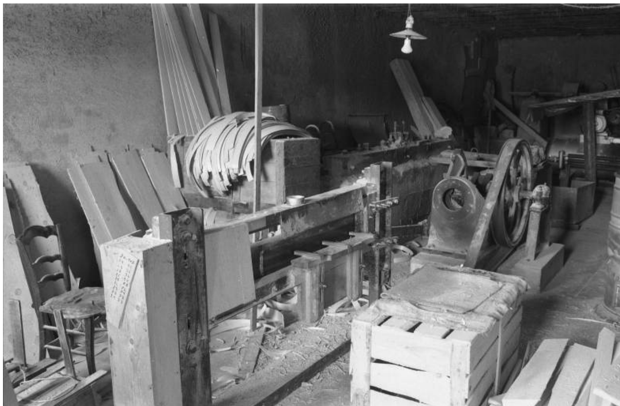
Vue d'ensemble de la targeuse, du côté d'application du bois. Rabot à gauche, système moteur à droite. 39, Bois-d'Amont Grande Route 233