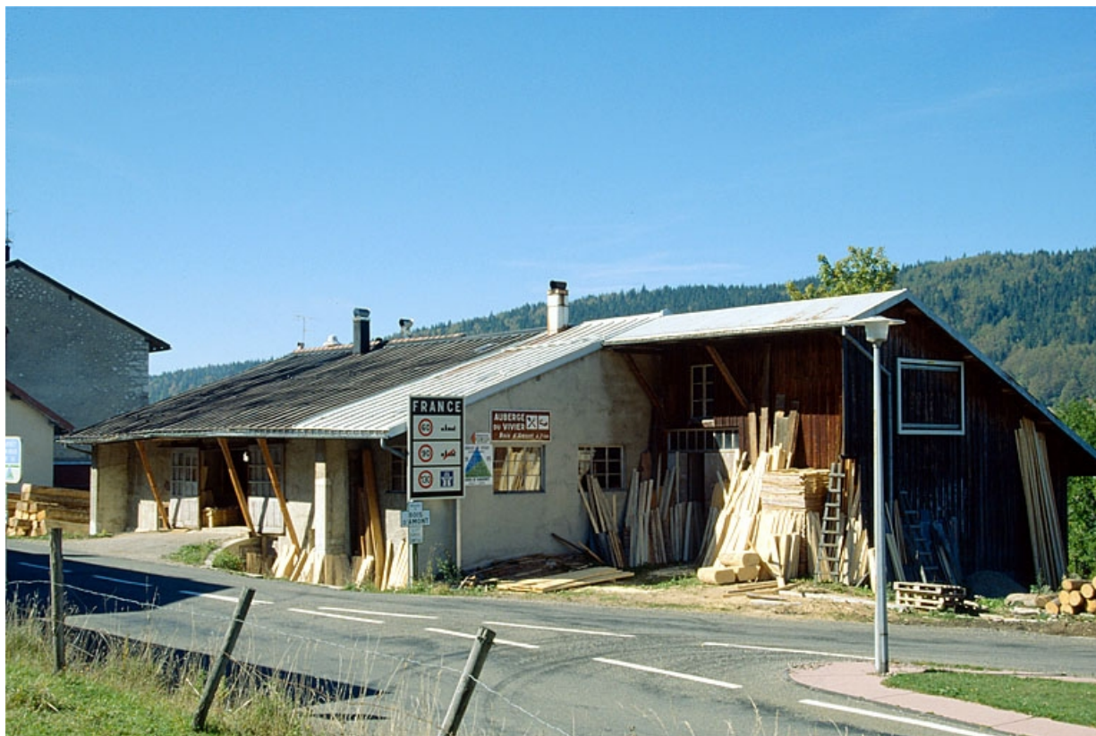
Scierie vue de trois quarts droite.