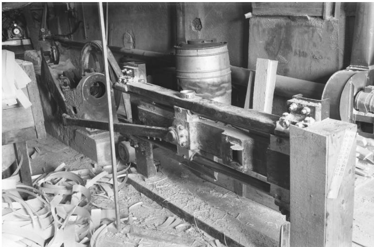
Vue d'ensemble de la targeuse, du côté de sortie des lanières de bois. Système moteur à gauche, rabot à droite. 39, Bois-d'Amont Grande Route 233