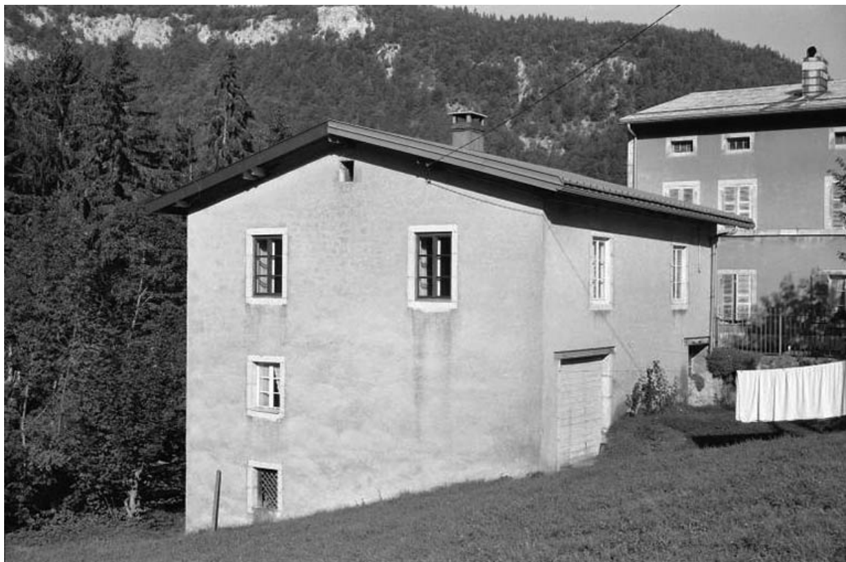
Ancien atelier de fabrication et bureau.