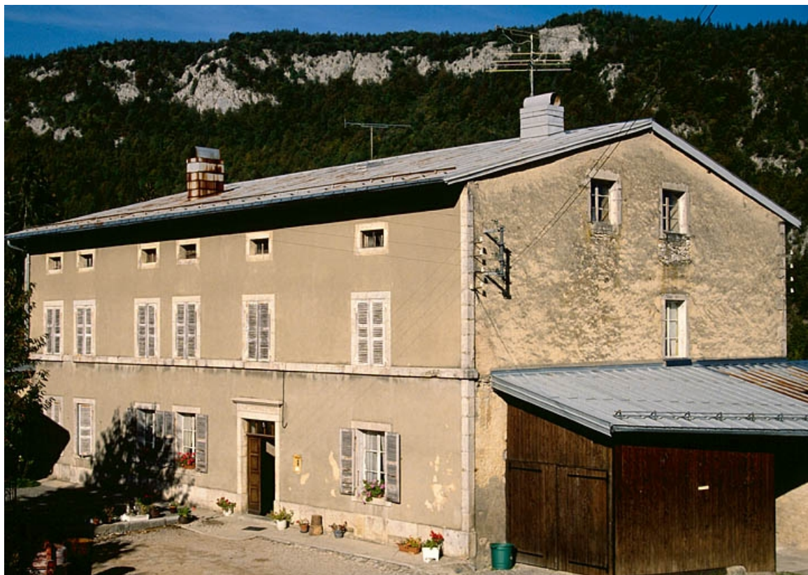
Façade antérieure de trois quarts droite.