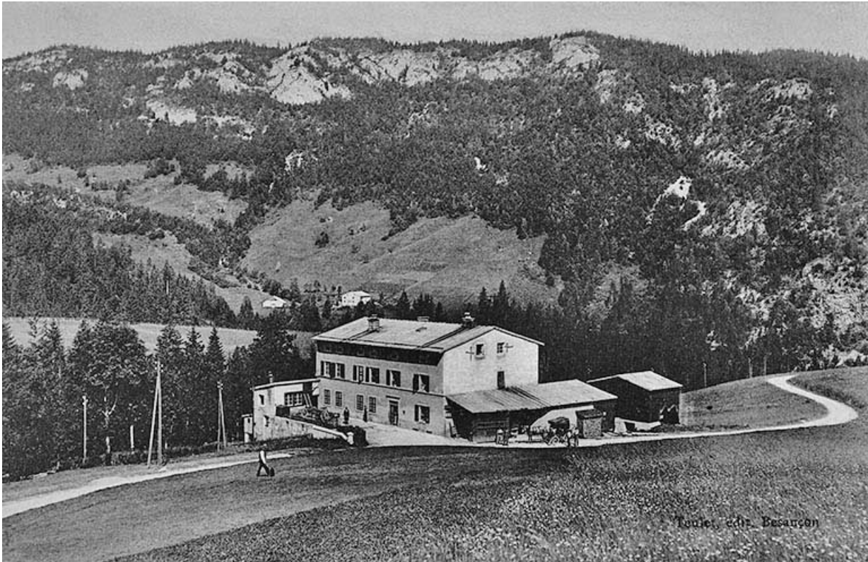
[Vue d'ensemble depuis l'est]. 39, Prémamanon, lieudit : les Rivières

Carte postale, s.d. [1er quart 20e siècle, entre 1903 et 1910]. Teulet éd., Besançon. Lieu de conservation : collection particulière