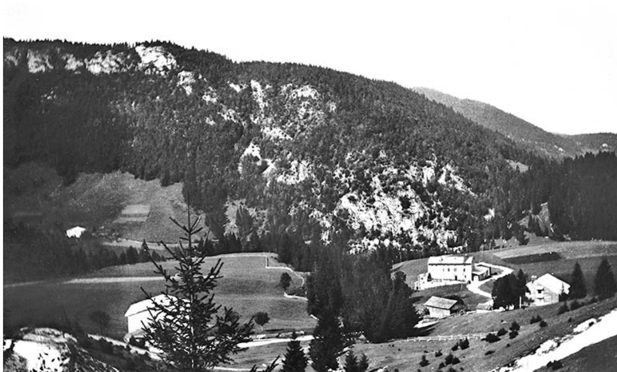
[L'usine vue depuis la route de Prémanon].