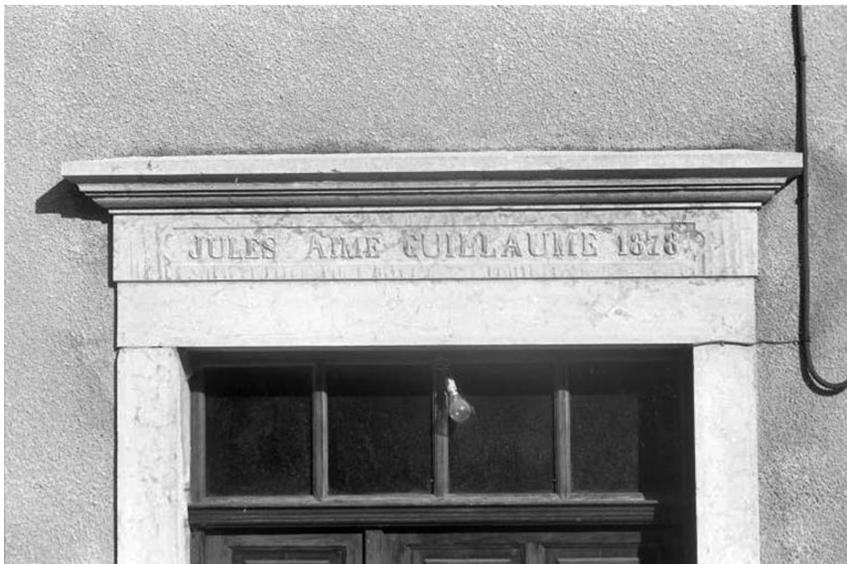
Linteau de la porte d'entrée.