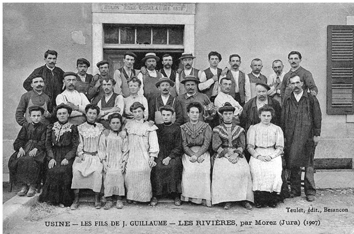
Usine - Les Fils de J. Guillaume - Les Rivières, par Morez (Jura) (1907).