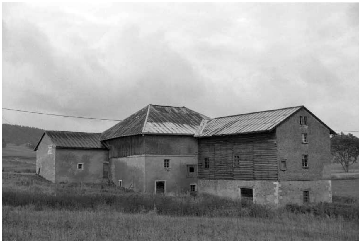
Vue d'ensemble depuis le nord (façades postérieures).