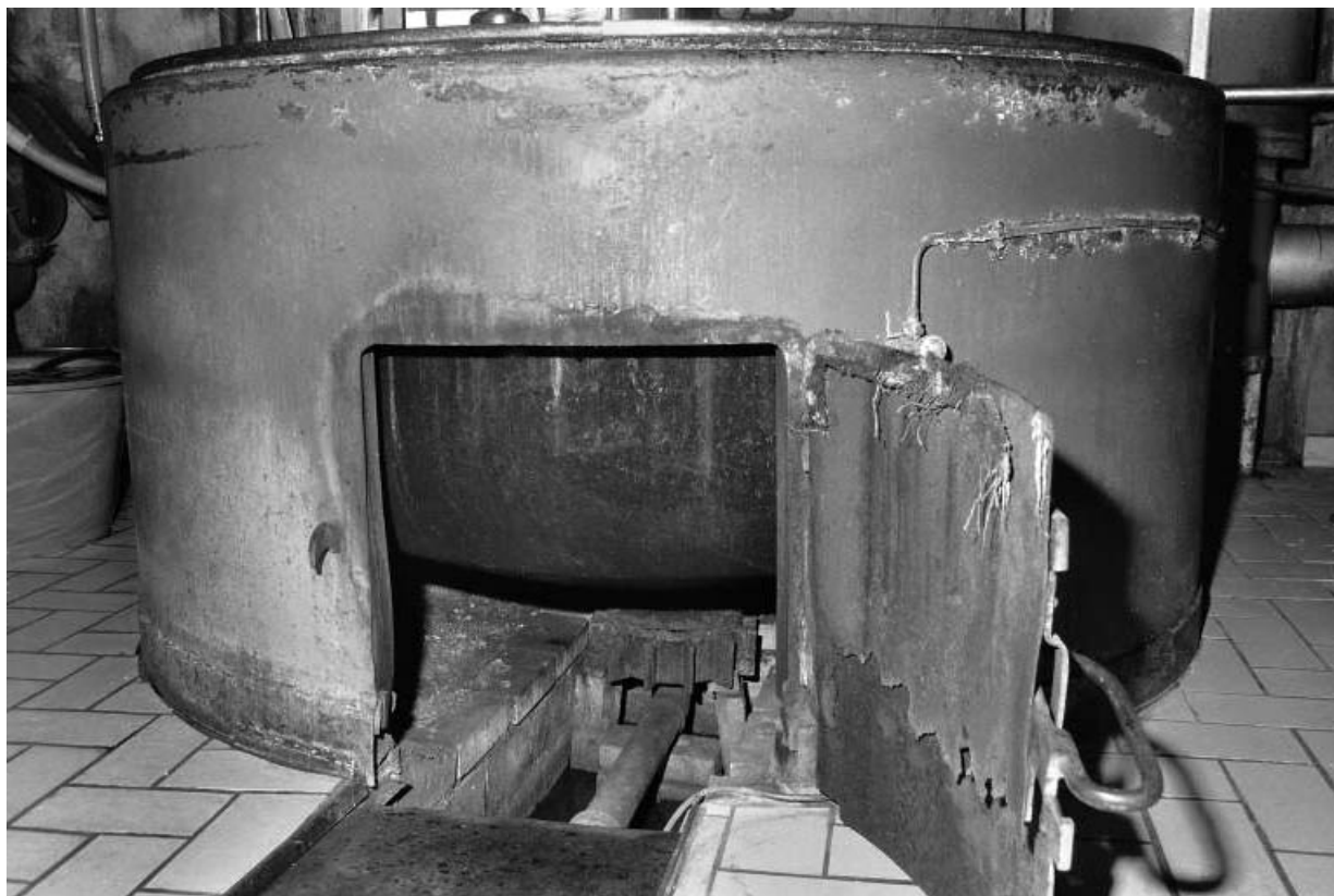
Cuve : brûleur au gaz.