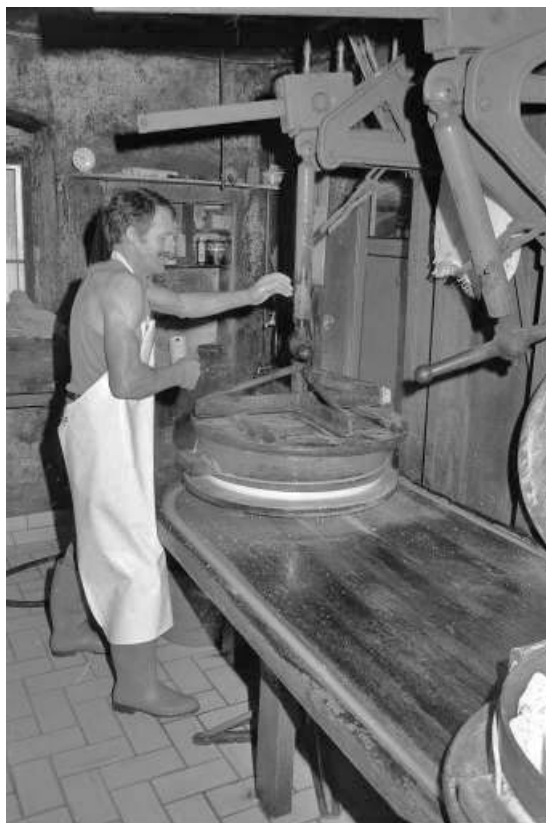
Fabrication du comté : serrage de la presse.