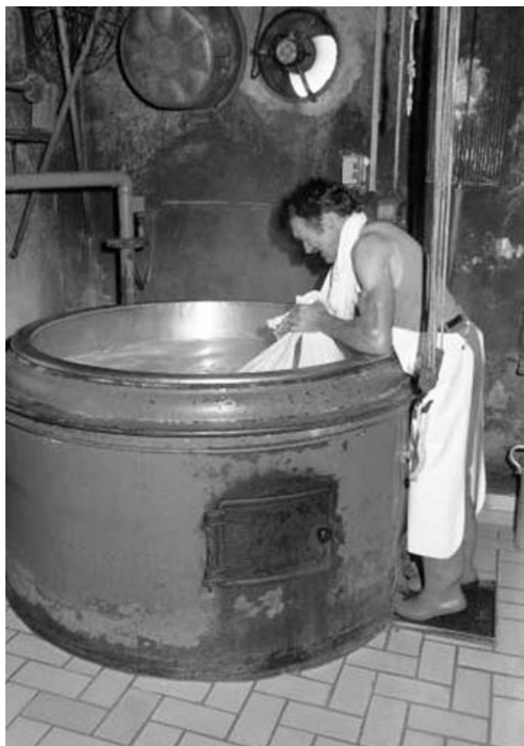
Fabrication du comté : fermeture de la toile.