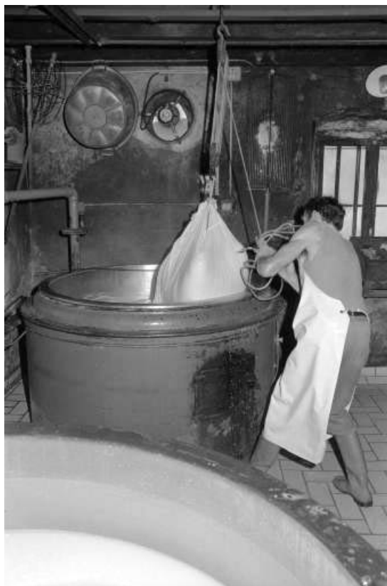
Fabrication du comté : sortie du caillé hors de la cuve.