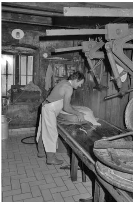
Fabrication du comté : dépose du caillé dans le cercle.