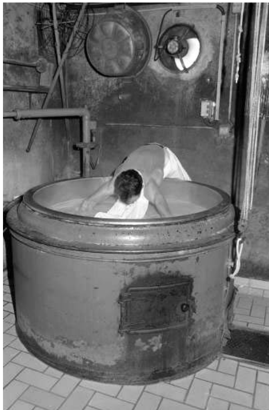
Fabrication du comté : ramassage du caillé dans la toile.