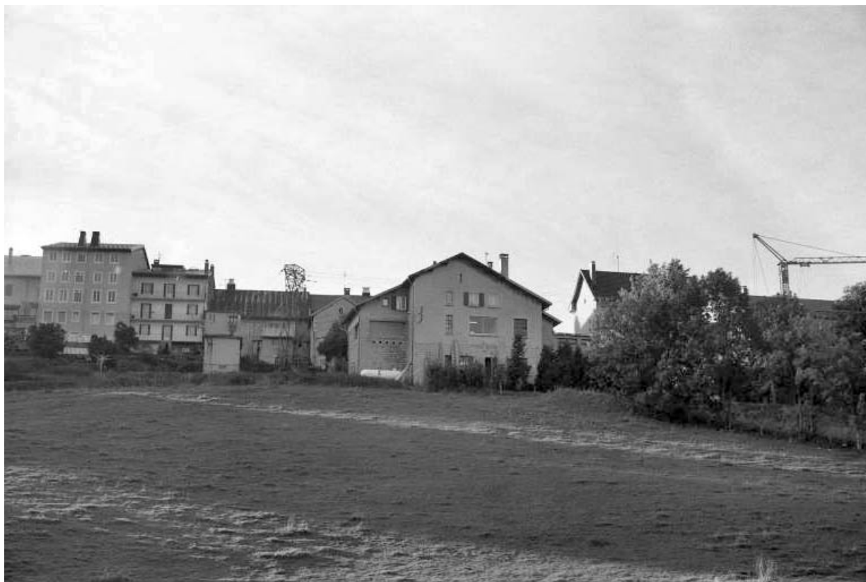
Vue d'ensemble : façade postérieure.