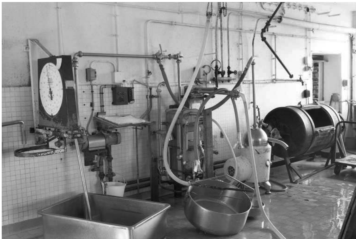
Atelier de fabrication : pèse-lait, écrémeuse et baratte.