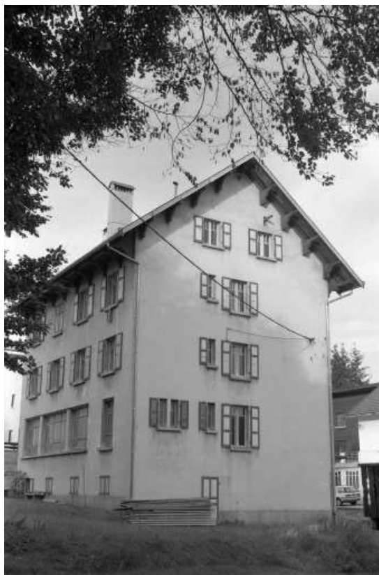
Façades antérieure et latérale droite.