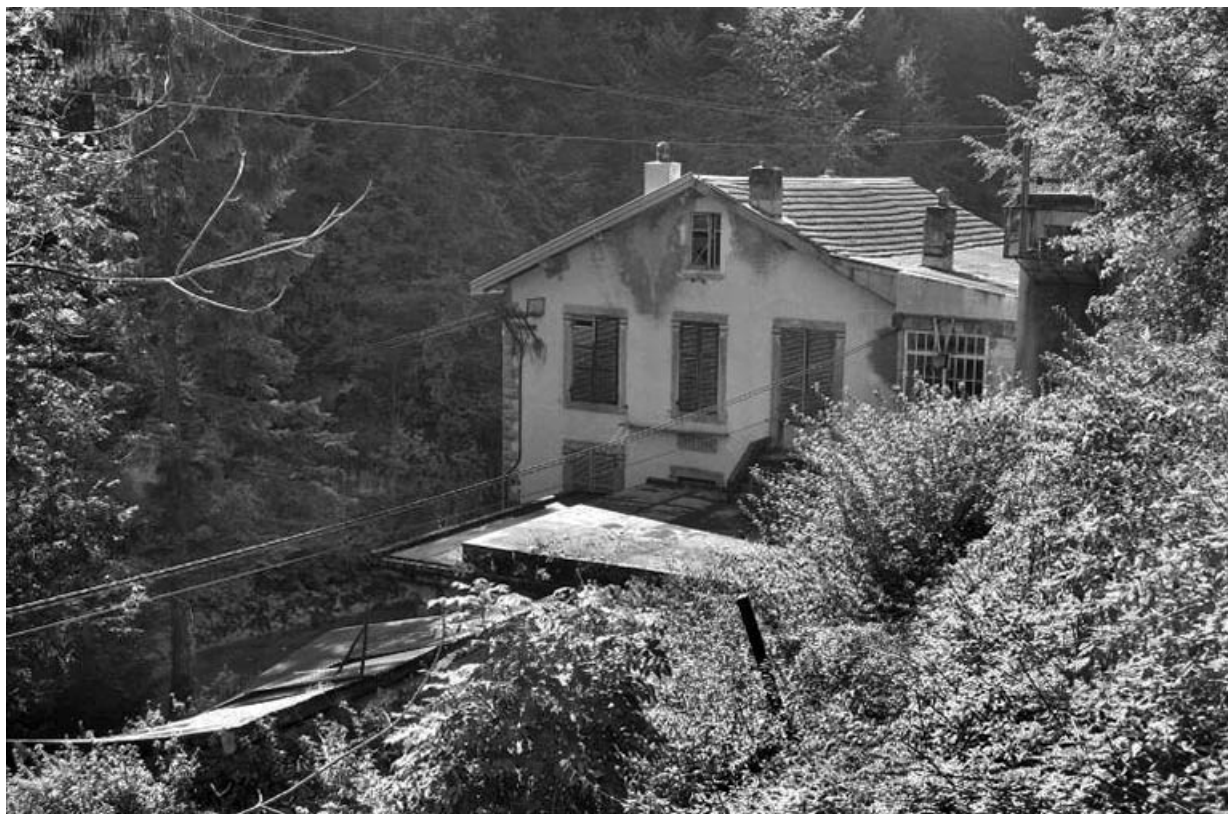
Façade antérieure, vue en plongée.

65, Tancua, lieudit : sur le Cul à l'Eau