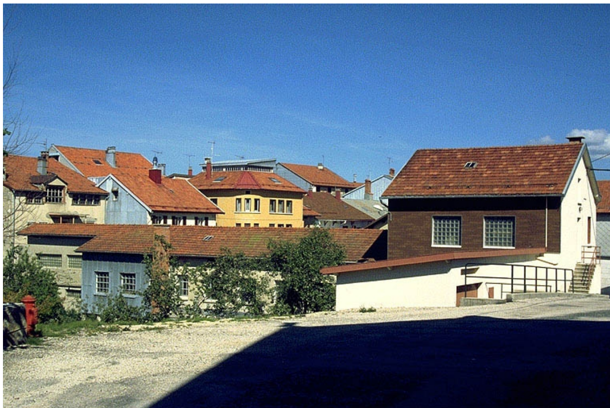
Façade postérieure de l'usine.