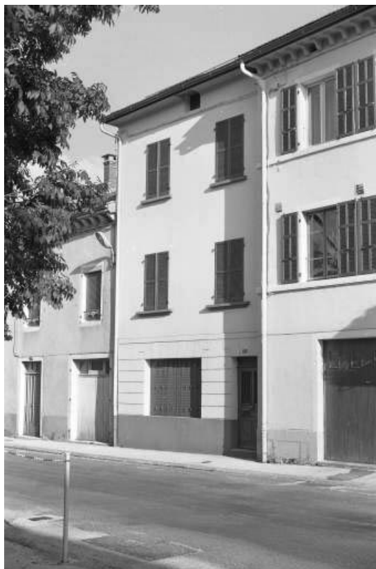
Façade antérieure du logement patronal (28, Grande Rue).