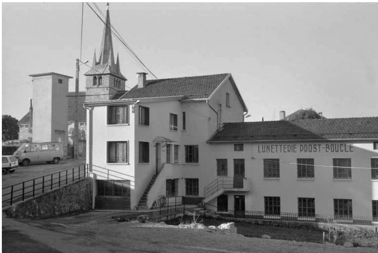
Bureau, atelier de réparation et atelier de fabrication.