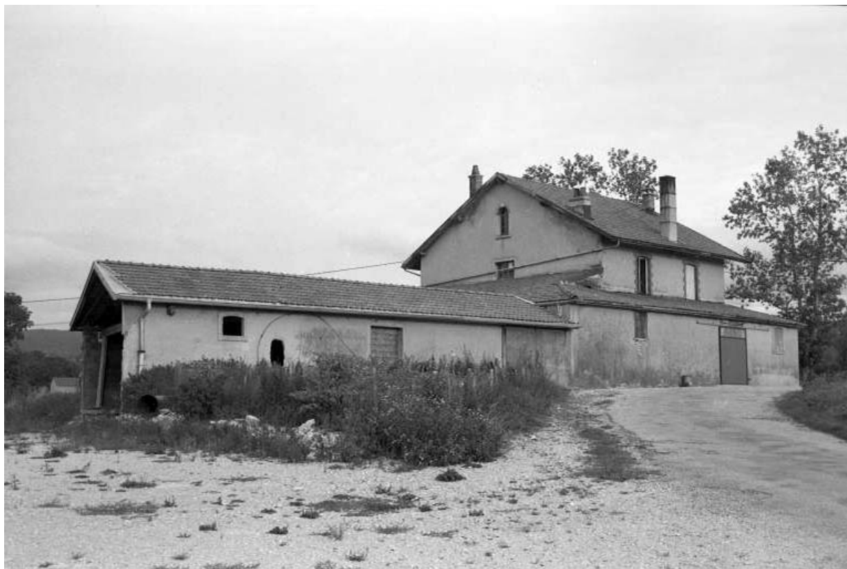
Façades postérieure et latérale gauche, et bûcher.