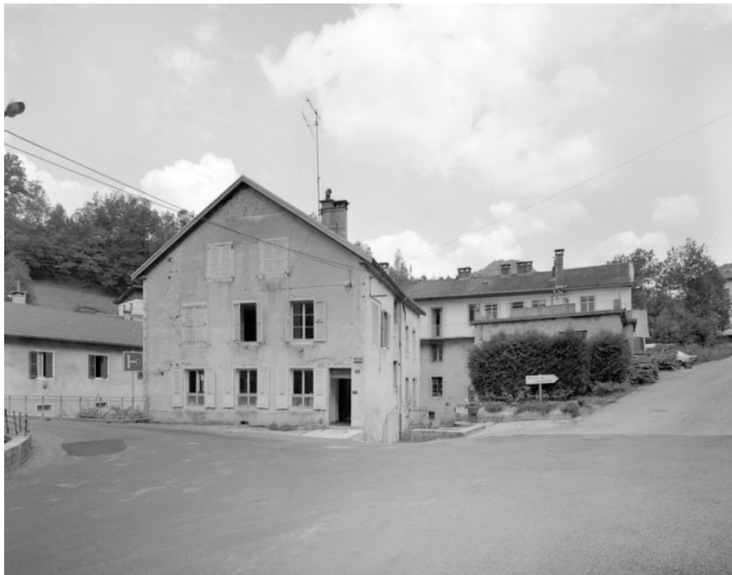
Façade antérieure du bureau (ancienne usine de mesures linéaires).

39, Saint-Claude, 1, 3 rue du Moulin Neuf