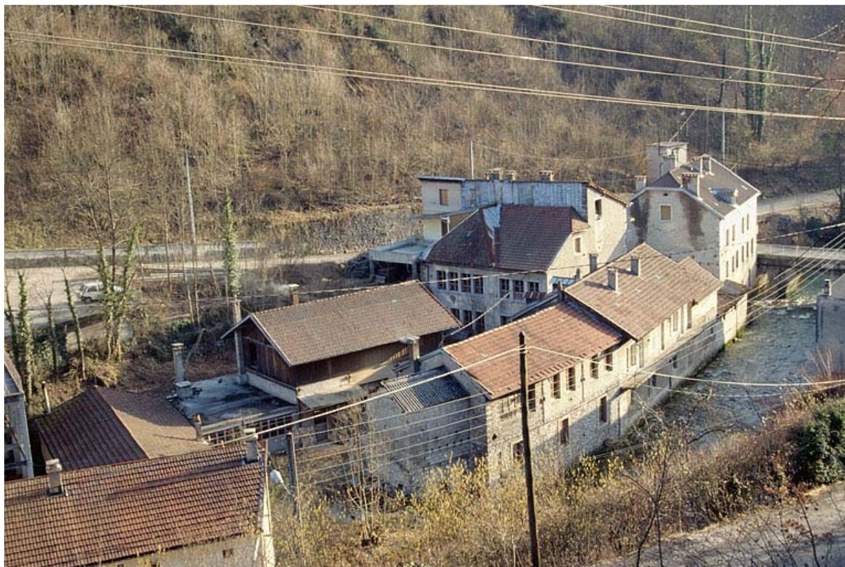
Vue d'ensemble plongeante depuis le nord-ouest.

39, Saint-Claude, 1, 3 rue du Moulin Neuf