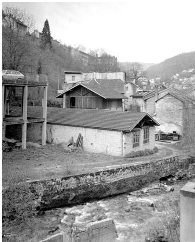
Atelier de fabrication de 1941 depuis le nord-est.

39, Saint-Claude, 1, 3 rue du Moulin Neuf