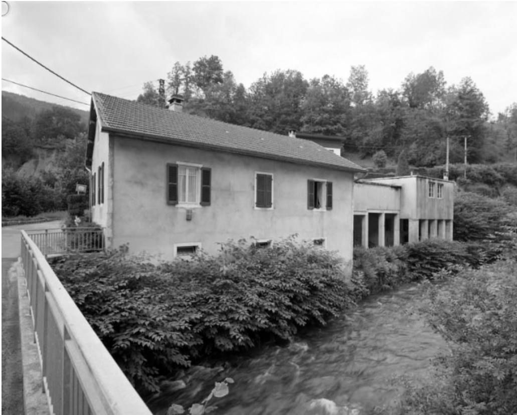
Façade sur l'Abîme de la maison et des remises à automobile.

39, Saint-Claude, 1, 3 rue du Moulin Neuf