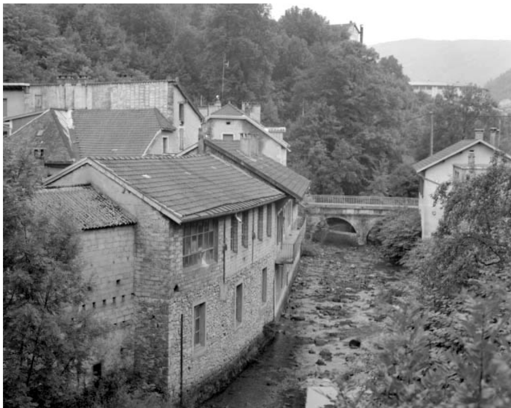
Ateliers de fabrication au long de l'Abîme, depuis l'amont.

39, Saint-Claude, 1, 3 rue du Moulin Neuf