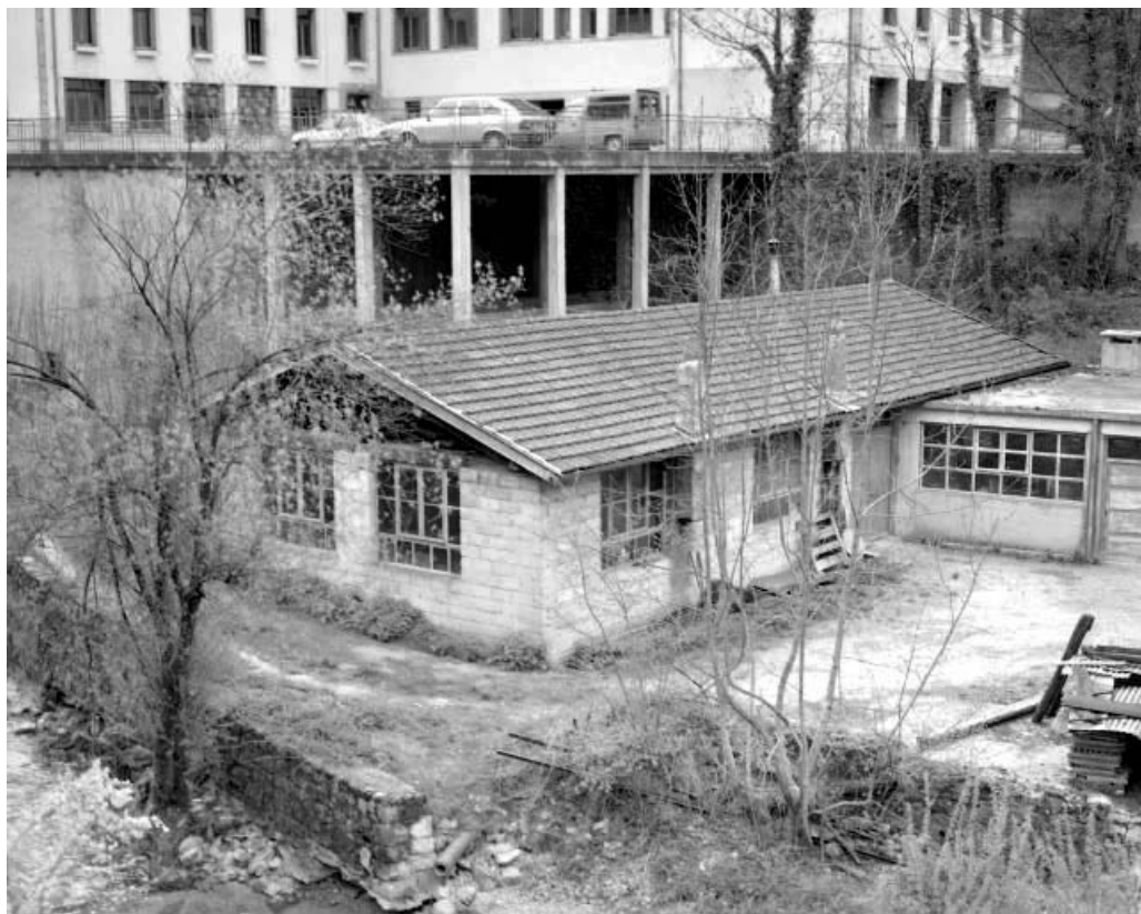
Atelier de fabrication et chaufferie de 1941.

39, Saint-Claude, 1, 3 rue du Moulin Neuf