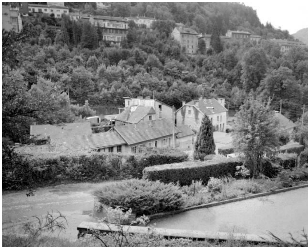
Vue d'ensemble plongeante depuis le nord-ouest.

39, Saint-Claude, 1, 3 rue du Moulin Neuf