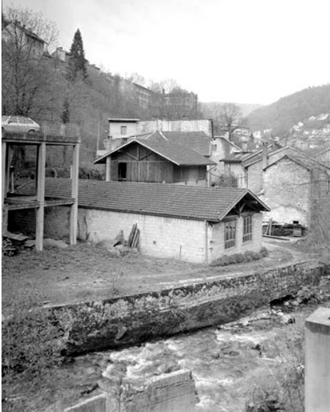
Atelier de fabrication de 1941 depuis le nord-est.

39, Saint-Claude, 1, 3 rue du Moulin Neuf