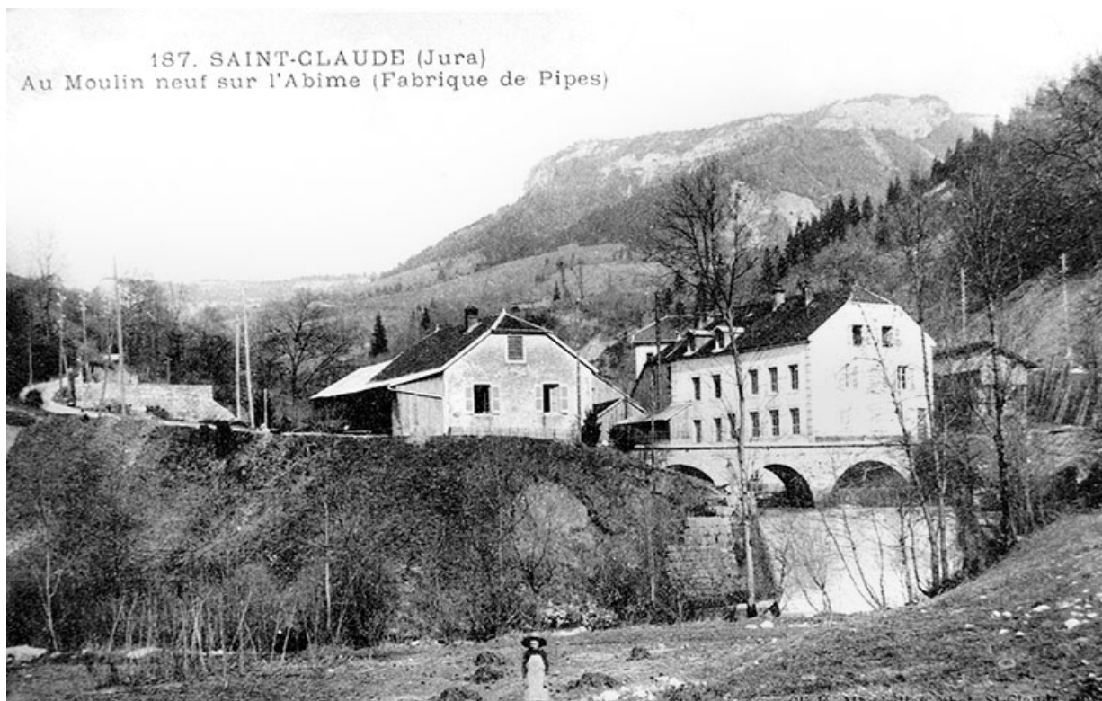
Saint-Claude (Jura). Au Moulin neuf sur l'Abîme (Fabrique de Pipes). 39, Saint-Claude, 1, 3 rue du Moulin Neuf

Carte postale, s.d. [1er quart 20e siècle, avant 1914], par Mandrillon, E. (photographe). Lieu de conservation : collection particulière : Gérard Chapel, Saint-Claude