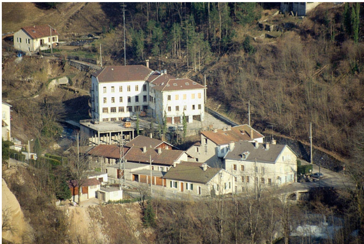
Vue d'ensemble plongeante depuis l'ouest.