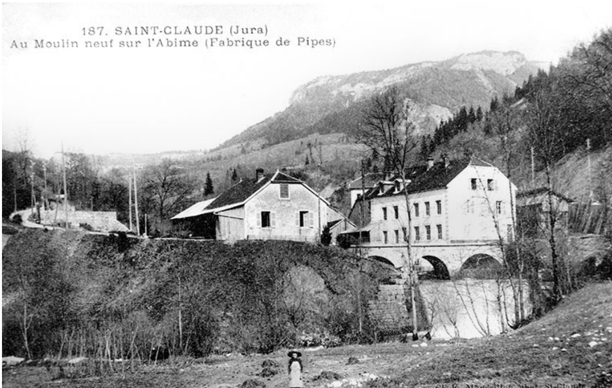
Saint-Claude (Jura). Au Moulin neuf sur l'Abîme (Fabrique de Pipes). 39, Saint-Claude, 1, 3 rue du Moulin Neuf