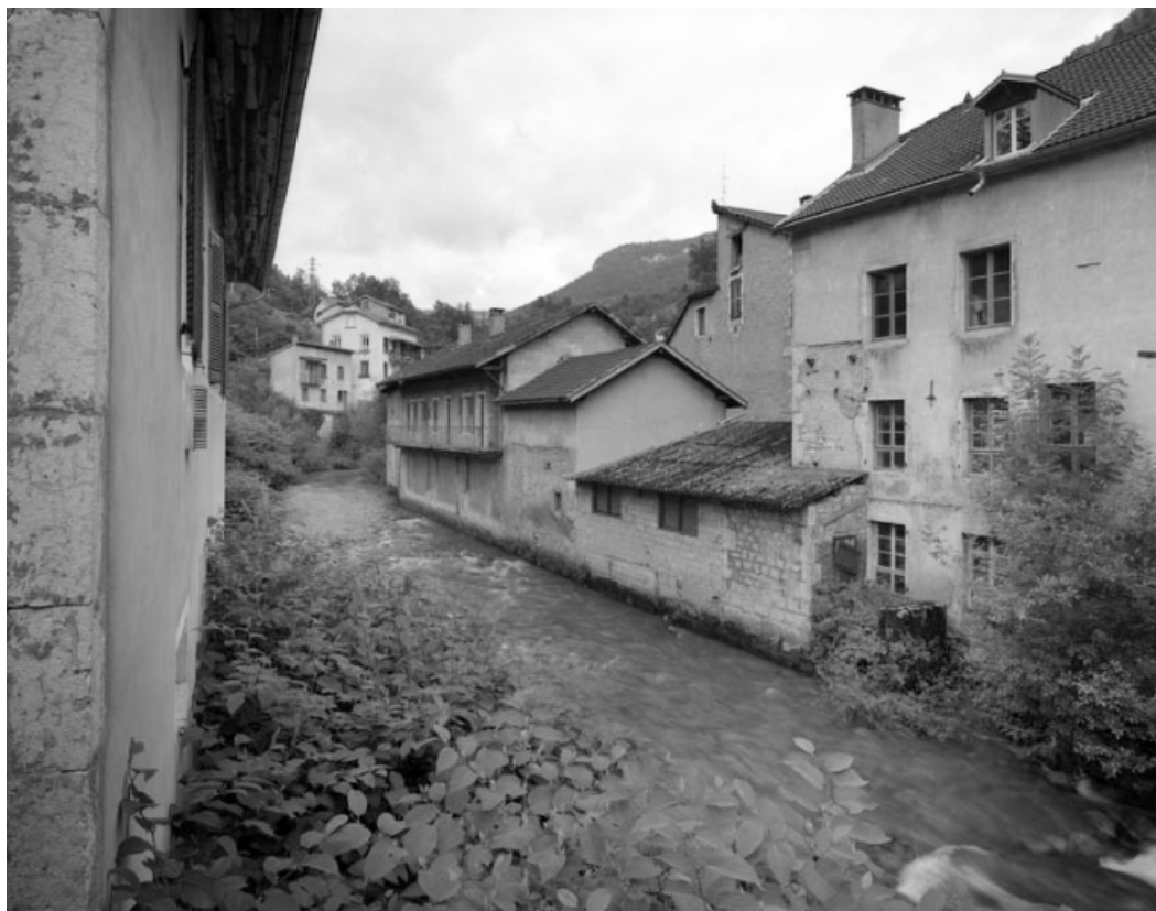
Bureau et ateliers de fabrication au long de l'Abîme, depuis l'aval.

39, Saint-Claude, 1, 3 rue du Moulin Neuf