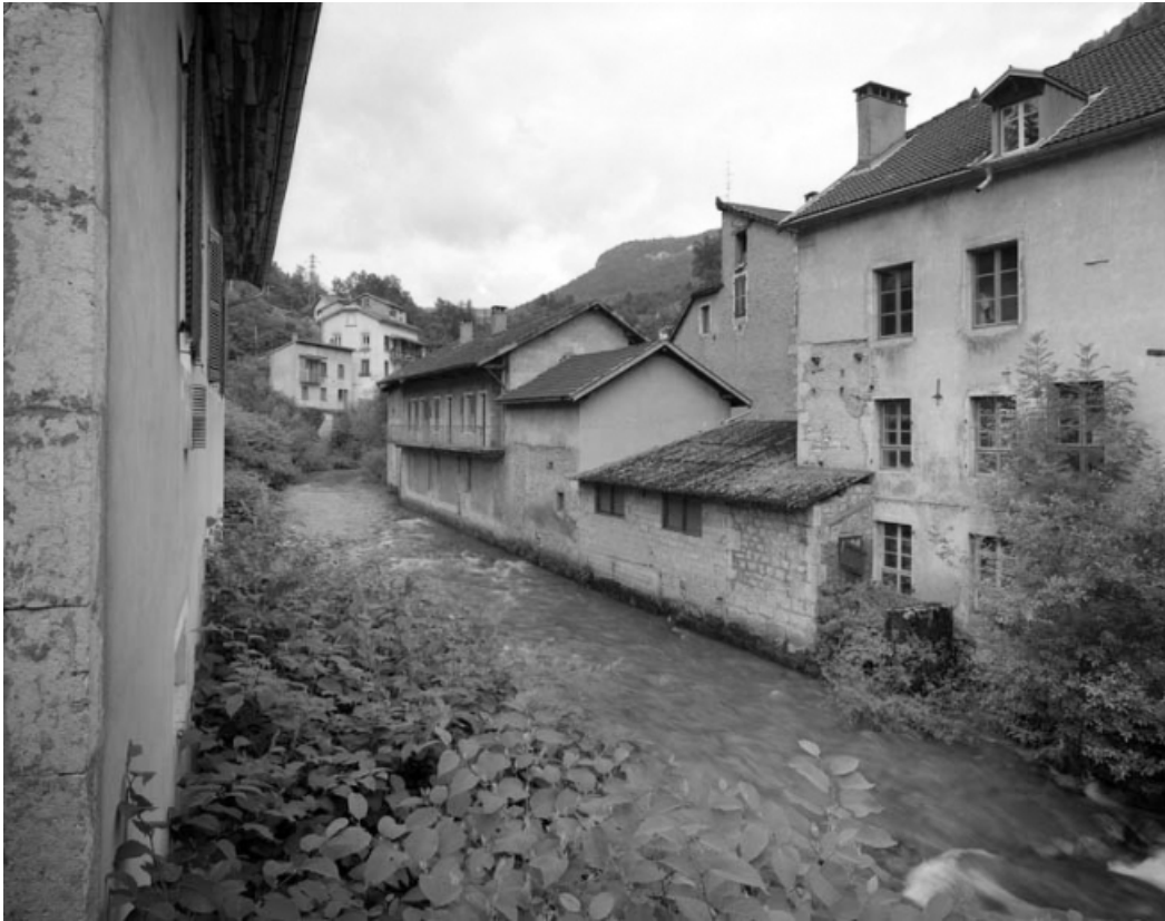
Bureau et ateliers de fabrication au long de l'Abîme, depuis l'aval.

39, Saint-Claude, 1, 3 rue du Moulin Neuf