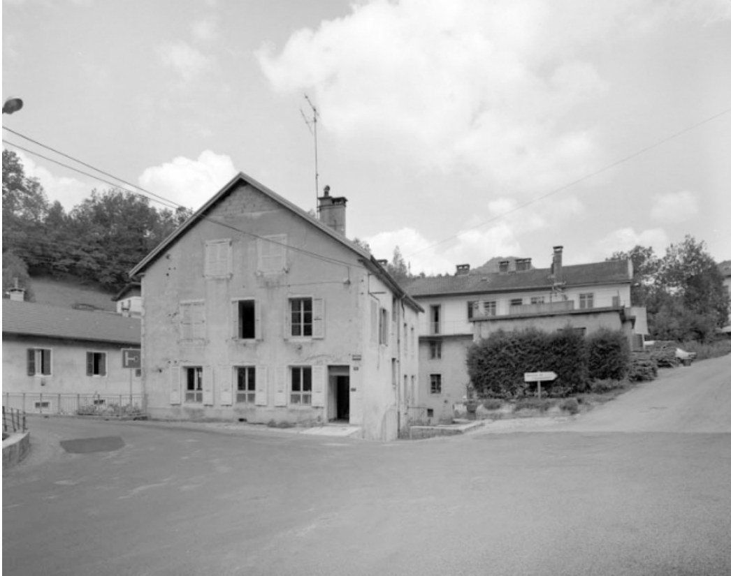
Façade antérieure du bureau (ancienne usine de mesures linéaires).

39, Saint-Claude, 1, 3 rue du Moulin Neuf