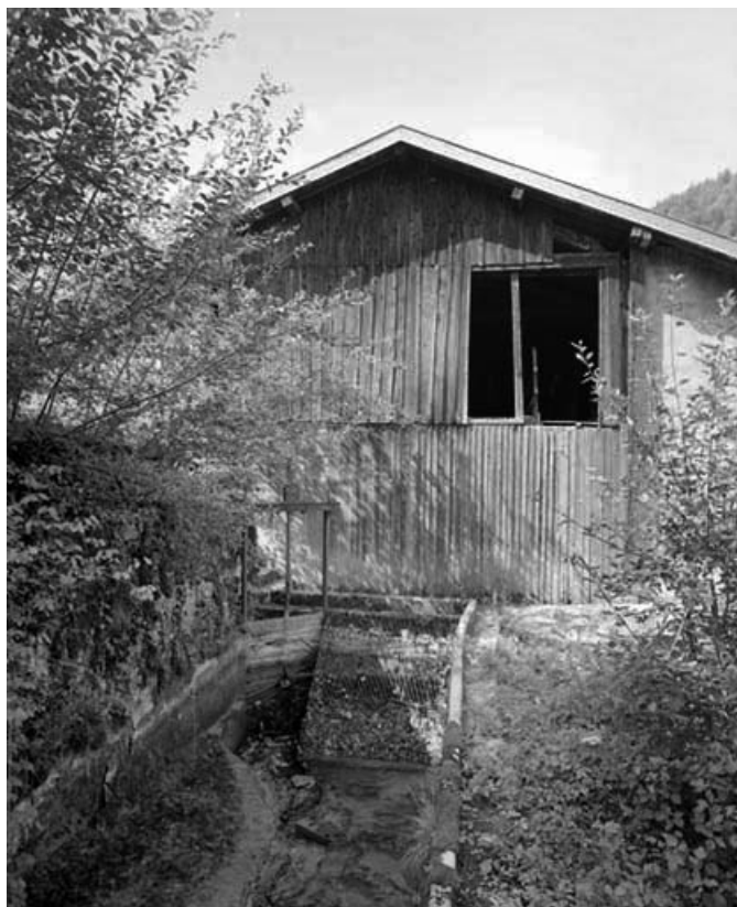
Canal d'amenée et bâtiment d'eau (ancienne scierie).

39, Saint-Claude, 15, 17 rue du Moulin Lacroix