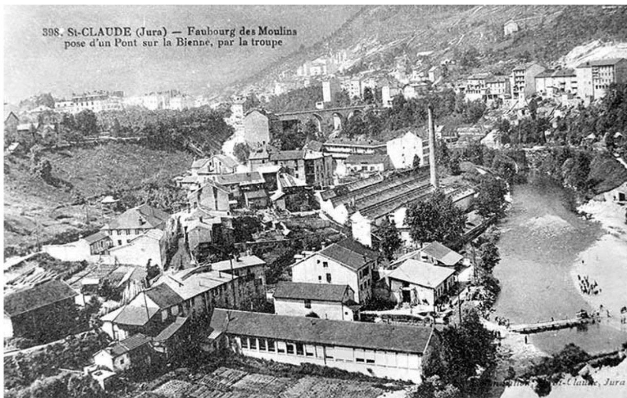
St-Claude (Jura) - Faubourg des Moulins. Pose d'un Pont sur la Bièvre, par la troupe.

39, Saint-Claude, 15, 17 rue du Moulin Lacroix