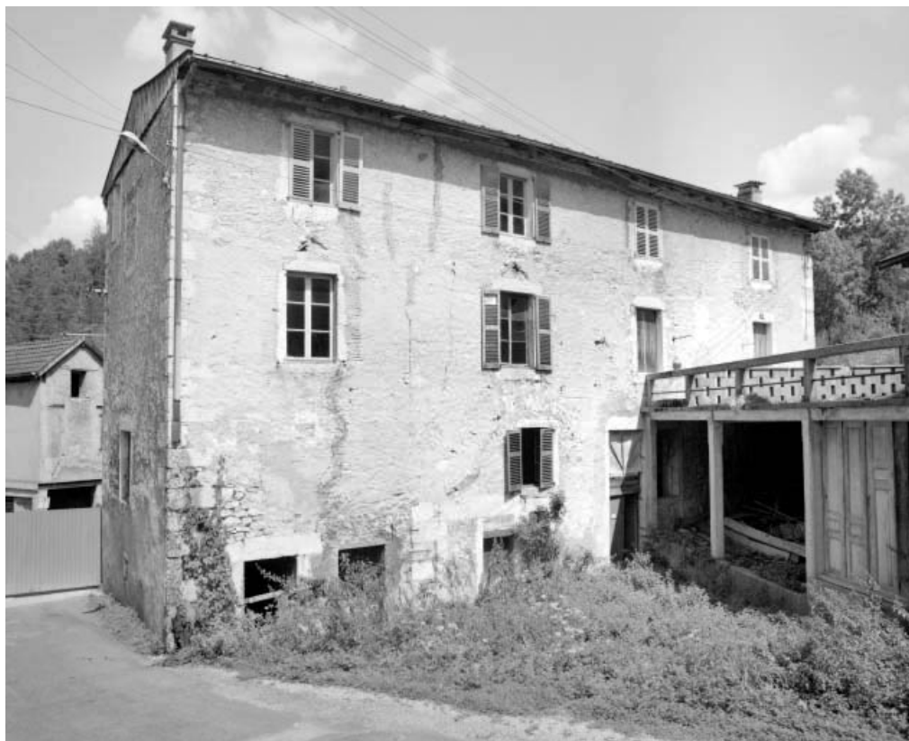
Bâtiment d'eau et atelier de fabrication (ancien moulin).

39, Saint-Claude, 15, 17 rue du Moulin Lacroix