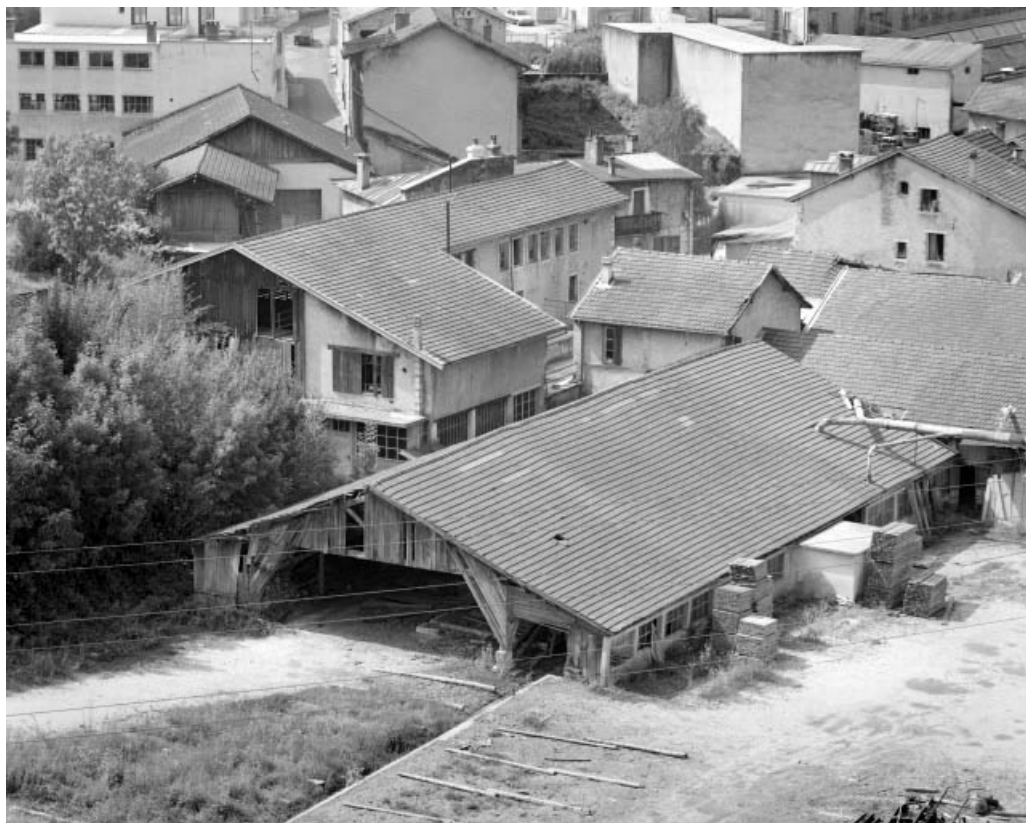
Bâtiment d'eau et ateliers de fabrication (ancienne et nouvelle scieries).

39, Saint-Claude, 15, 17 rue du Moulin Lacroix