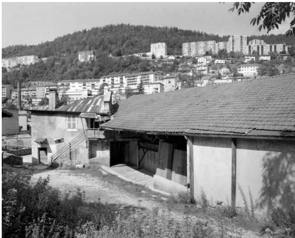
Bâtiments d'eau et ateliers de fabrication (ancien moulin et ancienne scierie). Ancien moulin à gauche. 39, Saint-Claude, 15, 17 rue du Moulin Lacroix