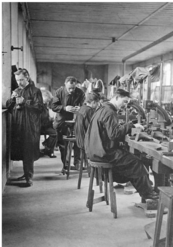
Usine du Moulin-Neuf [des Moulins] : ouvriers au travail.

39, Saint-Claude, 15, 17 rue du Moulin Lacroix