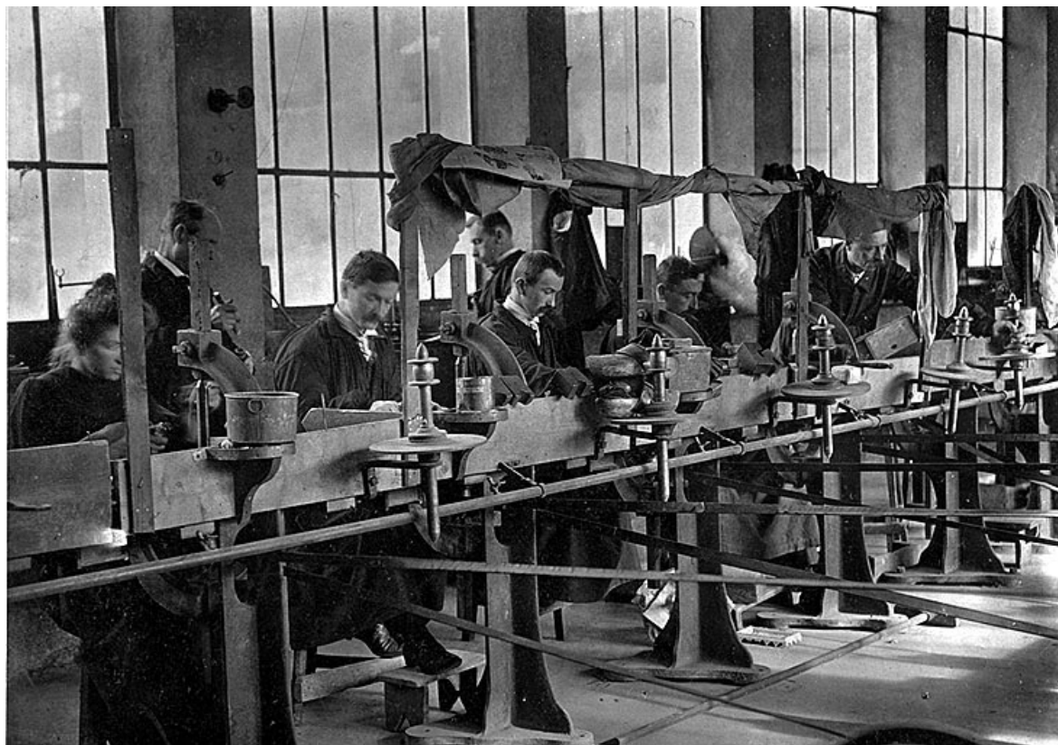
Usine du Moulin-Neuf [des Moulins] : intérieur de la tailleurie.

39, Saint-Claude, 15, 17 rue du Moulin Lacroix