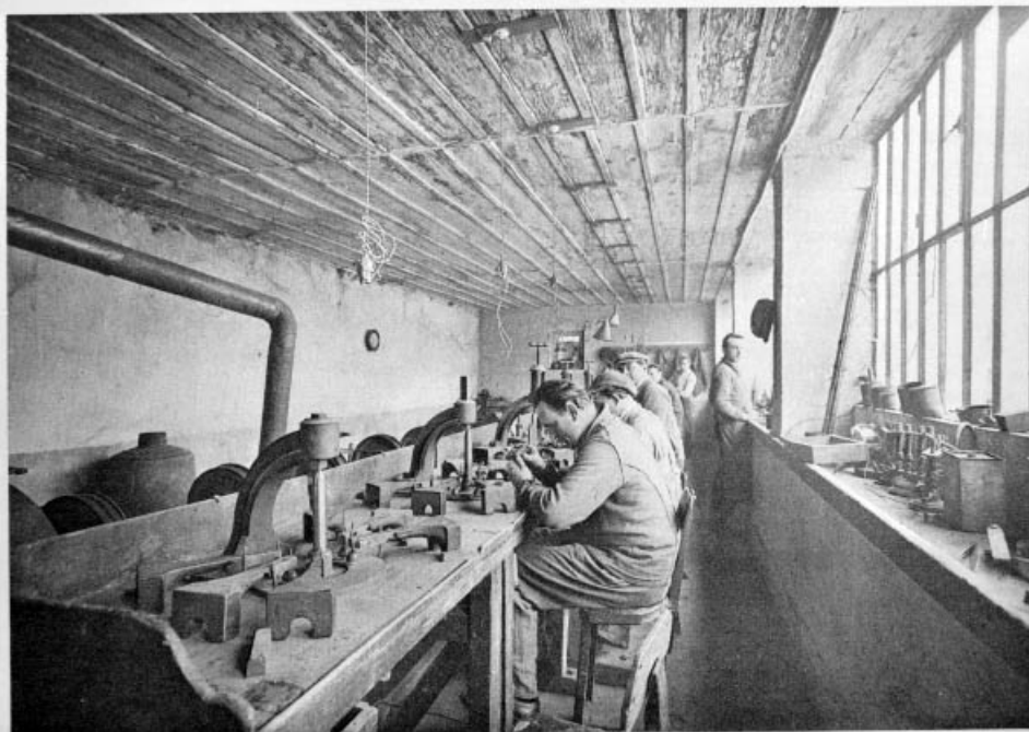
77. — Les Moulins. Société Coopérative — Taillerie de diamants.

Les Moulins, Société coopérative - Taillerie de diamants, début des années 1920.