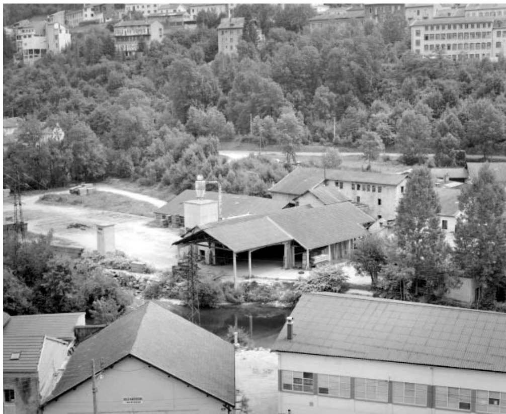
Vue d'ensemble plongeante depuis l'ouest.

39, Saint-Claude, 15, 17 rue du Moulin Lacroix