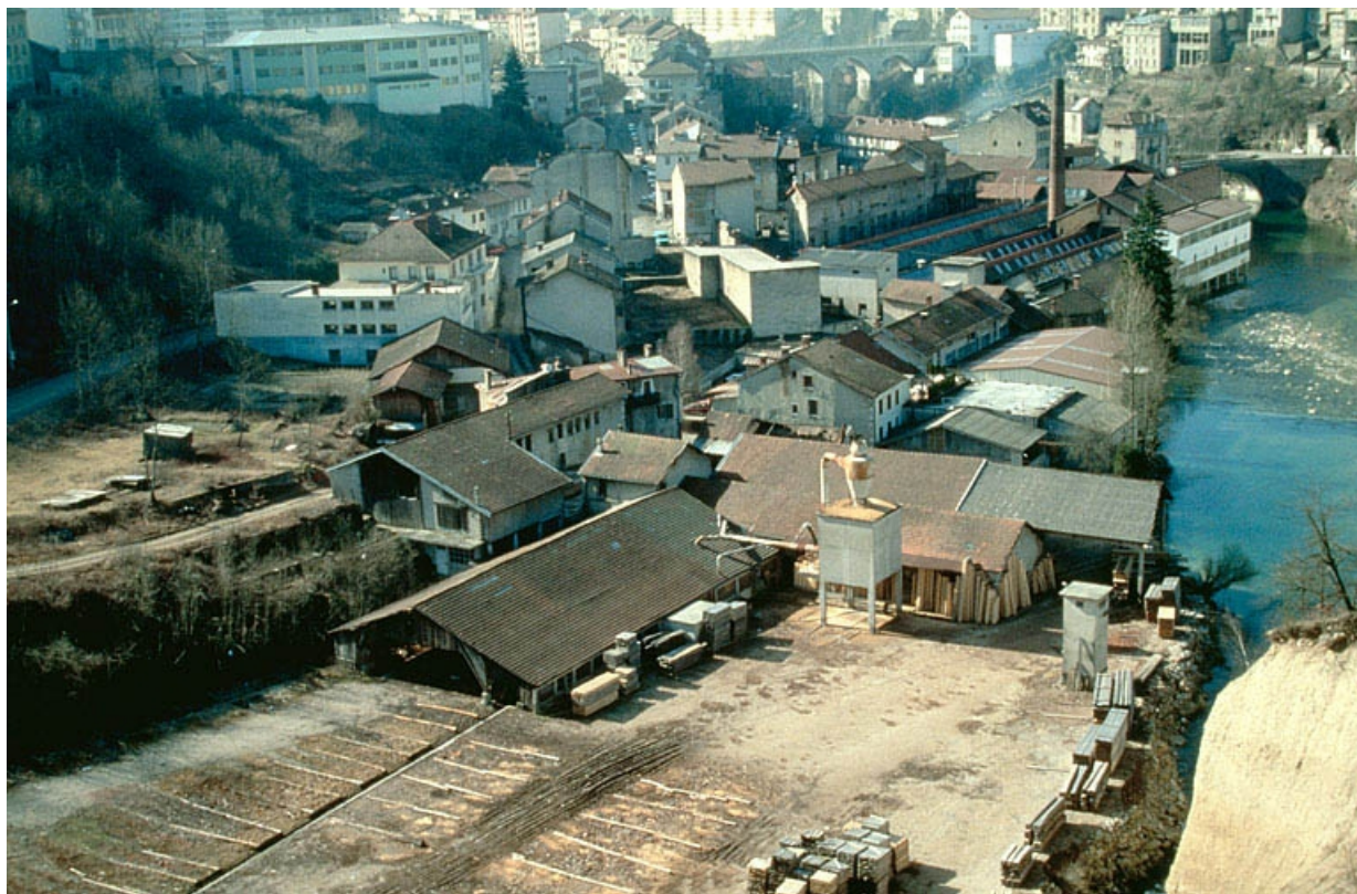
Vue d'ensemble plongeante depuis le nord. 39, Saint-Claude, 15, 17 rue du Moulin Lacroix