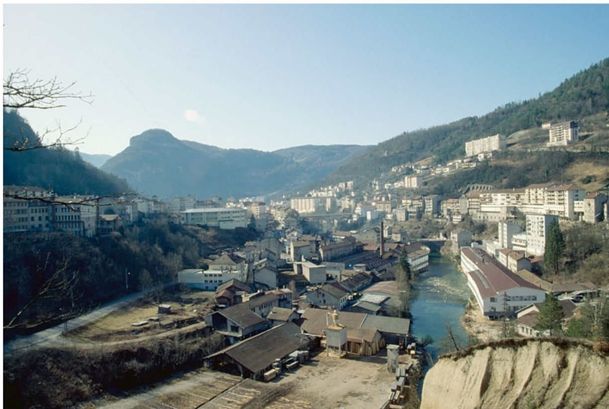
Vue d'ensemble plongeante sur le site et sur le quartier des Moulins, depuis le nord.

39, Saint-Claude, 15, 17 rue du Moulin Lacroix