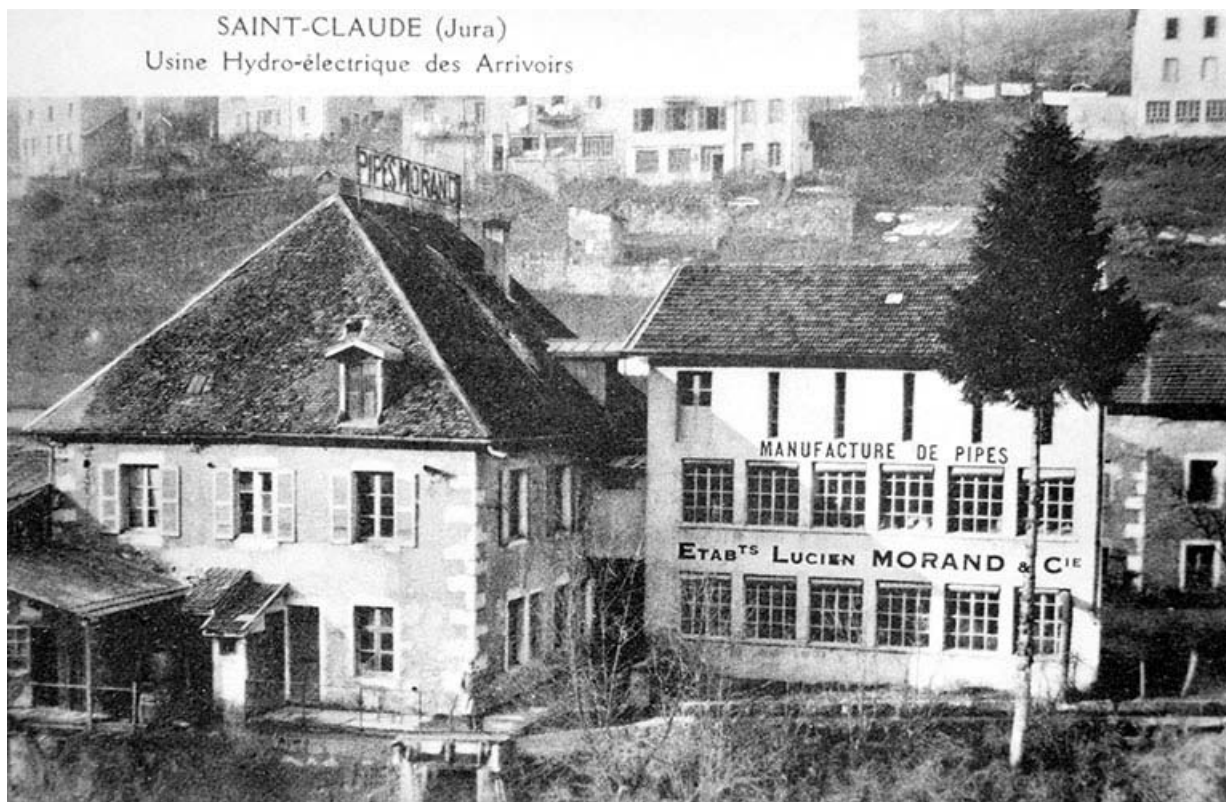
Saint-Claude (Jura). Usine Hydro-électrique des Arrivoirs.

39, Saint-Claude, 12, 14 chemin des Arrivoirs