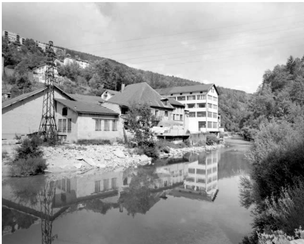
Façade postérieure des bâtiments, depuis l'aval.

39, Saint-Claude, 12, 14 chemin des Arrivoirs