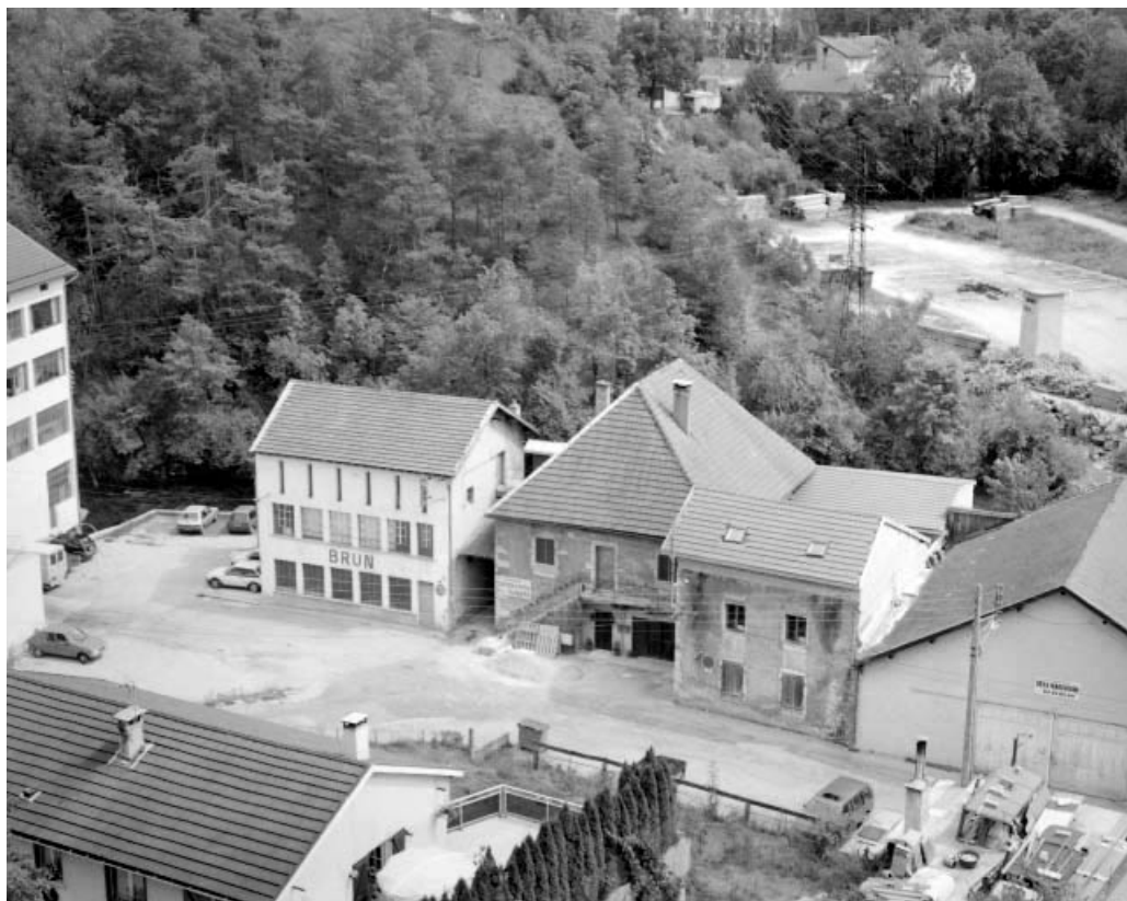
Vue d'ensemble de la façade antérieure des bâtiments.

39, Saint-Claude, 12, 14 chemin des Arrivoirs