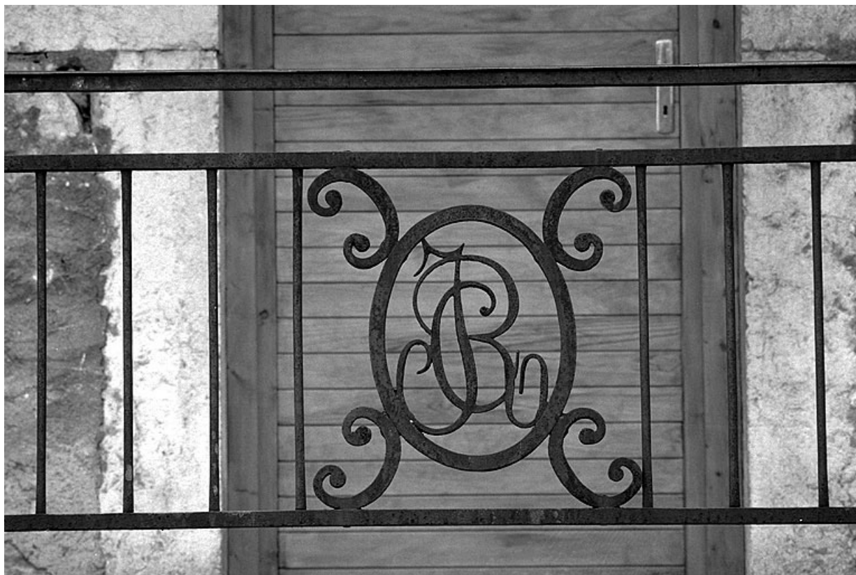
Initiales ornant la grille en fer forgé de l'atelier de fabrication.

39, Saint-Claude, 12, 14 chemin des Arrivoirs