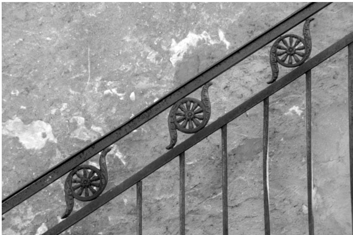
Détail de la grille en fer forgé de l'atelier de fabrication.

39, Saint-Claude, 12, 14 chemin des Arrivoirs