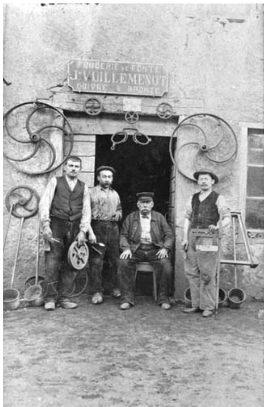
Personnel à l'entrée de la fonderie Vuilleminot (à Morez ?).

39, Saint-Claude, 7, 9 chemin des Arrivoirs