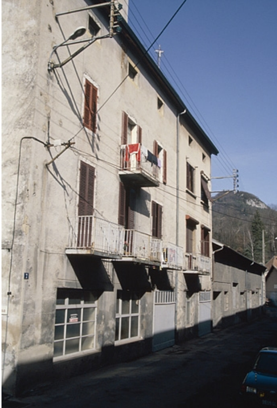
Façade antérieure de trois quarts gauche.

39, Saint-Claude, 7, 9 chemin des Arrivoirs