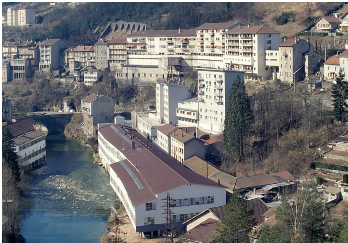
Vue d'ensemble plongeante depuis le nord-est. La fonderie est partiellement masquée par l'usine Manzoni-Bouchot, en bordure de Bienne.

39, Saint-Claude, 7, 9 chemin des Arrivoirs