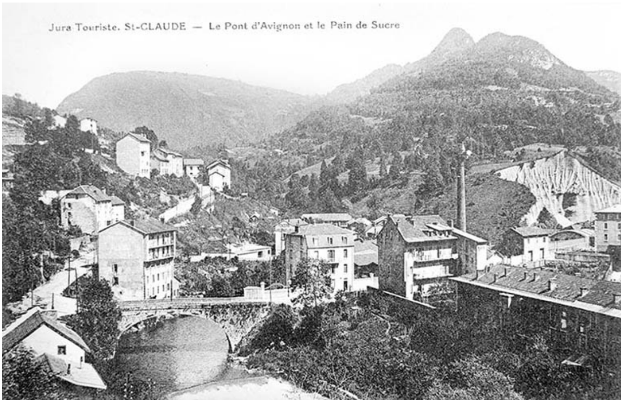
Jura-Touriste. St-Claude - Le Pont d'Avignon et le Pain de sucre.

39, Saint-Claude, 2 à 8 rue du Faubourg des Moulins