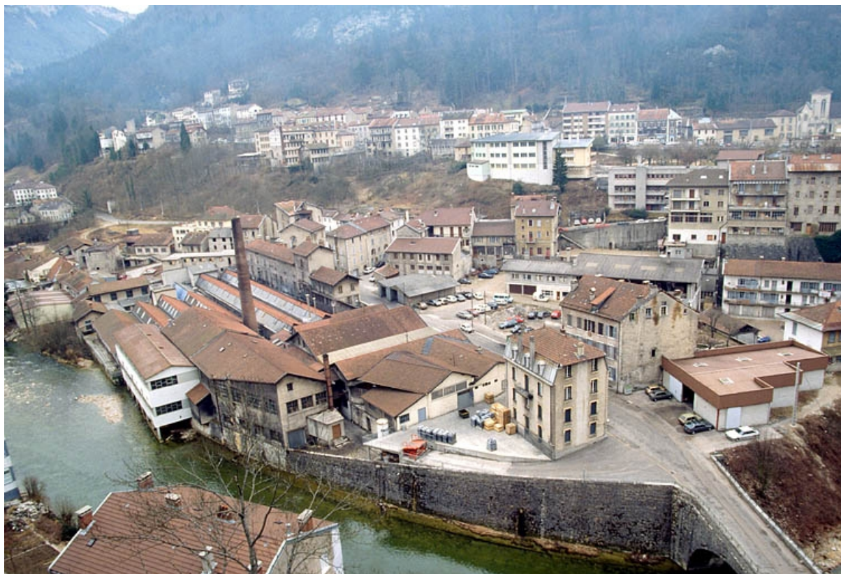
Vue d'ensemble plongeante depuis l'ouest.