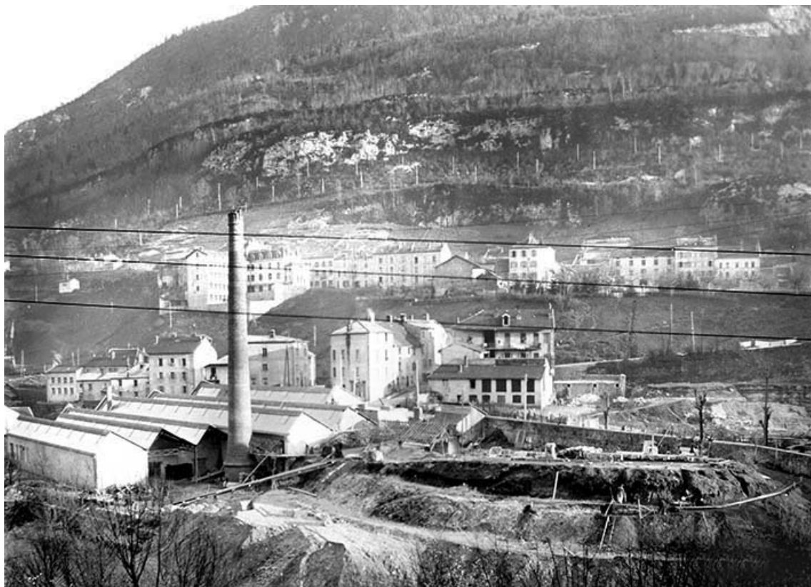
L'usine en cours d'agrandissement.

39, Saint-Claude, 2 à 8 rue du Faubourg des Moulins