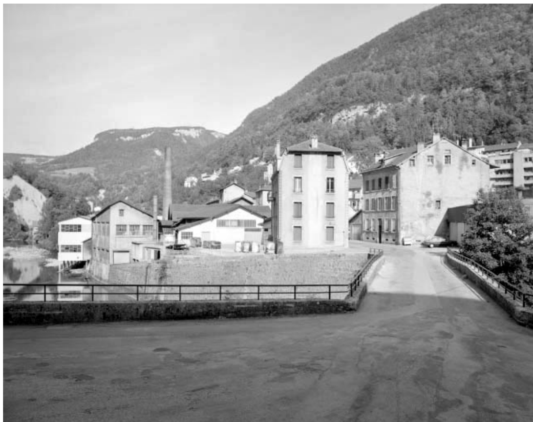
Usine, logement et immeuble pour les ouvriers, depuis le pont d'Avignon.

39, Saint-Claude, 2 à 8 rue du Faubourg des Moulins