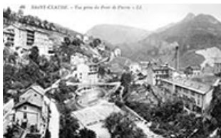
Saint-Claude. - Vue prise du Pont de Pierre.

39, Saint-Claude, 2 à 8 rue du Faubourg des Moulins