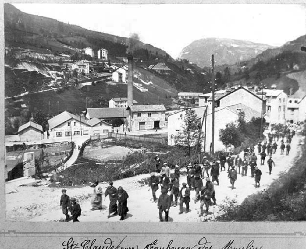
St-Claude (Jura). Faubourg des Moulins. Usine de l'Ebonite : la sortie des ouvriers à midi. 39, Saint-Claude, 2 à 8 rue du Faubourg des Moulins

Photographie, s.d. [1ère moitié 20e siècle, décennies 1910-1920], par Mandrillon, E. (photographe). Lieu de conservation : Archives de la société Paul Jeantet et Cie, Saint-Claude