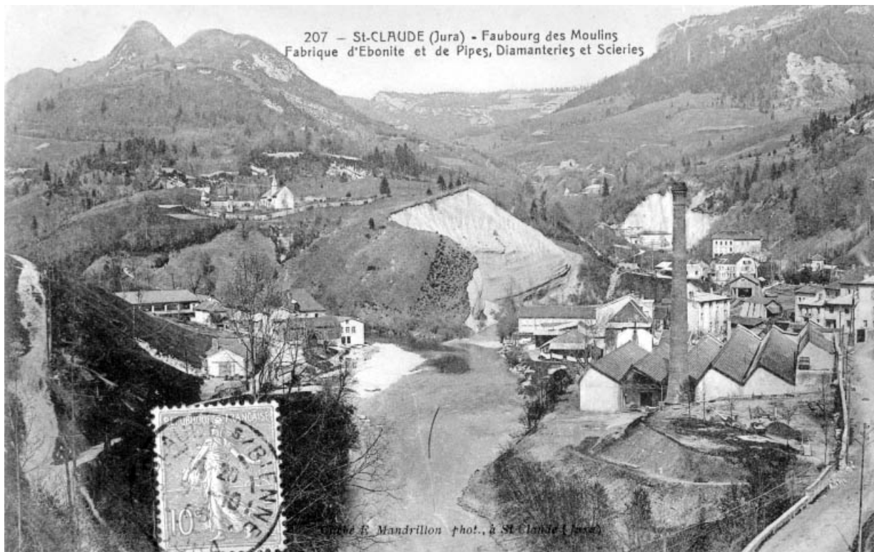
St-Claude (Jura) - Faubourg des Moulins. Fabrique d'Ebonite et de Pipes, Diamanteries et Scieries.

39, Saint-Claude, 2 à 8 rue du Faubourg des Moulins