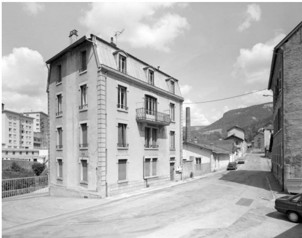
Logement et façades sur la rue du Faubourg des Moulins.

39, Saint-Claude, 2 à 8 rue du Faubourg des Moulins