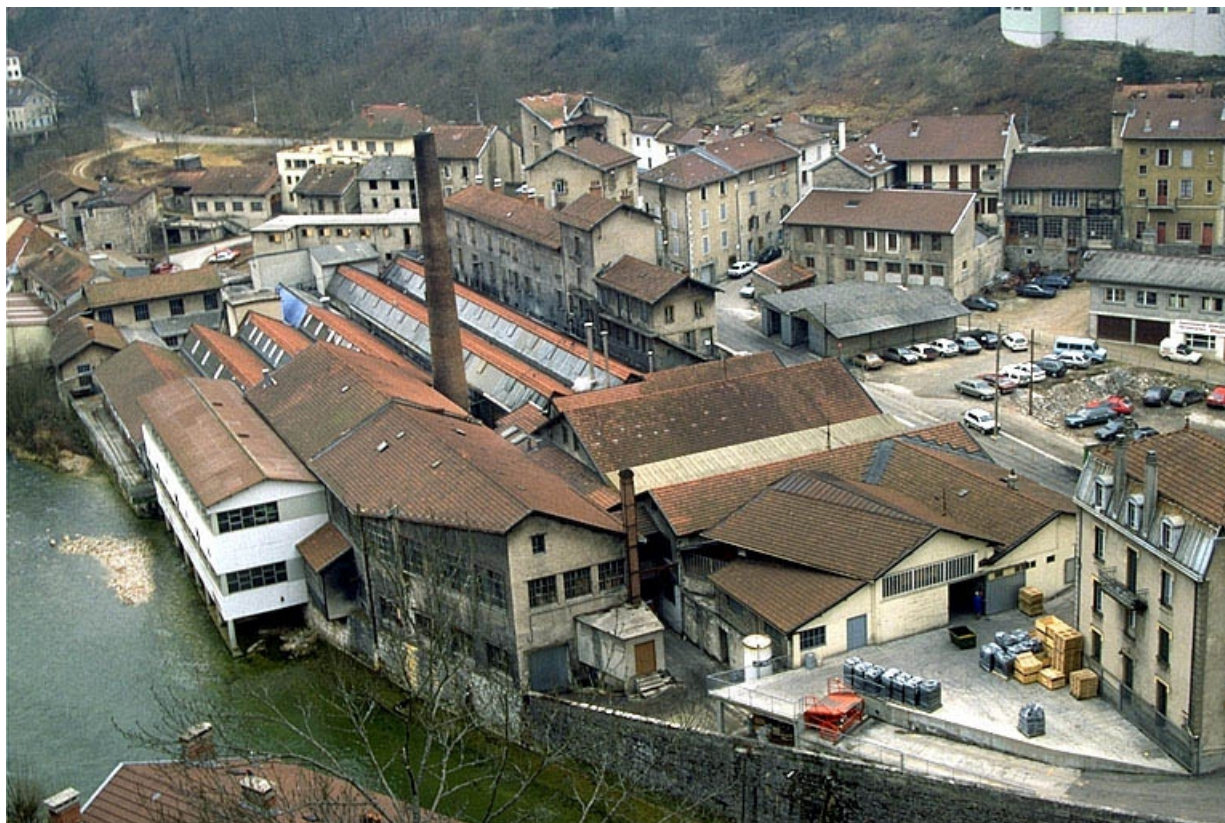
Vue d'ensemble plongeante sur l'usine, depuis l'ouest.

39, Saint-Claude, 2 à 8 rue du Faubourg des Moulins