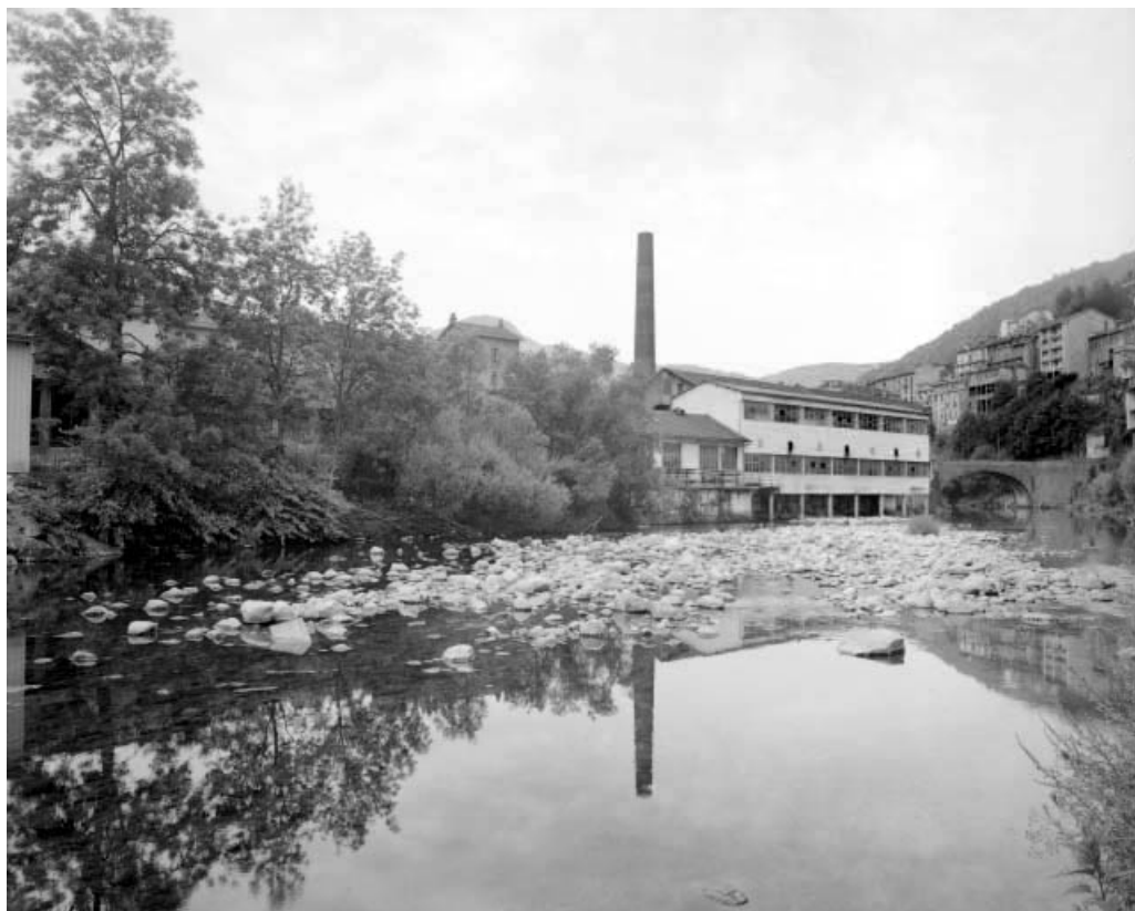
Façade sur la Bienne, depuis l'amont.

39, Saint-Claude, 2 à 8 rue du Faubourg des Moulins