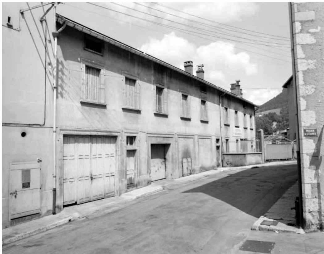
Transformateur, entrepôt industriel et bureau.

39, Saint-Claude, 2 à 8 rue du Faubourg des Moulins