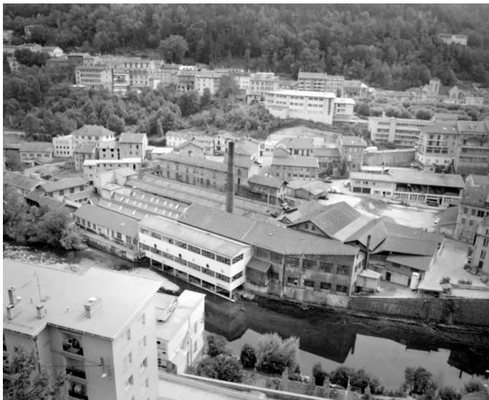
Vue d'ensemble plongeante depuis le nord-ouest. 39, Saint-Claude, 2 à 8 rue du Faubourg des Moulins