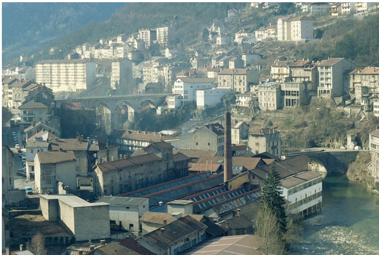
Vue d'ensemble plongeante depuis le nord.

39, Saint-Claude, 2 à 8 rue du Faubourg des Moulins