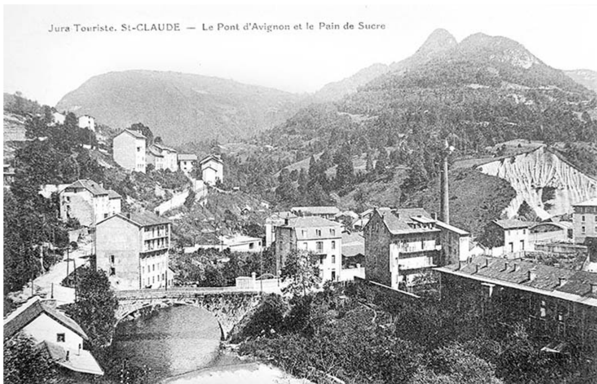
Jura-Touriste. St-Claude - Le Pont d'Avignon et le Pain de sucre.

39, Saint-Claude, 2 à 8 rue du Faubourg des Moulins