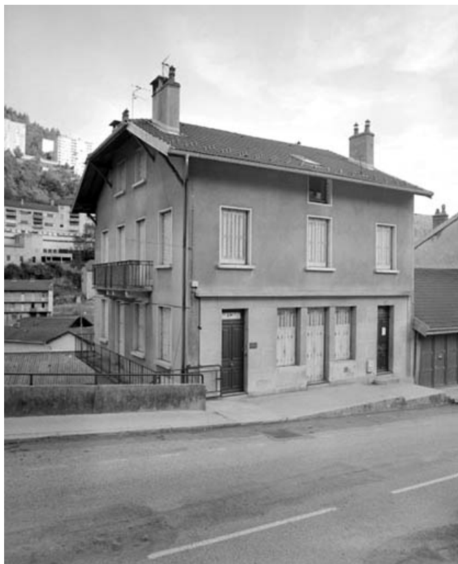
Façade antérieure de trois quarts gauche.