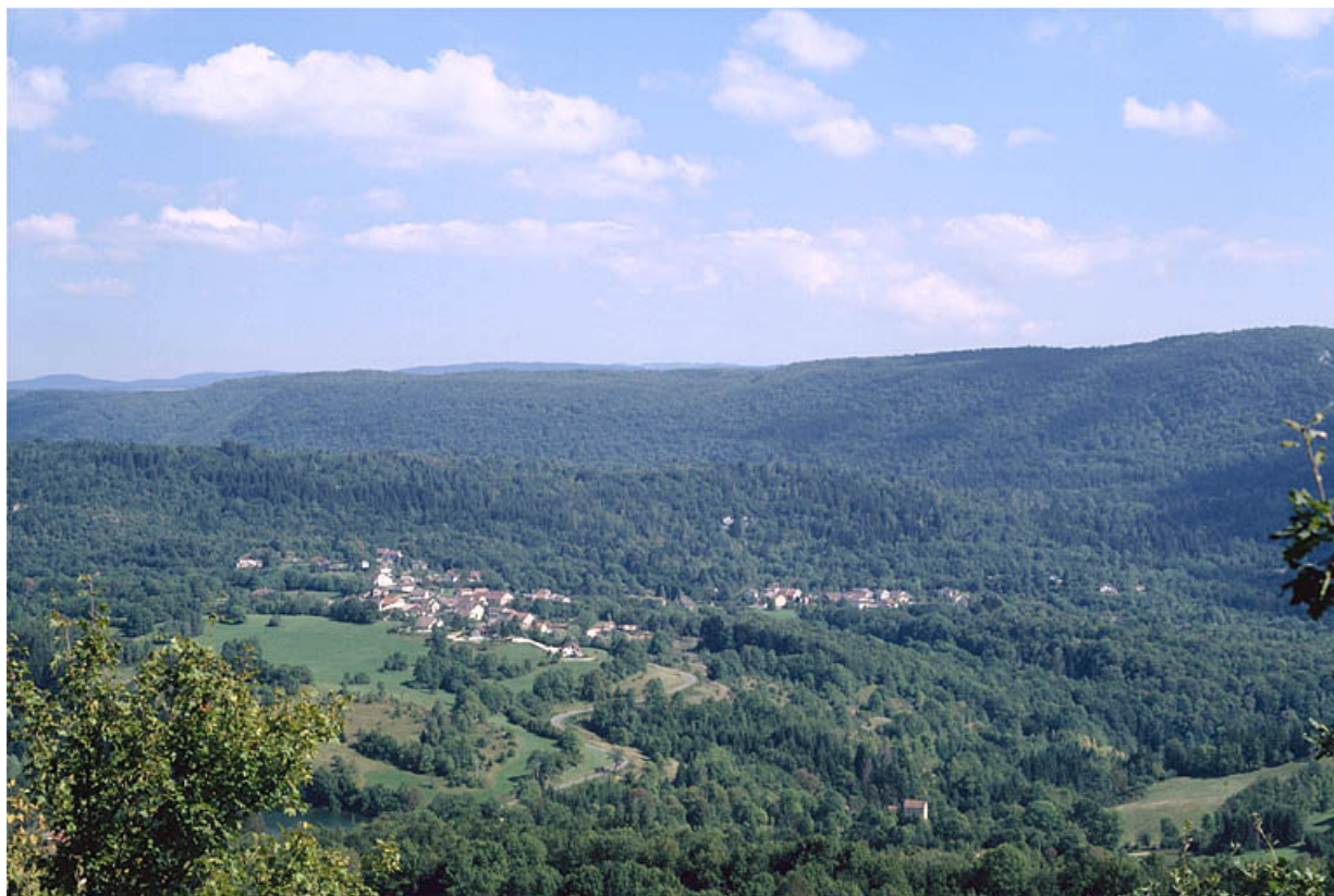
Vue d'ensemble du village de Cultura.