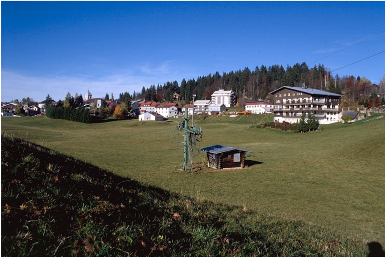
Vue générale du village.