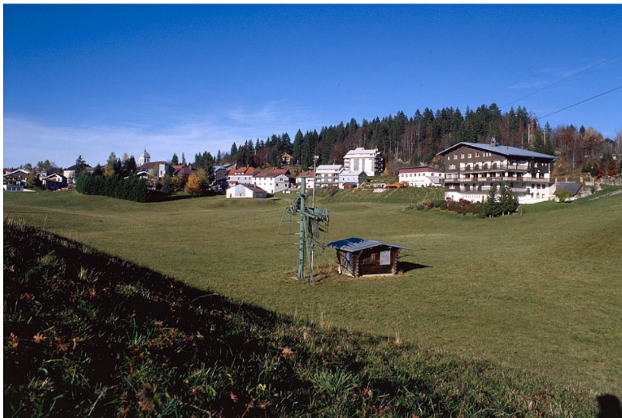
Vue générale du village.