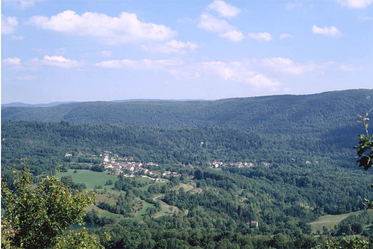
Vue d'ensemble du village de Cultura.