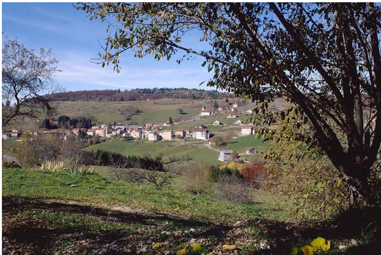
Le village de Septmoncel.