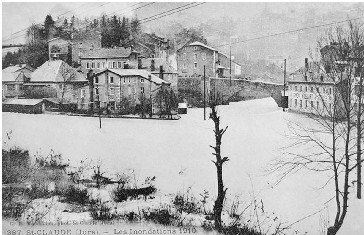
St-Claude (Jura).- Les Inondations 1910.