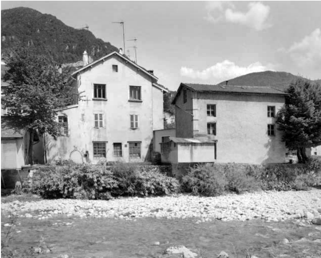
Bâtiments vus de l'ouest.