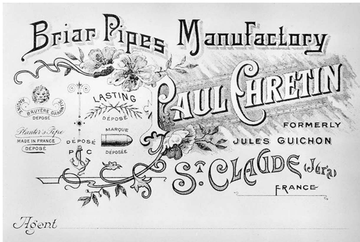
Carte publicitaire de la manufacture de pipes Paul Chretien.