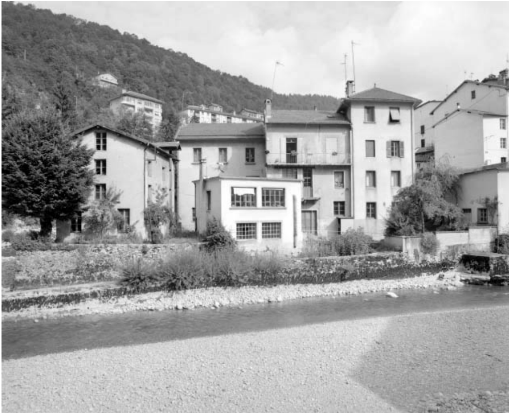
Bâtiments vus du sud-est.