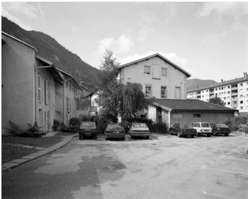
Façade postérieure des logements d'ouvriers et façade latérale droite de l'usine. 39, Saint-Claude, 22, 24, 26, 28 rue du Faubourg Marcel