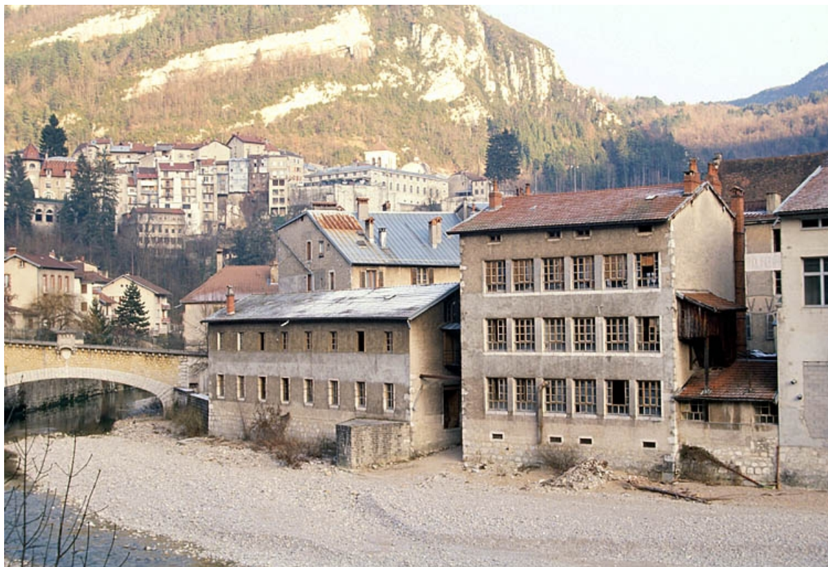
Séchoir à ébauchons et atelier de fabrication : façade postérieure.

39, Saint-Claude, 4, 8, 10 rue du Faubourg Marcel