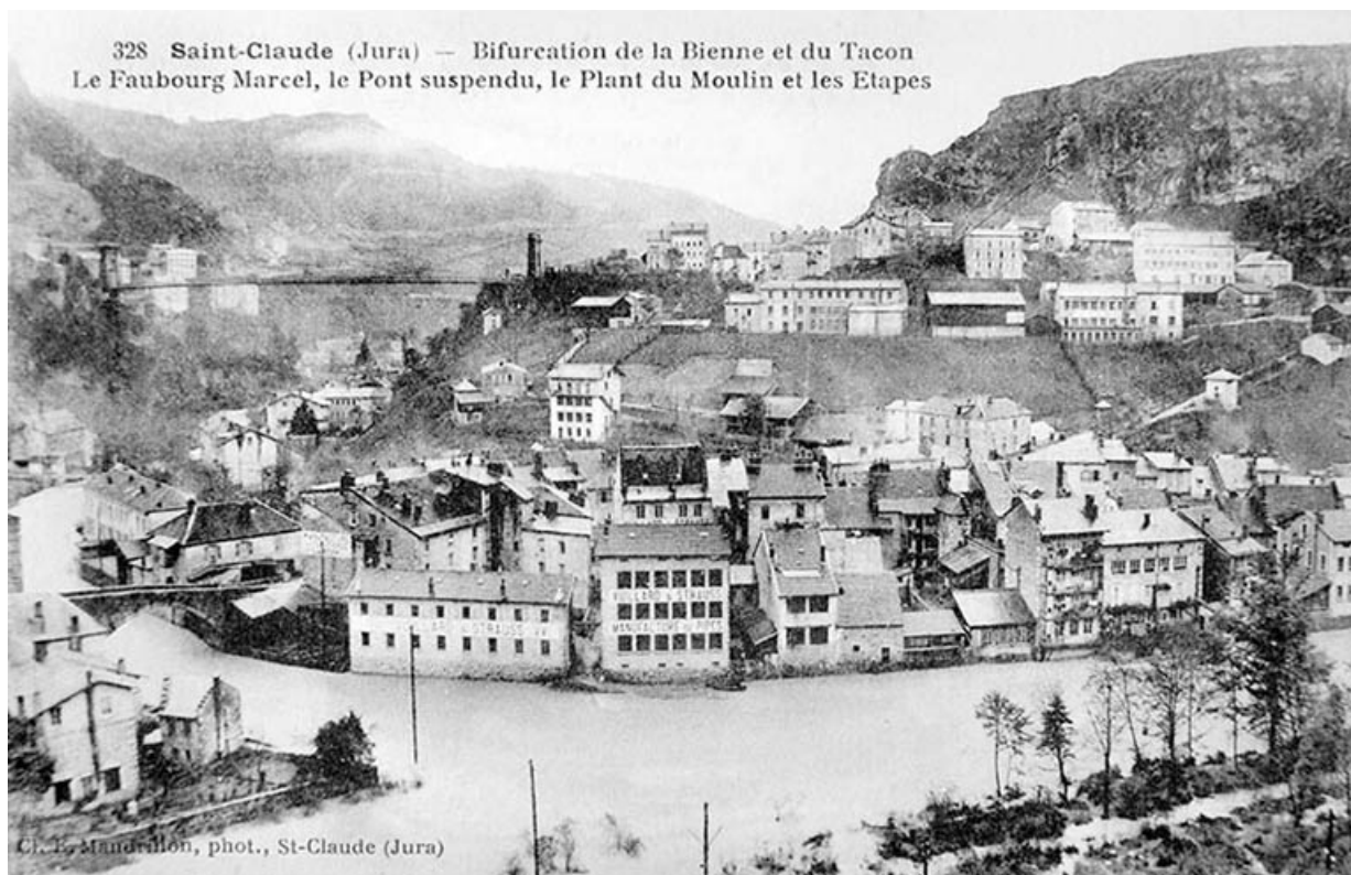
Saint-Claude (Jura) - Bifurcation de la Bienne et du Tacon. Le Faubourg Marcel, le Pont suspendu, le Plant du Moulin et les Etapes. 39, Saint-Claude, 4, 8, 10 rue du Faubourg Marcel