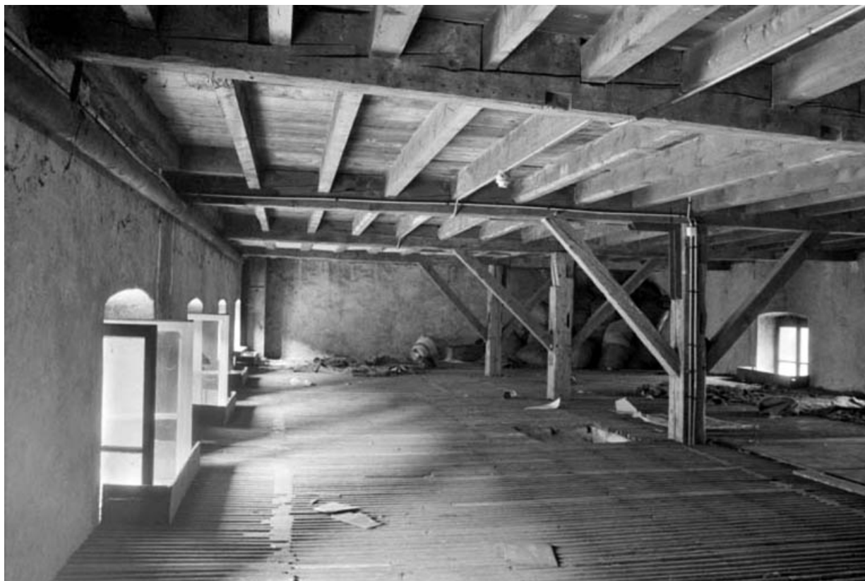
Séchoir à ébauchons : intérieur d'un niveau de séchage.

39, Saint-Claude, 4, 8, 10 rue du Faubourg Marcel