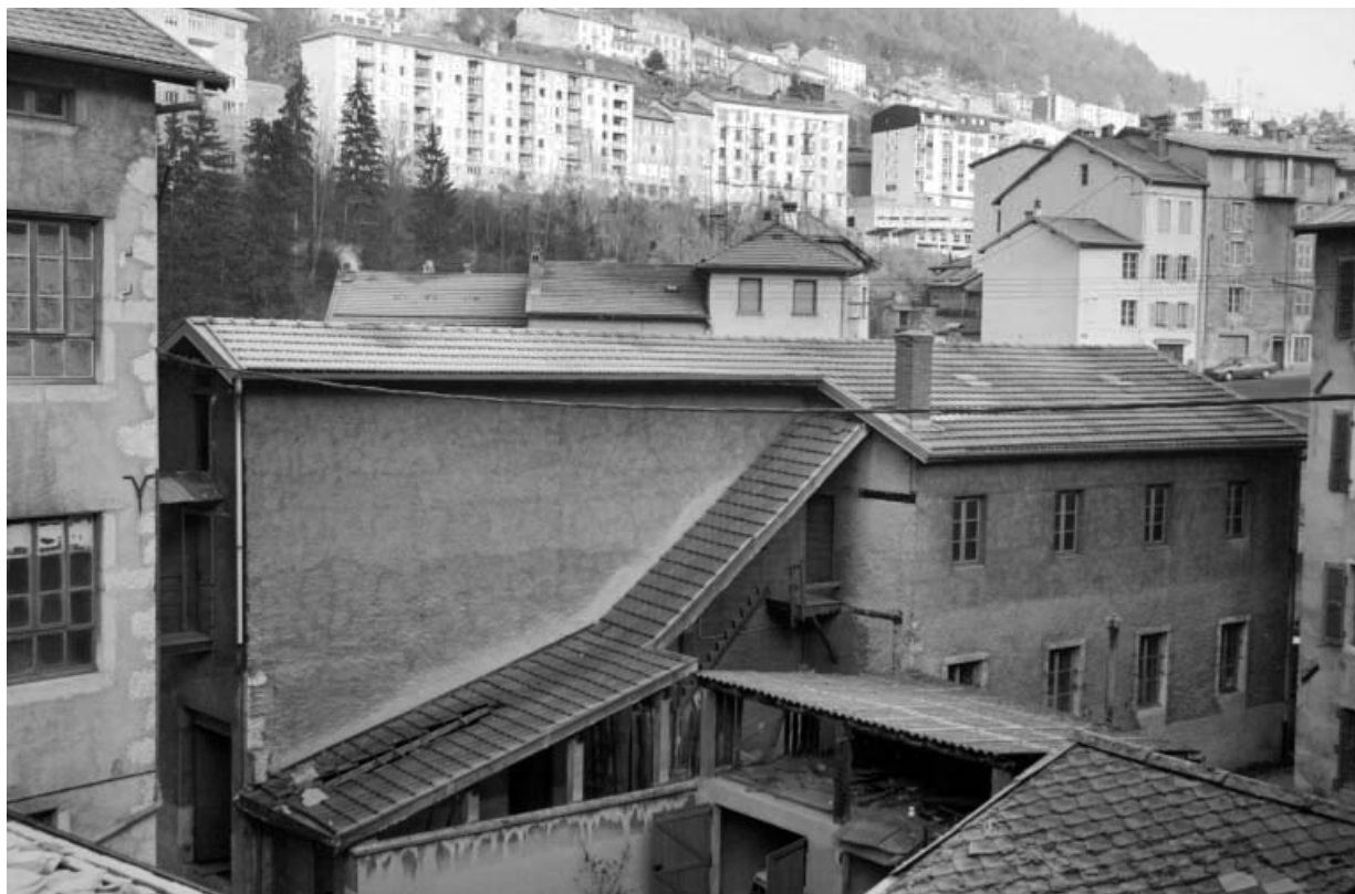
Séchoir à ébauchons : façade latérale droite. 39, Saint-Claude, 4, 8, 10 rue du Faubourg Marcel