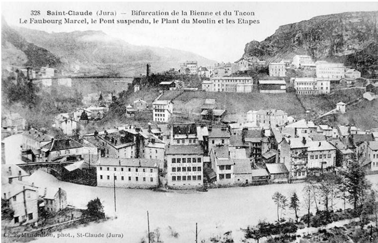
Saint-Claude (Jura) - Bifurcation de la Bienne et du Tacon. Le Faubourg Marcel, le Pont suspendu, le Plant du Moulin et les Etapes. 39, Saint-Claude, 4, 8, 10 rue du Faubourg Marcel