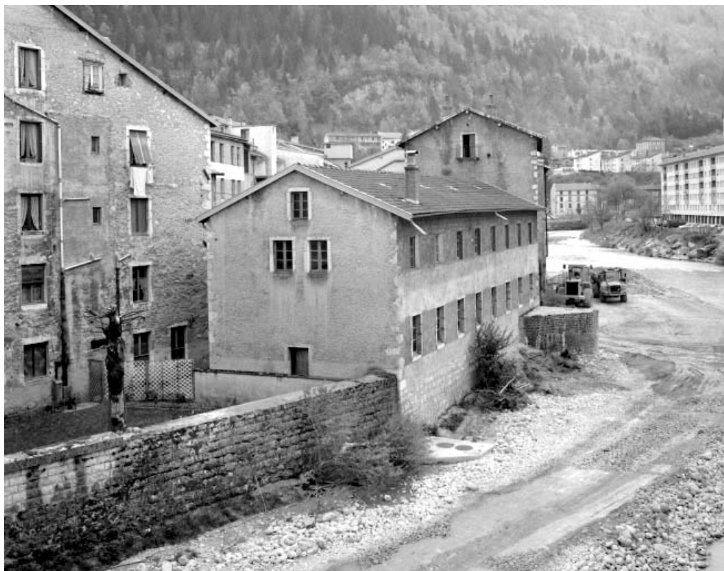
Séchoir à ébauchons : façades postérieure et latérale gauche.

39, Saint-Claude, 4, 8, 10 rue du Faubourg Marcel