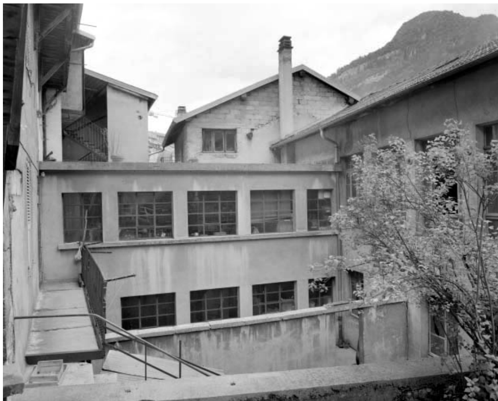
Cour couverte et façade du bâtiment sur cour au n° 15.

39, Saint-Claude, 13, 15 rue du Faubourg Marcel