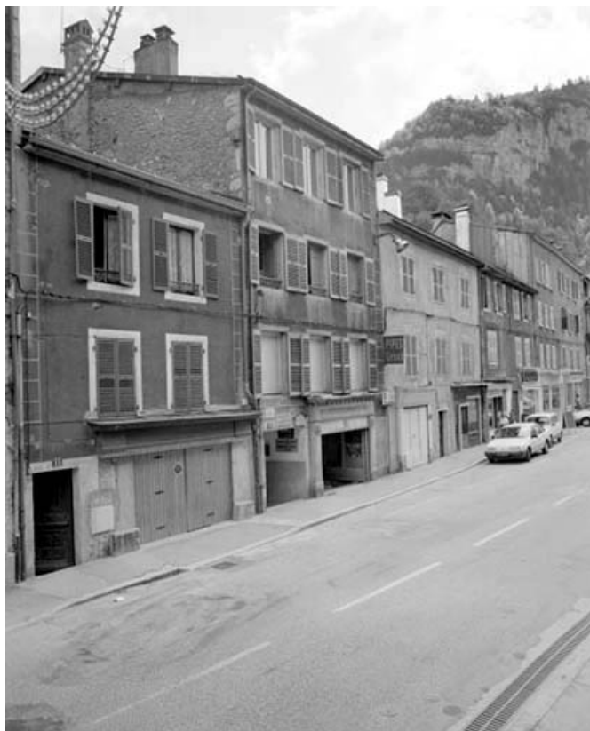
Façade antérieure des bâtiments sur la rue du Faubourg Marcel.

39, Saint-Claude, 13, 15 rue du Faubourg Marcel