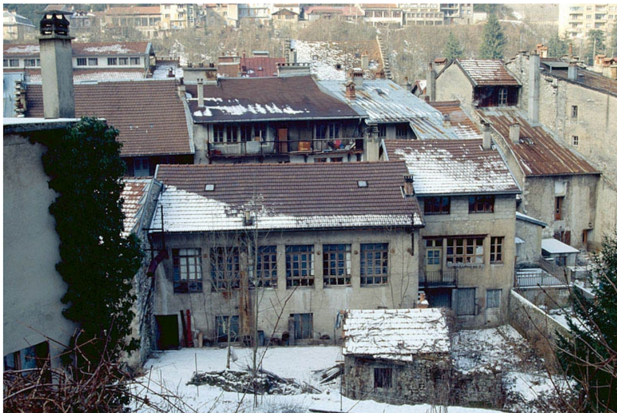
Façade postérieure des bâtiments sur cour.

39, Saint-Claude, 13, 15 rue du Faubourg Marcel