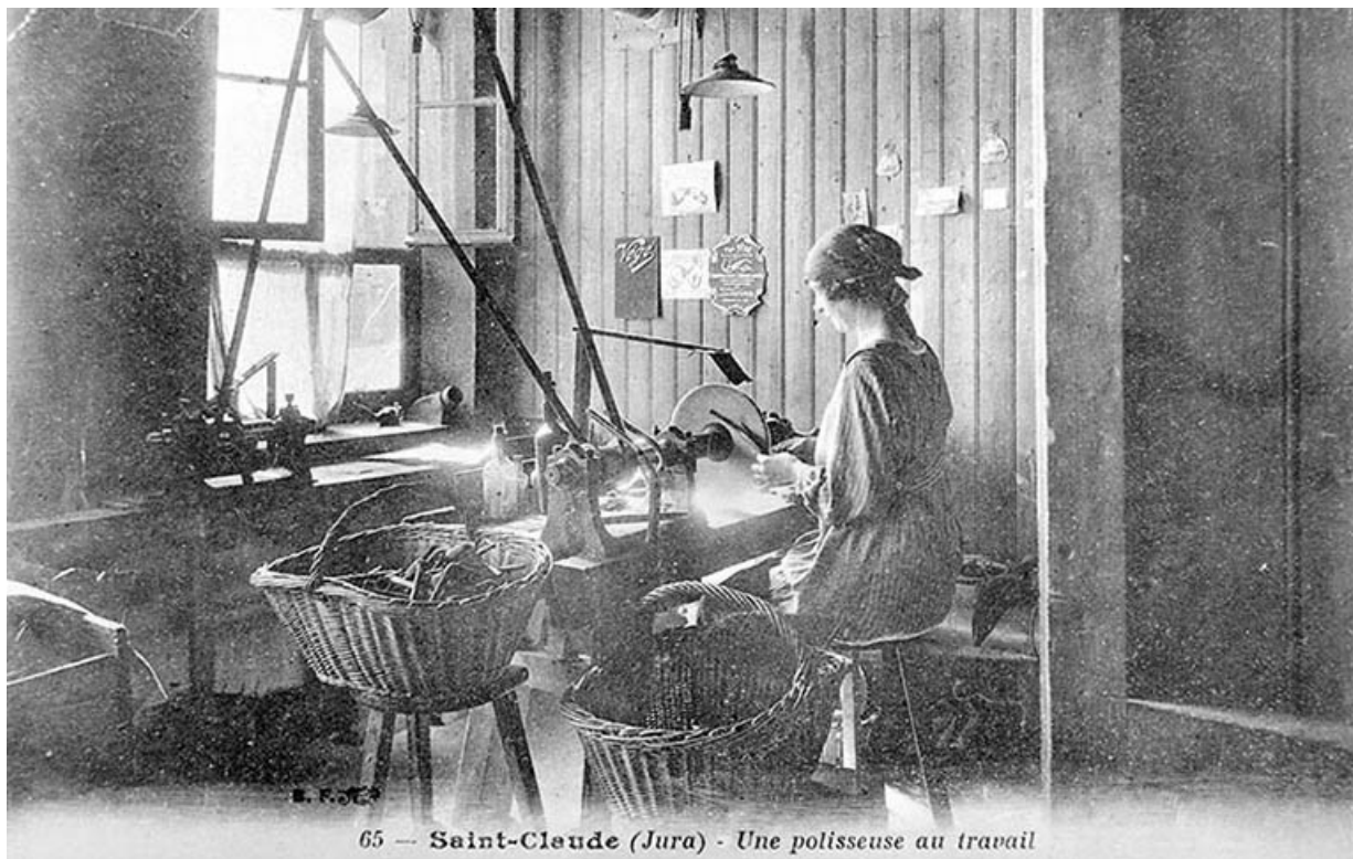
65 — Saint-Claude (Jura) - Une polisseuse au travail

Saint-Claude (Jura) - Une polisseuse au travail.