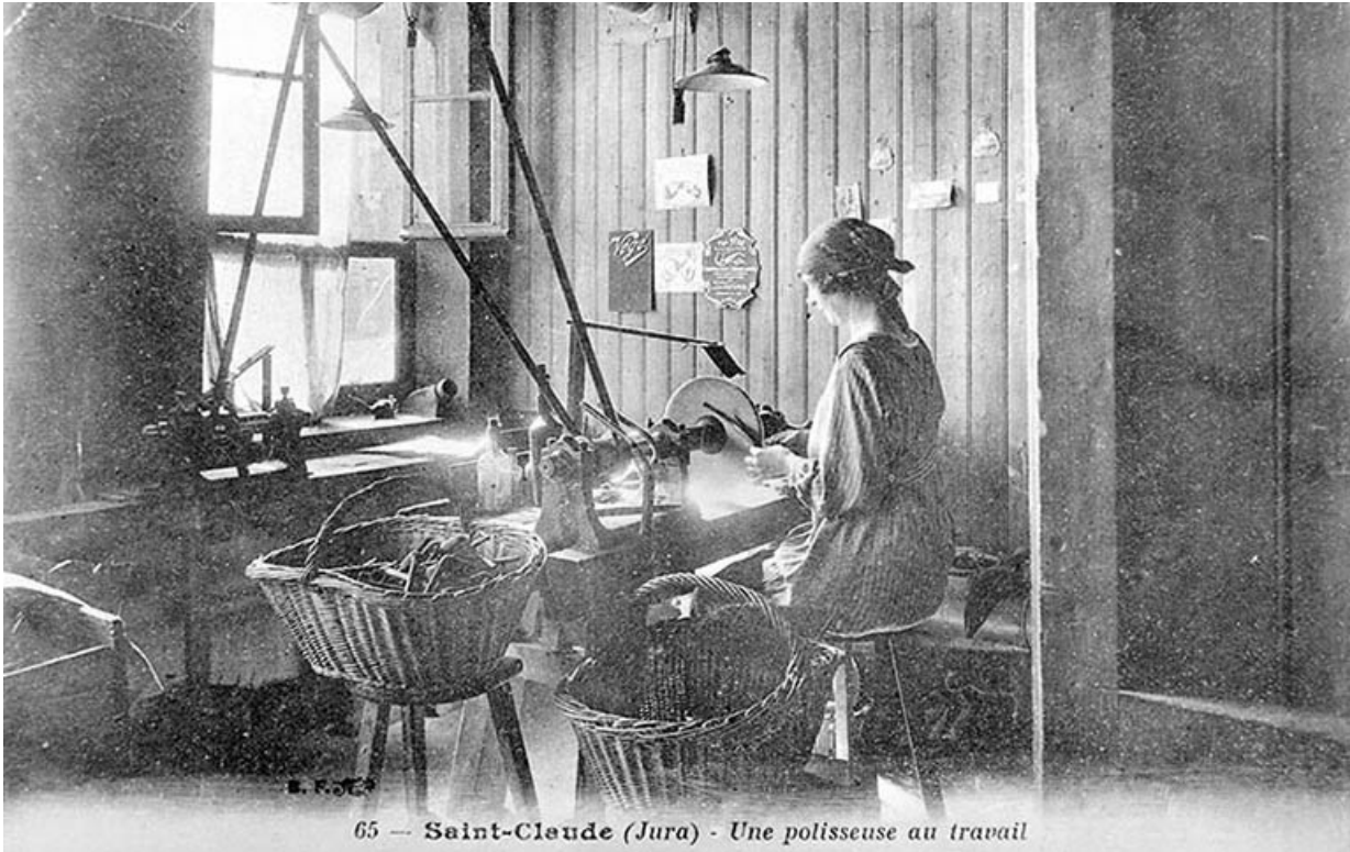
Saint-Claude (Jura) - Une polisseuse au travail.