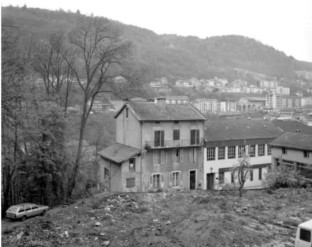
Vue d'ensemble de la façade antérieure.