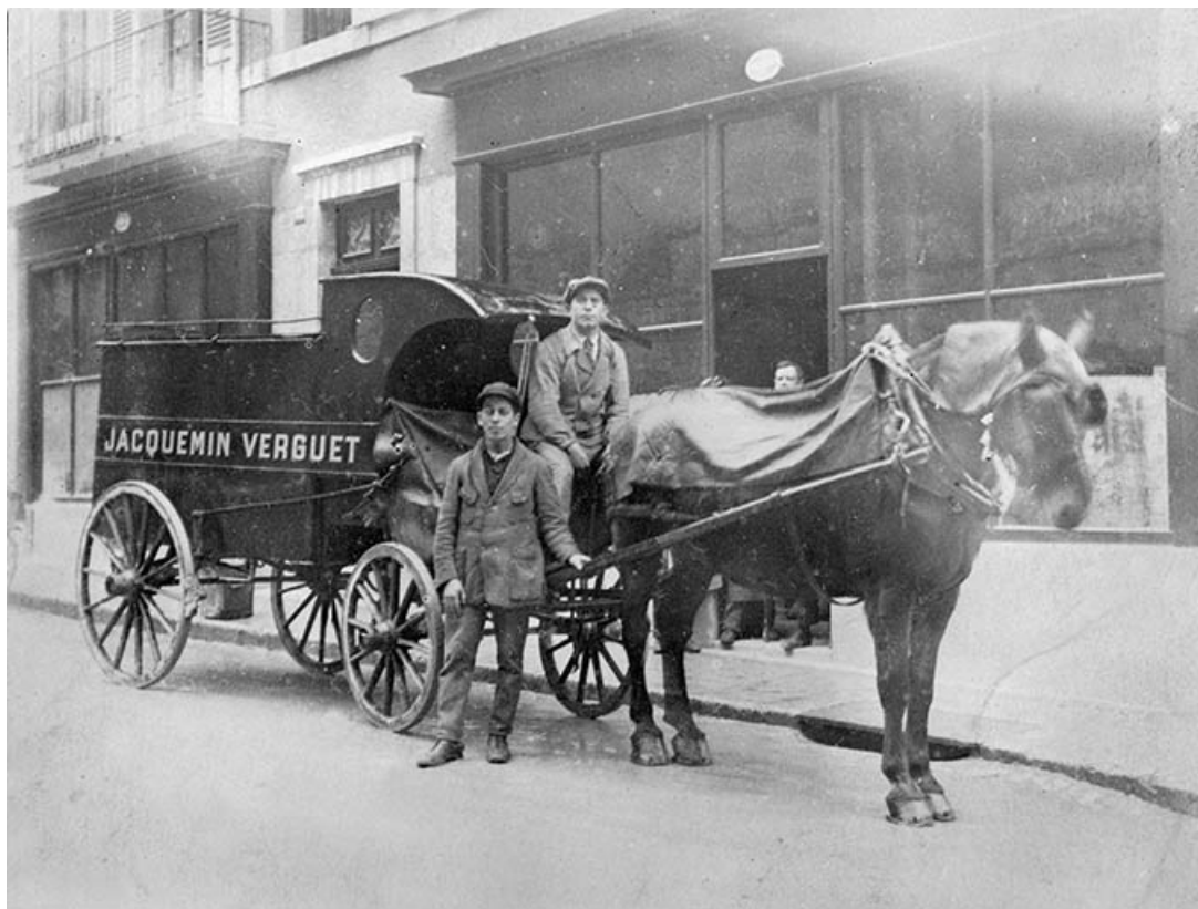
[Chariot de livraison de la société].

39, Saint-Claude Montée de l'Hôpital 1, 3