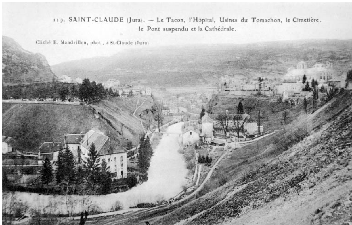
Saint-Claude (Jura).- Le Tacon, l'Hôpital, Usines du Tomachon, le Cimetière, le Pont Suspendu et la Cathédrale. 39, Saint-Claude Montée de l'Hôpital 1, 3