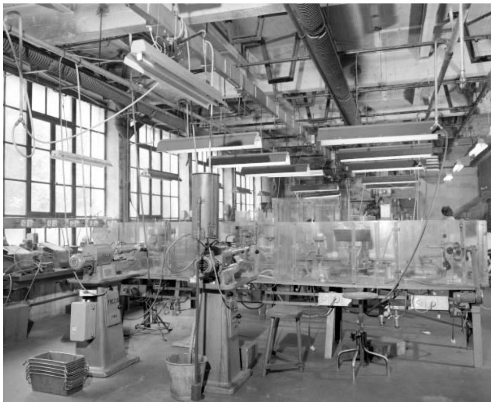
Atelier de fabrication au rez-de-chaussée du bâtiment de 1927.

39, Saint-Claude Montée de l'Hôpital 1, 3