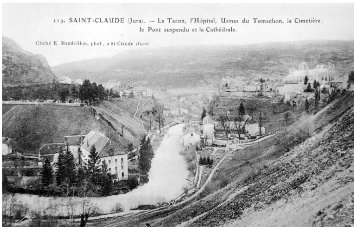
Saint-Claude (Jura).- Le Tacon, l'Hôpital, Usines du Tomachon, le Cimetière, le Pont Suspendu et la Cathédrale. 39, Saint-Claude Montée de l'Hôpital 1, 3

Carte postale, s.d. [1er quart 20e siècle, entre 1902 et 1927], par Mandrillon, E. (photographe). Lieu de conservation : collection particulière : Gérard Chapel, Saint-Claude