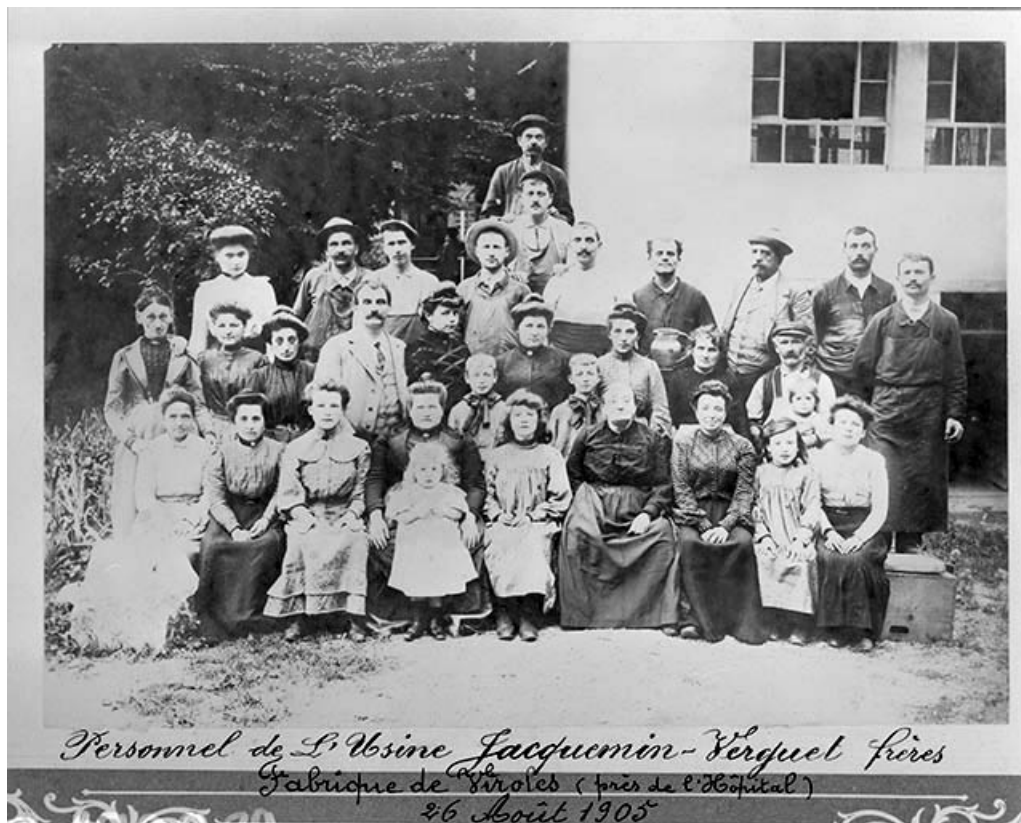
Personnel de l'Usine Jacquemin-Verguet frères. Fabrique de Viroles (près de l'Hôpital). 39, Saint-Claude Montée de l'Hôpital 1, 3