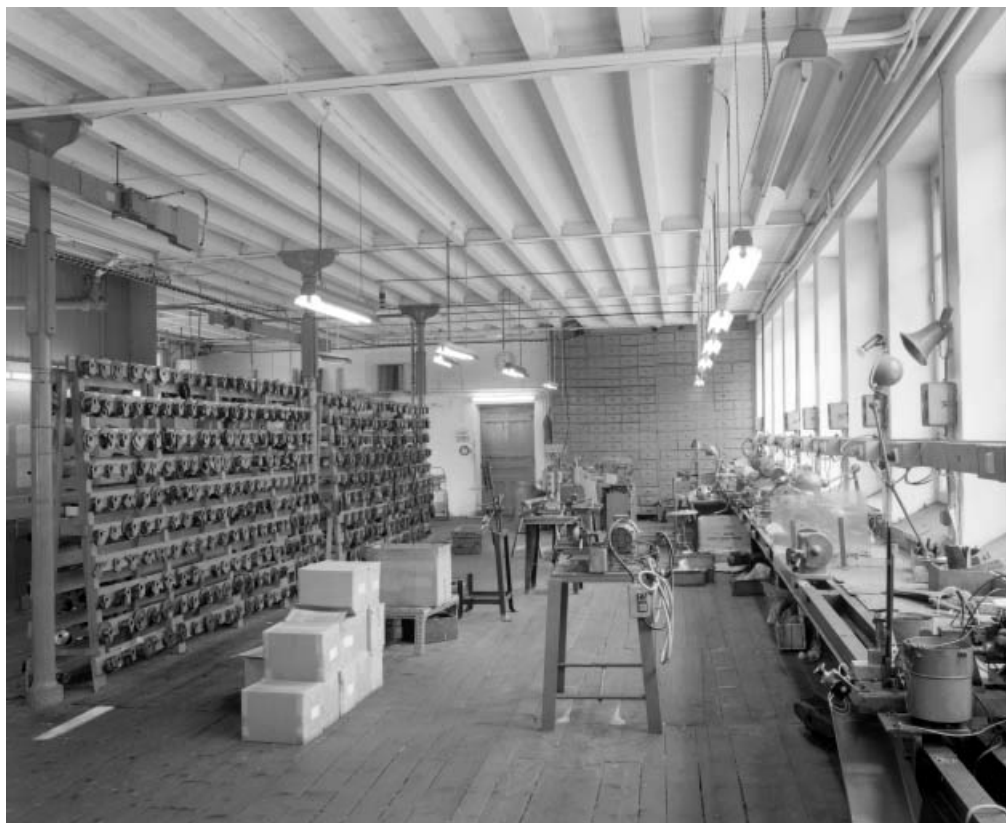
Entrepôt au 1er étage du bâtiment de 1902.

39, Saint-Claude Montée de l'Hôpital 1, 3