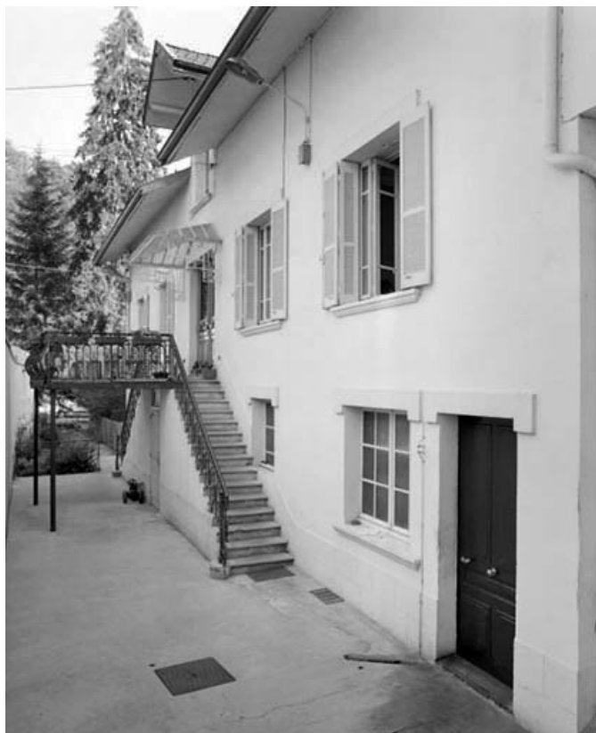
Façade sur cour du bâtiment de 1927.

39, Saint-Claude Montée de l'Hôpital 1, 3