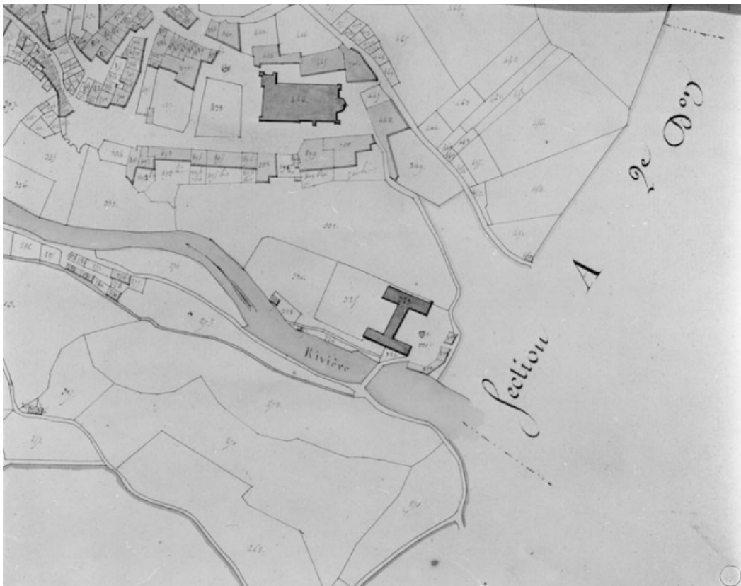
Saint-Claude. Première division de la section A dite de la Ville [hôpital et quartier abbatial].

39, Saint-Claude Montée de l'Hôpital 1, 3