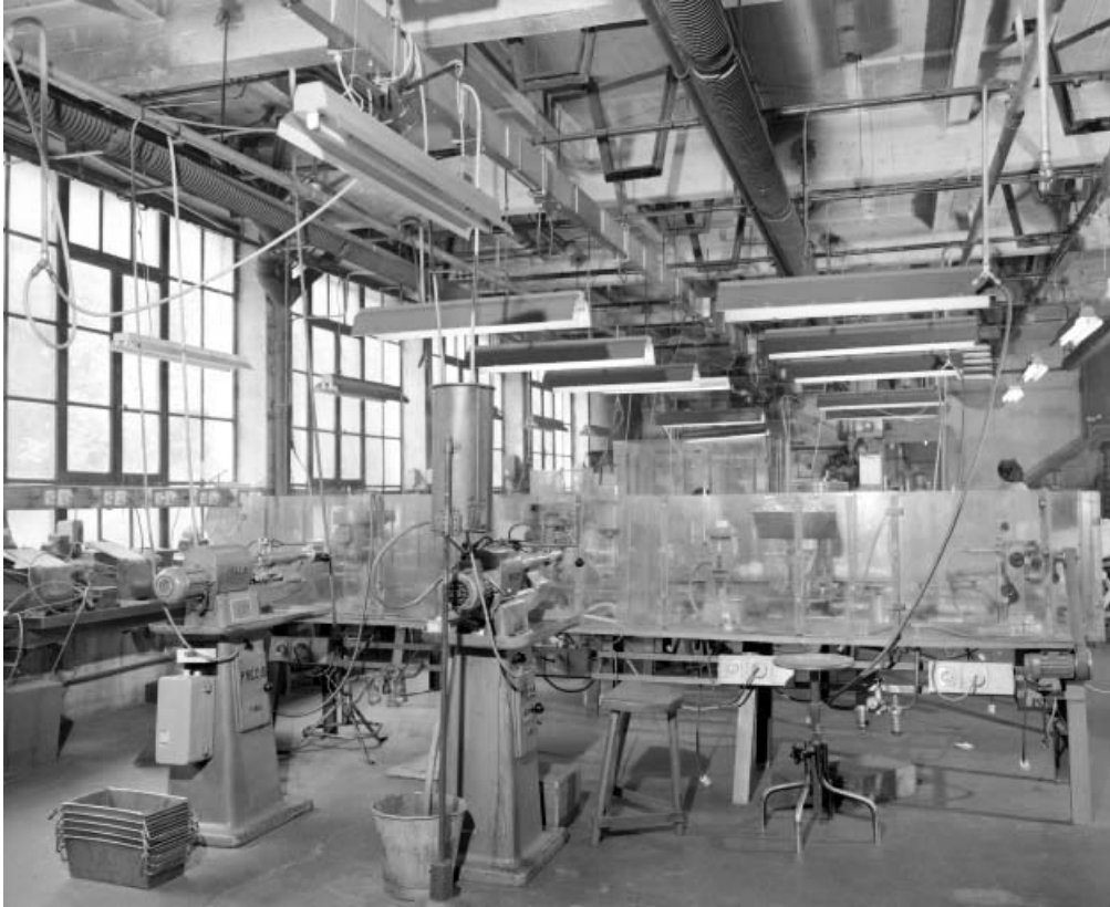
Atelier de fabrication au rez-de-chaussée du bâtiment de 1927.

39, Saint-Claude Montée de l'Hôpital 1, 3