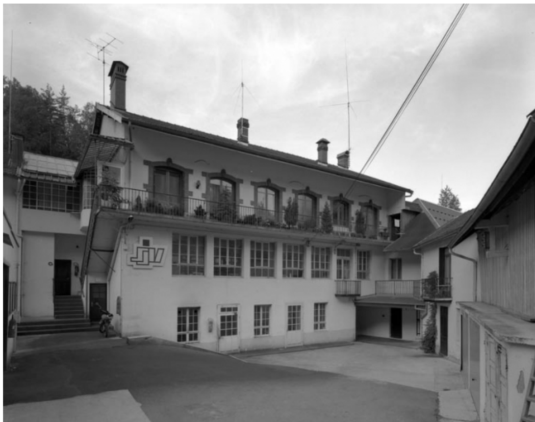
Façade sur cour du bâtiment de 1902. 39, Saint-Claude Montée de l'Hôpital 1, 3