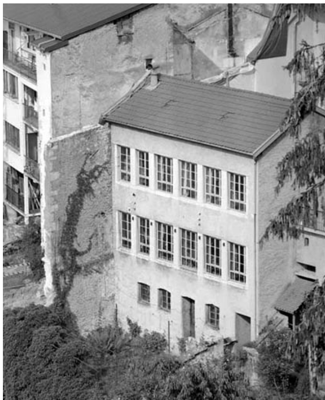
Vue plongeante sur la façade postérieure de l'usine.