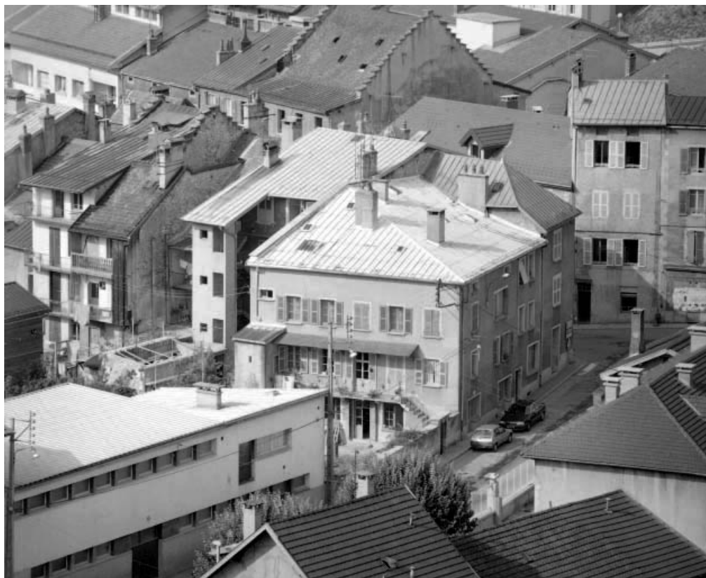
Vue d'ensemble plongeante sur la maison depuis le nord-est.

39, Saint-Claude, 2, 2 ter rue du Plan du Moulin