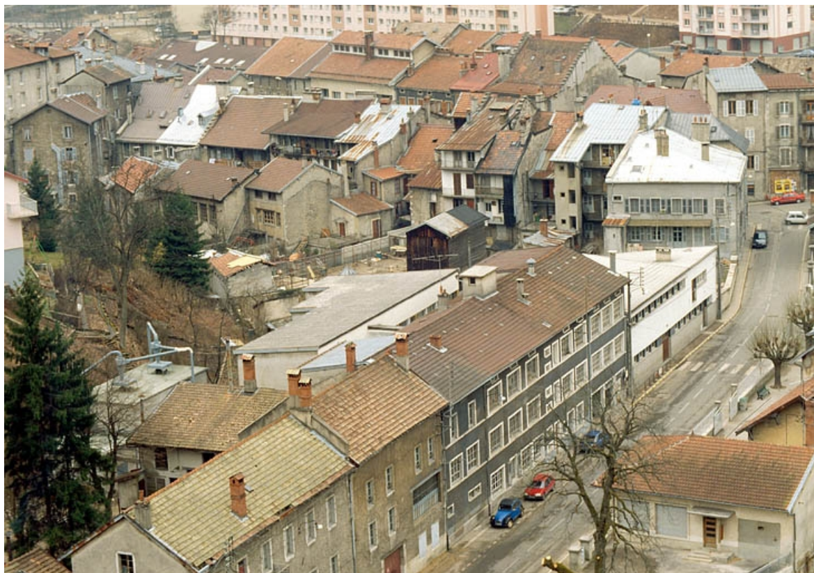
Vue d'ensemble plongeante sur l'usine depuis le nord-est.

39, Saint-Claude, 2, 2 ter rue du Plan du Moulin