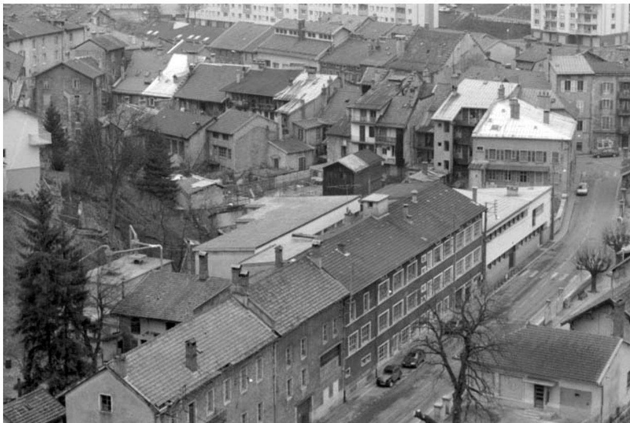
Vue d'ensemble plongeante sur l'usine depuis le nord-est.

39, Saint-Claude, 2, 2 ter rue du Plan du Moulin