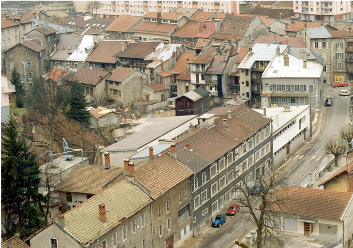
Vue d'ensemble plongeante sur l'usine depuis le nord-est.

39, Saint-Claude, 2, 2 ter rue du Plan du Moulin