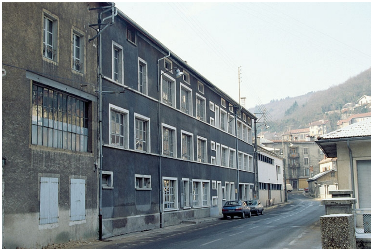
Façade antérieure de trois quarts gauche.

39, Saint-Claude, 2, 2 ter rue du Plan du Moulin