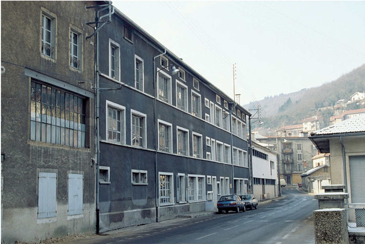
Façade antérieure de trois quarts gauche.

39, Saint-Claude, 2, 2 ter rue du Plan du Moulin