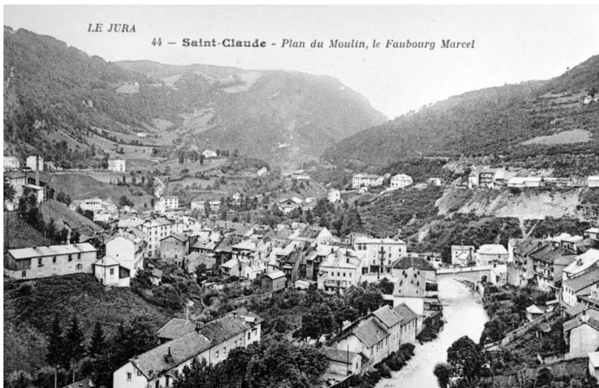
Saint-Claude - Plan du Moulin, le Faubourg Marcel.

39, Saint-Claude, 2, 2 ter rue du Plan du Moulin