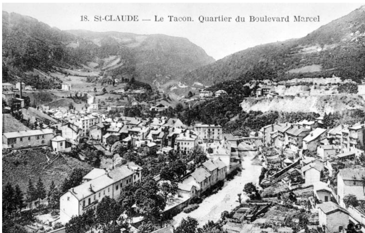
St-Claude - Le Tacon. Quartier du Boulevard Marcel.

39, Saint-Claude, 4 rue du Plan du Moulin