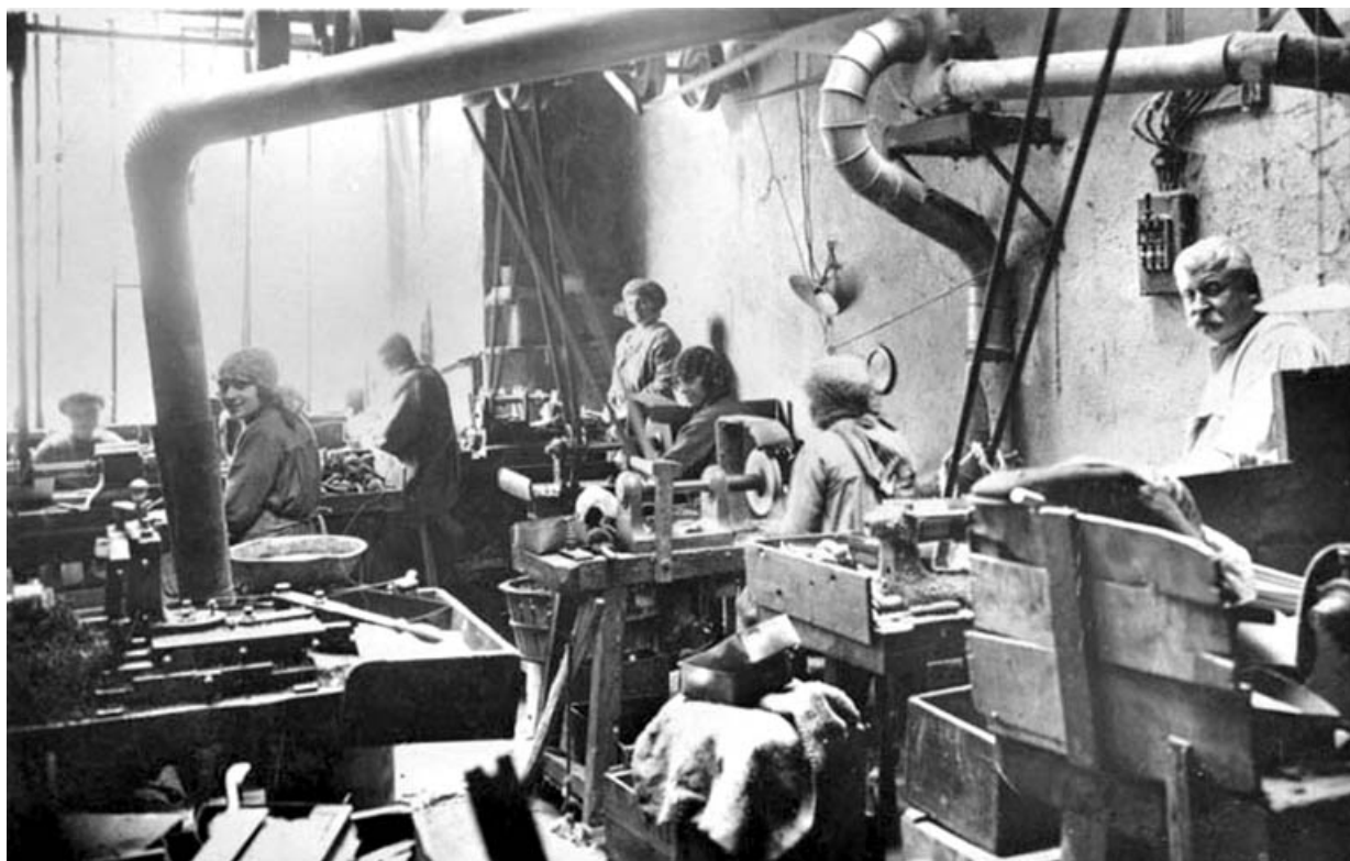
[Intérieur de l'atelier de pipier du 60, rue de la Poyat]. 39, Saint-Claude, 45 rue du Faubourg Marcel