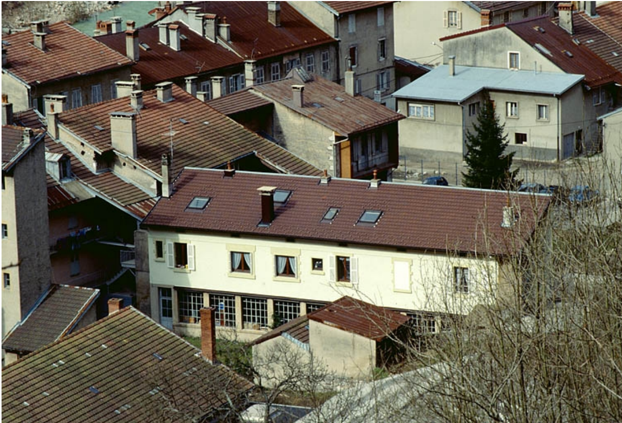
Vue plongeante sur l'atelier de fabrication.

39, Saint-Claude, 41 rue du Faubourg Marcel