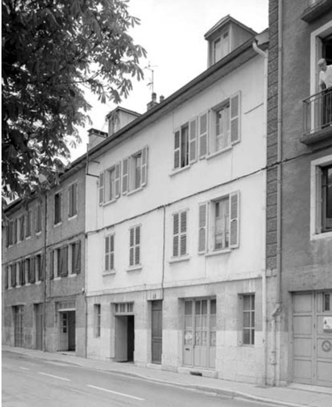
Façade antérieure de l'immeuble.

39, Saint-Claude, 41 rue du Faubourg Marcel