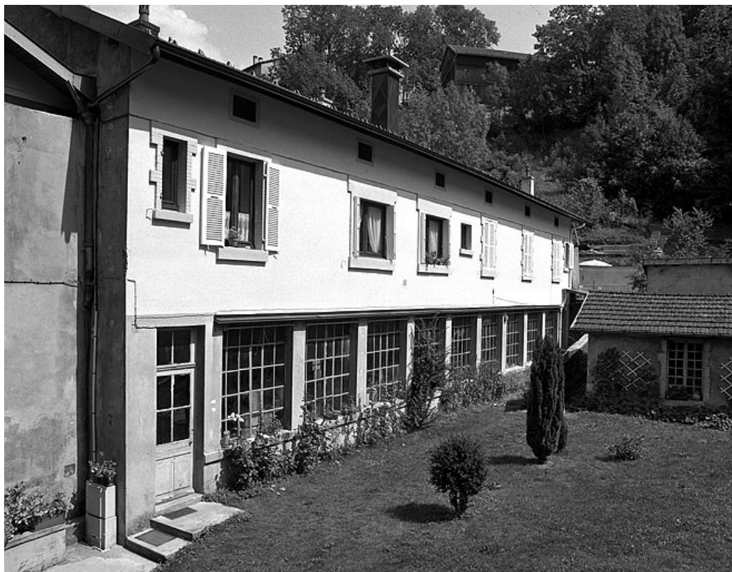
Façade antérieure de l'atelier de fabrication, de trois quarts gauche.

39, Saint-Claude, 41 rue du Faubourg Marcel