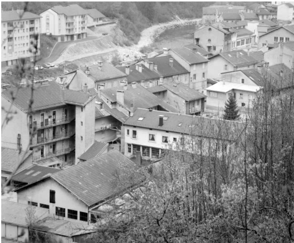
Vue d'ensemble plongeante depuis le sud-est.

39, Saint-Claude, 41 rue du Faubourg Marcel